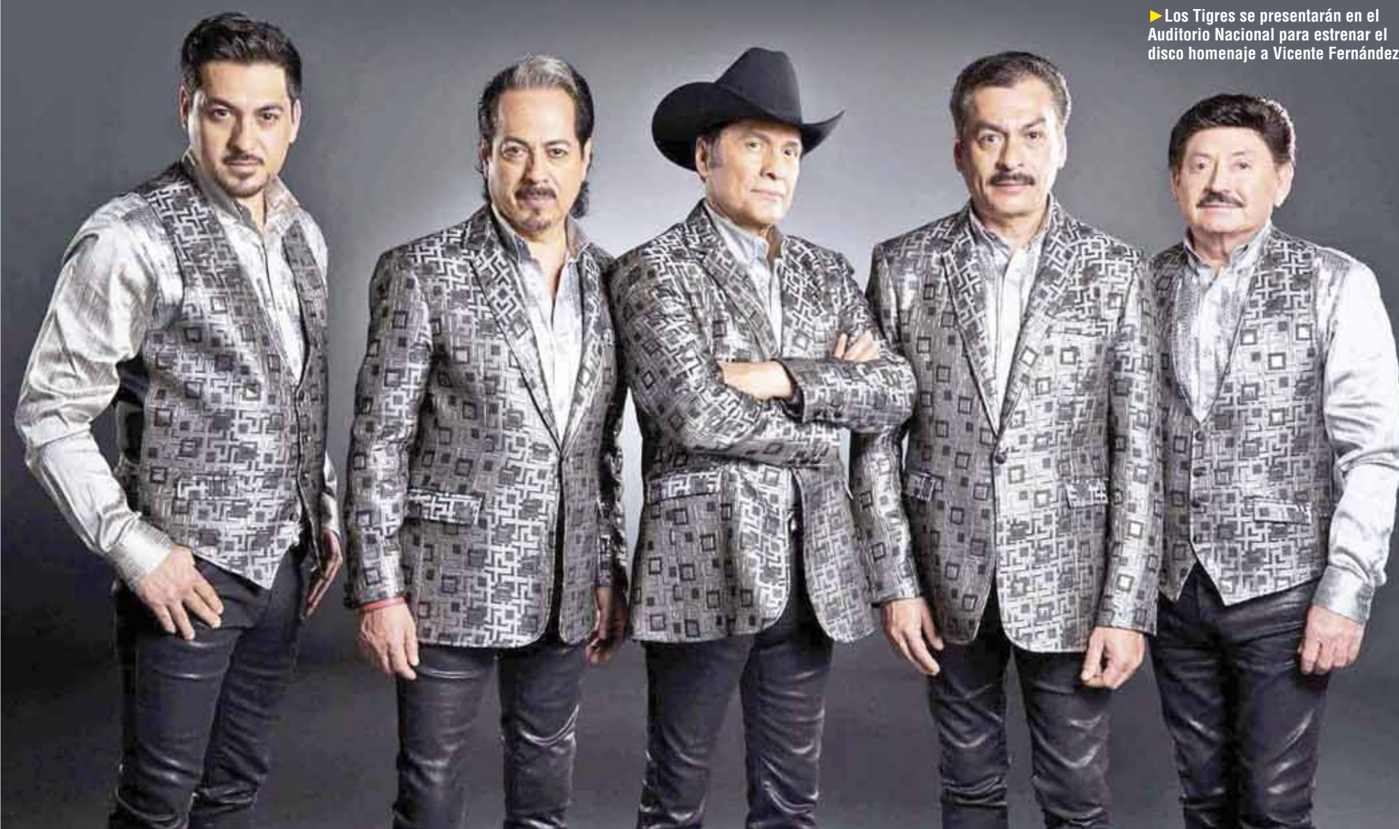
► Los Tigres se presentarán en el Auditorio Nacional para estrenar el disco homenaje a Vicente Fernández

"Se tiene que hacer el trabajo de base juntos, crear el sentimiento de confianza y seguridad que permita que pasemos tiempo separados, que hagamos todo lo que necesitamos hacer y que, así, nos sintamos atados a esa persona. Es necesario para emprender un viaje juntos", explicó el actor.