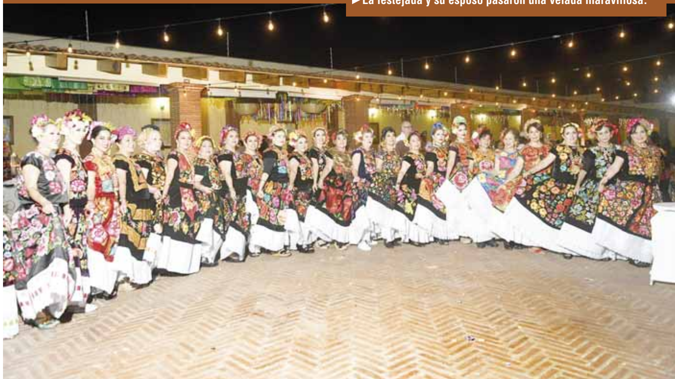
► Integrantes de los clubs fueron parte de las tradiciones del estado.