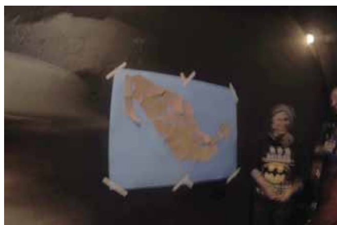
► La idea es seguir con las reflexiones y críticas sobre lo que ocurre en México.

De cinco colectivos que le dieron vida en noviembre de 2014, en el contexto de la guerra contra el narcotráfico, Res