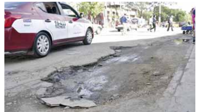
► En Oaxaca, los baches son uno de los problemas más apremiantes.