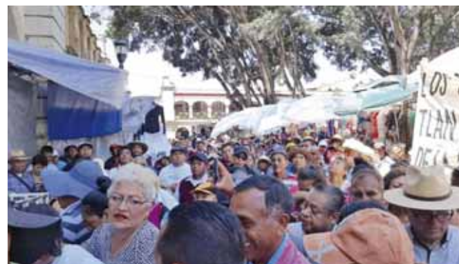
► Habitantes de Nochixtlán piden presencia de la GN.

"En el municipio ya no tenemos Ministerios públi-