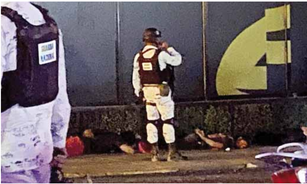
► Al menos cuatro sujetos resultaron detenidos.

Tras lo ocurrido las corporaciones policiacas realizaron recorridos en la colonia Reforma para garantizar la seguridad de los habitantes en esta zona. En tanto vecinos dijeron encontrarse alarmados por el despliegue realizado en este lugar y la detención de este comando armado.