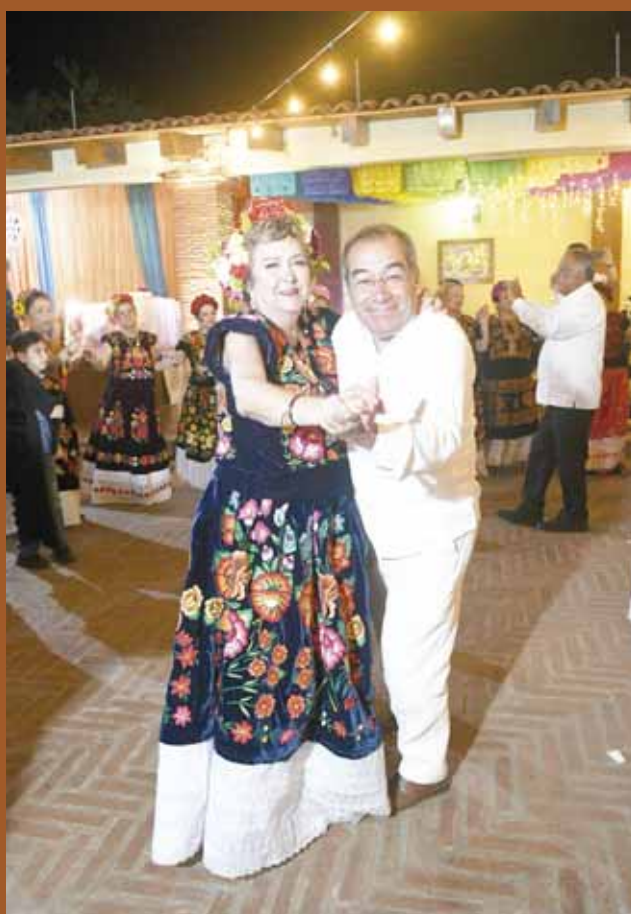
► Los presentes compartieron un vals con la festejada.

Las actividades que realizaron en conjunto el Club Rotario Guelaguetza y el Club Rotario de Estados Unidos concluyeron exitosamente y así lo reconocieron durante esta velada que transcurrió agradablemente.