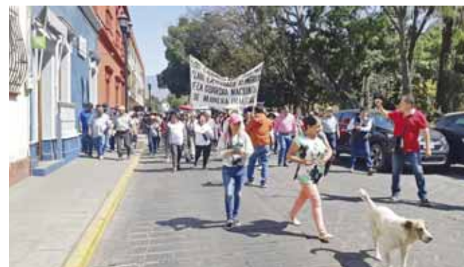
► Están hartos de la inseguridad en la comunidad.

"Solamente tenemos 24 policías municipales para cubrir todo el municipio con más de 30 mil habitantes,