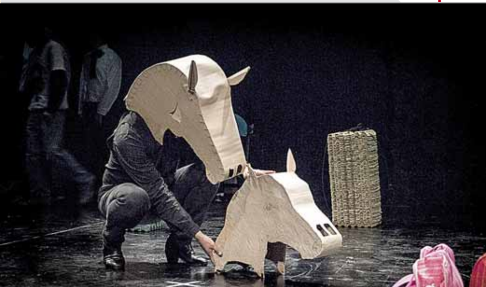
► La Res Pública permite la pluralidad y las relaciones horizontales.

enesena@imparcialenlinea.com / Teléfono 501 83 00 Ext. 3172