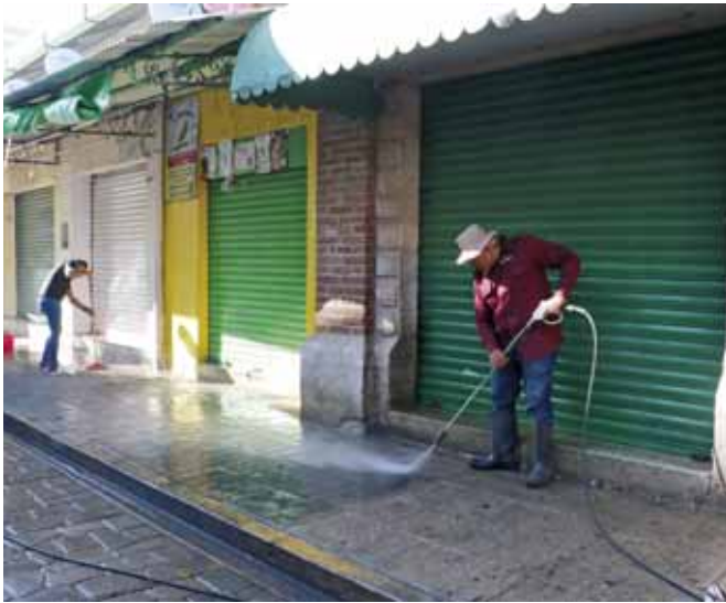
► Los mercados se preparan para las vacaciones de Semana Santa.

capital@imparcialenlinea.com / Teléfono 501 83 00 Ext. 3174