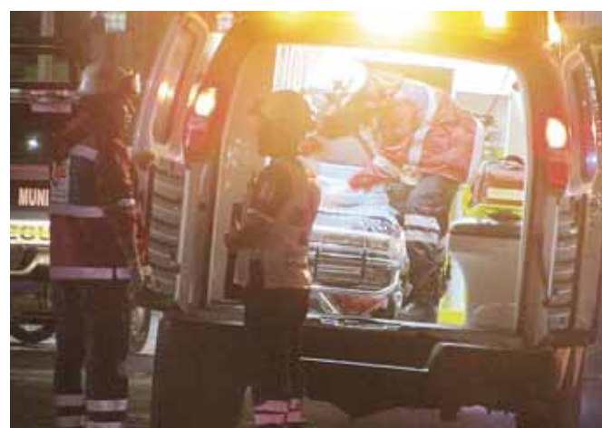
► Fue atendido por paramédicos de la Cruz Roja.