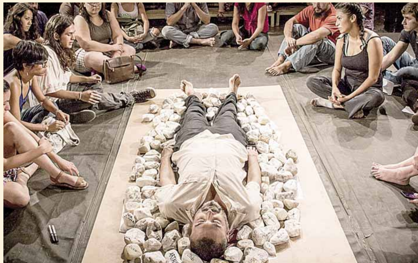
► Las propuestas analizan qué ocurre con la democracia y el país, pero también con la participación ciudadana.

“Después del triunfo de López Obrador, que significó para muchos un cambio, que votamos con mucha esperanza, creo que hubo