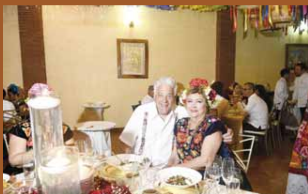
► La festejada y su esposo pasaron una velada maravillosa.