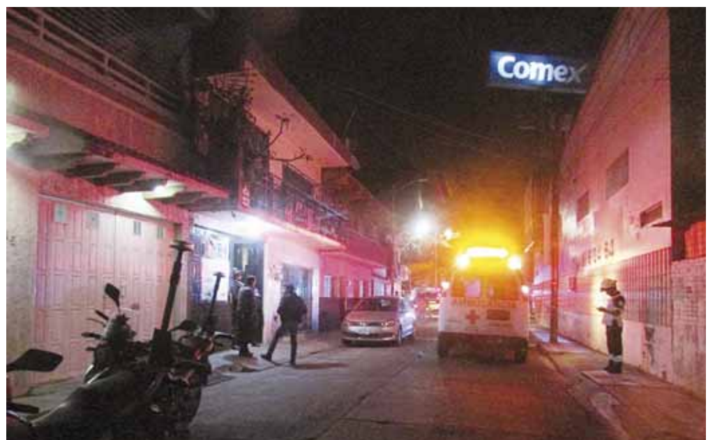
► Hasta el momento la víctima se encuentra hospitalizada.

Al ser lesionado, el hombre imprimió mayor velocidad para escapar de sus agresores logrando llegar a la ave-