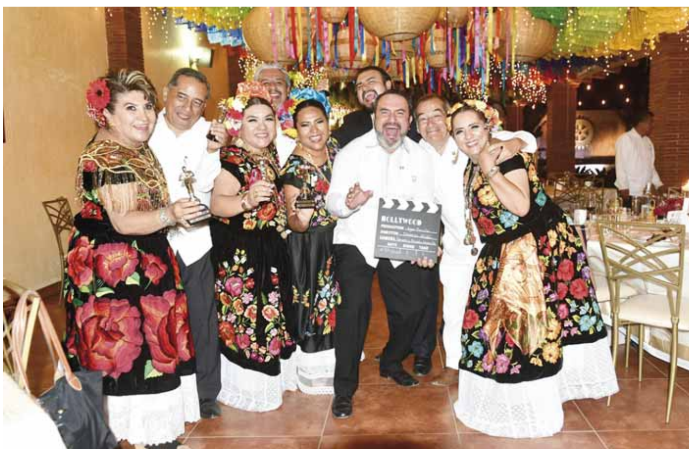
► Entrega de reconocimiento a las personas que hicieron posible el evento.