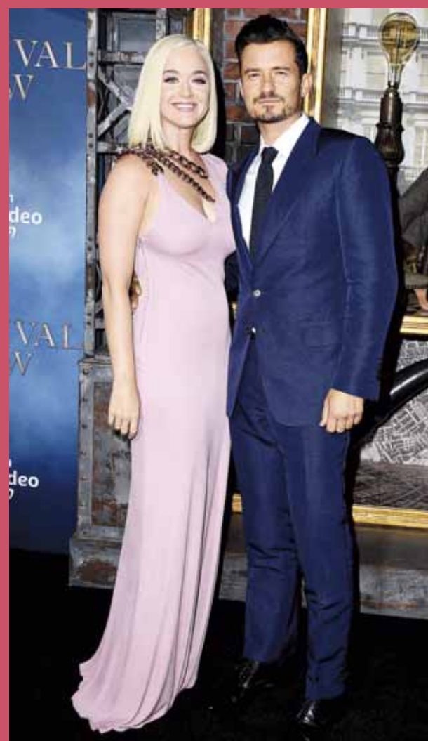
► La pareja se comprometió en 2019.

Sueño que se hizo realidad y que después de muchas historias de sufrimiento, de carencias y de triunfos los tiene como consentidos del público, con el que desean compartir la biopic que negocian con varias productoras "pues sí hay mucho que contar", dijo Jorge, el líder de Los Tigres del Norte.