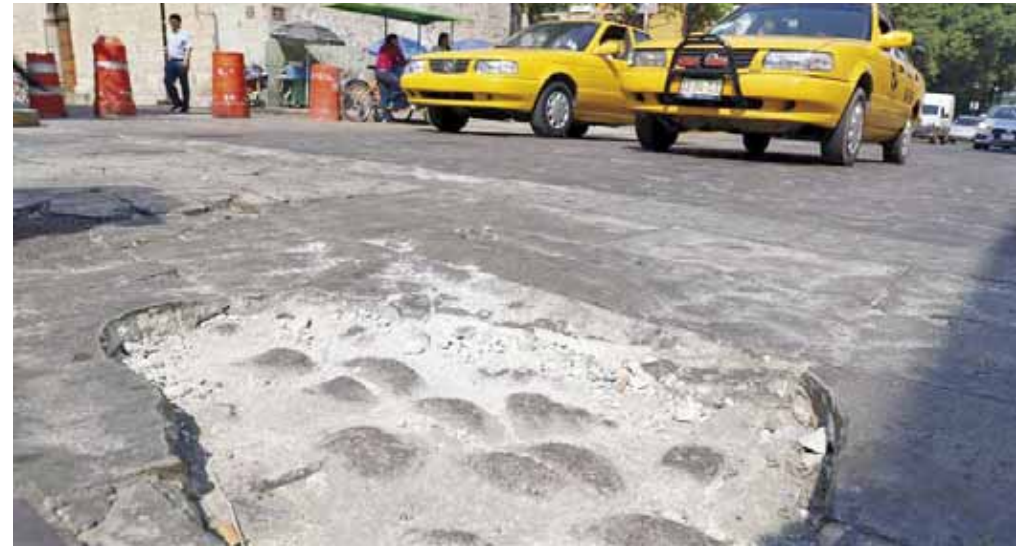
► Varias calles del Centro Histórico están muy deterioradas.