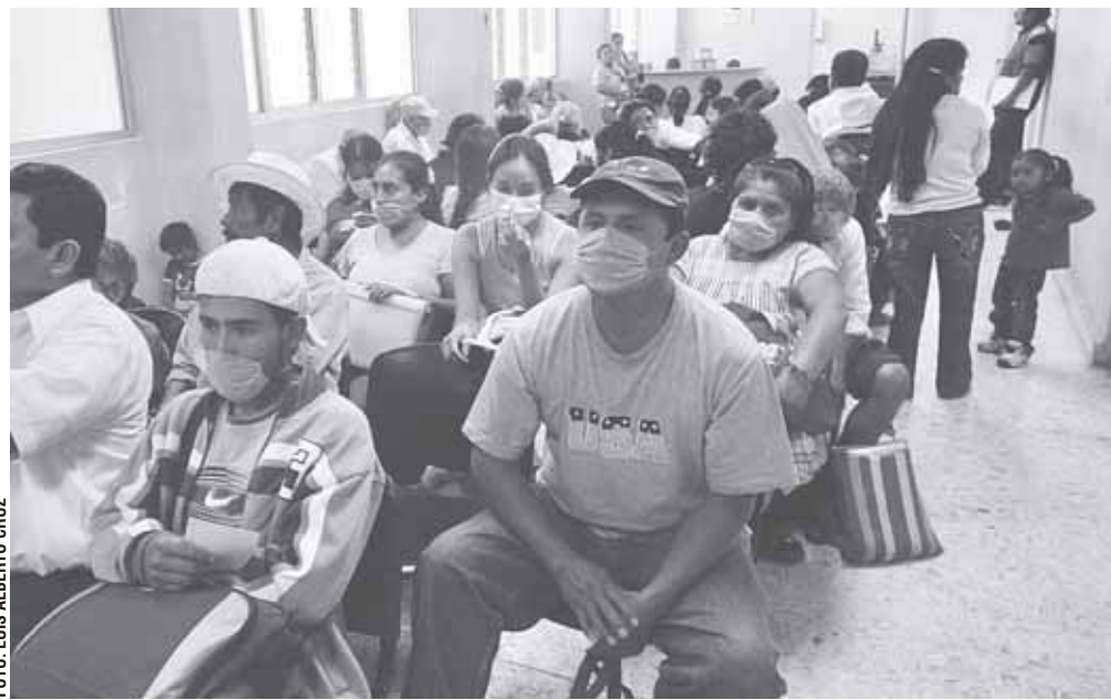
► Reportan desabasto de cubrebocas en supermercados y farmacias de la capital.

Mediante el díptico "Escuela libre del coronavirus, la autoridad educativa recomienda contar con disponibilidad de agua y jabón en los planteles, mantener