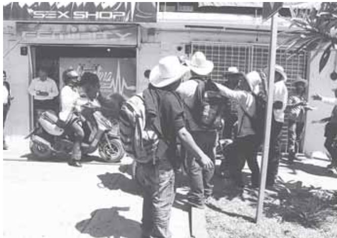
► "Aquí no pasas", dicen habitantes de Colotepec.