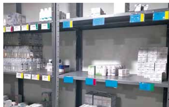
► No existen procesos judiciales por este delito.

ral se realizan compras consolidadas, con las cuales el medicamento llega de manera directa a los almacenes, desde los cuales, se distribuye a las jurisdicciones y los centros de salud y en algunos hospitales.