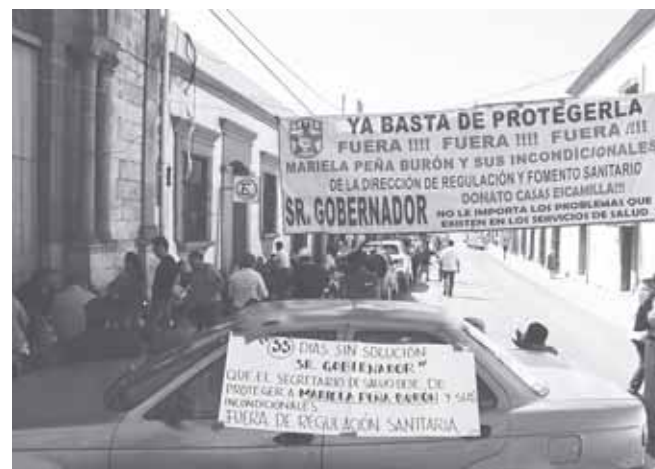
► Se cumplen dos semanas de protesta en los Servicios de Salud de Oaxaca.

nos cuente bien, el último censo fue hace 10 años; en 2020 viene un censo erróneo porque no quieren contemplar a las rancherías, se supone que la finalidad del INEGI debe ser recabar información veraz, verídica y eficiente que ayude a los gobiernos, pero no quieren dar de alta a 8 localidades, tampoco quie-