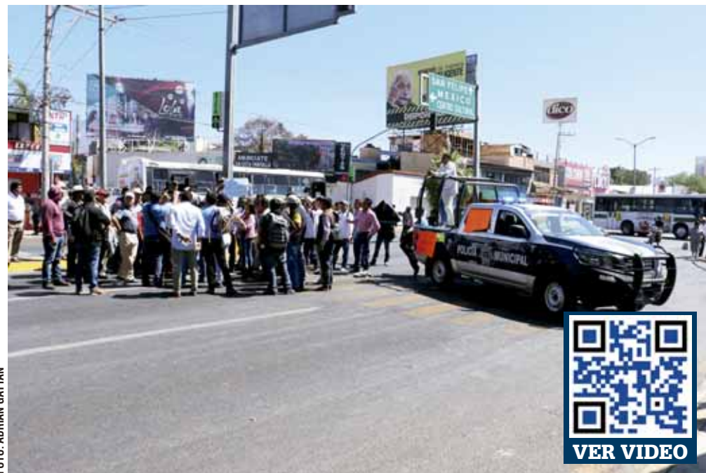
Para bloquear la calzada Niños Héroes de Chapultepec esquina con Netzahualcóyotl, usaron una patrulla de la Policía Municipal de Colotepec.

Minutos antes de las 21:00, personal femenino del INEGI logró abandonar las instalaciones que desde muy temprano tomó un grupo de habitantes de Santa María Colotepec. Entre insultos y amenazas de agresiones físicas por parte de los lugareños, las mujeres fueron desalojando el inmueble, cuando de manera cotidiana terminan sus labores a las 17:00 horas. Entanto, el grupo de manifestantes impidió la salida de los hombres para exigir atención a sus demandas. Lo anterior provocó una crisis nerviosa a uno de los empleados que obligó a soli-