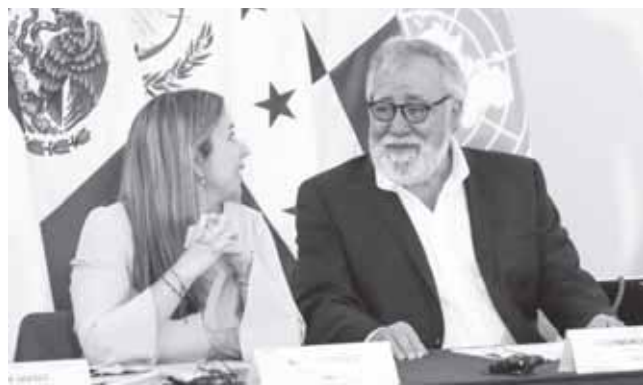
► Consideran un deslinde de responsabilidades en las autoridades.