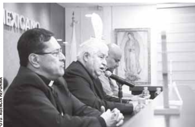
► La Conferencia del Episcopado Mexicano agradeció la visita de Charles Scicluna, arzobispo de Malta, que tendrá lugar del 20 al 27 de marzo próximos.

"Confiamos en que servirá para mejorar la respuesta a estos casos, buscando la acción de la justicia civil