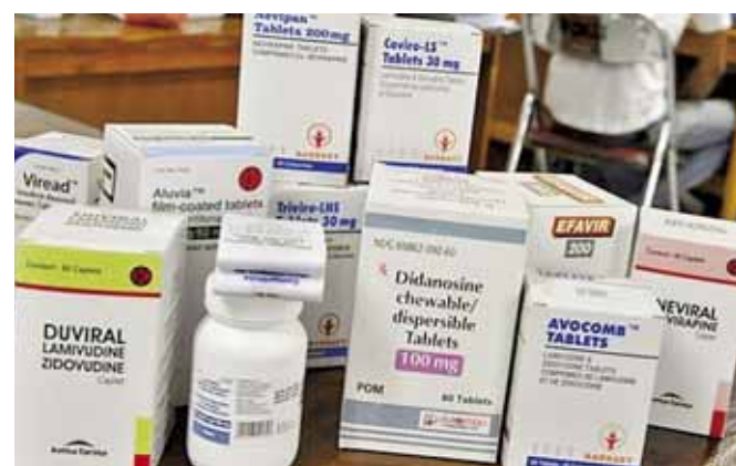
► El robo hormiga, también afecta el abasto en el sector salud.

Ante ello, el secretario de Salud, Donato Casas Escamilla, señaló que por disposición del Gobierno fede-