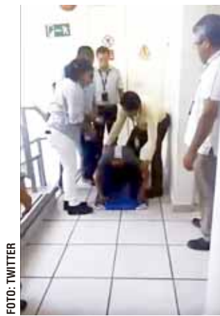
Uno de los empleados sufrió una crisis nerviosa.

nes del transporte urbano su bloqueo frente a las instalaciones de la dependencia federal. Ante el serio desquiciamiento que vivió la zona norte de la capital, representantes del sector empresarial cuestionaron la falta de atención a los agravios que sufre la ciudadanía en general con estas acciones. Lamentaron que no exista capacidad para atender de inmediato estos conflictos y