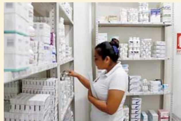
► Han tratado de controlar la distribución, pero han fallado.

El dasatinib tableta, con un precio de 34 mil 426 pesos, es usado para tratar a personas con leucemia mieloide crónica, un tipo de cáncer de los gló-