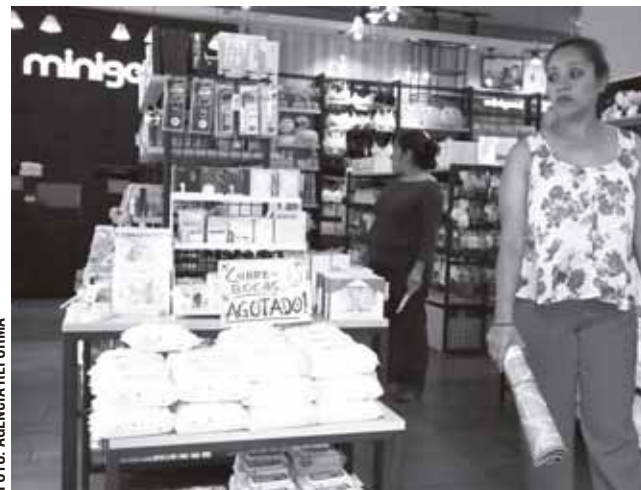
► Consideran que las medidas están siendo excesivas frente a un contagio que aún no se esparce.

En enero, reconocieron que investigan a 271 sacerdotes por abusos sexuales en los últimos 10 años, pero sólo 155 de estos casos han llegado a las fiscalías correspondientes. No ofrecieron cifras de cuántos menores pudieron ser víctimas de todos estos delitos.