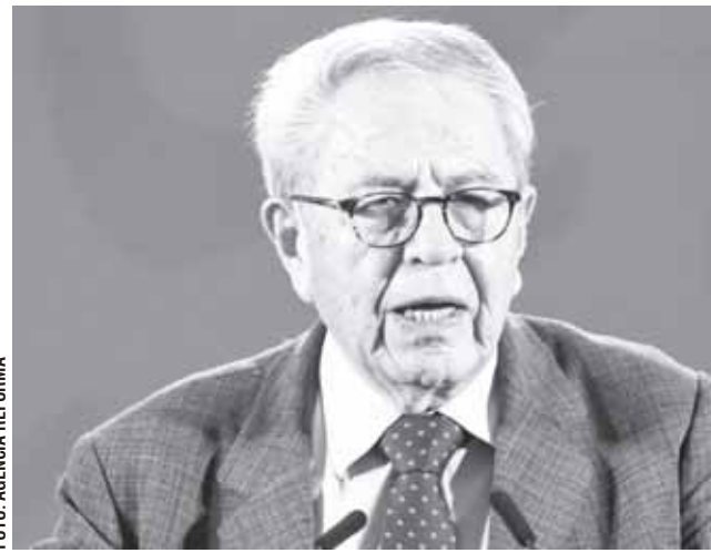
► La prioridad del etiquetado es proteger a los niños.

"Hay un contenido justiciero en esta investigación porque no sólo es el hecho de que no se hayan entregado algunos bienes, podrían ser otro tipo de bienes, pero estos son bienes que afectan la salud de los mexicanos", enfatizó.