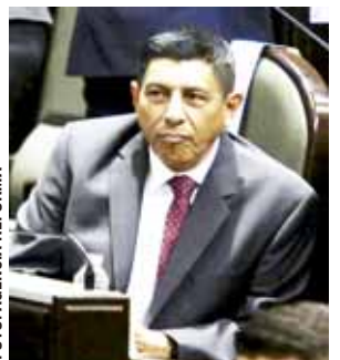
De nuevo Salomón Jara mete la pata.

Ante la caída en las encuestas de aprobación, que por primera vez lo llevaron por debajo del 60%, el presidente Andrés Manuel López Obrador reconoció que ha sufrido un desgaste por enfrentar a conservadores y corruptos. INFORMACIÓN 10A