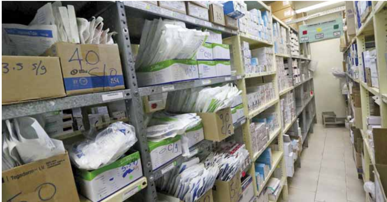
► Las autoridades ni siquiera tienen registro de cuántas y cuáles son las medicinas que más se roban del sector público.

Aunque trabajadores de diferentes instituciones públicas de Salud en el estado han hecho públicas estas prácticas de corrupción, las autoridades han mirado hacia otro lado sin investigar los casos