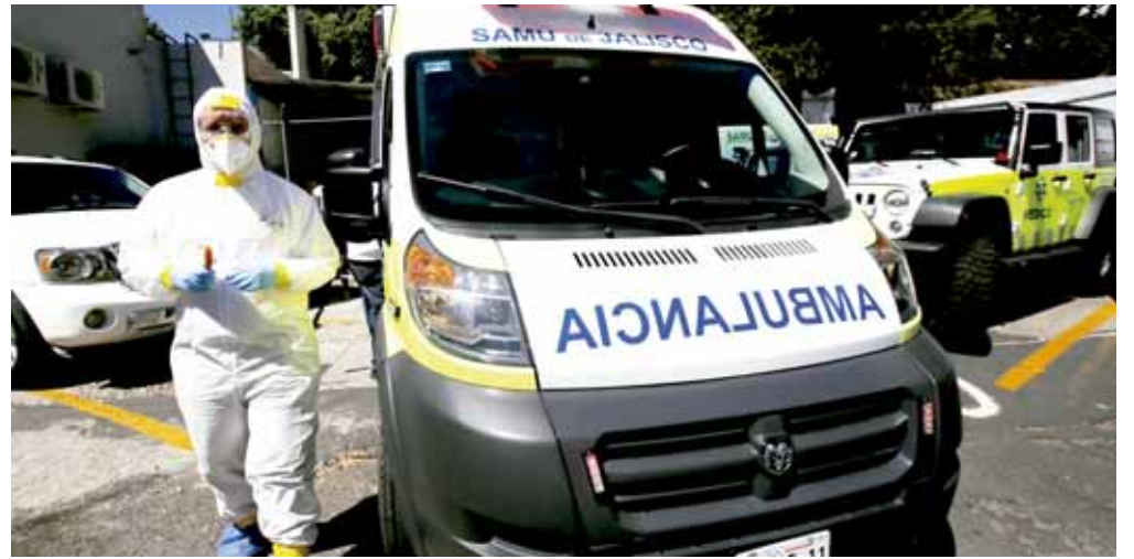
En Jalisco, Estado perteneciente a México cuentan con una ambulancia especializada en los casos.

El brote ha despertado temores para la eco-