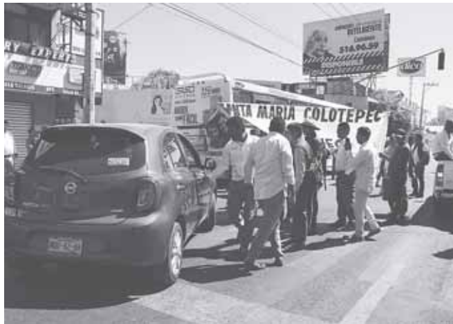
► Obligan a automovilistas a desviarse de ruta.