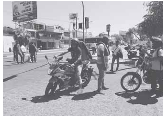
► No valieron las súplicas con los seguidores de Carmelo.