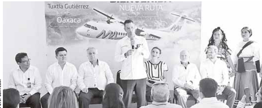
► El gobernador Alejandro Murat y el secretario de Turismo Federal, Miguel Torruco, inauguran el vuelo de Aeromar Tuxtla Gutiérrez-Oaxaca.

más mundo en Oaxaca y más Oaxaca en el mundo. "Lo que queremos es que haya mayor inversión para Oaxaca", afirmó, al tiempo de aseverar que esta nueva ruta también forma parte del fortalecimiento de la conectividad aérea que su gobierno ha impulsado desde el inicio de su administración.