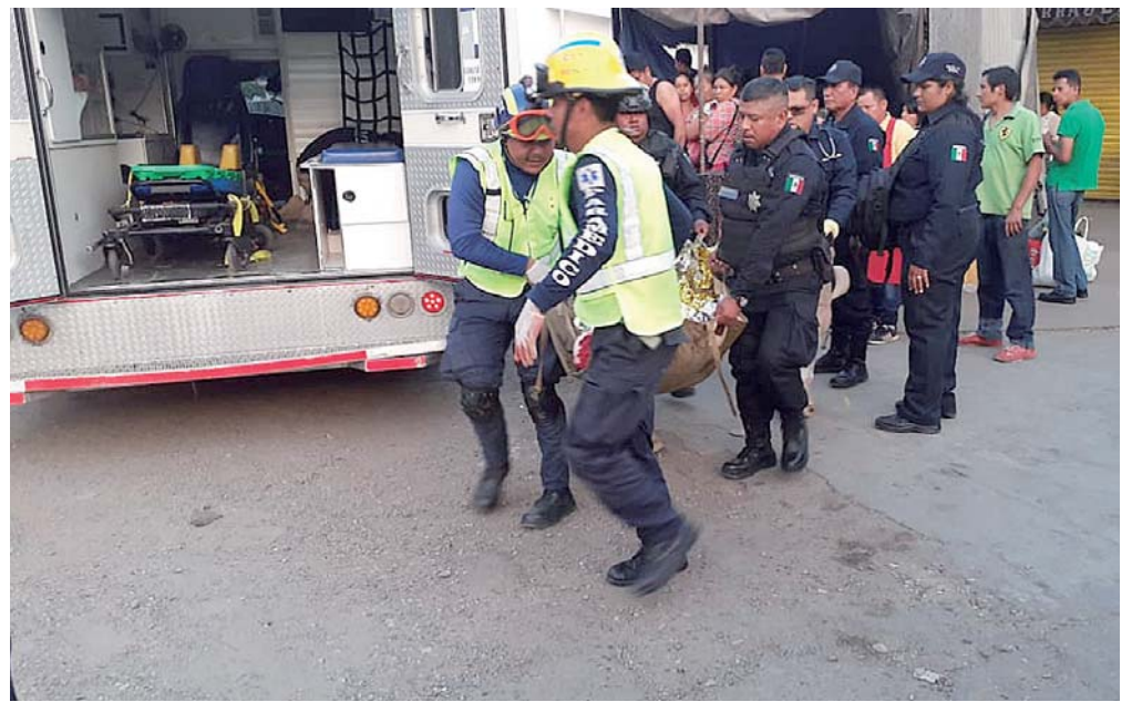
► El lesionado fue trasladado de urgencia hacia el Hospital Civil, Doctor Aurelio Valdivieso.