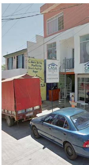
► La fémina fue internada en una clínica para su atención médica.

ron conocimiento del hecho y en las próximas horas se tratará de determinar el móvil de la agresión, a además de iniciar una exhaustiva investigación del caso.