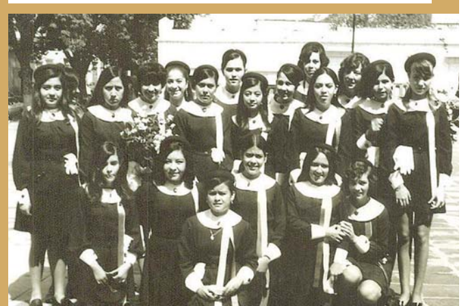
► Las alumnas portando sus uniformes de gala después de asistir a misa por su fin de curso.