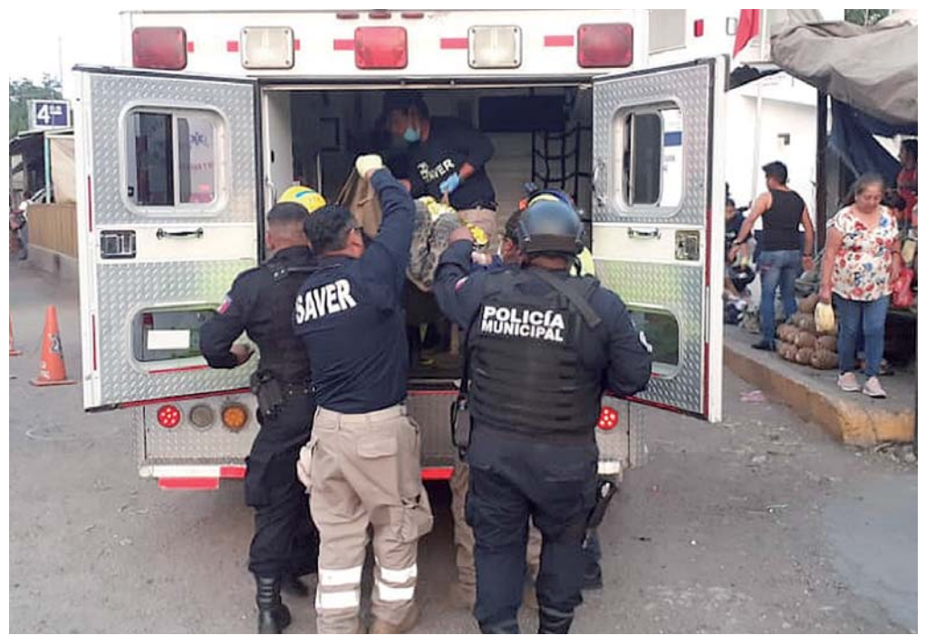
► Fue trasladado de urgencia al Hospital Civil.

Elementos de las distintas corporaciones policíacas se dieron cita en el lugar, para tratar de ubicar al o a