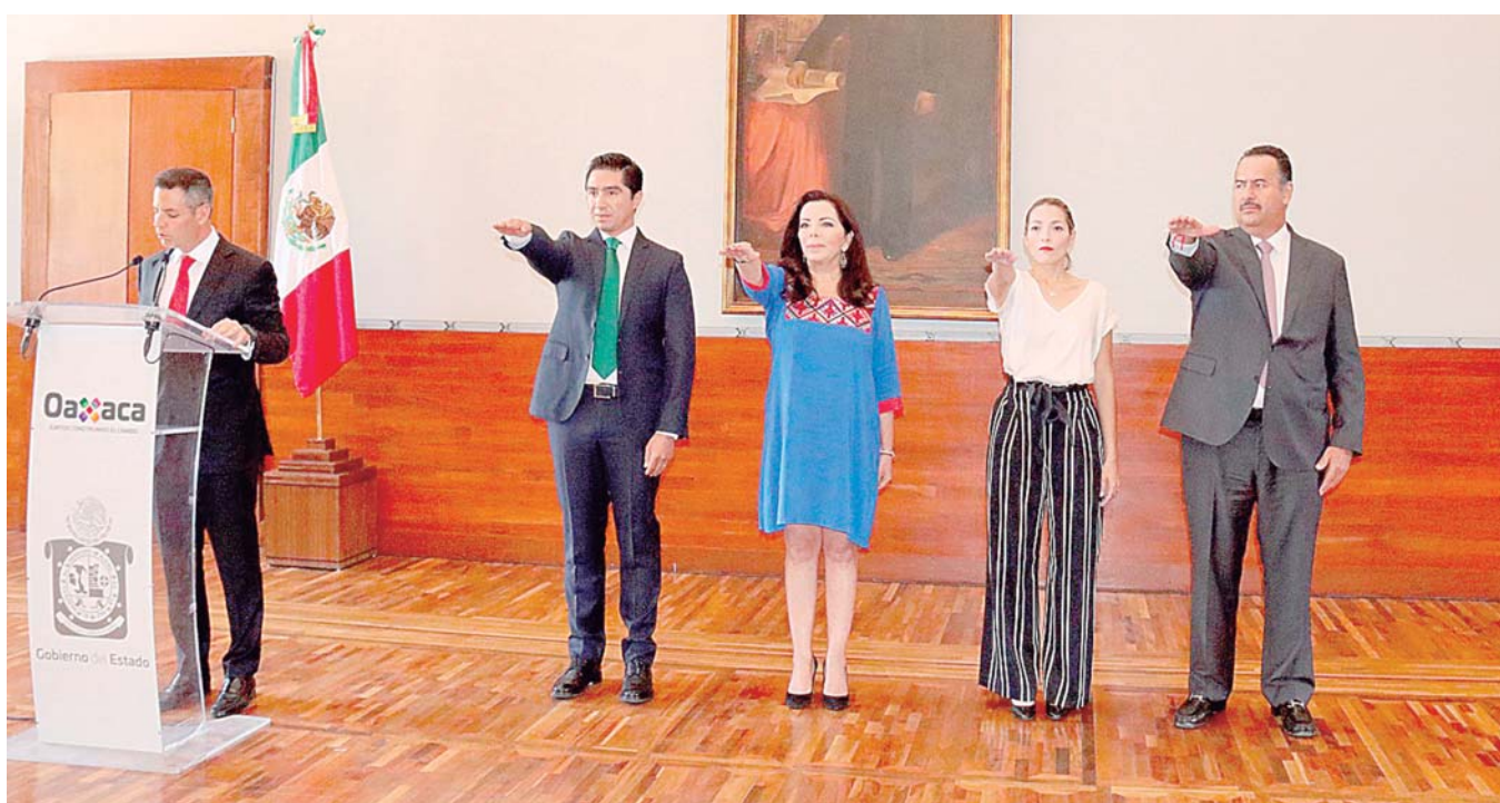
▶ A poco de iniciar su cuarto año, el gobernador Alejandro Murat realizó cambios y enroques en su gabinete.

Bien. Hoy en día, en nuestro México, bien podemos parafrasear a Knilling y decir que "el enemigo está a la derecha y el peligro a la izquierda", por ese acomodo de malos y buenos que desde el virreinal Palacio Nacional se elogian y condenan alternadamente todas las mañanas, logrando sólo un mal objetivo: dividir al país y generar condiciones para la inestabilidad, la decadencia y la caída en nuestra economía y las finanzas del Estado. Esos son los lamentables resultados: ficción y facción, enemigos de la realidad, de la historia.