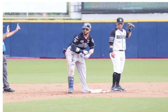
► También se suspendieron los juegos abiertos al público en el parque Eduardo Vasconcelos.

Además de las recomendaciones por el Gobierno del Estado de Oaxaca, la directiva bélica anunció que quedan suspendidos los partidos de pretemporada programados los días 27, 28 y 29 de marzo en la