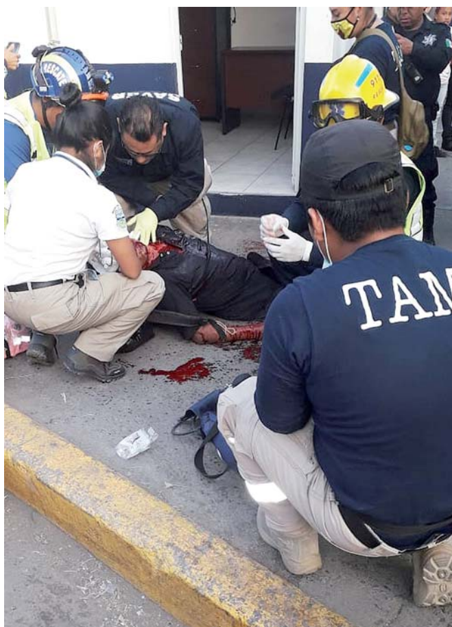
► La víctima presentaba una hemorragia abundante.

Al lugar de manera oportuna arribaron paramédicos de la brigada Bravo Alpha, a bordo de biciambulancias color verde, quienes valoraron al lesionado y contuvieron la abundante hemorragia que presentaba, a la