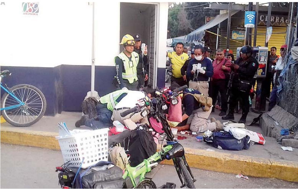
► El hombre fue auxiliado cerca del módulo de policías, a un costado de las bodegas de fruta.

policiaca@imparcialenlinea.com / Teléfono 501 83 00 Ext. 3176