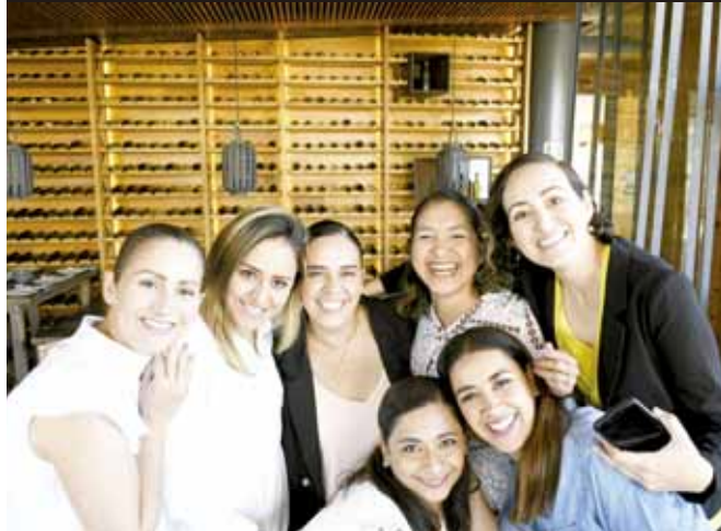
► Entre risas y cariño celebraron ese día.