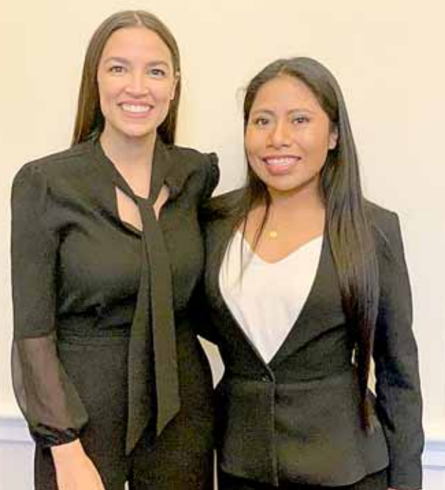
► La actriz agradece a la congresista y a su equipo que le haya abierto las puertas de su oficina en Washington.

Gracias a nuestro encuentro pudimos escucharnos y compartir nuestro punto de vista sobre los derechos de las y los trabajadores del hogar", escribió.