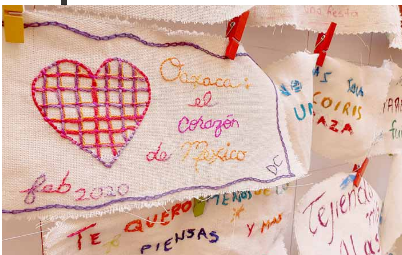
► Los asistentes podrán bordar o escribir alguna frase.

“Este taller surge porque en las piezas de la exposición Escribir con una aguja: la palabra en el textil hay implicados muchos textos, podemos leer poemas, despedidas y dedicatorias; algunas frases están escritas con la aguja o con el telar y se busca que los participantes tengan una experiencia más amplia de lo que es el textil”.