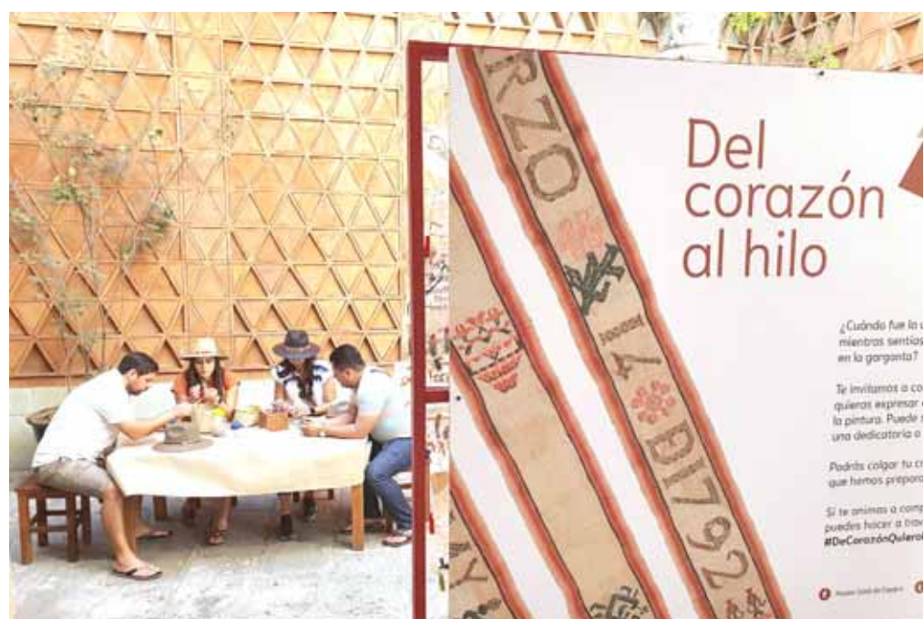
► La actividad se realiza desde el pasado 18 de enero.