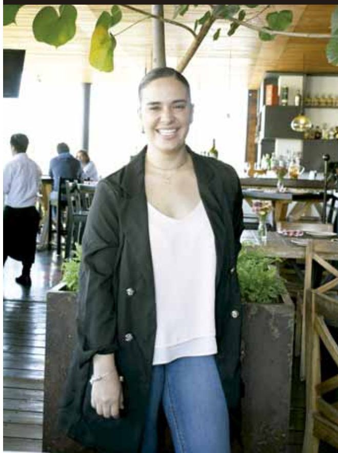
► La festejada disfrutó de la celebración de su cumpleaños.

Las ahí presentes disfrutaron de una muy grata reunión donde pudieron reunirse disfrutando su amistad forjada en estos pequeños detalles.