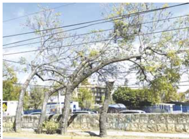
► Los árboles podados no han recibido atención.

El funcionario municipal expuso que en tanto se realiza este convenio, se solicitó a la CFE evitar más podas en la ciudad.