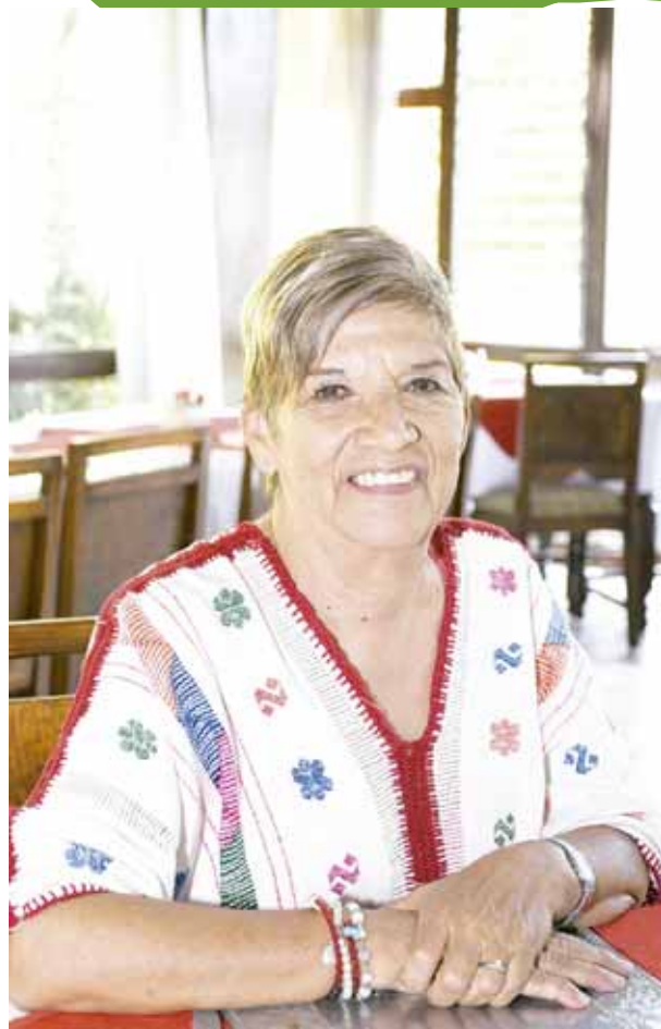
► Tutis de Santillana.

Un cordial saludo para las guapas mujeres que posaron para el lente de Estilo Oaxaca .