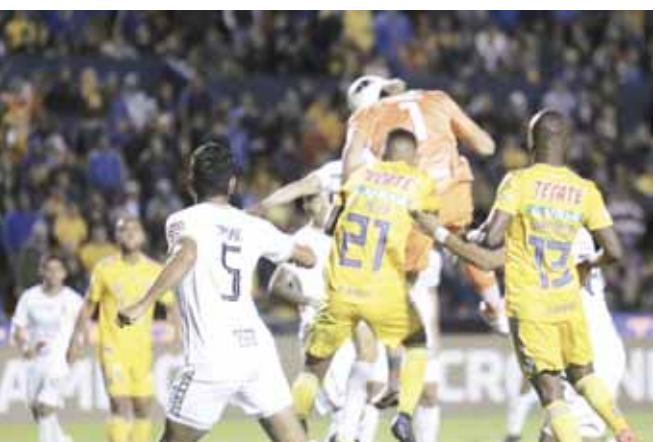
► Tigres avanzan con global de 5-4 a los Cuartos de Final de la Concacampions.

El "Patón" se fue a celebrar con los Libres y Lokos, mientras su nombre era coreado. Así acabó la noche histórica de Gignac, que terminó encumbrando a Nahuel.