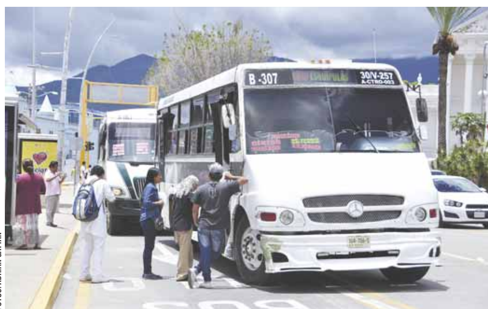
► Se requiere cambiar, mínimo, el 30% de los camiones urbanos que circulan.