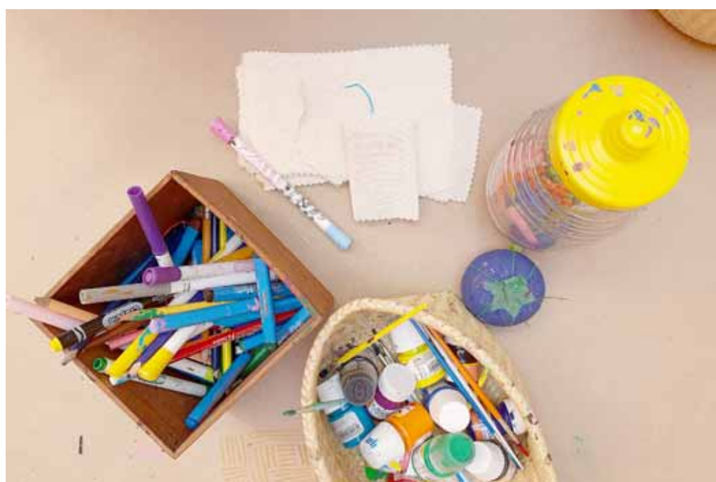
► Con plumones o hilos para bordar podrán expresarse.