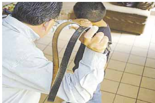
► La agencia de Pueblo Nuevo presenta mayor incidencia en violencia familiar.