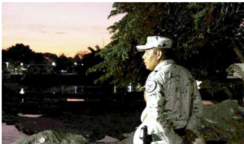
► Los elementos de la Guardia Nacional, al ser atacados, sólo repelieron la agresión.

Posteriormente, a la zona arribaron los elementos de las Policías Municipal y Estatal, quienes acordonaron el área y dieron aviso al personal de la Agencia Estatal de Investigaciones (AEI),