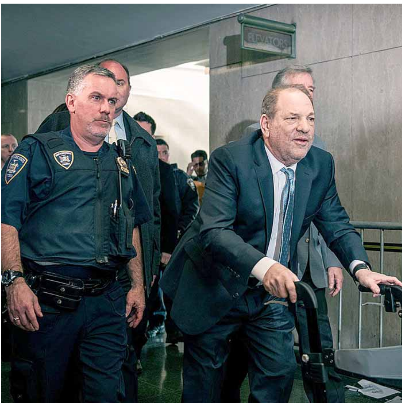
► La sentencia del ex productor de Hollywood está programada para el 11 de marzo.

enesena@imparcialenlinea.com / Teléfono 501 83 00 Ext. 3172