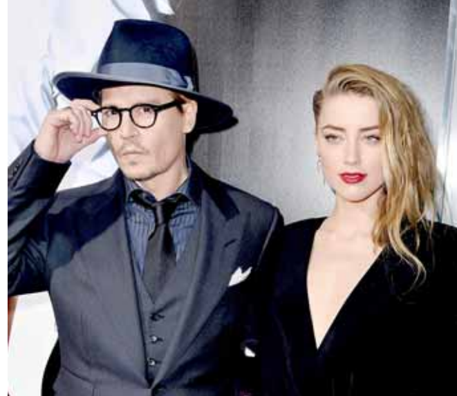
► La pareja se divorció con gran estruendo en 2016.

Un abogado de Weinstein no pudo ser contactado para realizar comentarios el miércoles.