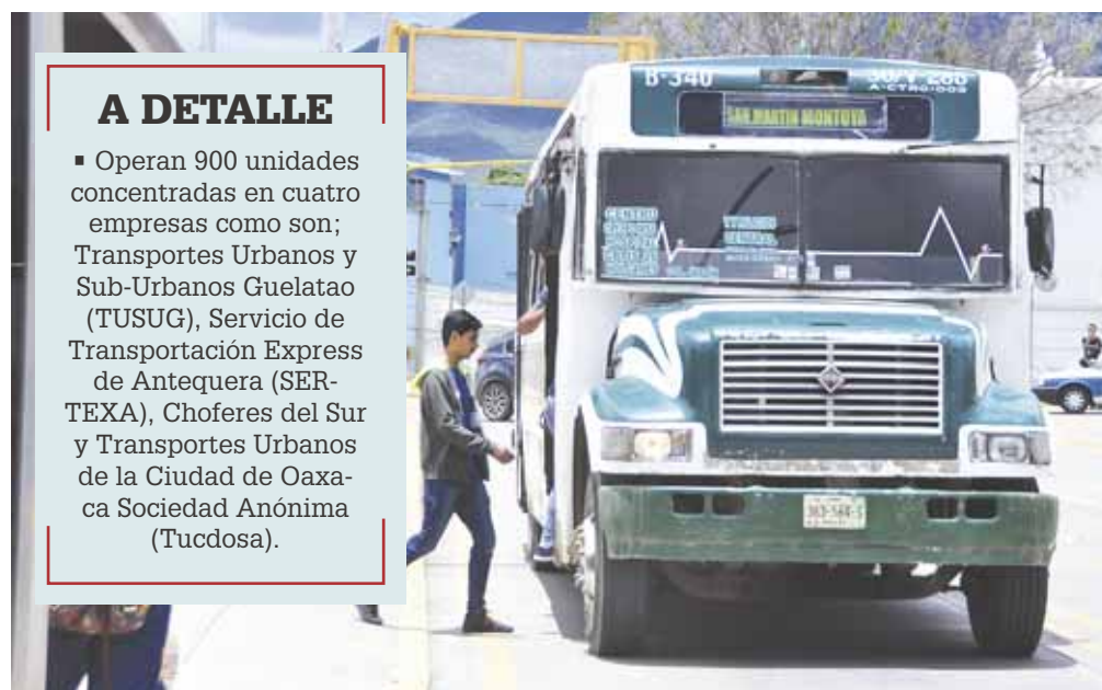
► Varias unidades ya rebasan los 10 años de servicio que marca el reglamento.