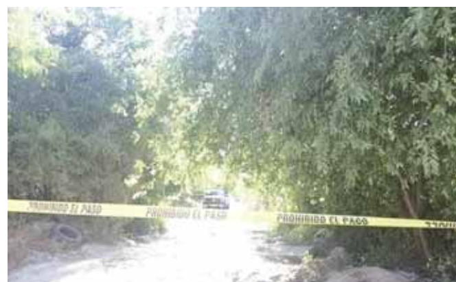
► Los lamentables sucesos acontecieron el 17 de agosto de 2019, sobre avenida Oaxaca, en Puerto Escondido. El cuerpo fue arrojado en un camino de terracería.