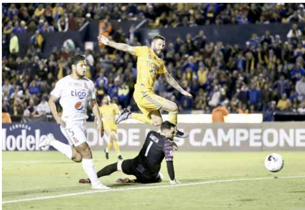
► André-pierre Gignac se convirtió en el máximo goleador del fútbol regio.

ve ante la salida del arquero Rafael García. Con ese gol, Gignac empató en 121 a Suazo, pero al 23', de penal, anotó el 122 que lo convirtió en solitario en el máximo romperredes del fútbol regio.