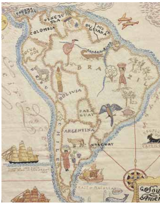
► Piezas de la exposición Escribir con una aguja: la palabra en el textil , la cual sigue vigente.