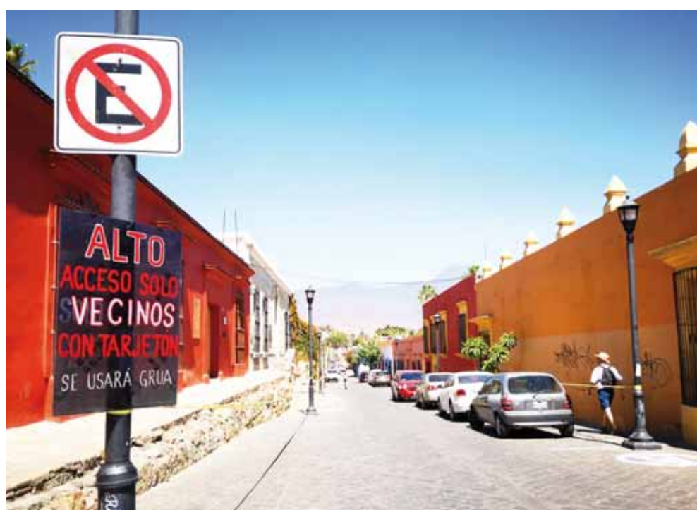
► Vecinos han colocado letreros para impedir el paso de los automóviles.

“Ya de paso nosotros también pedimos a la autoridad que ya le den una manita de gato a nuestra calle, que se vea la cuarta transformación, votamos por el cambio para tener una mejor ciudad pero hasta al momento no vemos que esto mejore”, destacó.