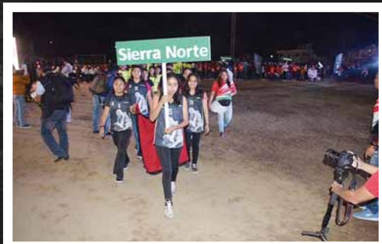
► La Sierra Norte también compete en la justa deportiva.