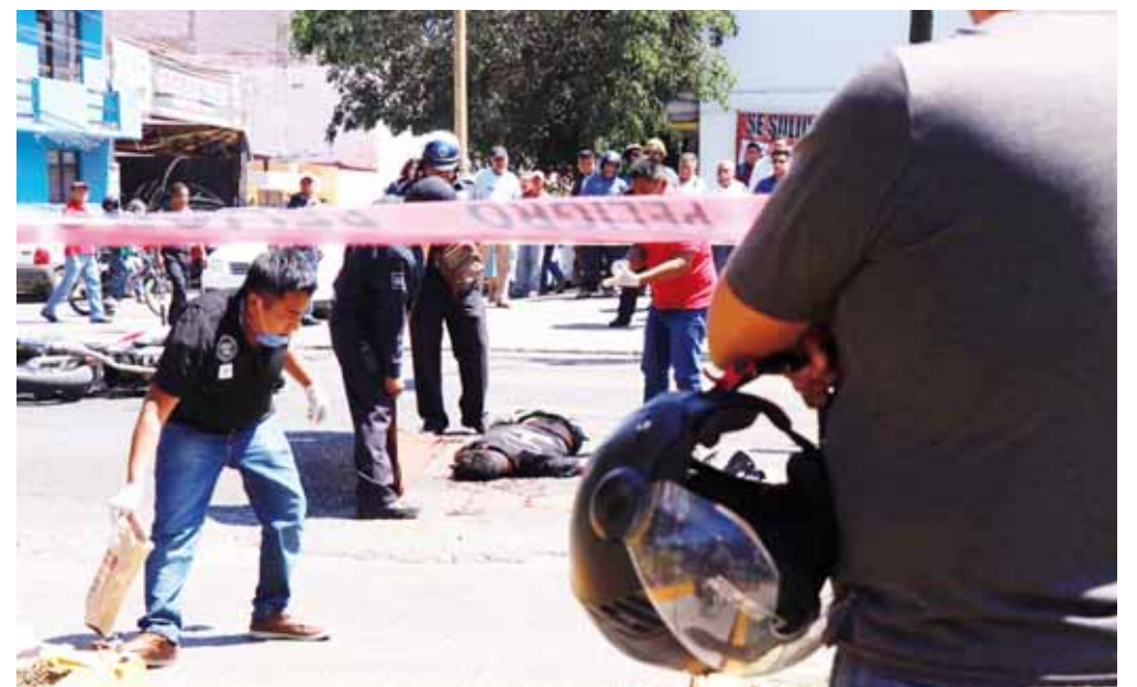
► El accidente sucedió frente a una gasolinera del bulevar Eduardo Vasconcelos.

Automovilistas y transeúntes, al ver el accidente, corrieron a tratar de auxiliar a la víctima.