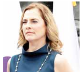
Beatriz Gutiérrez Müller.

Sin embargo, más tarde rectificó y se sumó al movimiento #NOALPARONACIONAL, que congrega a simpatizantes del Presidente y llama a hombres y mujeres a trabajar para erradicar la violencia.