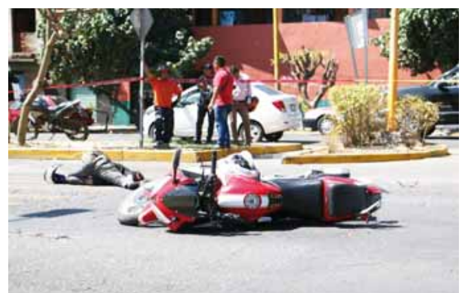
► Trascendió que la víctima es originaria de Huautla de Jiménez, pero vivía en Oaxaca por trabajo.

ma, en tanto paramédicos y rescatistas del Escuadrón ORAM, arribaron al lugar para ayudar pero ya no fue posible, pues el joven perdió la vida al instante que le aplastaron la cabeza.