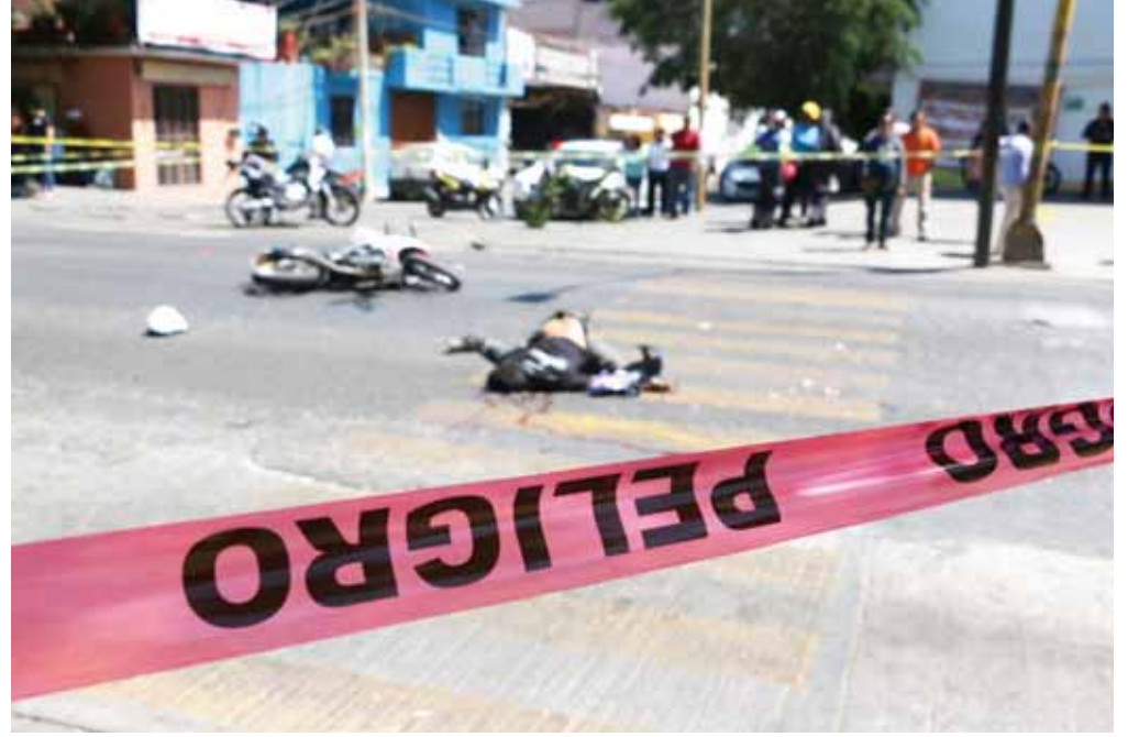
► El motociclista estaba detenido esperando la luz verde en el semáforo.