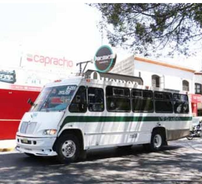
► Este camión de la Tusug fue el responsable del accidente.

Cabe hacer mención que SEMOVI mandó un comunicado, donde mencionaban, que debido a los diferentes sucesos que han venido cometiendo los urbaneros de la empresa TUSUG, se inició el procedimiento para cancelar la concesión del camión que provocó la muerte de una persona.