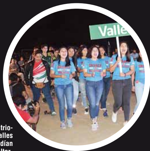
► Los anfitriones de Valles no podían faltar.

Editor: Diego MEJÍA ORTEGA / Diseño: Humberto GUERRERO GARCÍA