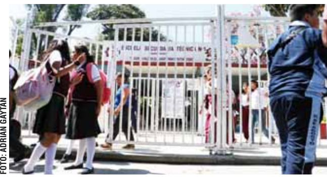
Estudiantes y académicos de la EST 6 piden mayor seguridad.