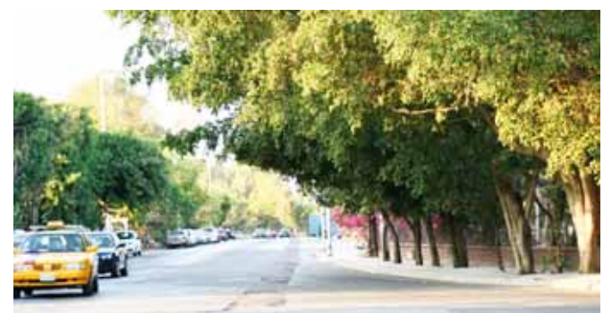
► A pesar de ser una vía concurrida no ha tenido mantenimiento.

el Periférico y concluye en el mercado, los vecinos colocaron una señalización de “peligro”, para evitar que los peatones o incluso los automovilistas puedan sufrir algún tipo de accidente.