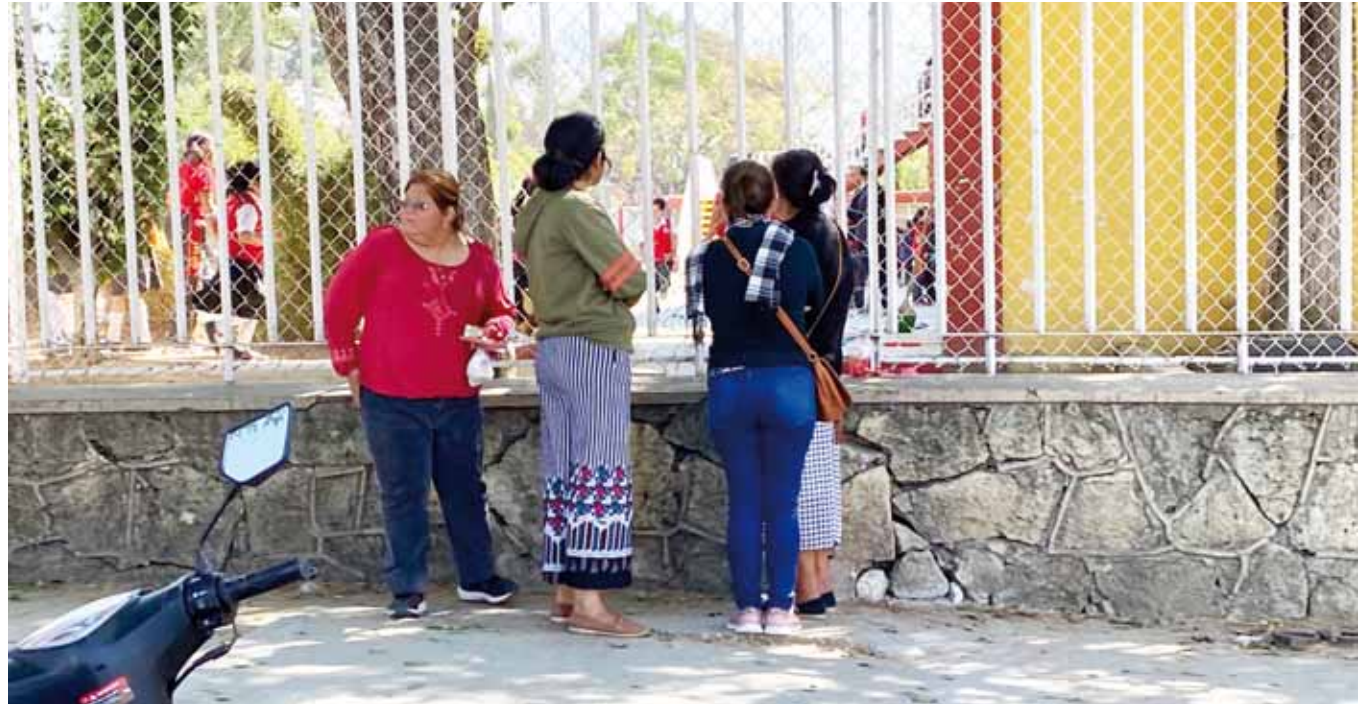
► Padres de familia se encuentran preocupados por sus hijos.

Dijo que en el corredor escolar de San Felipe