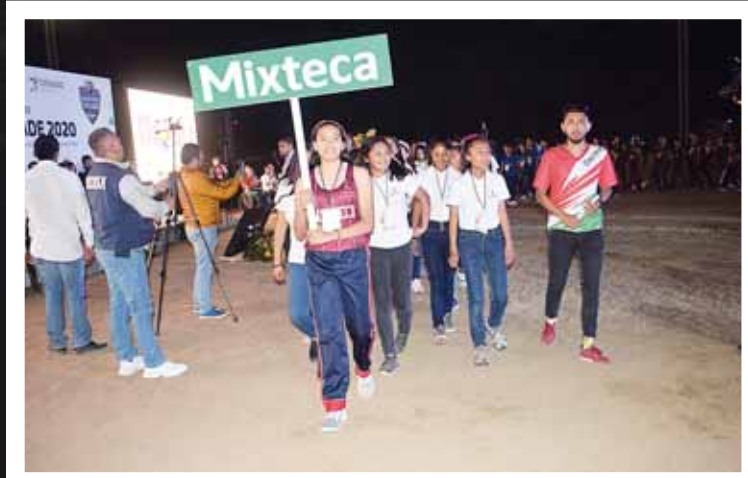
► La Mixteca presente en la inauguración.

dos de año comenzarán los trabajos en la Unidad Deportiva El Tequio, con la remodelación de la Alberca Olímpica y la Pista de Tartán que se encontraban prácticamente en el olvido.