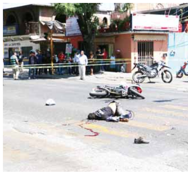
► El cafre iba echando carreras para ganar el pasaje cuando arrolló a la víctima.