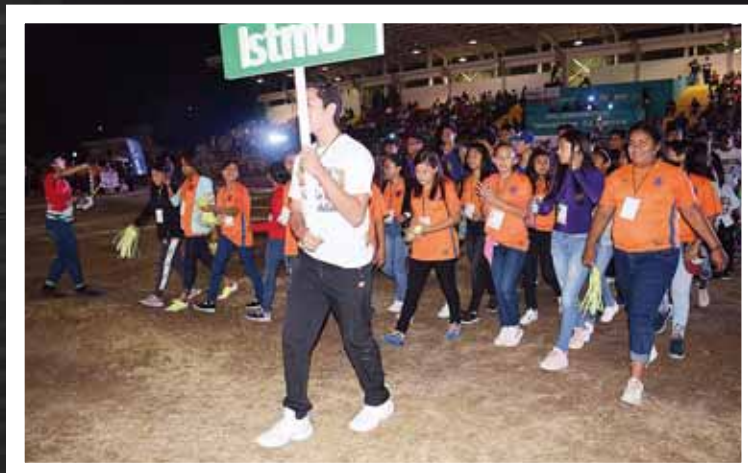
► Los istmeños le pusieron mucho ánimo a su intervención.

Asimismo, la administración estatal espera dejar un legado que perdure y por ello a media-