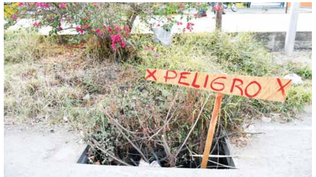
► Han colocado letreros de advertencia para evitar accidentes.

Ante esta situación, los vecinos se vieron obligados a colocar cintas de precaución en el paso peatonal, pues a pesar de ser un paso obligado para los turistas que disfrutan de las calles de la capital, los automovilistas obstruían frecuentemente las banquetas.