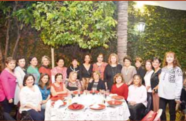
► Contenta la festejada recibió infinidad de parabienes de parte de sus invitados.