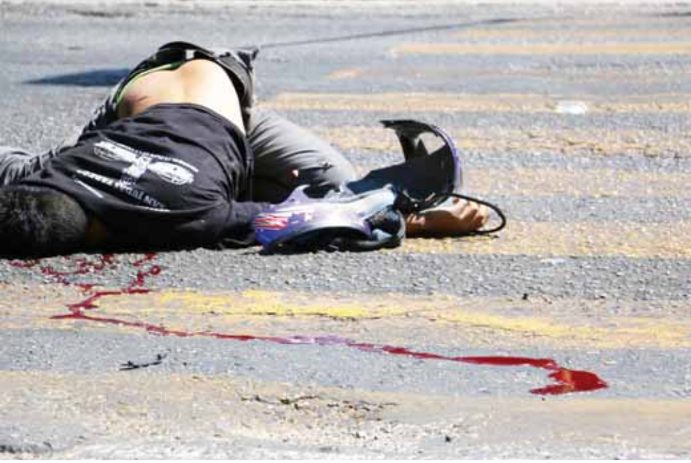
► El camión le pasó encima al motociclista.

policiaca@imparcialenlinea.com / Teléfono 501 83 00 Ext. 3176