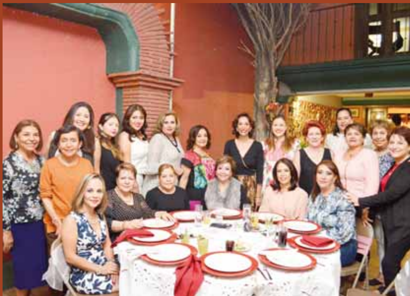
► Los más allegados estuvieron disfrutando de la agradable velada.