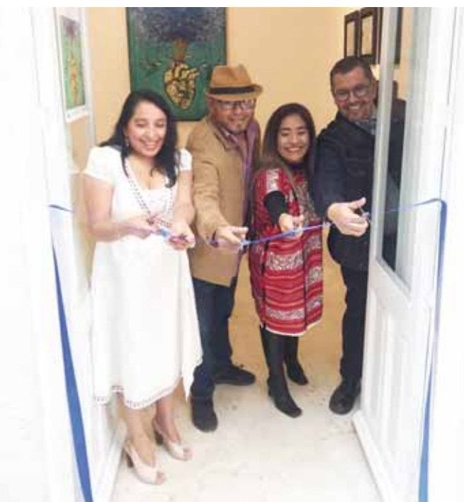
► Inauguraron la colorida exposición "Naturaleza de los sueños".

Por lo pronto, la exposición "Naturaleza de los sueños" se puede visitar en la galería que se ubica en Salvador Díaz Mirón #128, Santa María La Rivera, delegación Cuauhtémoc en la Ciudad de México, donde permanecerá hasta principios del mes de marzo.