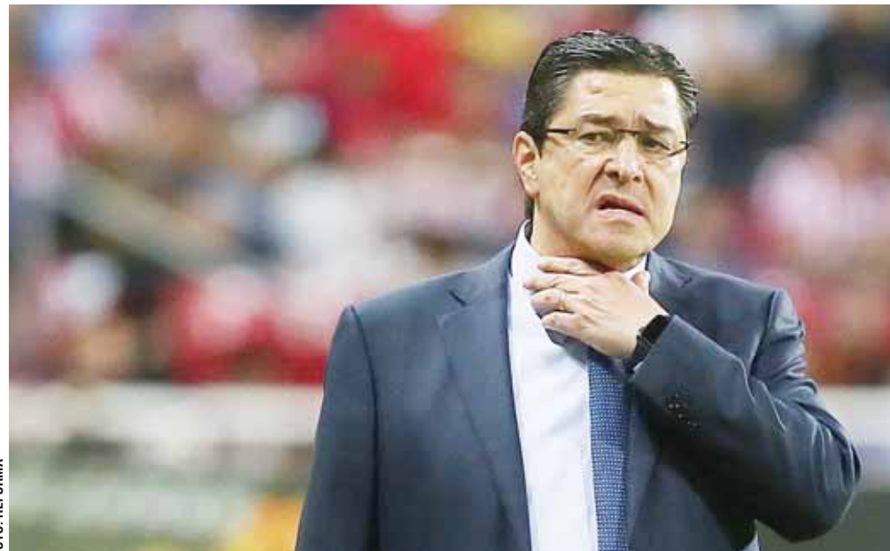
► Las rachas negativas rodean y envuelven a Tena y sus Chivas.

Como timonel de equipos de menos mediáticos incluso, Tena ha tenido que salir cuando ya se juntaron varios partidos sin una línea positiva. Le pasó con León en 2016 al acumular cinco caídas en siete juegos, le sucedió en Morelia en el 2009 por sólo reportar dos victorias en seis cotejos, y también con Jaguares en el 2010 por cuatro encuentros sin triunfo.