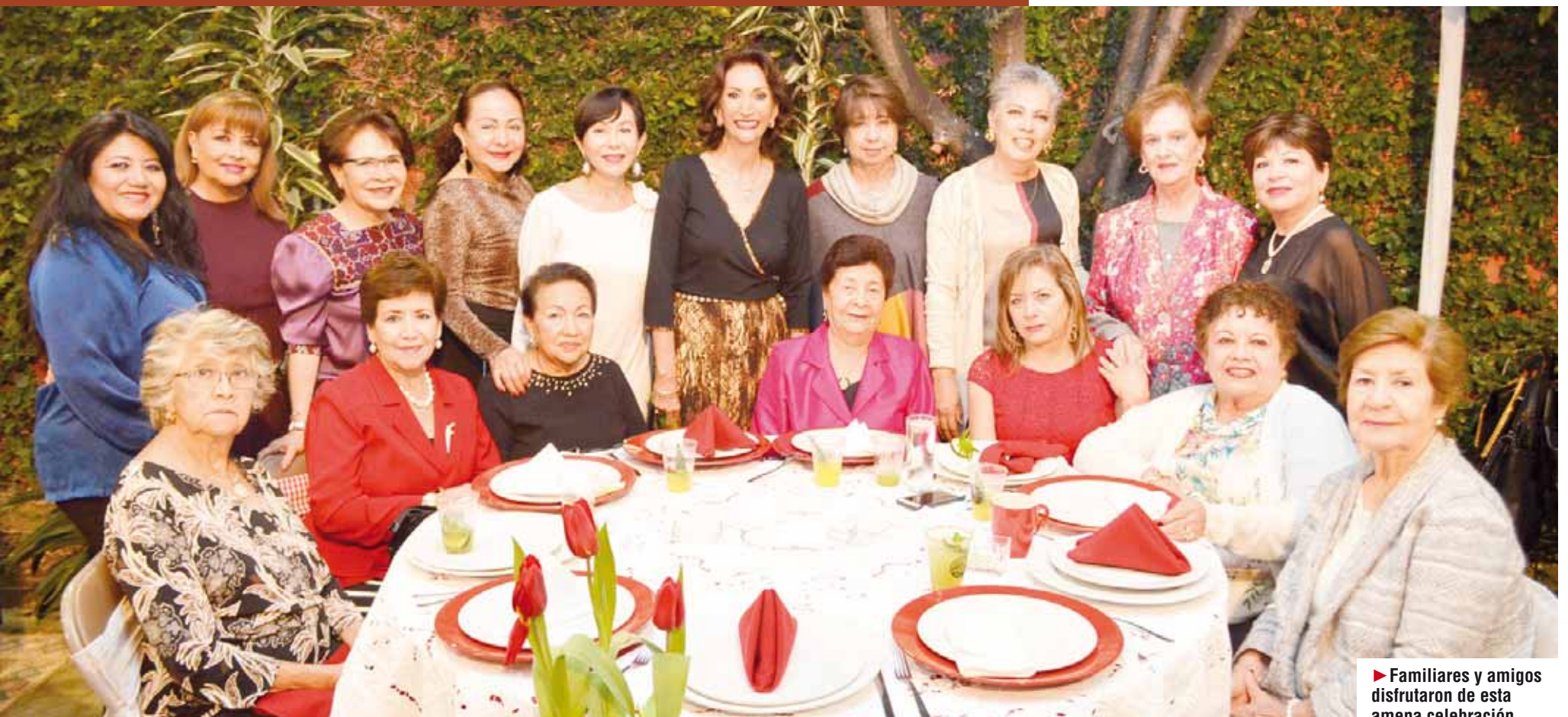
► Familiares y amigos disfrutaron de esta amena celebración.