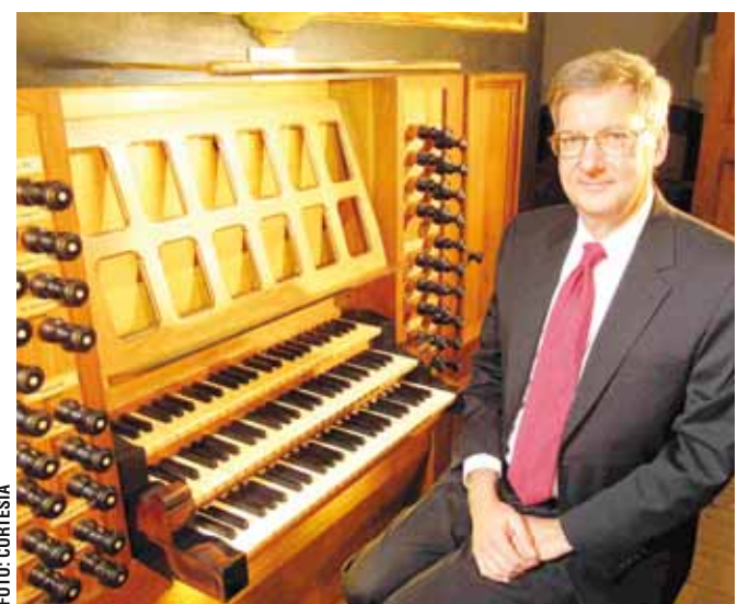
► El prestigioso organista Craig Cramer brindará un concierto gratuito.

Tiene quince grabaciones de CD y sus conciertos se escuchan con frecuencia en el programas del National Public Radio.