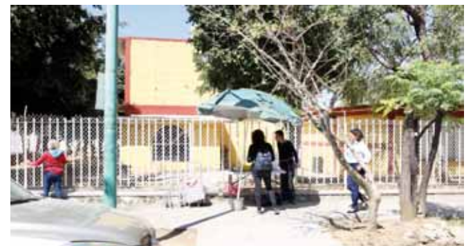
► Exhortaron a familiares a denunciar a quienes se dedican a actividades ilícitas fuera de las escuelas.

ter delitos, por eso a partir del 1 de marzo vamos a iniciar un operativo, ya no se va permitir que levanten pasaje en el Centro Histórico, solamente dejar y que se retiren del centro lo más pronto posible, queremos mantener las zonas escolares libres de cualquier delincuente, acosador y ya no digamos de algo más”, apuntó.