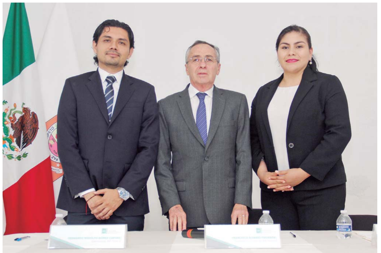
► Al nuevo comisionado del Instituto de Acceso a la Información y Protección de Datos Personales (IAIP), no se le conoce ni experiencia ni tablas en el tema

Las políticas públicas responden sólo a enunciados de corte político. No hay interés en la mejora social. Se gobierna con encono, con afanes divisionistas, con falseadas rifas. El bien social queda relegado al capricho de los alarmistas de catástrofes, una forma de desviar la atención de los verdaderos problemas.