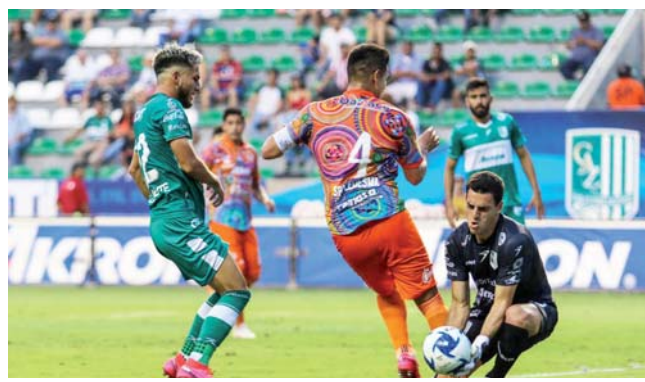
► En la segunda parte Oaxaca salió en busca del empate.

El próximo juego de Alebrijes será el 23 de febrero visitando al Tampico MaderoFC.