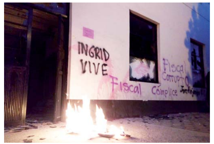
► Las activistas causaron varios daños a las instalaciones del CEJUM.

Ante lo ocurrido en la zona fue solicitada la presencia del Cuerpo de Bomberos, que arribó para atender el supuesto incendio, la circulación de automóviles se vio interrumpida durante la manifestación. Personal de la Fiscalía General que atiende en este inmueble se resguardó ante la amenaza latente de los inconformes, que arremetieron en contra de la fachada de las instalaciones.