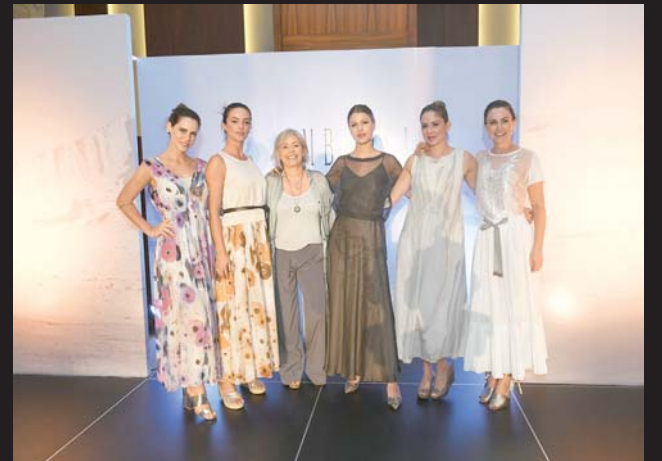
Las hermosas modelos y la representante de la marca Ambrosi.

La pasarela se llevó a cabo en un céntrico hotel de esta ciudad y posterior al desfile selecto y privado se dio lugar a un cóctel en donde los asistentes disfrutaron de una excelente tarde - noche.