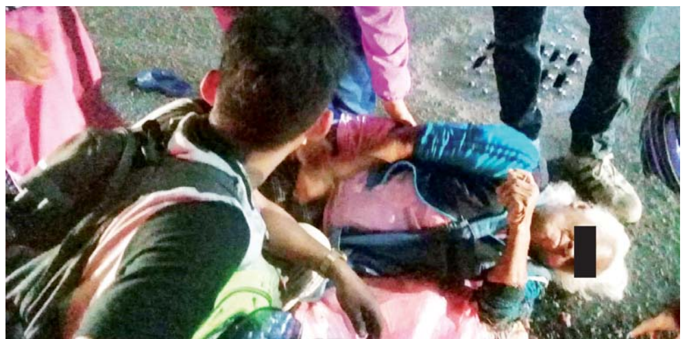
► La septuagenaria fue trasladada de urgencia a un hospital.

Policías municipales arribaron al lugar para resguardar la zona, en tanto se llevaban a cabo las actividades de los paramédicos.