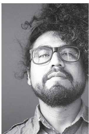
► Los oaxaqueños compiten por el máximo galardón del cine mexicano.