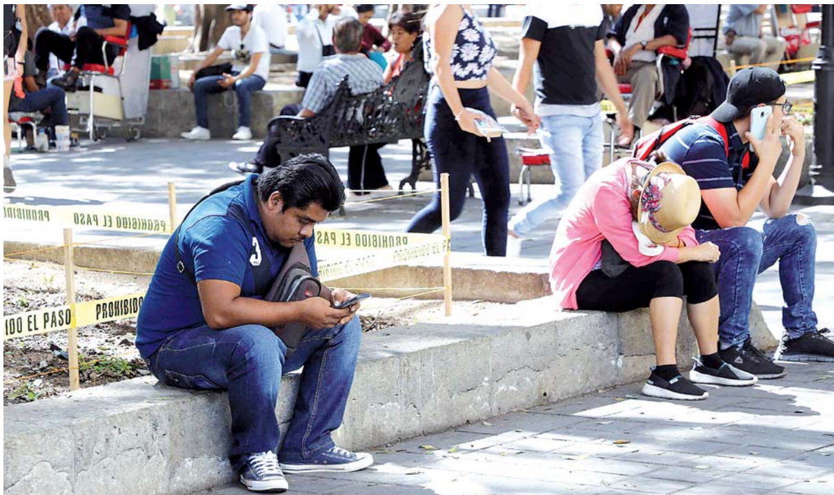
► Aunado a la falta de oportunidades, los jóvenes se topan con trabajos en los cuales no es seguro el salario.

"En Oaxaca se registra la mayor presencia de mujeres sin estudiar ni trabajar. Por cada hombre que no estudia y no trabaja en el esta-