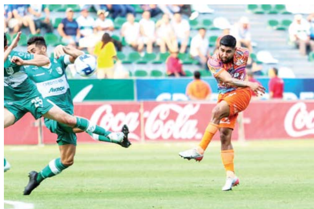
► En el primer tiempo Zacatepec mostró más autoridad.