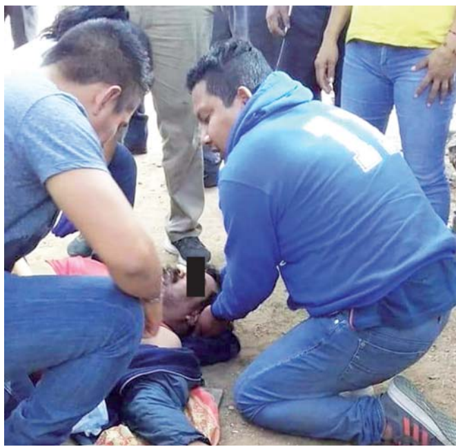
► El chofer de la pesada unidad quedó grave e inconsciente en el lugar.

policia@imparcialenlinea.com / Teléfono 501 83 00 Ext. 3176