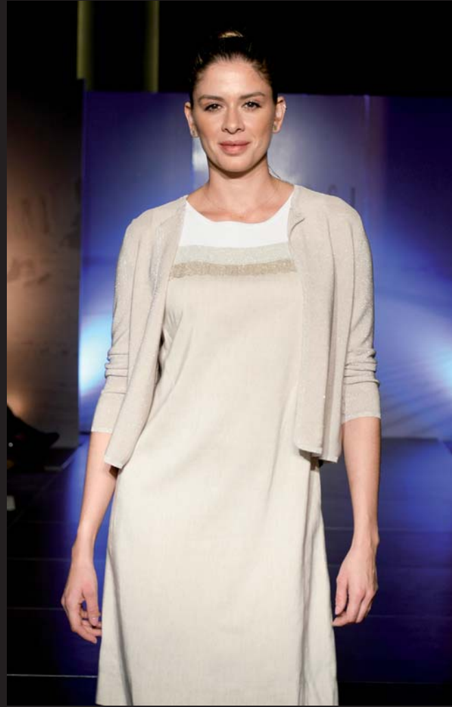
Diseños en la pasarela.