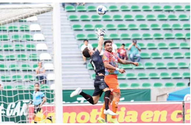
► Los oaxaqueños tuvieron la posibilidad de empatar por medio de un penalti.