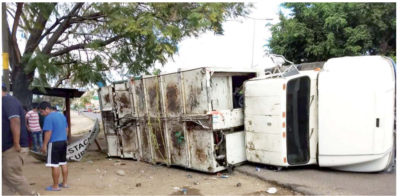
► El camión volcó pesadamente sobre uno de sus costados.