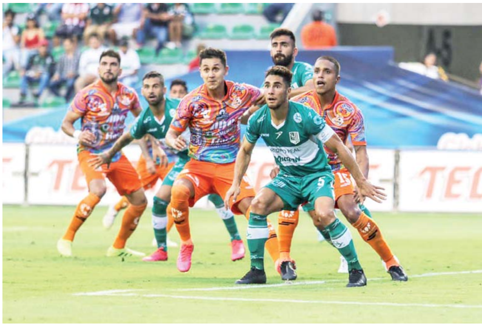
► El próximo juego de Alebrijes será el 23 de febrero visitando al Tampico MaderoFC.

Apenas sé estar con un hombre más, Oaxaca no pudo lograr la paridad y