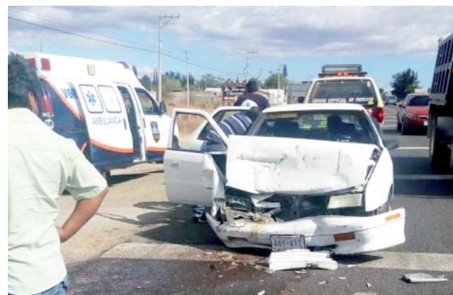
► Un automóvil resultó con daños en la parte frontal.