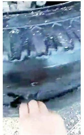
► Las llantas estaban en muy malas condiciones.

Minutos después, al lugar llegaron paramédicos de San Bartolo Coyotepec, quienes le brindaron los primeros auxilios a la víctima, al ver que sus lesiones eran de gravedad, fue trasladado inconsciente a un hospital y no pudo dar sus