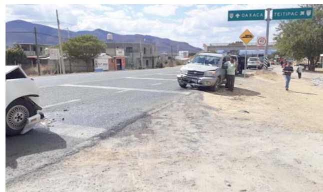
► El conductor de la camioneta, el posible responsable.

arribaron paramédicos del grupo VOREAM, quienes le brindaron los primeros auxilios a la víctima, al ver que una menor y una mujer estaban heridas, fueron trasladadas a un nosocomio.