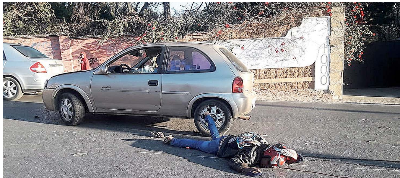
► Mientras tanto, el presunto responsable huyó del lugar.

Al circular sobre la carretera Ignacio Bernal, en el carril que de dirige a Montoya, un hombre que conducía su vehículo Chevrolet tipo Chevy color arena, con placas de circulación del Estado de Méxi-