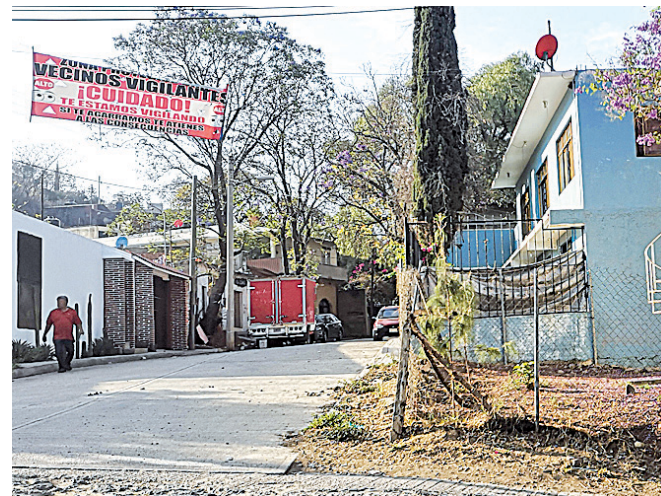
► Los vecinos se han organizado para protegerse.

Los vecinos de la colonia denunciaron a esta casa editorial que en constantes ocasiones han solicitado a las autoridades municipales mayor vigilancia, por los robos que se han dado en las viviendas y los transeúntes, donde las mujeres son las principales víctimas. Aseguraron que ante la inseguridad en la zona, vecinos de distintas calles decidieron organizarse para evitar más robos y aprehender a los delincuentes, ante la falta de actuación de las autoridades.