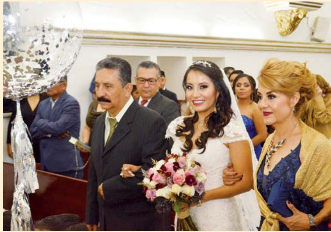
► La novia fue entregada al novio por su madre.