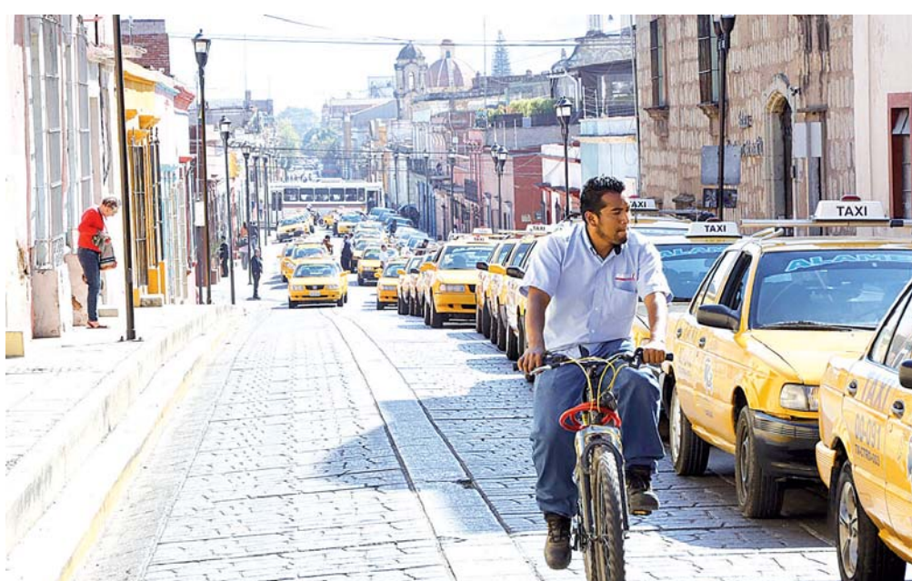
► Los taxistas bloquearon diversas calles del Centro Histórico.