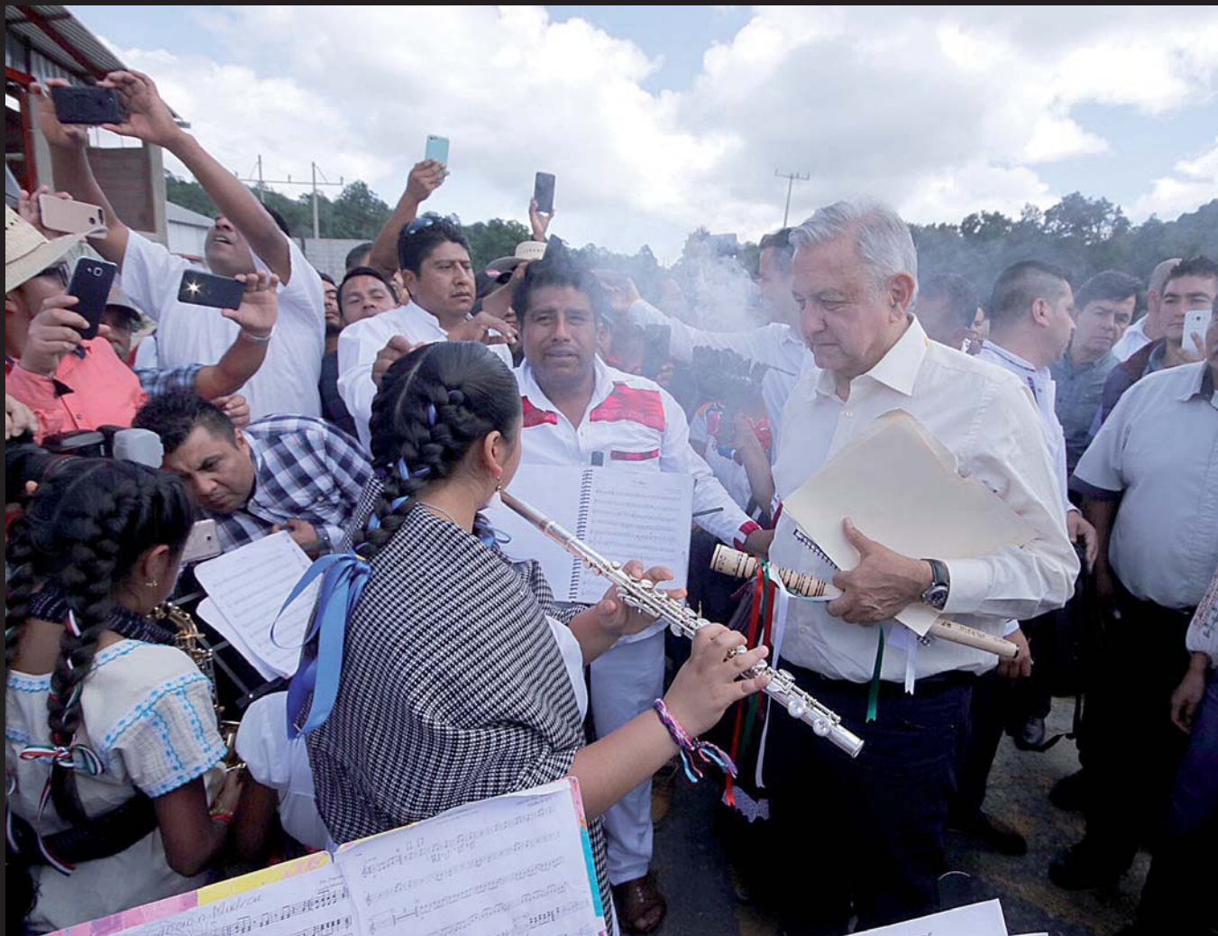
► El presidente Andrés Manuel López Obrador pidió no burocratizar la entrega del recurso.

Ante una solicitud de información, García Barrios sólo había dicho que se tra-