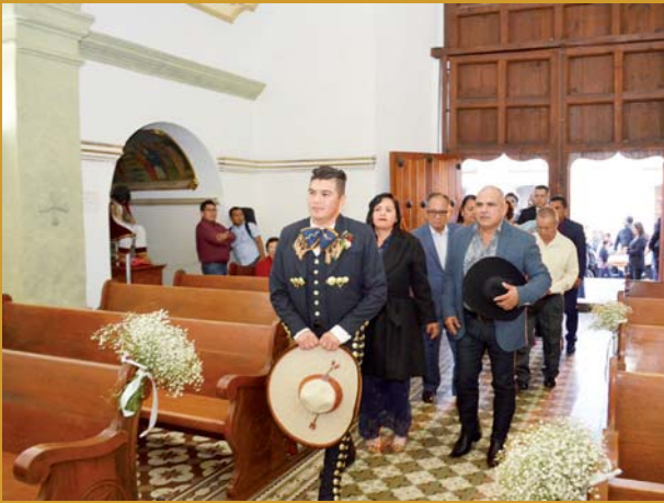
► El novio llegó al altar en compañía de los suyos.