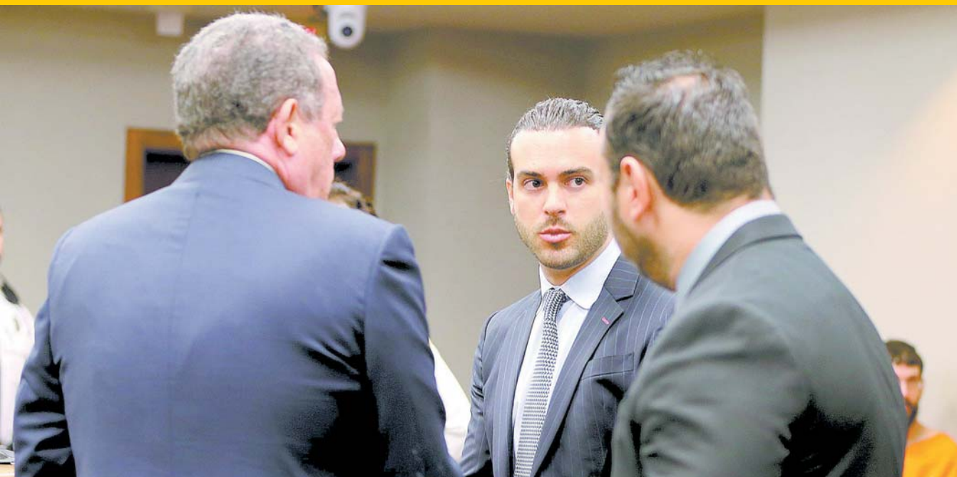
► Habían pedido permiso el 15 de enero para que el actor viajase a México