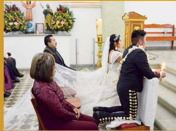
► Los padrinos de velación guiarán al matrimonio.