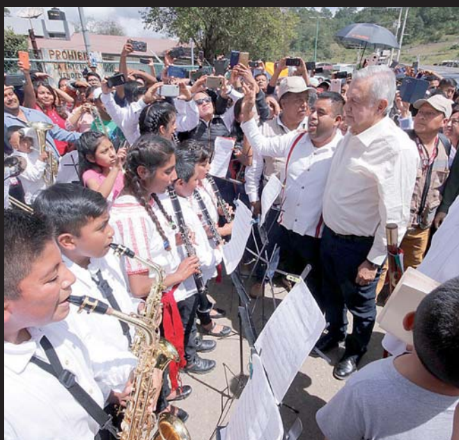
► No se sabe con certeza a cuántas bandas de música se apoyará.

bajará en un modelo musical comunitario y que para ello participarían estas instancias y la Secretaría de las Culturas y Artes de Oaxaca.