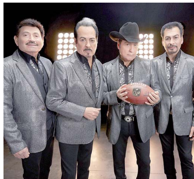
► Los podremos ver el próximo domingo 2 de febrero.