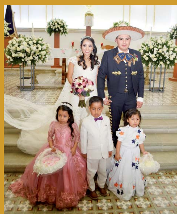
► La pareja con sus pajes.

La recepción los esperó en un jardín de la ciudad, en donde disfrutaron de un delicioso banquete y realizaron un acto social en donde participaron amigos y familiares.