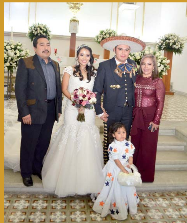
► El matrimonio acompañado de sus padrinos de velación.