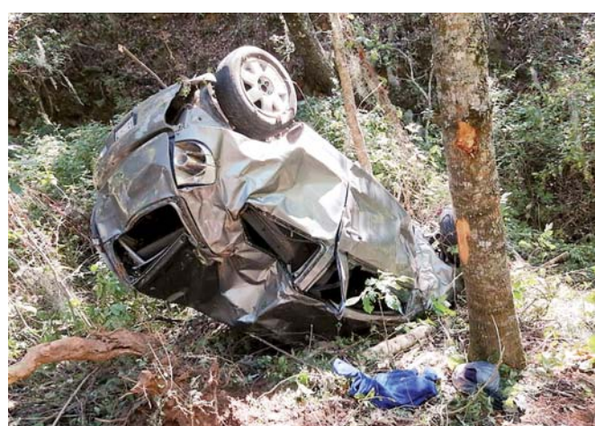
► Fueron reportados como desaparecidos el pasado 20 de enero: la última vez que fueron vistos fue en 19 de enero en Santa Lucía del Camino.

Después, se supo que los profesores no se presentaron a trabajar, ni el lunes,