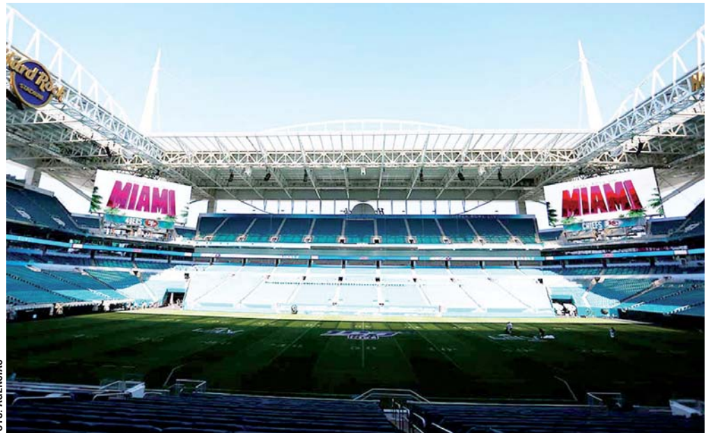
Para su remodelación se invirtieron 550 millones de dólares. El teleférico, la gran atracción.

la NFL hablaba, los trabajadores frente al estadio cortaban madera, aplicaban capas de pintura y probaban un teleférico, cuyos vehículos están hechos de material transparente y