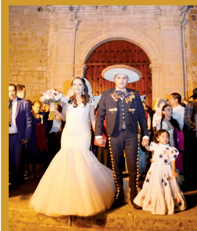
► Los novios disfrutaron de la compañía de amigos y familiares.