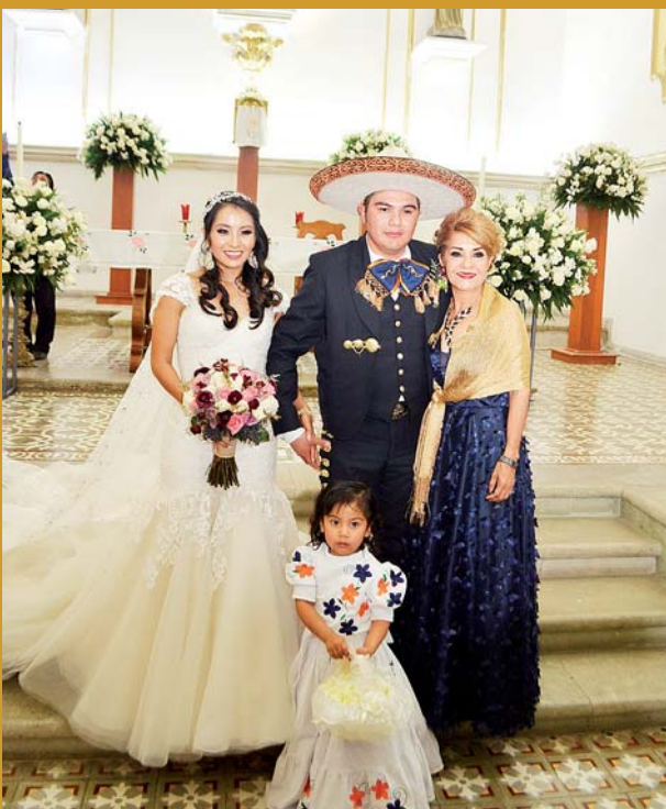
► La madre de la novia los acompañó.