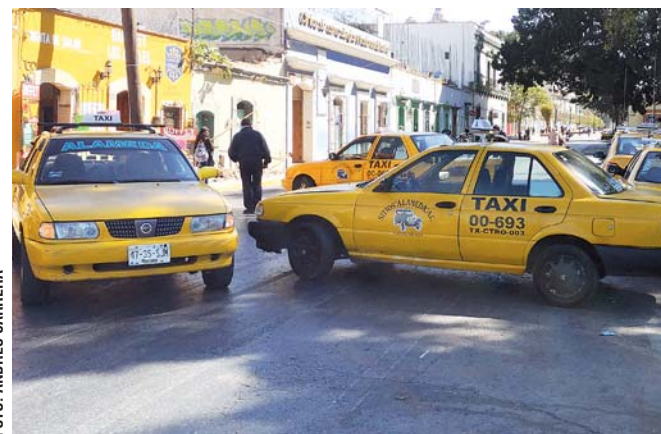
► Exigen que se atiendan sus demandas.

Detalló que por el uso de piso en espacios destinados al transporte público y por