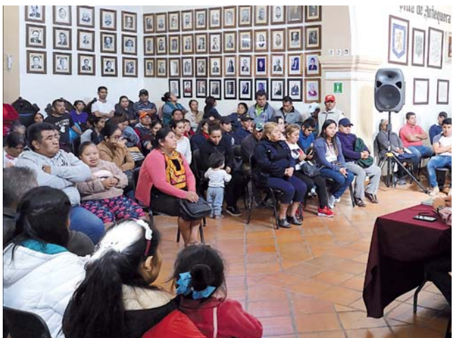
► Los ambulantes fueron atendidos por el gobierno municipal.

capital@imparcialenlinea.com / Teléfono 501 83 00 Ext. 3174