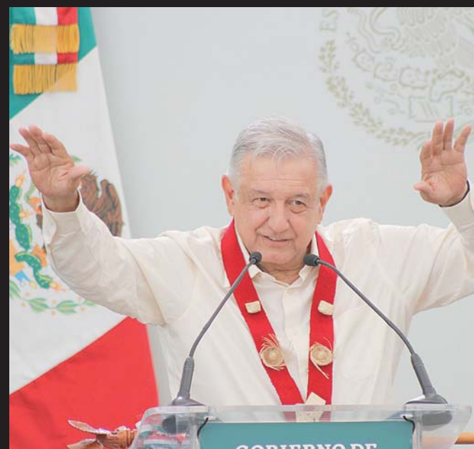
► El recurso ya lo tiene la Secretaría de Cultura federal.

Ya van a llegar los instrumentos, fue el compromiso del presidente que en el año pasado también se comprometió a apoyar a dos de los municipios considerados de mayor pobreza. A mediados de junio pasado, a casi un mes de la subasta realizada el 26 de mayo en Los Pinos, autoridades de Santos Reyes Yucuná y Santa María Zaniza recibieron un monto global de 28.4 millones de pesos.