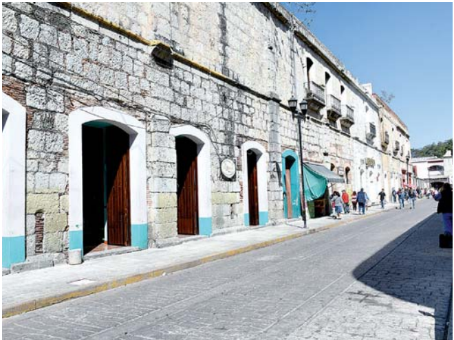
► Sigue vigente el programa Miércoles sin ambulantes.

Esta situación generó la suspensión de la sesión de cabildo, por lo que los concejales fueron citados nuevamente para este jueves 23 de enero a las 12 horas.