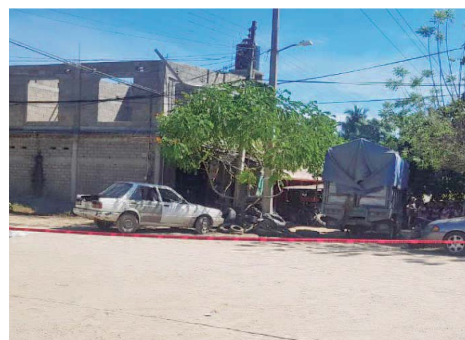
► Los sucesos sangrientos fueron en este lugar.