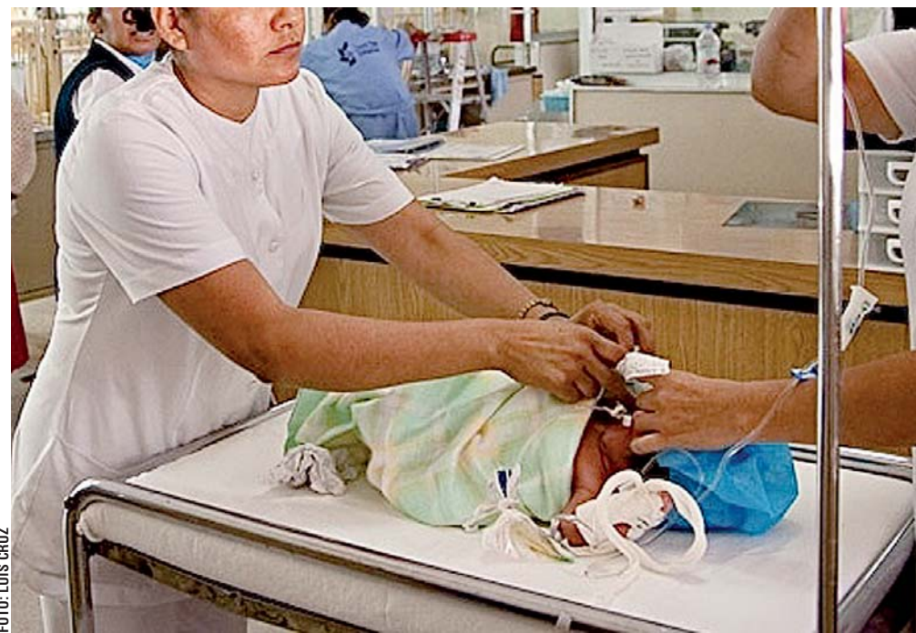
Según estudio del propio IMSS, la delegación de Oaxaca tiene el peor resultado en atención de bebés.

Con cifras de 2017, este estudio advirtió el año pasado, que las unidades médicas de Oaxaca ocuparon la segunda posición en mayor tasa de defunciones por infecciones respiratorias agudas, solo después de