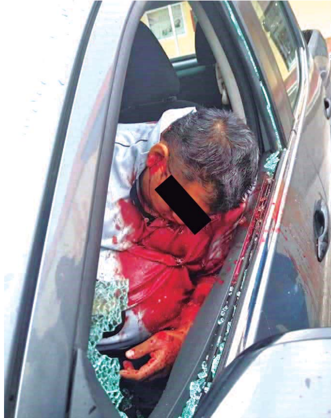
► La víctima quedó abatida al interior de su camioneta.

Tras el levantamiento de las evidencias, el agente del Ministerio Público ordenó