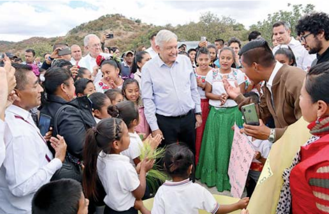
Inauguran camino: El Presidente cumplió en Yucuná su segundo día de gira por Oaxaca.