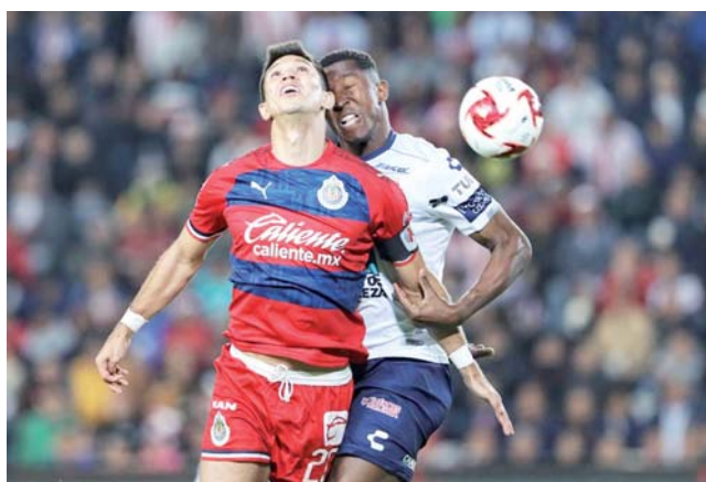
▶ La recta final se volvió un duelo de ida y vuelta.