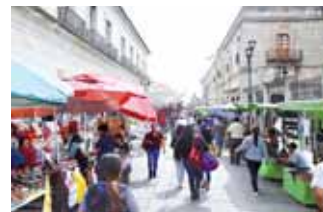
El ambulante es uno de los temas que debe ser atendido en la ciudad.

“Hay muchas cosas por hacer, el presidente tiene buenas intenciones, pero necesita colocar en cada ramo a gente conocedora