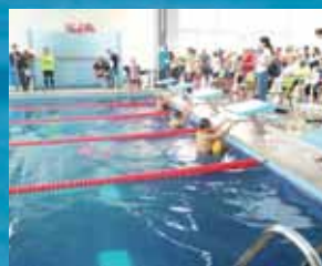
La justa se disputó en la alberca de CRAD con la participación de 50 nadadores.

Con esta competencia se cerró la temporada estatal de natación de curso corto en Oaxaca.