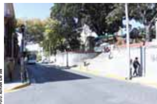
Calle de Independencia donde hoy se instalarán el resto de puestos.

“Dependiendo de la cantidad de peregrinos que acudan a la Basílica de la Soledad, se analizará si a partir de este lunes se restringe la circulación o se habilita un carril”, informó el subdirec-