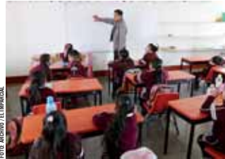
Ante la falta de evaluación en los estudiantes y docentes oaxaqueños, se desconoce el aprovechamiento escolar en el Estado.

“Con la resistencia (de la Sección 22 del SNTE) se han vuelto muy opacos para conocer el nivel de desempeño de los centros escolares,