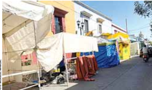
Se instalarán cerca de 800 puestos ambulantes para el Día de la Soledad.

Los comerciantes ofrecerán diversos productos de gastronomía típica oaxaqueña como tlayu-