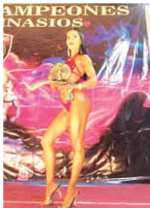
Lucieron sus esculturales figuras.

El triunfo sobre Al Sadq confirma su jerarquía como el equipo mexicano con más triunfos en la historia del torneo. 6C