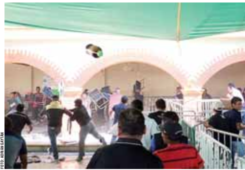
Grupos antagonísticos se dan con todo en San Agustín de las Juntas; vuelan sillas, piedras y envases. Reportan al menos 3 personas lesionadas.

“Hay antecedentes de que en la zona no quieren a la policía”, advierten los elementos comisionados en la región.