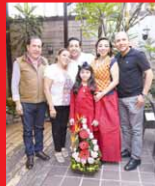
► La cumpleañera con su esposo, hijos, yerno y nieta.