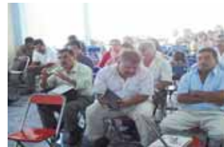
El arquitecto defraudó a la comunidad de San Juan Bautista Guelache, Etla.

gen de la Soledad. Una vez concluidas las festividades se prevé que los verbeneros se retiren hasta el próximo 20 de diciembre para despejar la vialidad, toda vez que inician las preparativos para la celebración de la Noche de Rabanos en el Zocalo de la capital.