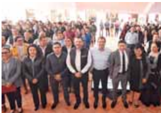
► El edil capitalino, Oswaldo García Jarquín encabeza el arranque de la Tercera Jornada de las Caravanas de los Derechos Humanos.

Acompañado del secretario de los Servicios de Salud de Oaxaca, Donato Casas Escamilla, y del defensor de los Derechos Humanos del Pueblo de Oaxaca, Bernardo Rodríguez Alamilla, el municipio de la capital puntualizó que esta iniciativa se lleva a cabo en estrecha colaboración con 16 dependencias gubernamentales, 2 de carácter federal, 7 estatales y 7 más de orden municipal y rinde frutos gracias a la suma de voluntades entre diversas instancias de gobierno.