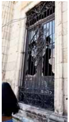
► Cristales rotos del edificio de la UABJO.

"Por tal motivo, aunque de manera tardía nos corresponde ahora a todos los oaxaqueños asumir la gran responsabilidad y capacidad profesional de cuidar, proteger y conservar en óptimas condiciones, la riqueza del legado histórico-cultural que por su valor universal forma parte del Patrimonio Cultural de Oaxaca, de México y por ende de la Humanidad", apuntó.