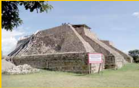
► En los proyectos de atención a los efectos de los sismos participan diferentes especialistas.

el funcionario, quien a esto añade que a 80 años de las primeras investigaciones se siguen desarrollando investigaciones y acciones para "difundir y preservar" tal patrimonio.