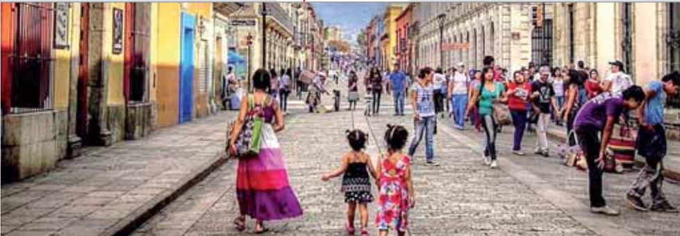
► El reconocimiento dado el 11 de diciembre de 1987 ha influido en la ciudad que ha sido turísticamente seguida y buscada.

enesena@imparcialenlinea.com / Teléfono 501 83 00 Ext. 3172