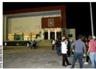
Los diputados locales de la 4T siguen sin ponerse de acuerdo y detienen el "reloj legislativo".

Para declarar un receso y detener el "reloj legislativo" a unas horas de vencerse el plazo para aprobar el Paquete Fiscal 2020, integrantes del Congreso local iniciaron anoche una sesión extraordinaria que apenas duró dos minutos. La falta de acuerdos entre diputadas y diputados obligó a abrir la sesión solo por unos minutos y cumplir con la ley, para después reanudar la sesión en próximos días, sin definir ni la fecha y hora. Los y las legisladoras detuvieron el "reloj parlamentario" para aclarar dudas en el paquete fiscal y "dar transparencia a la ciudadanía".