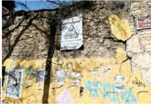
► Paredes y casas en mal estado abundan en el Centro Histórico de Oaxaca.

La Zona Arqueológica de Monte Albán, una de las más visitadas en el estado de Oaxaca, presenta serios deterioros en cada una de sus áreas desde los edificios que albergan las áreas administrativas