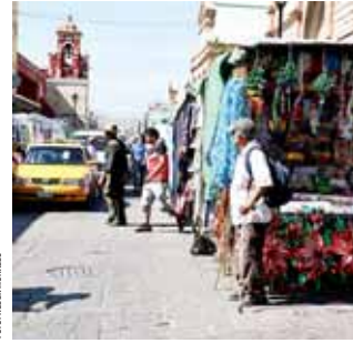
► Una de las alternativas es generar proyectos para que la vía pública se vuelva equitativa.