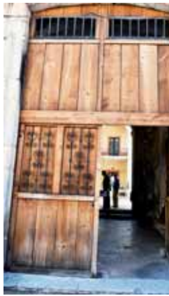
► Continúa dañada la puerta que fue quemada de la UABJO.