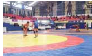
► El evento sirvió de preparación para futuras justas nacionales.