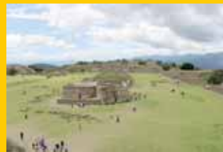
► Se ha garantizado la preservación del patrimonio arqueológico.

La finalidad de estas adecuaciones es que se regulen las actividades sociales y turísticas para que no impacten en la conservación