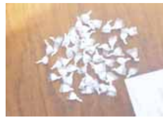
► La droga y las personas fueron puestas a disposición de las autoridades correspondientes.

Los uniformados les solicitaron realizarles una revisión de rutina, los sospechosos accedieron y les encontraron en su poder