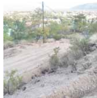
► Los vecinos creen que se pretende construir un complejo habitacional en la parte alta de la colonia.

"Parece que pretenden construir un complejo habitacional en la parte alta de la colonia, esto no es posible porque además de invadir una zona protegida también afectaría el funcionamiento de los servicios básicos como agua y drenaje porque se ubica en la parte más alta de la ciudad", mencionó Nazario García Ramírez.