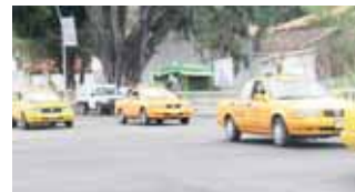
► Los ruletero exigieron a las autoridades mayor seguridad para realizar sus actividades.

En el lugar, los efectivos hallaron un cuchillo con manchas de sangre, con el que presumiblemente se cometió el