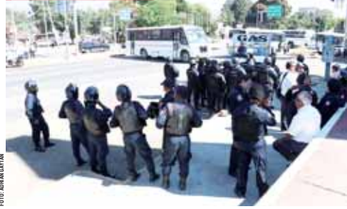
Habitantes de San Sebastián Tutla bloquean por más de 8 horas el cruce del Monumento a Juárez.

9:00 horas, dado que al ser la vía más importante para entrar a la ciudad y llegar a Ciudad Administrativa, su cierre colapsó el tránsito.