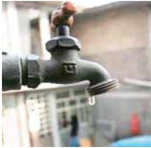
► El abasto de agua incluso ha tardado un mes en algunas zonas.