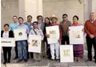
► El maestro Toledo impulsó la creación literaria en lenguas indígenas.

enesena@imparcialenlinea.com / Teléfono 501 83 00 Ext. 3172