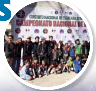
► Cosecharon cinco medallas en el nacional: dos oros, una plata y dos bronce.

El cierre del Circuito Nacional de Escalada 2019-2020, tuvo como sede el muro de la Confederación Deportiva Mexicana (CODEME) en la CDMX y fue avalada por Federación Mexicana de Escalada (FEMED).