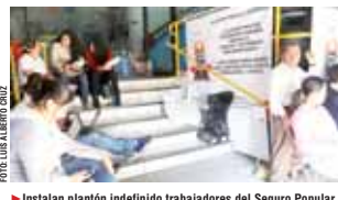
Instalan plantón indefinido trabajadores del Seguro Popular.

"No sabemos cual será la situación laboral de nuestros compañeros; no sabemos si se les dará continuidad o habrá despidos", expuso el entrevistado, luego de afirmar que los agre-