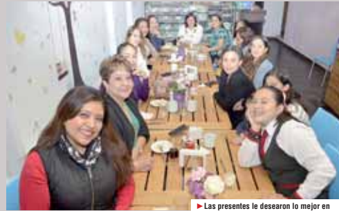
► Las presentes le desearon lo mejor en su nuevo año de vida.