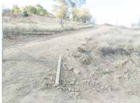
► Un particular se presentó para reclamar una fracción de los predios.