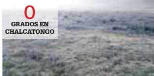
Los campos de cultivo se pintan de blanco en la Mixteca.