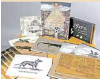
► También apoyó la elaboración de materiales didácticos en lenguas.

«Diseño como un programa en el que seríamos "especialistas académicos y comunitarios", el coloquio busca que los "avances y proyectos sobre las lenguas otomangues y otras lenguas que se hablan en regiones colindantes" sean abordados en este periodo. Para ello, los organizadores han lanzado una convocatoria que se puede consultar en http://bibliotecajuandecordova.mx/colov/ .