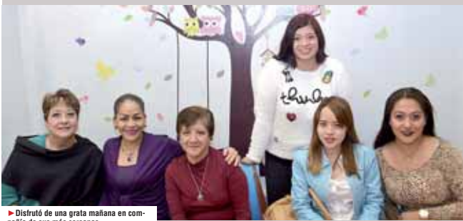
► Disfrutó de una grata mañana en compañía de sus más cercanas.