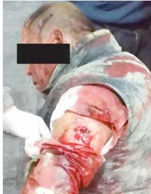
► El taxista fue lesionado salvajemente con arma blanca y despojado de dinero en efectivo, objetos personales y de la unidad que conducía, dejándolo abandonado y malherido.