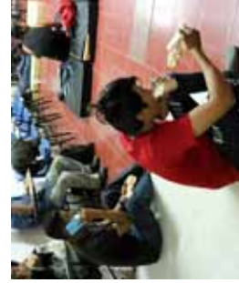
En Oaxaca los apoyaron con un albergue luego del percance.