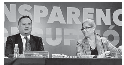
► El titular de la UIF, Santiago Nieto, durante el Foro “Más Transparencia, igual a menos corrupción”.

Con respecto al tema de la negativa de la Cámara de Diputados a la posibilidad de decretar la extinción de