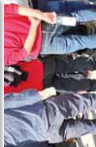
Impacientes, los jornaleros buscan explicaciones.