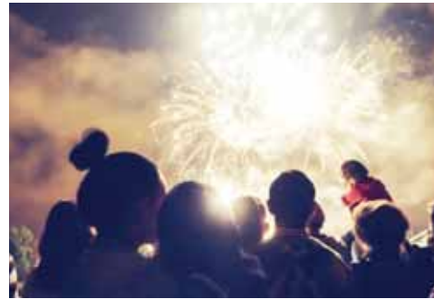
► Piden no quemarlos en las calles o plaza pública municipal, por ser presuntamente de alto riesgo.