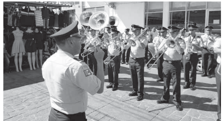
► La banda tocó temas conocidos durante una hora.

“Aquí estuvimos hace dos años también, aquí anduvimos llevando la música a los diferentes lugares en donde estuvieron muy afectados por los sismos y desde entonces estamos nosotros ora si unidos a toda la región que sufrió mucha afectación y nosotros nos unimos, estamos con el pueblo, estamos con la gente”, apuntó.