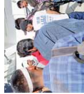
Solo buscaban regresar a casa.