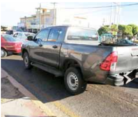
► Severos daños materiales.

De estos hechos tomaron conocimiento elementos de vialidad estatal, y será la autoridad competente la encargada de deslindar responsabilidades de este accidente que a pesar de lo aparatoso no se reportaron personas lesionadas.