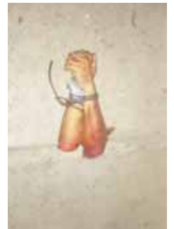
► En el lugar también se halló una cartulina con un narcomensaje en donde se presume que hay una lista de nombres de quienes aseguran tomaran venganza.