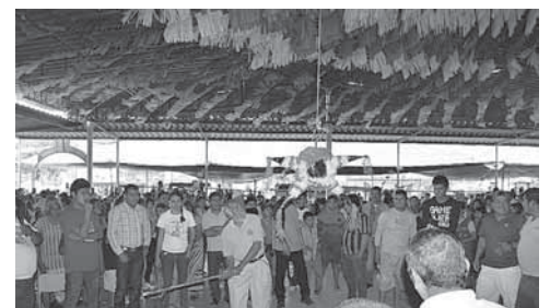
► Se esperan grandes sorpresas.

mativo que para los niños habrá dulces, piñatas y un obsequio especial con motivo de las fiestas navideñas; para las personas que se inscribieron en el programa cobijando corazones, recibirán una cobija para cubrirse de esta temporada invernal, para los papás, un regalo especial por asistir a este tradicional evento navideño.