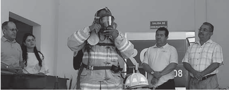
► Los equipos son de última generación.