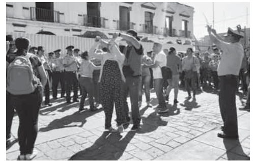
► El público disfrutó y bailó.

“Son 12 regiones militares distribuidas en todo el país y todas tienen una ban-