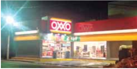
► Los asaltos van en aumento.