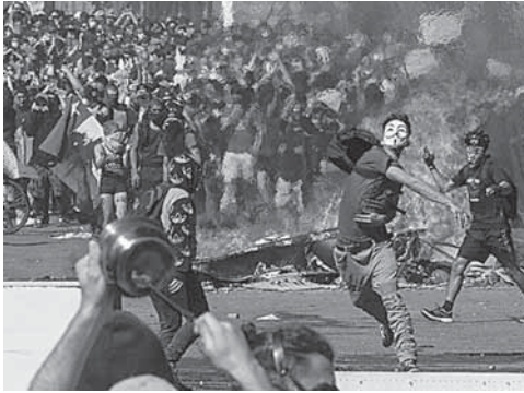
► Protesta en la Plaza Italia en Santiago.