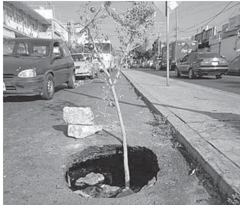
► El hoyo mayor se ubica en la Avenida Manuel Ávila Camacho, en pleno centro de la Ciudad.

En el caso específico del hoyanco la calle Manuel Ávila Camacho en el centro de la Ciudad, los vecinos habían colocado una rama, la cual fue adornada con serpentinas, globos y demás, como un árbol de navidad, esto a manera de burla para ver si las autoridades lo tapaban,