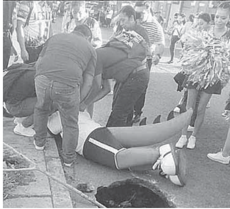
► Una mascota de la escuela terminó en el piso luego de que cayera en tremendo hoyanco.