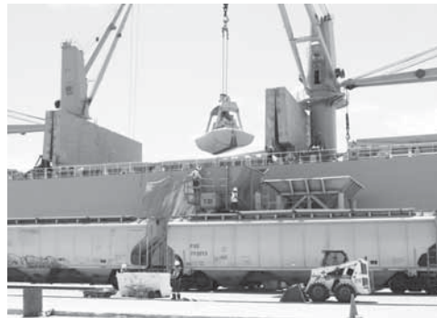
► Serán 42 proyectos para esta región del sur-sureste.

En ese sentido, explicó que dentro del Plan están incluidos los estados de Quintana Roo, Yucatán, Campeche, Tabasco, Veracruz, Chiapas, Gue-