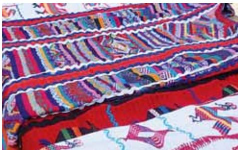
► También se clausuró un curso.