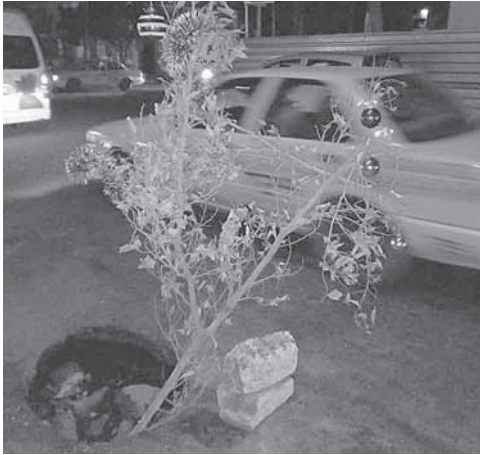
► Por las noches se corre el mayor riesgo.