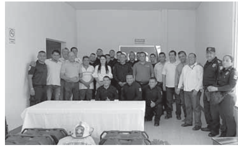
► La corporación otorga el servicio de auxilio a la población en prácticamente todo el Istmo.

trol de cómo está trabajando el cilindro, micrófono de comunicación de bombero a bombero en el área de trabajo, así como con la víctima o con personas a su alrededor.