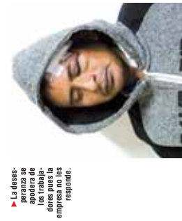
La desesperanza se apodera de los jornaleros pues la empresa no les da respuesta.