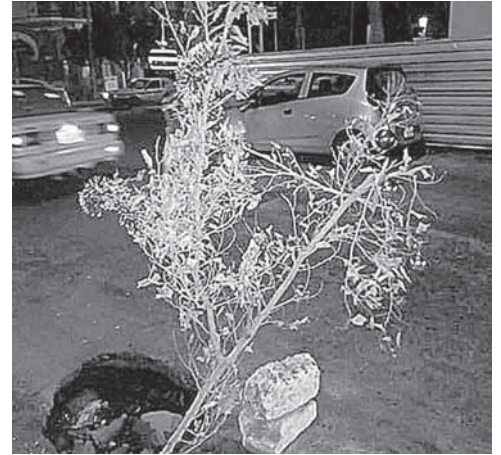
► Los vecinos adornaron el bache.

Un camión urbano y la mascota de una escuela durante un desfile han caído en el tremendo hoyanco de la Avenida Manuel Ávila Camacho en pleno centro de la Ciudad