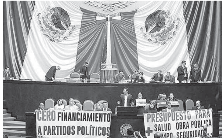
► Diputados del PES plantearon eliminar el financiamiento total a partidos, lo cual no prosperó.

sidenta de la mesa directiva, Dulce María Sauri (PRI), sostuvo que la reforma pretendía un sistema de partido debilitado, desdibujado, mucho más cercano a un movimiento que a un partido político. ¿Les suena?