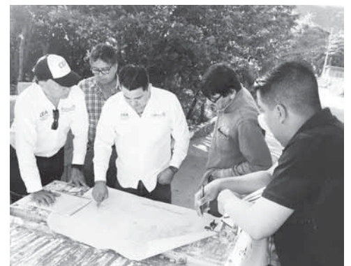
► La CEA y el SAP analizan mediante planos la zona de influencia distribución de agua

"Estamos buscando mediante el gobierno del estado y nuestro director modernizar las redes que suministran de agua, pero también de prevenir que en un futuro haya escasez de líquido", añadió.