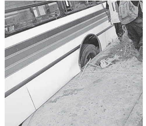
► Un camión urbano se quedó atorado.

Este tipo de baches también se pueden observar