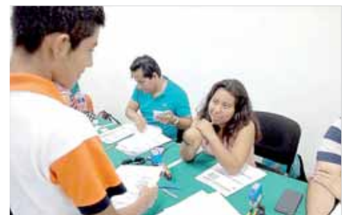
► Los programas federales Bienestar son un respaldo económico para alumnos y padres de familia.

El Colorado, El Vigía, entre otras localidades, "tenemos infraestructura para atender a la actual matrícula, cada Expo Orienta ofertamos ante escuelas secundarias el bachillerato bivalente, nuestro subsistema tiene excelente calidad académica y administrativa que se refleja en alumnos que se gradúan como Técnicos profesiona-