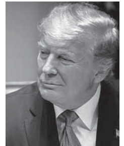
► Donald Trump en el ojo del huracán.

cabo un juicio para decidir si el presidente Trump debe ser destituido de su cargo.