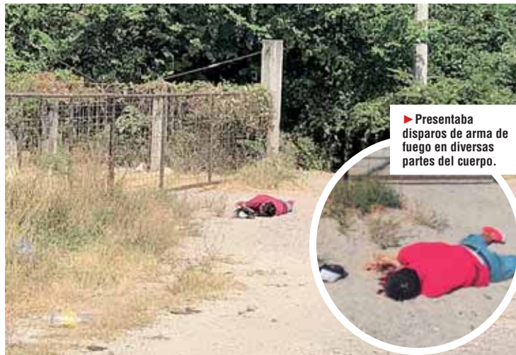
► Automovilistas que transitaban por el lugar dieron aviso.

El área fue acordonada y la circulación se vio