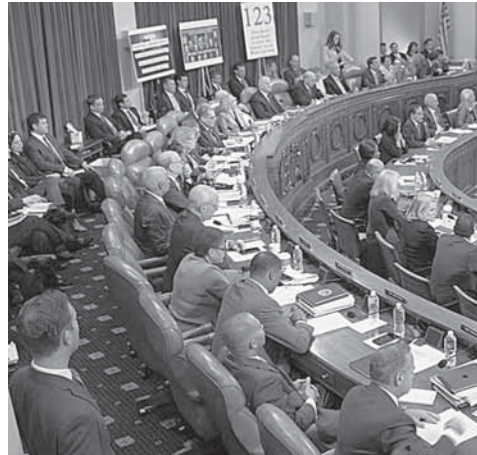
► Los dos cargos resultaron con 23 a favor y 17 en contra.

Como fueron aprobados los cargos, los enviarán a la Cámara de Representantes para una votación la próxima semana que podrían convertir a Trump en el tercer presidente en la historia