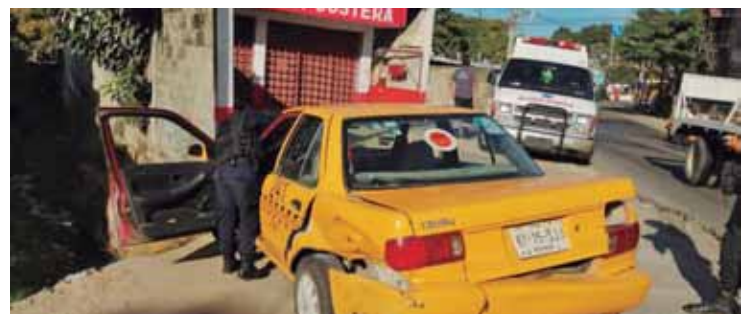
► Tras el impacto, las unidades quedaron con daños en su carrocería.

Asimismo paramédicos de la Comisión Nacional de Emergencias (CNE) se apersonaron en el lugar donde solo valoraron a los conductores, quienes afortunadamente no sufrieron lesiones, por lo que será la autoridad correspondiente quien se encargue de deslindar responsabilidades de este choque que dejó daños cuyo valor se desconoce.