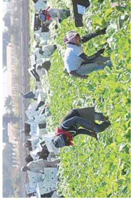
Asociaciones Civiles han buscado mejorar las condiciones laborales de los jornaleros pero las empresas no ceden.

Más de 40 jornaleros oaxaqueños, en su mayoría hombres, regresan a comunidades per-