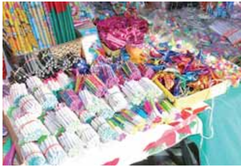
► Autoridades y Ejército Mexicano han estado decomisando artefactos explosivos.

Los ciudadanos exponen que se atenta contra la tradición, sobre todo en las mayordomías