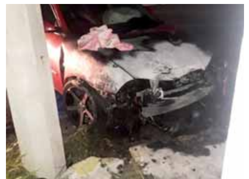
► El fuego fue sofocado por bomberos de esta ciudad y puerto.

Al revisar la unidad se percataron que se encontraba vacía, por lo que hace suponer que su o sus ocupantes salieron ilesos dejando abandonada la unidad de motor.