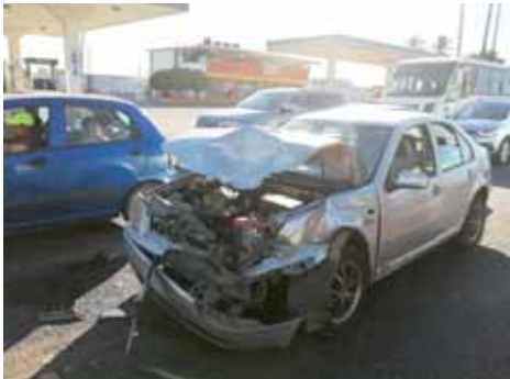
► Pese a lo aparatoso no se reportaron personas lesionadas.