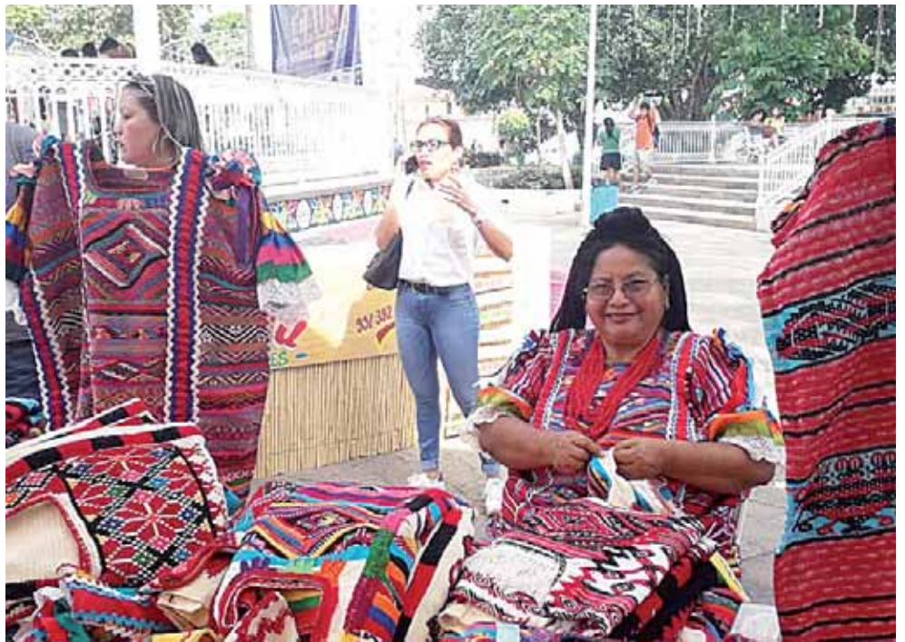
► Parte del trabajo realizado por 45 mujeres.

Durante la inauguración de esta segunda feria de la inclusión, la titular de la SEDESOH, estuvo acompañada de varias personalidades entre ellas funcionarios de gobierno estatal y local, así como concejales, funcionarios municipales y los comerciantes que están dando vida a esta feria, algunos vinieron de San Felipe Usila, y de la comunidad de Díaz Ordaz, de los valles centrales de Oaxaca, entre otros.