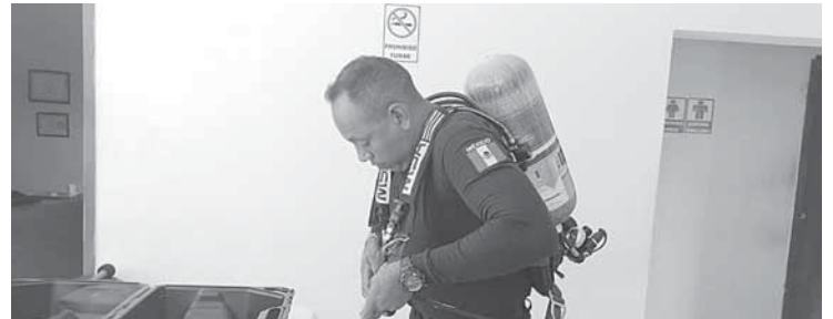
► El cilindro permite trabajar 60 minutos.

El costo de los equipos fue de más de 200 mil pesos que fueron entregados por la AMDEE y el Fondo Oaxaca