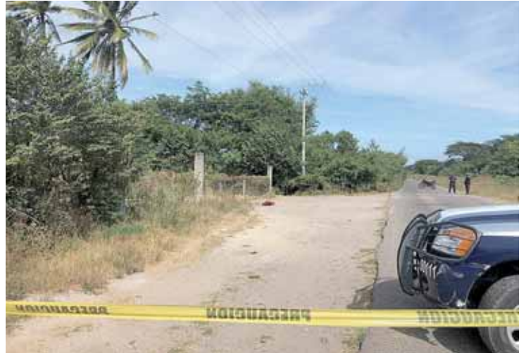
► La policía acordó el área.

El cuerpo de un hombre fue localizado sobre el tramo de Juchitán a Asunción Ixtaltepec, vía al canal 33