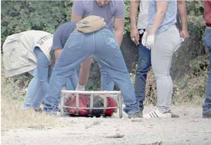
► El cuerpo se encuentra en calidad de desconocido.