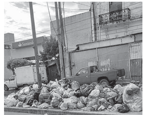
► Buscan evitar un foco de infección.

Asimismo, destacó que hace falta mucha cultura en el tema de la basura en el sentido en que hay personas que aun cuando ya paso el camión recolector optan por sacar sus desechos a las calles sin saber el daño que provocan y la contaminación que generan.