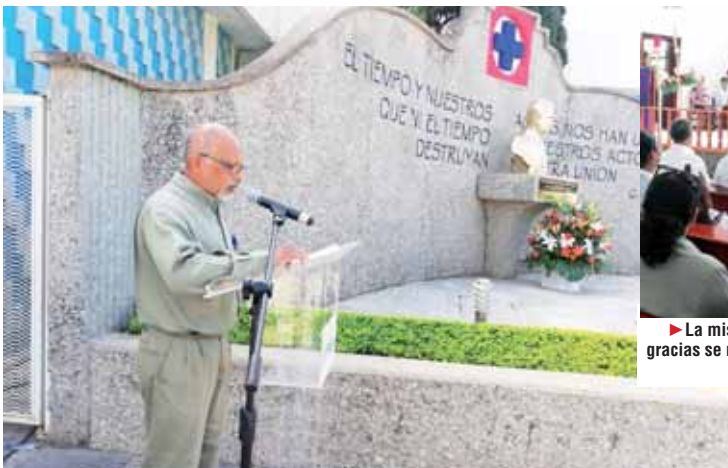
► Orador del 66 aniversario.

que continúa hasta nuestros días con los cambios estructurales que desde sus inicios los socios y trabajadores de la empresa Cruz Azul, S.C.L., y hoy en Cruz Hidalgo se tiene el horno número 10 y en Lagunas, Oaxaca el horno número 5, que vienen a mejorar la estructura de producción para estar a la vanguardia industrial.