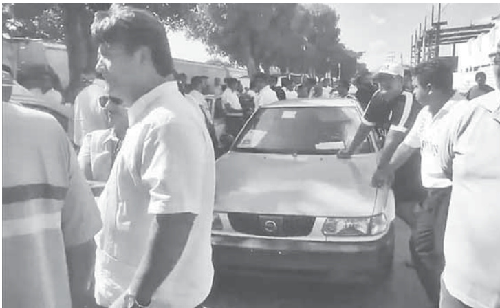
► Marcharon por las principales calles de la ciudad, obstruyendo la circulación vehicular.

lar sobre la avenida Ferrocarril, ya que dejaron estacionadas sus unidades frente a su sitio.