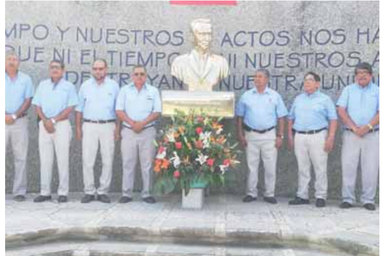
► Socios jubilados montaron guardia de honor.