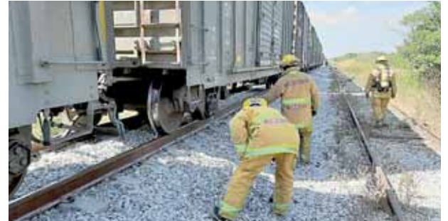
► El incidente no puso en riesgo a la población.