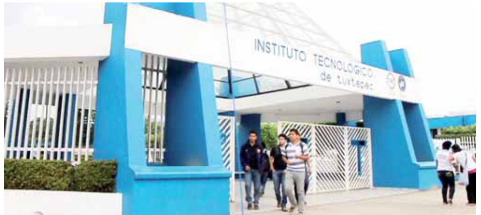
► Estudiantes piden la intervención de las autoridades correspondientes.

Ante esta problemática los estudiantes del Tecnológico de Tuxtepec hacen un llamado a las autoridades educativas de índole federal, para que intervengan y analicen la situación; explicaron que para corroborar lo dicho, realicen un sondeo entre los estudiantes para que puedan recibir las quejas de manera directa y anónimas para que no tengan problemas de represalias sobre el actuar de este catedrático que aseguran es protegido del director.