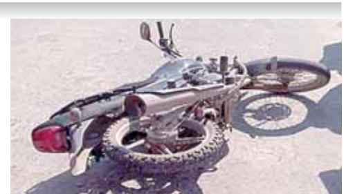
► La moto involucrada.

Personal de la Policía Municipal llegó al lugar e invitaron a las partes involucradas a llegar a un arreglo por los daños y lesiones ocasionados en este accidente.