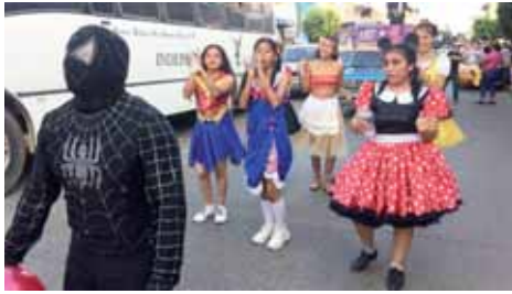
► Alegría y diversión durante el recorrido.