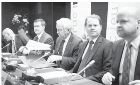
► El Comité Ejecutivo decidió sancionar a Rusia.

Sin duda lo harán la Agencia Rusa Antidopaje (Rusada), por su acrónimo en ruso) o el Comité Olímpico de Rusia, incluso federaciones por separado, pero pocos rusos creen que se pueda anular la decisión de