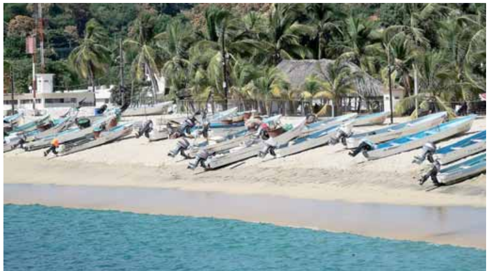
► Cooperativas pesqueras piden atención integral e inserción en programas de los gobiernos federal y estatal.

tos, requerimos más atención del gobierno, no es posible que los permisos de pesca lleguen de forma tardía, cuando ya está la veda, hay mucho burocratismo que afecta al sector”, puntualizó.