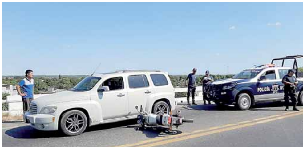
► Sobre el tramo carretero Tehuantepec - Salina Cruz.