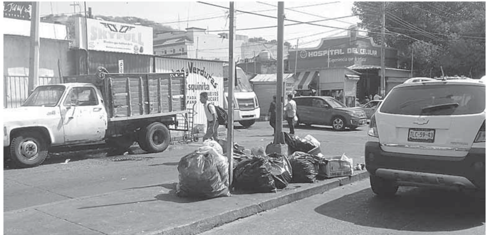
► A diario se generan grandes cantidades de basura.

Aseguran que el camión recolector no transita o cumple con su ruta