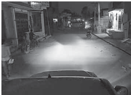
► La ciudadanía ha denunciado esta situación.

En algunas colonias y sectores, los vecinos se organizaron para iluminar sus calles ante la serie de asaltos que se han presentado y el riesgo que corren constantemente.