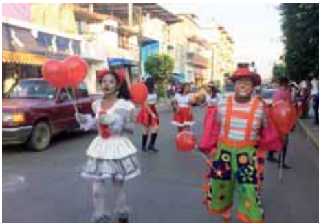
► Los payasos regalaron dulces.

La población respondió con infinidad de aplausos.