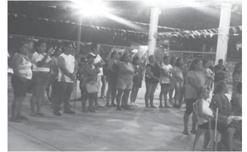
► La comunidad determinó la construcción de una obra.

SEMOVI, de los dirigentes de los transportistas de la ciudad y del gobierno del estado, los trabajadores del volante, retornaron a su sitio reiniciando labores.