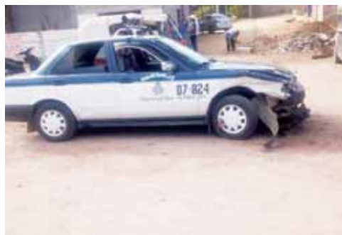
► Solo daños materiales.