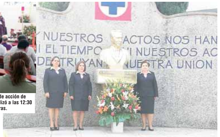
► Damas voluntarias de la fundación Cruz Azul.