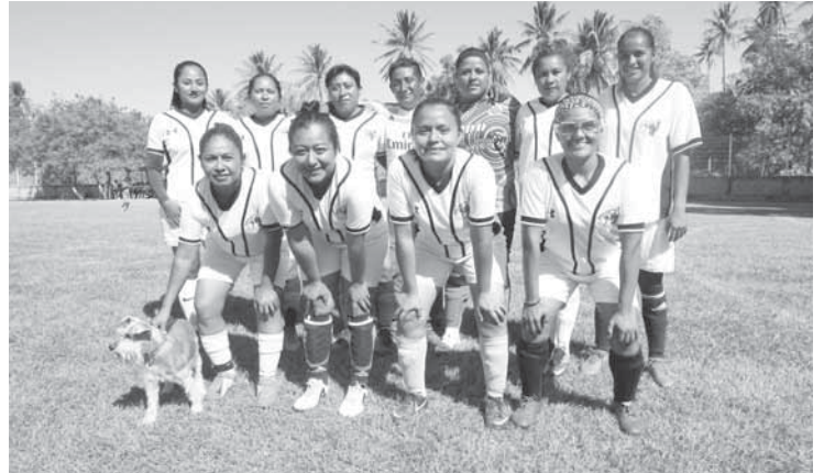
► Chacaleras Sub campeonas.

El encuentro se realizó en el deportivo Luis Donald Colosio