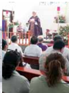
► La misa de acción de gracias se realizó a las 12:30 horas.