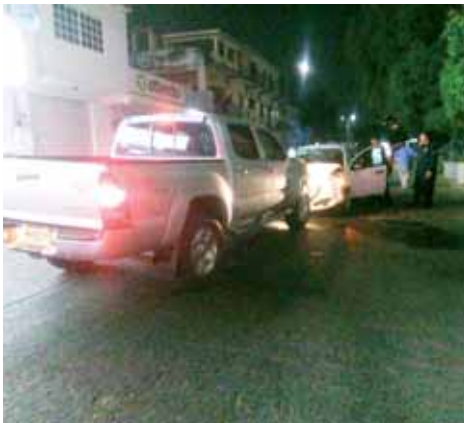
► Cuantiosos daños materiales.

Los vehículos involucrados son camioneta Toyota modelo tacaoma en color gris con placas de circulación RW-59-234 del estado, y el automóvil Aveo en color blanco sin placas de circulación.