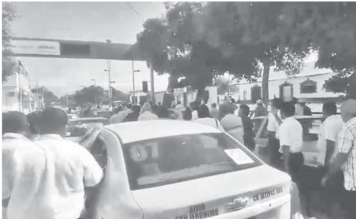
► El grupo inconforme asegura que no fueron invitados a la reunión.

Los trabajadores del volante realizaron una marcha por las principales calles de la ciudad, obstruyendo la circulación vehicu-