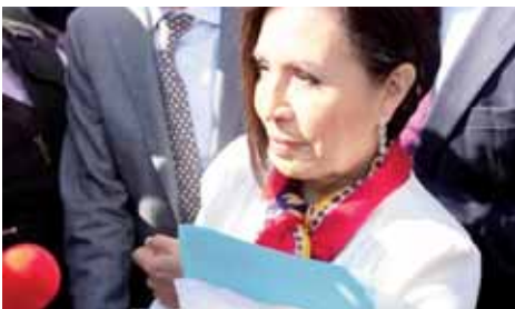
► La información será utilizada en el proceso de juicio político de Robles.

Una vez que Aureoles responda si ratifica o no la denuncia, comenzará a correr el periodo de instrucción para el desahogo de pruebas, que a su vez será de 30 días naturales.