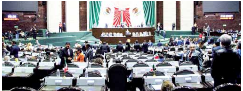
► Sesión plenaria en la Cámara de Diputados este martes 10 de diciembre