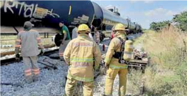
► Bomberos de Salina Cruz arribaron al lugar.