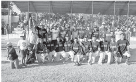
► Los ganadores se impusieron con pizarra de 8 carreras a 7.

N ILTEPEC, OAX.- Al llegar empatada a 3 juegos por bando la serie final en los play off de la Liga Regional de Beisbol Instruccional del Istmo, tuvo que definirse en el campo 14 de Abril con el 7° y definitivo juego entre Guerreros de Tehuantepec y Red Sox de Nilttepec imponiéndose estos últimos con pizarra de 8 carreras a 7 y se quedaron con el título en casa.