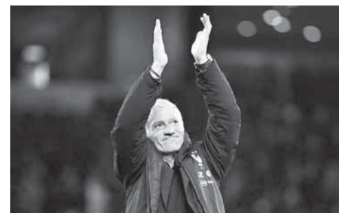
► Deschamps buscará junto con los Bleus defender su corona.

Los Bleus obtuvieron su boleto para la cita continental (12 junio-12 julio) en noviembre y ya saben que en la fase de grupos se medirán a Alemania, campeona del mundo en 2014, y a Portugal, vigente campeón de Europa. La identidad del cuarto participante de esta llave no se conoce todavía.