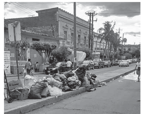
► Los desechos son amontonados en las calles principales.