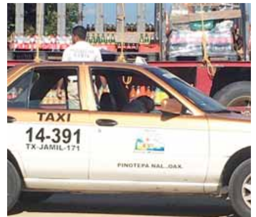
► Los hechos se registraron alrededor de las 13:15 horas del martes.