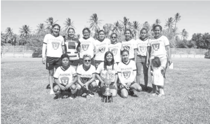
► Las campeonas se tomaron la foto del recuerdo.