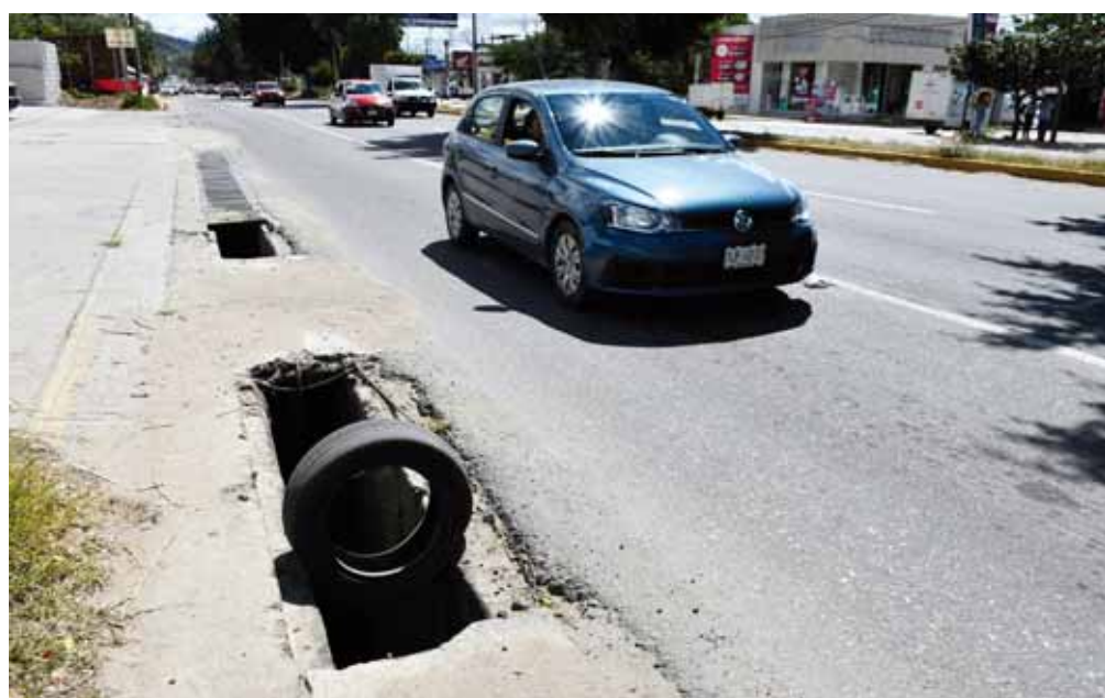
► Representan un riesgo latente para peatones y automovilistas.

“Nadie le ha dado una solución de fondo a esta problemática; antes los que reparaban eran los de la SCT y últimamente han venido los del gobierno del estado, pero solamente arreglan un poco donde pasan los carros y no atienden en toda esta zona afectada”