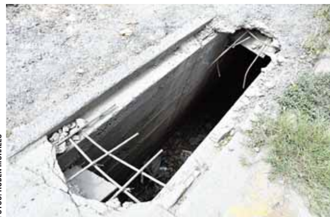
► Ninguna autoridad o dependencia ha atendido el problema.