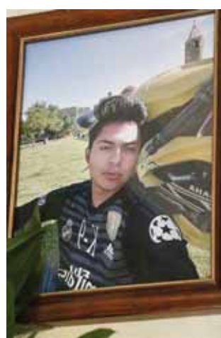
► Así lucía la víctima en vida.

“El policía no va ni bien amaestrado ni bien armado, ni con los elementos suficientes para hacer un enfrentamiento a 40 o 50 personas, es lo más triste que manden a una o dos patrullas con 5