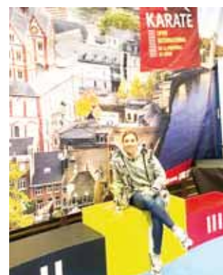
Caballero Santiago sigue buscando su clasificación a Tokyo 2020.

La meta de la karateca istmeña es seguir parti-