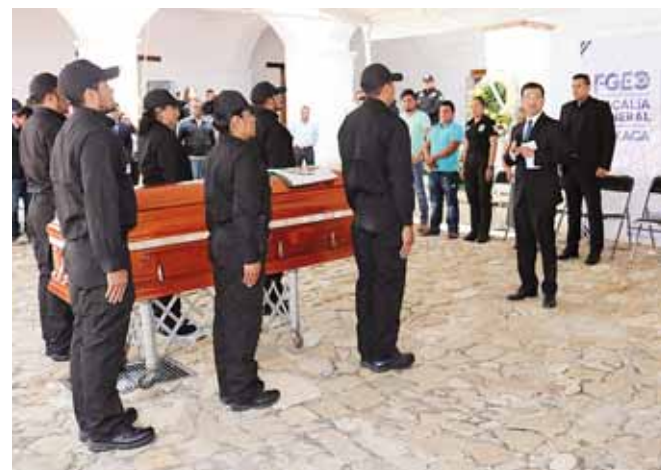
► Los avances de las investigaciones en torno al asesinato del AEI van a cuenta gotas.

Más tarde, al arribaron paramédicos de Atarriación Civil de Etlá, quienes al confirmar la muerte de la víctima, a quien reconocieron