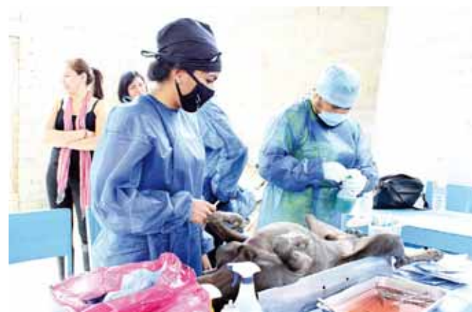
► La campaña de esterilización de mascotas está vigente en la capital.

Los interesados en que las Jornadas de Esterilización vaya a sus colonias, pueden ponerse en contacto a través del teléfono (951) 516 83 65, en la extensión 104, o en las oficinas de la Subdirección