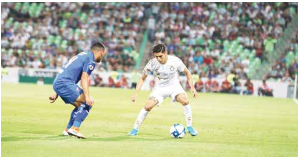
Cruz Azul se despidió del Apertura 2019 al caer ante Santos.

recibe un día antes a Atlético de San Luis, luego del parón de la Liga por fecha FIFA.