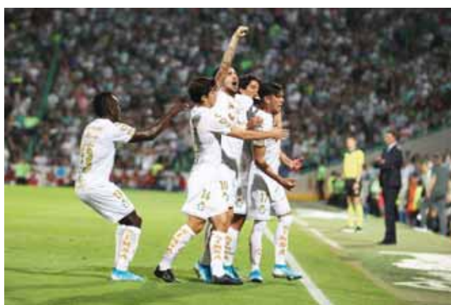
Los Guerreros llegaron a 36 puntos que los dejan en la cima.

Cruz Azul cumplirá este 7 de diciembre 22 años sin