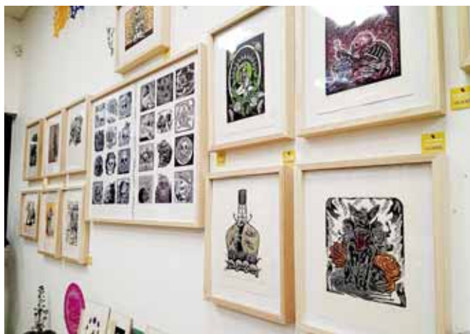
► La exposición de gráficas retoma a la figura del perro xoloitzcuintle y su relación con la muerte.

de Guanajuato. La temática de las piezas retoma la importancia del perro xoloitzcuintle, una especie mexicana en la que se cree que es un tipo de mediador o guía de