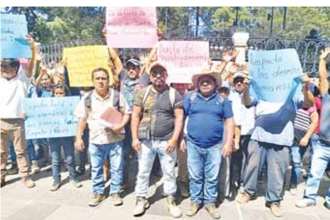
► Los comuneros se manifestaron en el Zócalo de la ciudad.