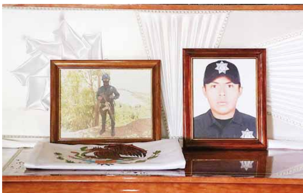
► El joven policía contaba con 22 años de edad y deja en la orfandad a dos niños.