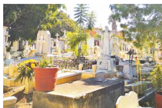
► Este primer lunes será en el camposanto del Barrio del Ex Marquesado.

Así también se realizaron actividades de control larvario como es la descacharrización, así como la eliminación de botes de lata que son utilizados como floreros.