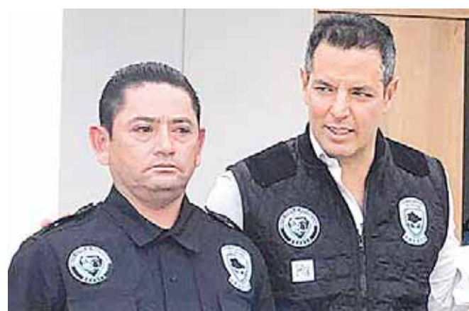
► Apenas había recibido un reconocimiento de parte del gobernador.

Sujetos a bordo de una motocicleta interceptaron al agente y dispararon contra él en repetidas ocasiones, arrebatándole la vida al instante