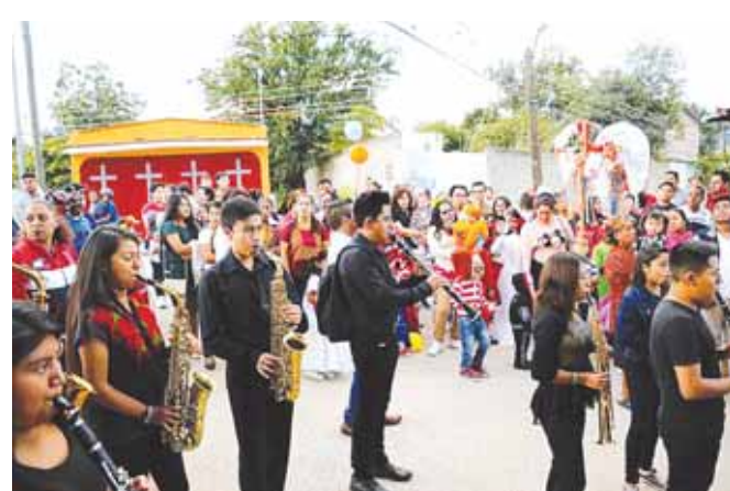
► Se reportó una afluencia de más de 25 mil personas.

SANTA CRUZ Xoxocotlán.- Con la afluencia de más de 25 mil visitantes locales, nacionales y extranjeros se realizó con éxito el programa de actividades "Fieles Difun-