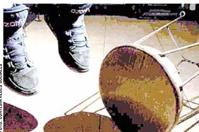
► Uno de los suicidios fue en Jalapa del Valle, perteneciente a San Felipe Tejalapa, Etlá.

construida de lámina. Ante ello, dieron parte a las autoridades municipales de Cuilápam, quienes al confirmar los hechos solicitaron