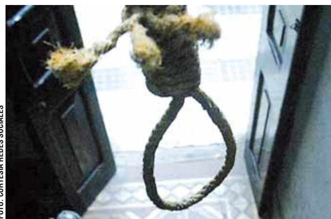
► El método más utilizado para terminar con la vida es el ahorcamiento.

el apoyo de Ministerio Público del Sector Metropolitano, por lo que hasta el lugar se trasladaron los agentes del