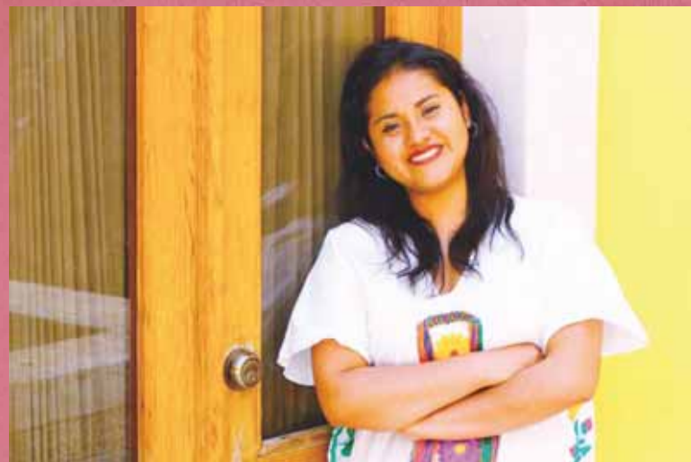
► Como escritora ha reflexionado y dicho que en México no se escribe literatura únicamente en castellano, sino en otros idiomas.