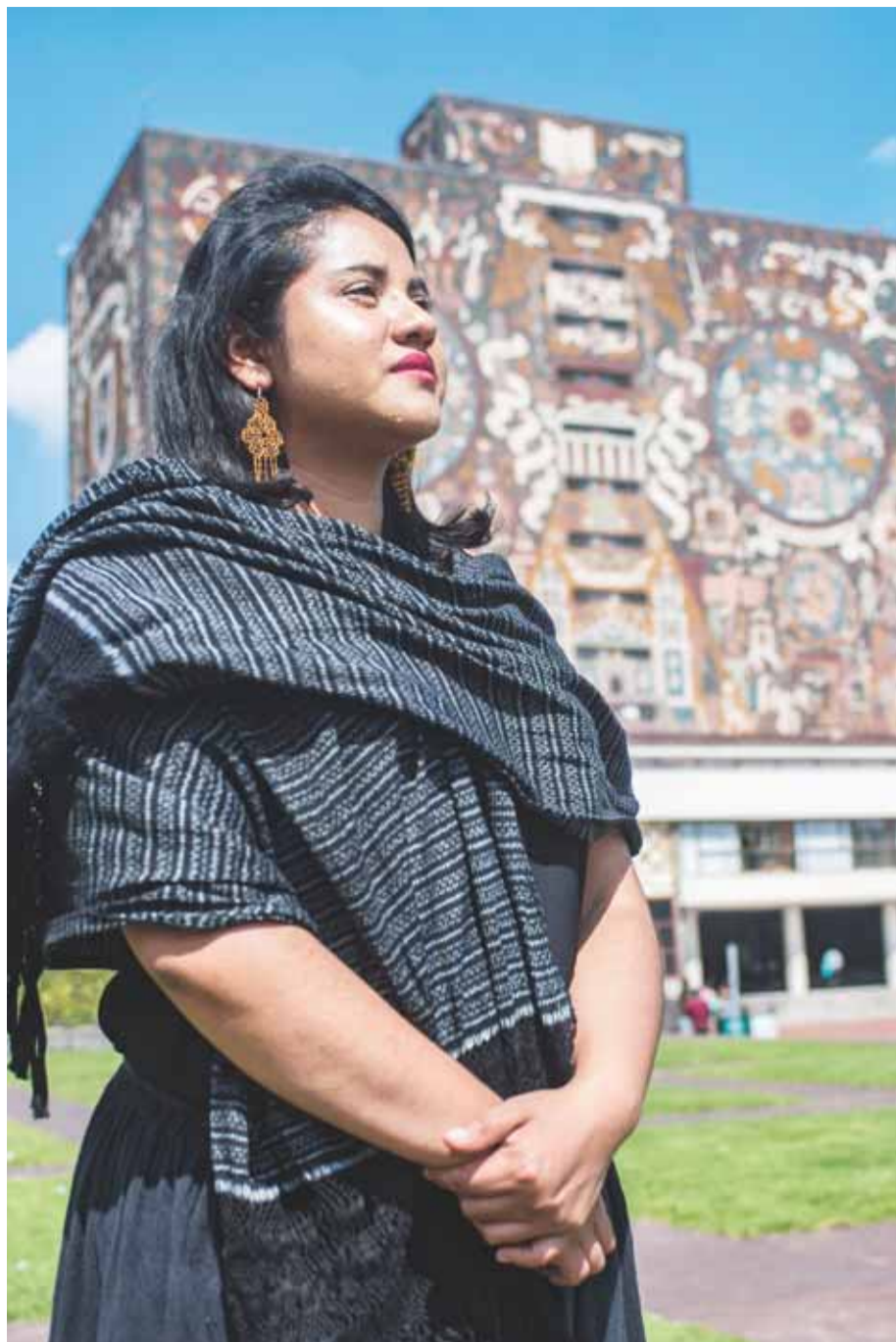
► Estudió la licenciatura en Pedagogía en la Facultad de Filosofía y Letras de la Universidad Nacional Autónoma de México.

—Sí me preguntaras si me considero feminista o no, yo te diría que no porque creo que hay muchos