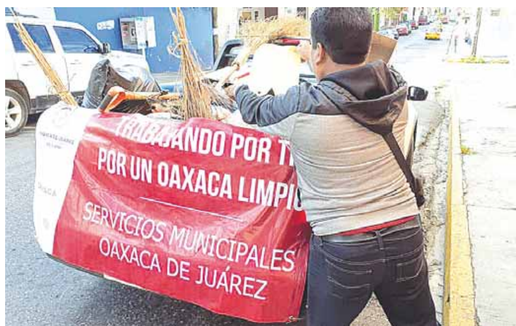
► En el primer cuadro de la ciudad, la recolección de desechos pasó de 40 a 80 toneladas.