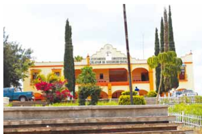
► Otro de los hechos ocurrió en Cuilápam de Guerrero.

De acuerdo a la familia del occiso, al regresar a su