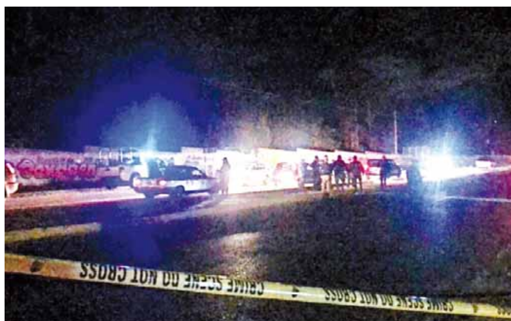
► El área del crimen fue acordonada.

gaba varios crímenes en la región, así como el robo de tráileres con mercancía en la zona, por los cuales se presume fue asesinado, sin embargo, sus compañeros no descartan ninguna línea de investigación.