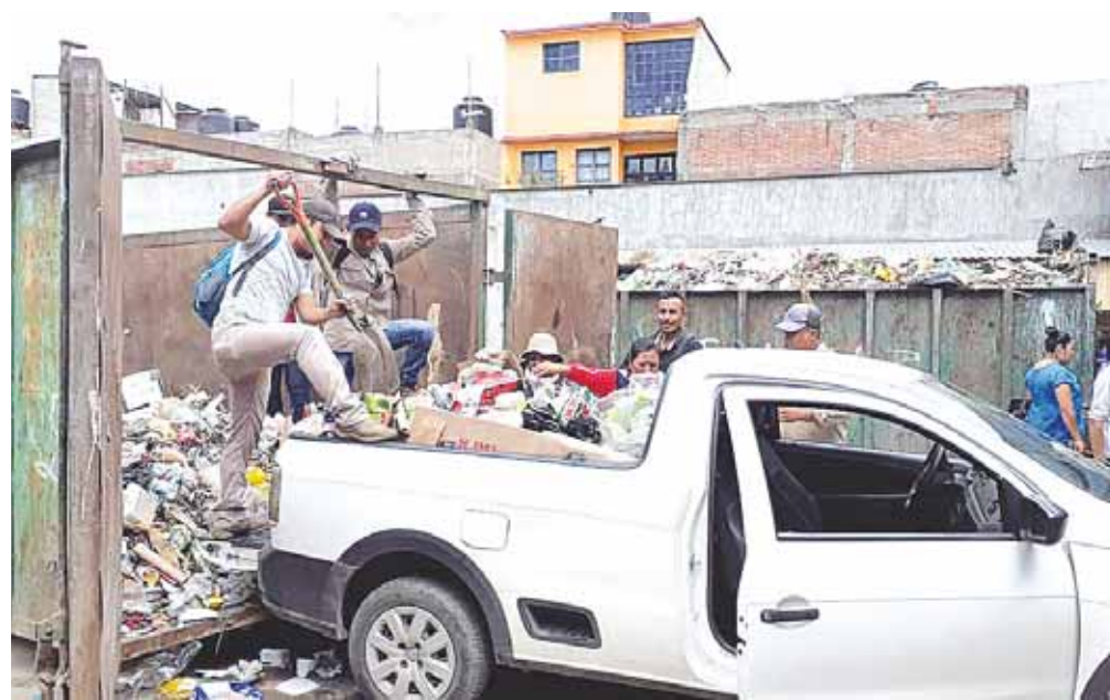
► Se recolectaron de manera adicional más de 100 toneladas de basura en la ciudad.

En el primer cuadro de la ciudad, la recolección de desechos pasó de 40 a 80 toneladas diariamente durante estos tres días de puente, por lo que fue necesaria la implementación de un operativo especial para mantener limpias las principales calles y avenidas.