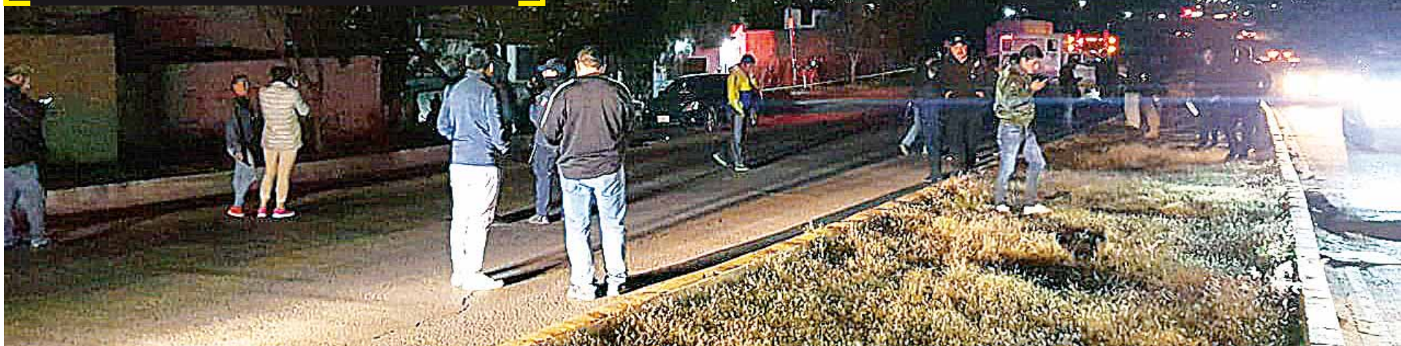
► Diferentes elementos policiacos arribaron al lugar.

de noviembre de 2018 había asumido la Comandancia Regional de la AEI