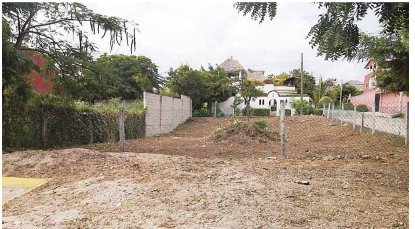
► La invasión de terrenos para luego falsificar los documentos de propiedad para su posterior venta, es parte de un entramado en el que están inmiscuidos varios niveles del gobierno.