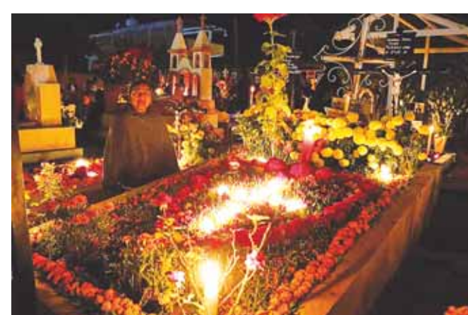
► La festividad concluyó con saldo blanco.

festividad concluyó con saldo blanco; miles de visitantes fueron testigos de la cultura y tradiciones de la pobla-