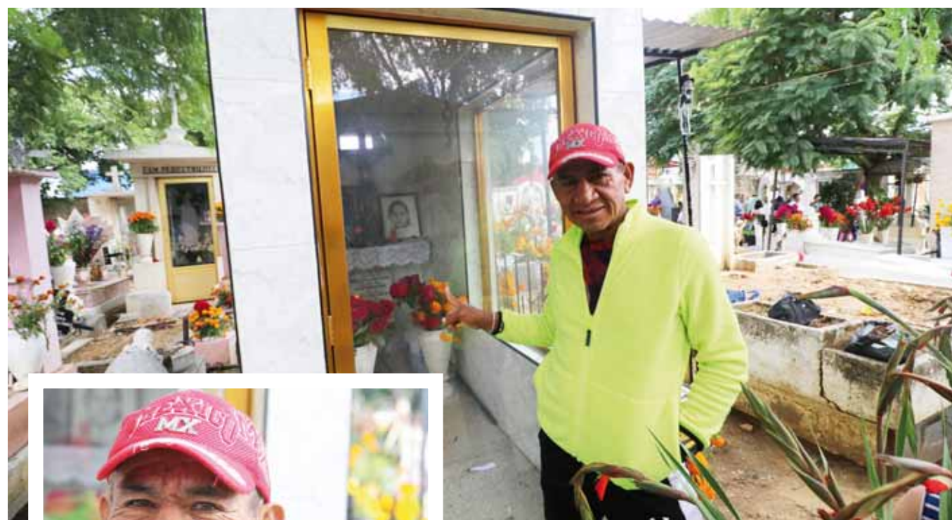
► Aún adolorido mostró su mejor sonrisa.

noció que el esfuerzo provocó que se le bajara la presión y en 3 ocasiones estuvo a punto de abandonar. “afortunadamente, un español se comunicó con quienes me apo-