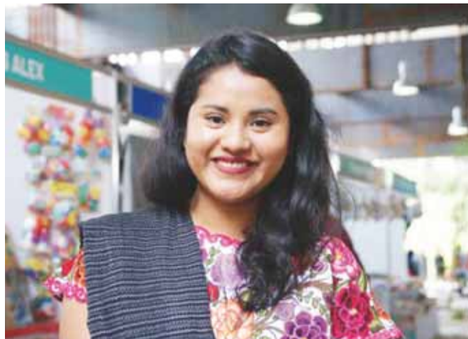
► La joven oaxaqueña ha sido invitada a varias ferias de libro.

feminismos, no sólo uno, y hay unos que todavía están en construcción y quién sabe cómo los vamos a nombrar en un futuro. Todavía los estamos pensando, dialogando, y yo parto de una idea que, a pesar de lo que se cree, en muchos de nuestros pueblos, desde hace muchos años, antes de que fuera tan viral la palabra feminismo, estamos construyendo con las mujeres, estamos hacien-