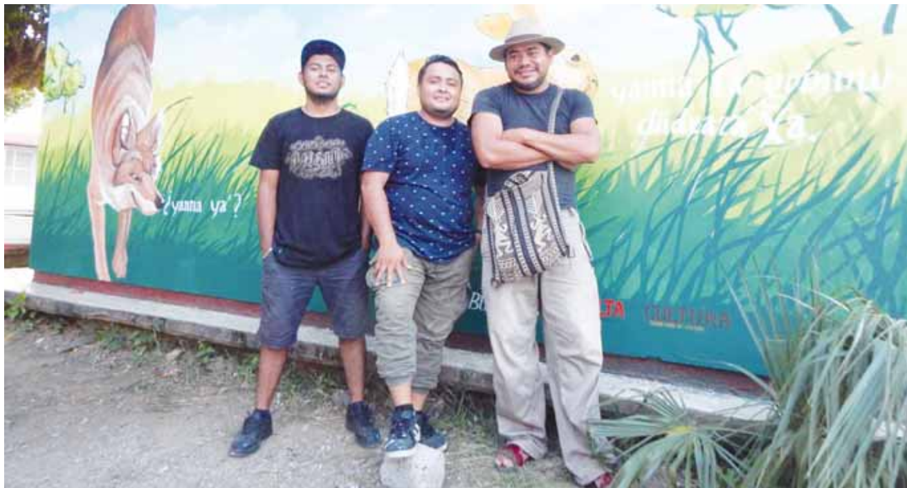
► El Colectivo BinniCubi plasma en los murales especies como iguana, armadillo, conejo, entre otros.

Señaló que están trabajando algunos murales, como un paisaje lingüístico, por lo que a través del mural se utilizan figuras de las especies en peligro de extinción apoyándose de unas frases en zapoteco, “hacemos conciencia de