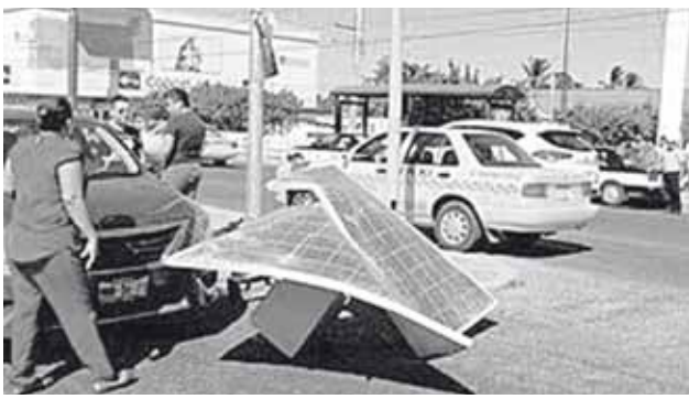
► Los automovilistas exigen mayor seguridad.