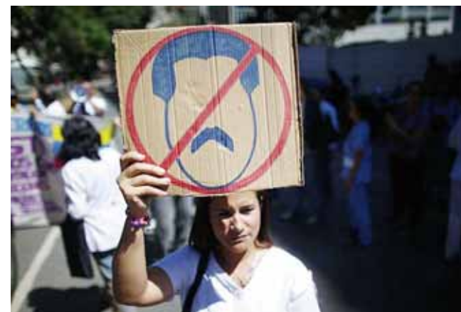
► Cientos de personas saldrán a las calles el próximo sábado.

Asimismo, se espera que se lleven a cabo marchas contra el gobierno de Maduro en ciudades de Argentina, Brasil, Chile, España, Estados Unidos, Francia, Hungría, México y Lituania, entre otros países, reportó el servicio público