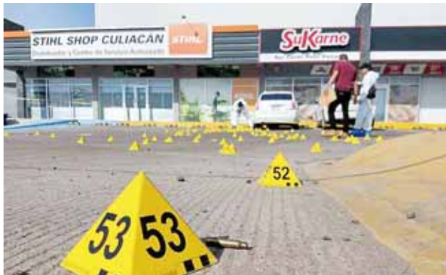
► En Culiacán, Sinaloa, el cadáver de una persona de aspecto joven fue localizado a las afueras de la ciudad.