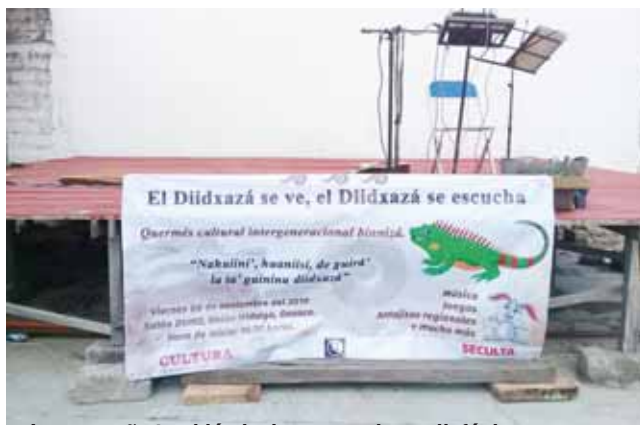
► La campaña también incluye capsulas radiofónicas.