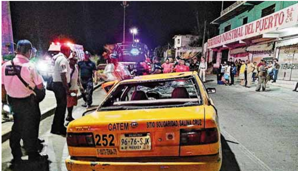
► Los hechos se registraron a las 20:30 horas del este martes.