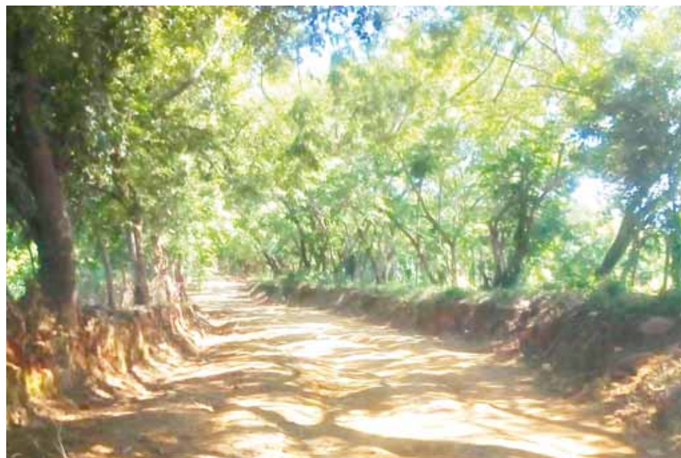
► Los delincuentes ya han sido identificados.