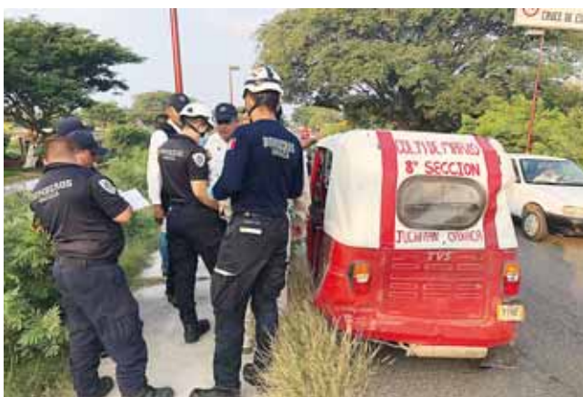
► Una persona resultó con lesiones con leves.

dicha autoridad se encargará de su situación jurídica.