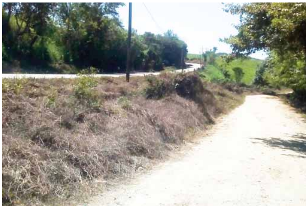
► Los atracos se registran en el camino de terracería.