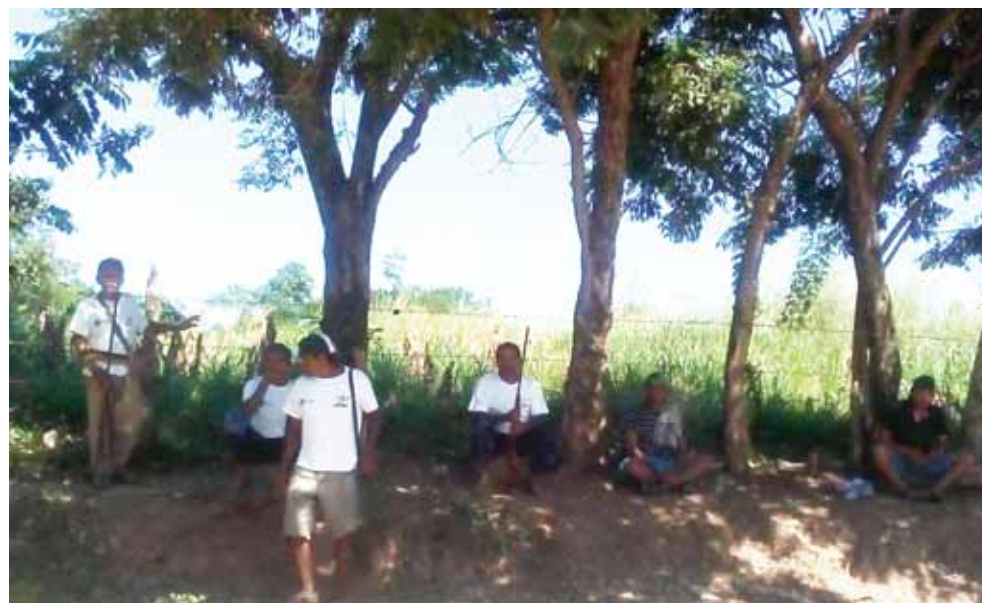
► La comunidad se caracteriza por ser tierra de hombres y mujeres de trabajo.