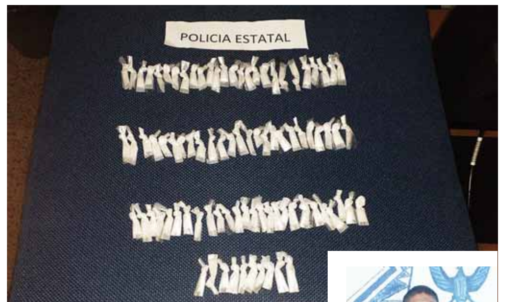
► La droga que llevaba.

por la cual fue trasladado a la comandancia de dicha corporación policíaca ubicado en la población de El Espinal.