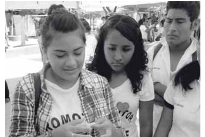
► El objetivo es que la población joven haga conciencia de la importancia de protegerse ante cualquier enfermedad.

a conocer que en lo que corresponde al “Día Mundial del VIH”, a celebrarse este 29 de noviembre las actividades comenzarán a las 09:00 y concluirán a las 14:00 horas.