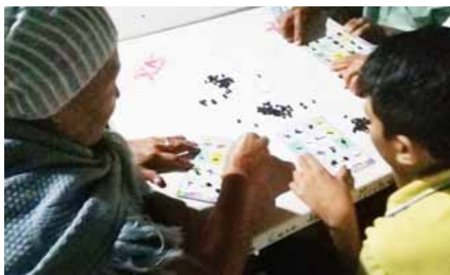
► También se realizan juegos de mesa para no olvidar la lengua.

la lengua y todo está escrito en zapoteco, pues queremos que los jóvenes hagan