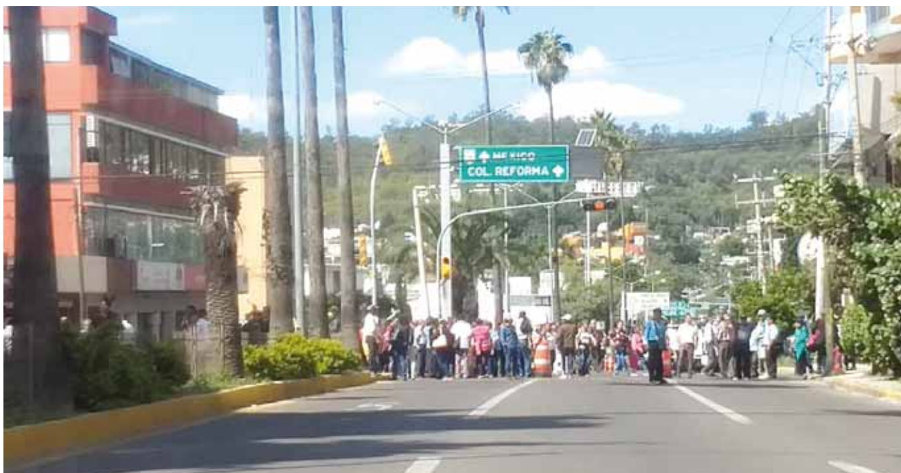
► Bloquearon varias calles.

Respecto al bono 2019, el gobernador Alejandro Murat reconoció que se les va a pagar, pero se está analizando para que este año se les pueda dar un bono de 3 mil pesos y no de 5 mil como lo están pidiendo.