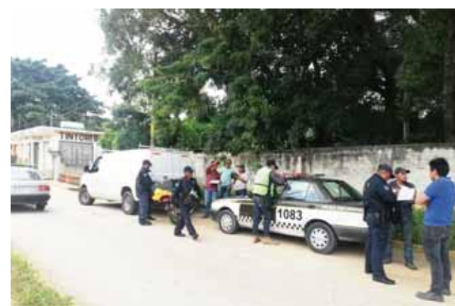
► En el operativo participó la Guardia Nacional, la Policía del Estado y la Policía Municipal.

datos se pudo encontrar que la camioneta tenía infracción en el estado de México, Puebla y Chiapas, en ninguna había pagado la mul-