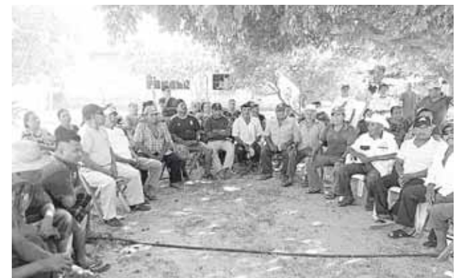
► La comunidad lleva 11 meses sin autoridades municipales.