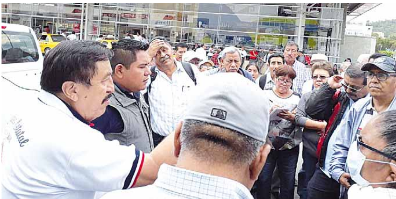
► Los jubilados también reclamaron que el gobierno federal desaparezca la Unidad de Medida Actualizada (UMA).