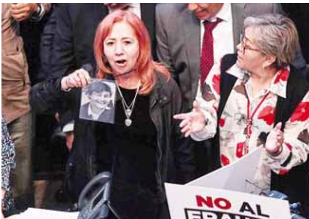
► Los mandatarios estatales agregaron que la asignación de Rosario Piedra viola la Constitución y a los Tratados Internacionales.

Al final del mensaje institucional, el PAN destacó que confía en que "pasando cinco años, pueda resurgir de las cenizas la credibilidad y autonomía de la CNDH".