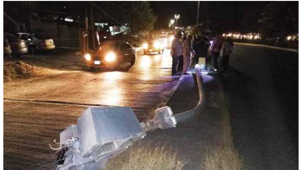
► Debido a los fuertes vientos, un poste metálico cayó e impactó a la unidad.

Una persona murió y dos más resultaron lesionadas al caerle un poste metálico a la unidad en la que viajaban