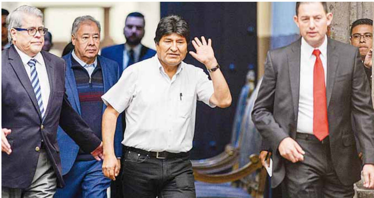
► Los familiares de Morales aun no llegan al país, pero seguramente así será.