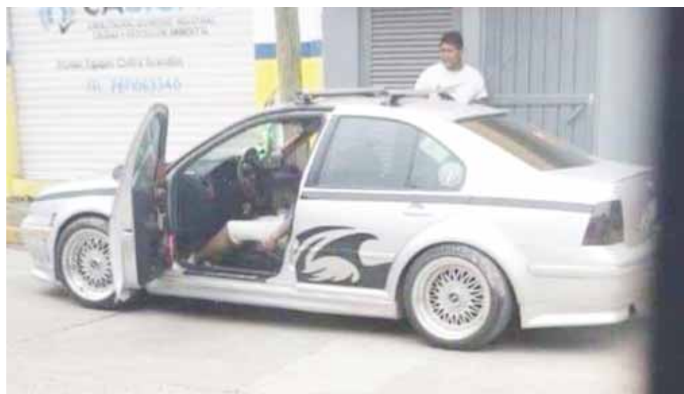
► El cuerpo quedó en el automóvil.