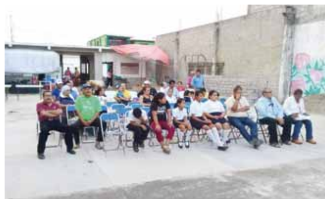
► Se busca crear acciones de difusión y visibilización entre los habitantes.

quiere decir esa frase, para ir recuperando la lengua materna y la comunicación