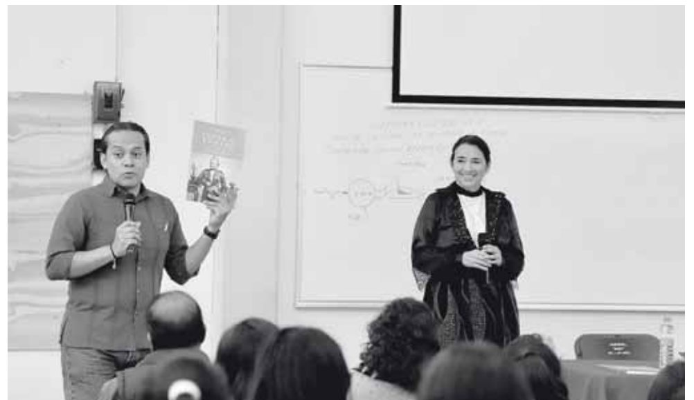
► Dijo que Juana Cata comenzó su acercamiento con el ex presidente Porfirio Díaz Mori, cuando éste fungía como comandante de Tehuantepec.

ra que en 1859 Porfirio Díaz se haya metió en las enaguas de Juana Cata para esconderse.