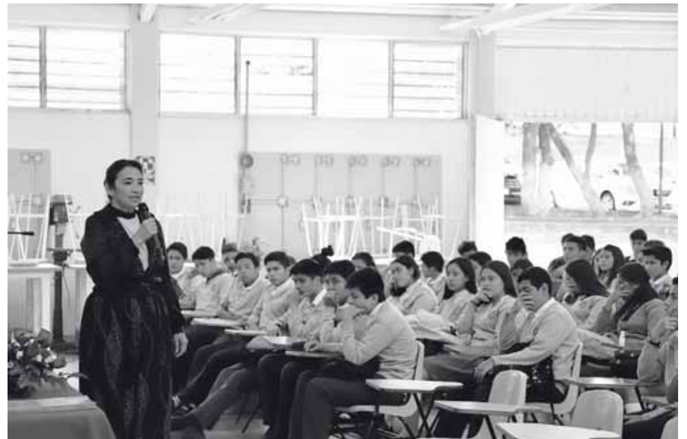
► También habló del apoyo económico que ofreció al presidente Benito Juárez.

Julia, ataviada en un traje negro escenificó a la mujer que fue crucial en la vida política del Istmo de Tehuantepec de 1837 a 1915