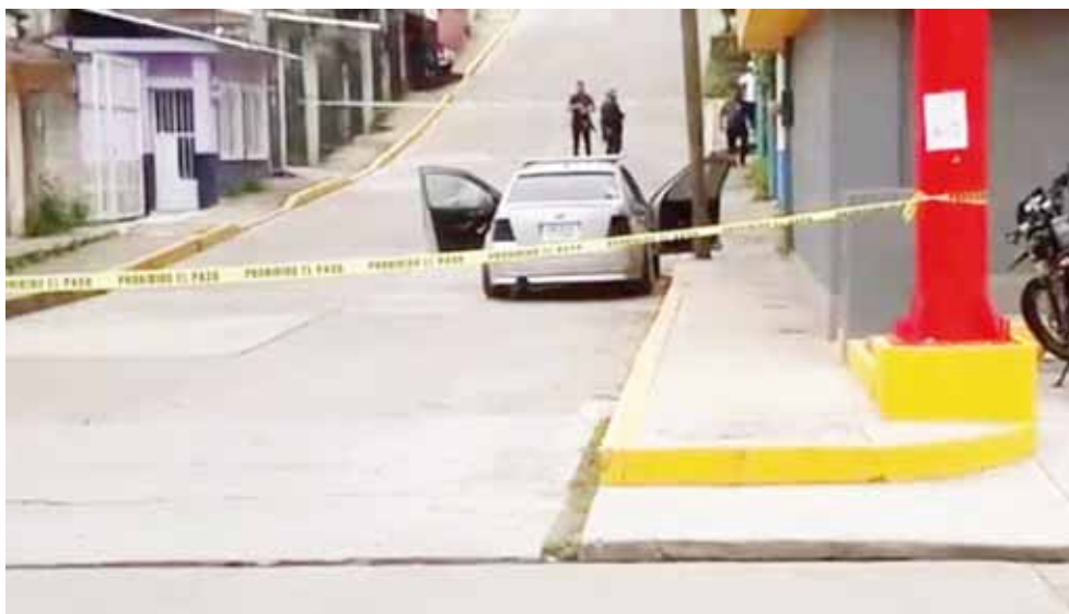
► La víctima había salido de un Oxxo.