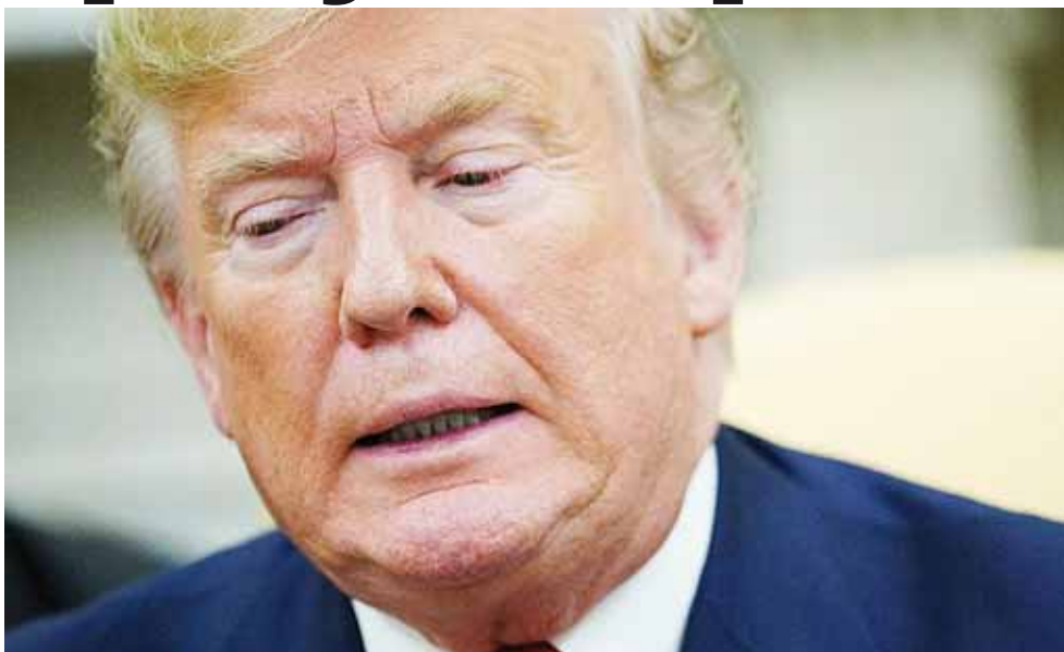
► Donald Trump se dirigió a Twitter para restar importancia a lo que calificó de “Nuevo Engaño. Mismo Pantano”.

simultáneamente en YouTube para miles de personas.