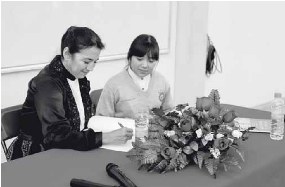
► Los estudiantes quedaron envueltos en esta presentación.