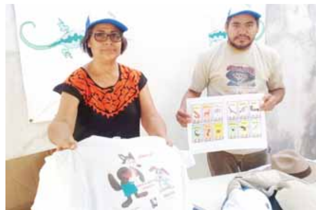
► Imprimen playeras con el nombre de animales en zapoteco.

un esfuerzo por aprender, ya sea preguntando a sus familiares, a su abuelo, que