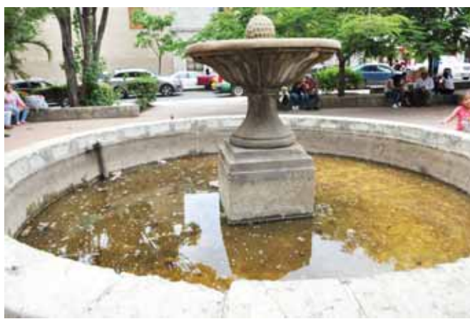
► Existen 49 fuentes en la capital del estado.

El urbanista Rafael Vergara demandó acudir a su rescate debido al serio deterioro que presentan, pues además de proceder a su lavado para evitar se acumule agua sucia que genere moscos e infecciones, se necesita sustituir la cantera deteriorada, sellar grietas para que se mantengan en servicio y que-