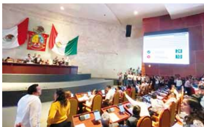
El Congreso de Oaxaca despilfarra recursos que deberían destinarse para el combate a la pobreza, señala el IMCO.

ve superó lo que el Congreso de la Unión desembolsó por legislador el año pasado.