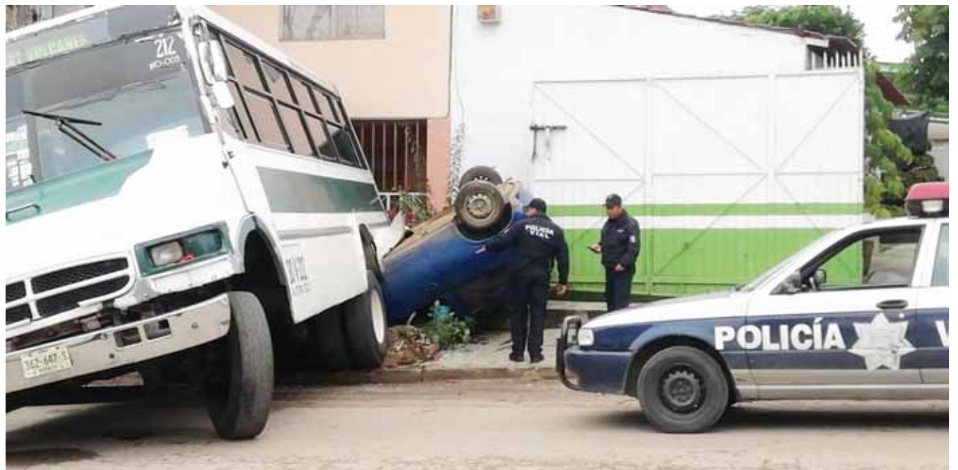
► Elementos de la Policía Vial arribaron al lugar del accidente.

Los bomberos retiraron de la zona el aceite y el combustible que quedaron rega-