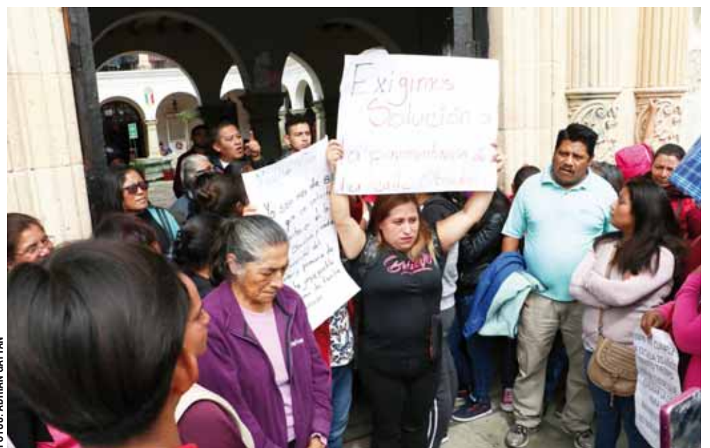
► Buscan un diálogo con la autoridad municipal para poder resolver el problema.