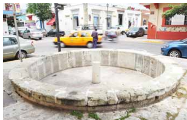
► Las fuentes requieren mantenimiento para garantizar su funcionamiento.