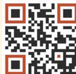
► Escanea el código para ver el video

Al considerar la literatura un espacio en el que se construyen algunos de los modelos de quiénes somos y de quiénes podríamos ser, el comité programó una serie de mesas con temas como los trabajos domésticos y de