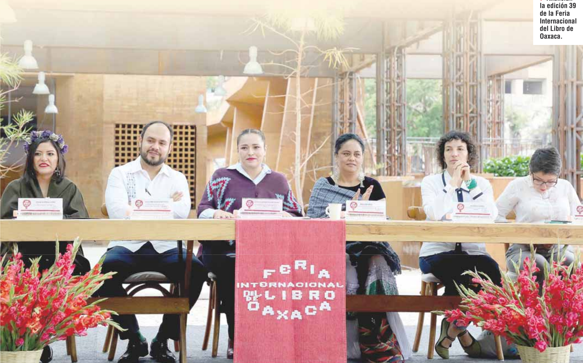
► Anuncian la edición 39 de la Feria Internacional del Libro de Oaxaca.

La intención de la FILO, como cada año, es construir juntos con ayuda de la literatura un mundo más justo donde todos quepamos en la misma medida. Es, pues, reinventar la vida.