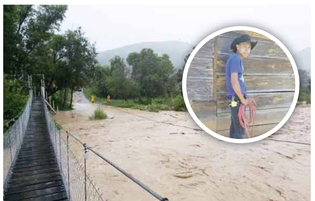
► El joven montador de toros fue arrastrado por la creciente de un río en San Cristóbal Honduras, Miahuatlán.

Personal de la Fiscalía General del Estado de Oaxaca (FGEO) como peritos y elementos de la Agencia Estatal de Investigaciones (AED) realizaron el levantamiento del cadáver.