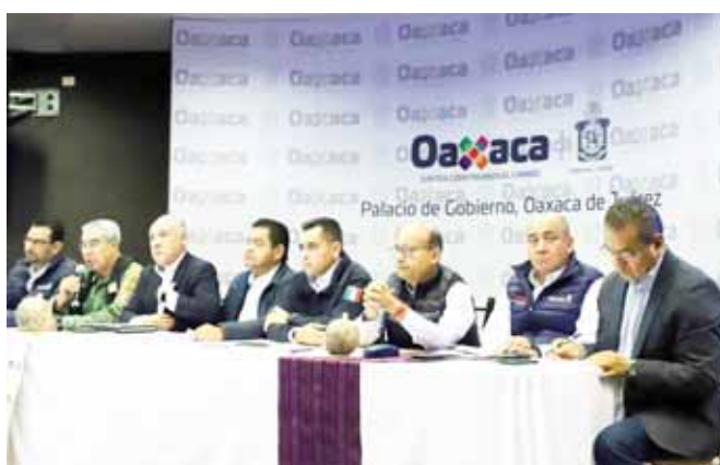
Funcionarios federales y estatales informan sobre las acciones que se llevan a cabo en las regiones afectadas por la tormenta "Narda".

Damnificados de La Boquilla Chicometepec, comunidad perteneciente al municipio de Santa María Huazolotitlán, en la región de la Costa, fueron apoyados por elementos de la Guardia Nacional, luego de los daños que dejó la tormenta "Narda" en las viviendas y terrenos de cultivo.