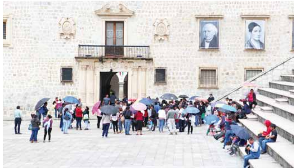
► Los inconformes cerraron el acceso al palacio municipal.