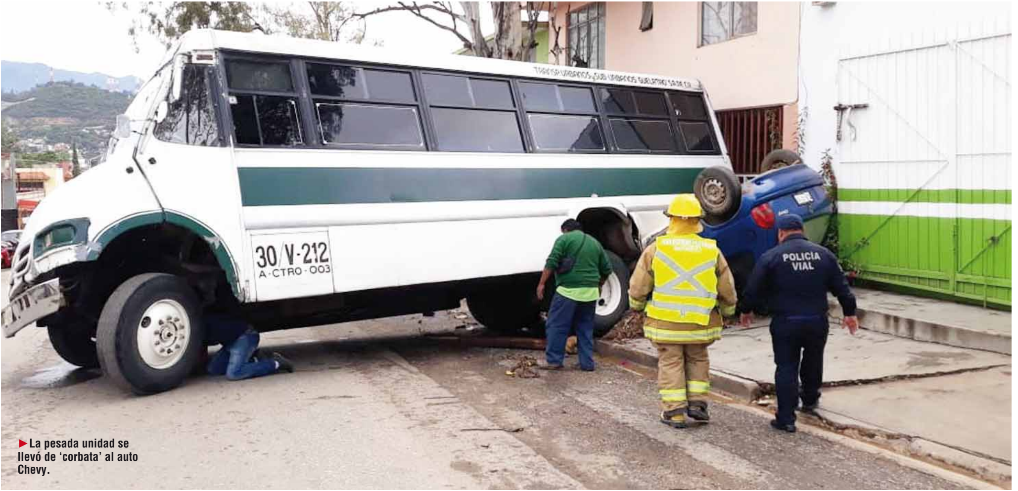
► La pesada unidad se llevó de 'corbata' al auto Chevy.

policiaca@imparcialenlinea.com / Teléfono 501 83 00 Ext. 3176