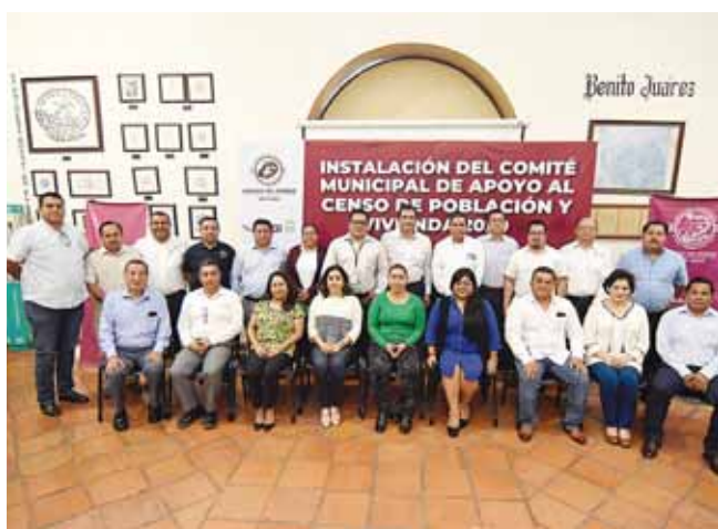
► El censo se realizará del 2 al 27 de marzo del 2020.

capital@imparcialenlinea.com / Teléfono 501 83 00 Ext. 3174