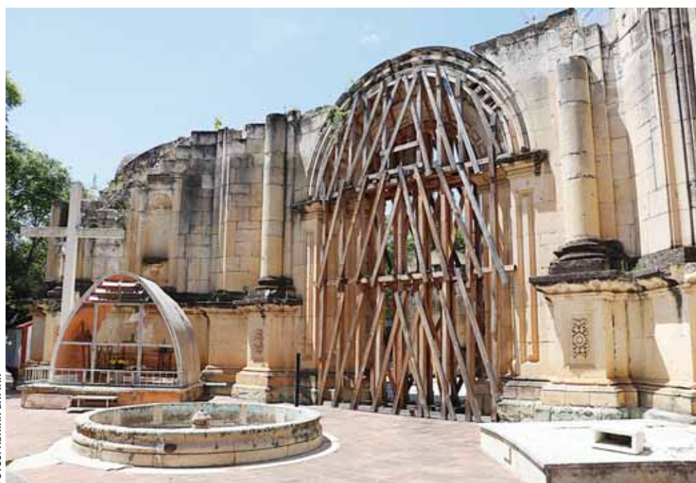
► Trabajan en el apuntalado de algunos muros y arcos del Panteón San Miguel.