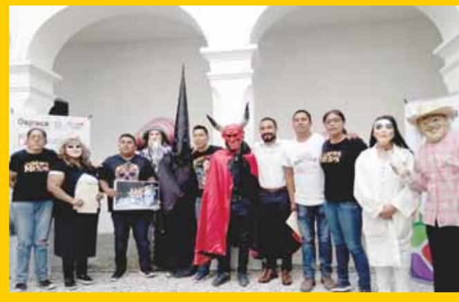
► Tres ediciones de las fiestas: la tradicional, la octava y la de las meras meras.

Los días 1, 9 y 16 de noviembre, este municipio eteco vivirá una edición más de sus muerteadas, fiestas que se caracterizan porque de entre sus personajes están los que conforman un cuadro especial: con figuras como la muerte, el diablo, espiritistas, el viejo, la viuda, los doctores y el muerto. De ahí que se