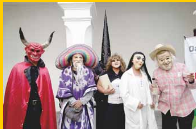
► A partir del 1 de noviembre se desarrollarán las muerteadas.

las calles de la comunidad, acompañadas de bandas de música de viento que tocan sones, danzones, marchas y chilenas que son bailadas por los personajes que integran las comparsas”. Es decir, con personas del pueblo que se disfrazan de viejos, viudas, sacerdotes, médicos y otros personajes del imaginario popular.