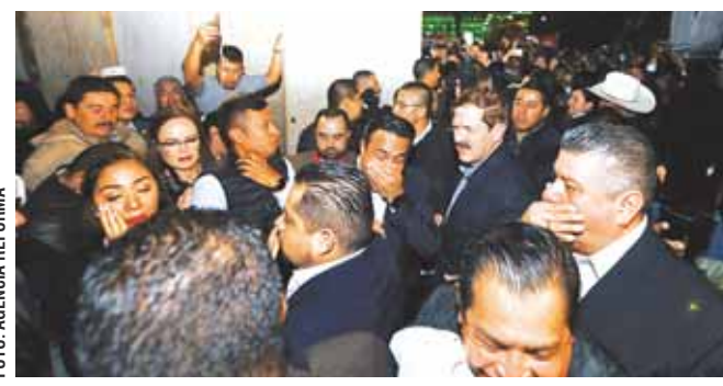
Alcaldes de oposición que demandaban recursos afuera de Palacio Nacional, fueron rociados con gas lacrimógeno.

CIUDAD DE MÉXICO.- Mientras jóvenes encapuchados pudieron vandalizar la Puerta Mariana y la fachada de Palacio Nacional hace casi un mes, ayer Alcaldes de Oposición que demandaban recursos afuera del inmueble fueron rociados con gas lacrimógeno.