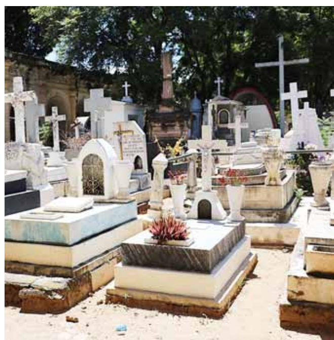
► Sorprendió a los ciudadanos la falta de agua para hacer limpieza en las tumbas.

afectaciones en más del 85 por ciento de la infraestructura.