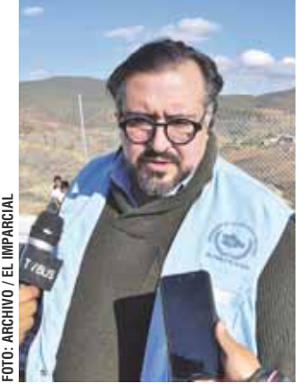
Arturo Peimbert Calvo comparece ante el Senado.

CIUDAD DE MÉXICO.- La crisis de derechos humanos que enfrenta México ha rebasado a la Comisión Nacional de Derechos Humanos (CNDH), que requiere una reestructuración para descentralizar su actuación y ser más cercana a las víctimas, expresó ayer Arturo Peimbert Calvo durante su comparecencia ante el Senado al presentar su candidatura para ser electo como nuevo ombudsman de México. "Hay una crisis prácticamente en todos los capítulos de derechos humanos, desde la pobreza, como una violadora de derechos humanos, hasta temas gravísimos como feminicidios, desaparición forzada, tortura, agre-