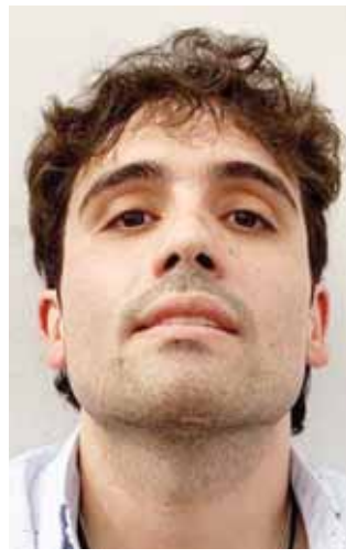
► Ovidio Guzmán López fue liberado por la Guardia Nacional.