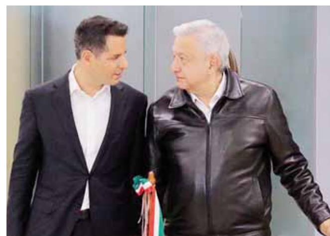
► El gobernador Alejandro Murat Hinojosa recibió anoche al presidente Andrés Manuel López Obrador, a su llegada al aeropuerto internacional de Xoxocotlán.

En su onceava gira, luego de ofrecer su conferencia "mañanera" se trasladará vía