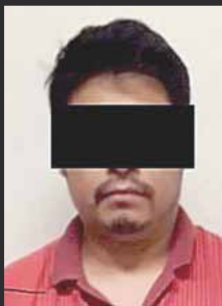
► Un sospechoso ya fue detenido y presentado ante el juez.

En ese momento, J. C. M., en compañía de otras