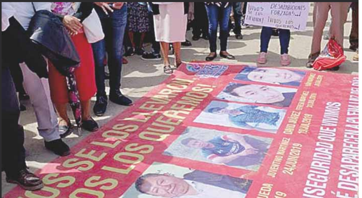
► Familiares exigen su aparición con vida.

últimos meses fueron reportadas como desaparecidas varias personas. Por esta razón a mediados del mes de agosto se realizó una marcha para exigir que se realicen las investigaciones pertinentes para poder encontrarlos.