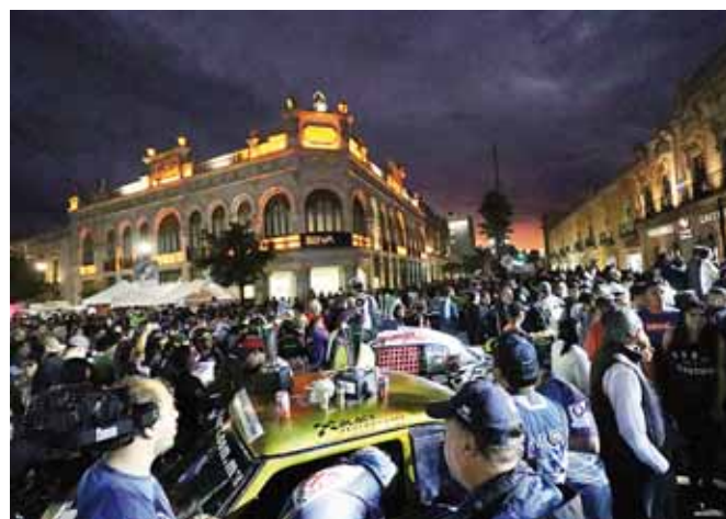
► La Carrera Panamericana concluyó este jueves en Durango.

Cientos de aficionados al deporte motor acudieron a la salida a los participantes