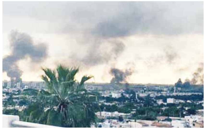
► Culiacán bajo intenso fuego del Cártel de Sinaloa.

EL CÁRTEL DE SINALOA DOBLEGA Y HUMILLA A LA 4T