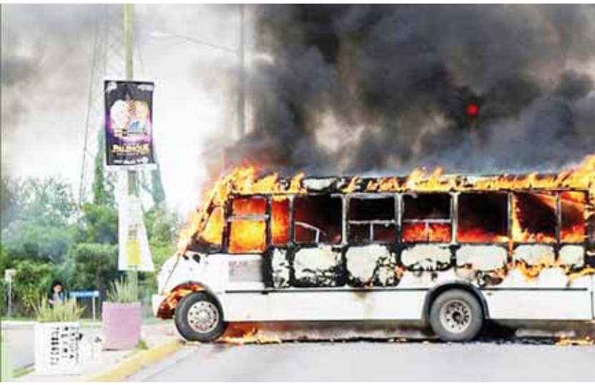
► Arde Sinaloa con la detención del hijo de "El Chapo" Guzmán.