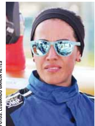
► La navegante cuenta con 16 años de experiencia, 6 de ellos en la Panamericana.

cambia al estar arriba del carro, ahí la tripulación trabaja para un mismo fin, que es ganar, se tienen que hacer bien las cosas, en nuestro caso en la noche nos reseatamos y al otro día comenzamos nuevamente".