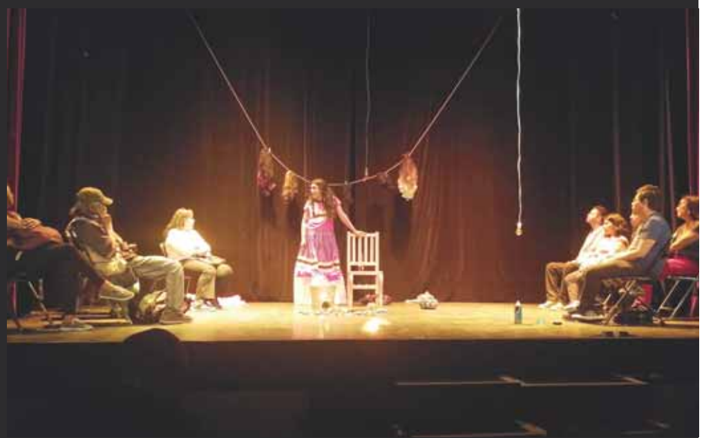
► El público forma parte de la pieza teatral.

Luego de sus 100 funciones, la pieza sigue su camino por Nayarit y Veracruz, en programas como el Festival Amado Nervo