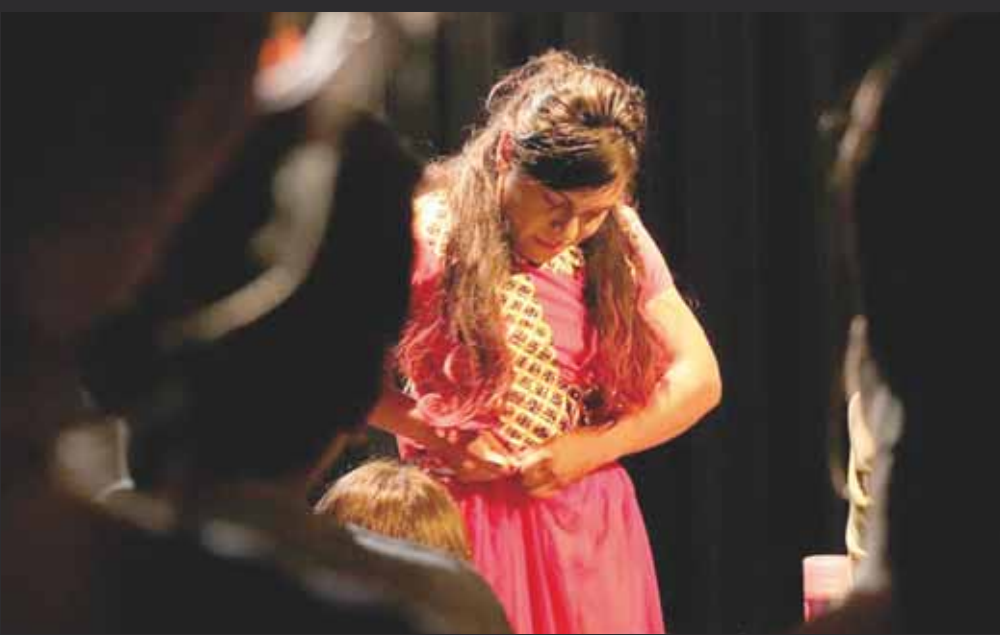
► Bala'na está basada en un 90 por ciento en una historia real.

enesena@imparcialenlinea.com / Teléfono 501 83 00 Ext. 3172