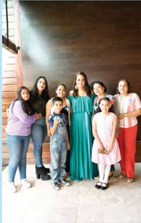
► Acompañada de sus sobrinos y familiares más cercanas.