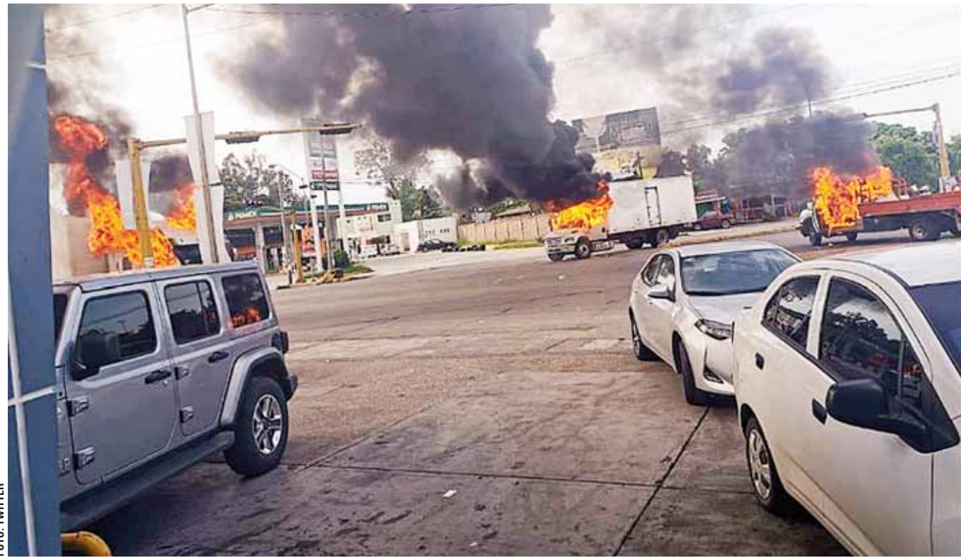
► La detención de Ovidio Guzmán López, hijo de "El Chapo", desató una violenta ofensiva del Cártel de Sinaloa.

La detención de Ovidio en una casa del fraccionamiento Tres Ríos en la capital sinaloense desató una ofensiva inusitada del Cártel de Sinaloa cuyos integrantes tomaron la ciudad, desataron el terror en sus calles, bloquearon carreteras, incendiaron autos y camiones, y rodearon el sitio donde estaba detenido el líder para rescatarlo.