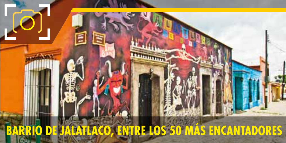
BARRIO DE JALATLACO, ENTRE LOS 50 MÁS ENCANTADORES

capital@imparcialenlinea.com / Teléfono 501 83 00 Ext. 3174