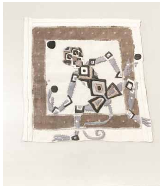
► Muchos de los diseños que Toledo realizó son colaboraciones con distintos talleres artesanales.

Toledo ve se inauguró el 3 de julio de 2019, ha recibido cerca de 32 mil visitantes de todas las edades. Está integrada por 826 piezas de