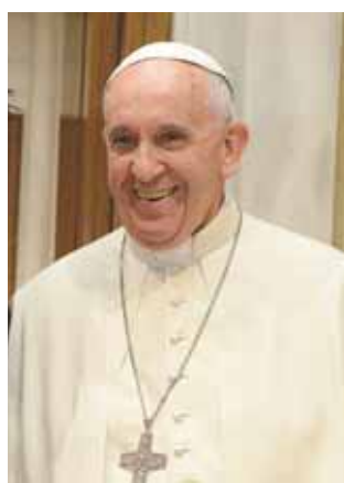
El mensaje del Papa fue transmitido durante el festejo en Coapa.

"Los felicito por unir el deporte y la integración social. El futuro no se construye con lamentos sino con decisiones como la vuestra".