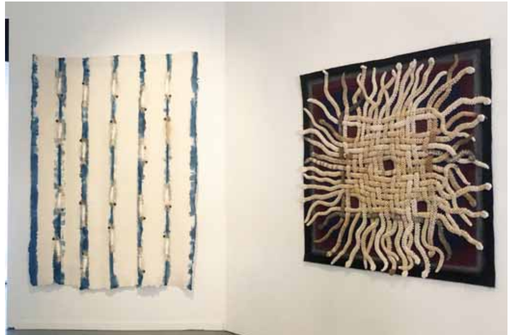
► El artista exploraba constantemente distintos materiales.

La muestra compuesta por 826 piezas es un recorrido por la exploración en diseño de Francisco Toledo; puede ser admirada en el Museo de Culturas Populares en la Ciudad de México