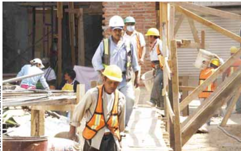
La industria de la construcción se desploma en Oaxaca.

En los últimos cuatro años, se han perdido más de 4 mil empleos en el sector de la construcción en Oaxaca.