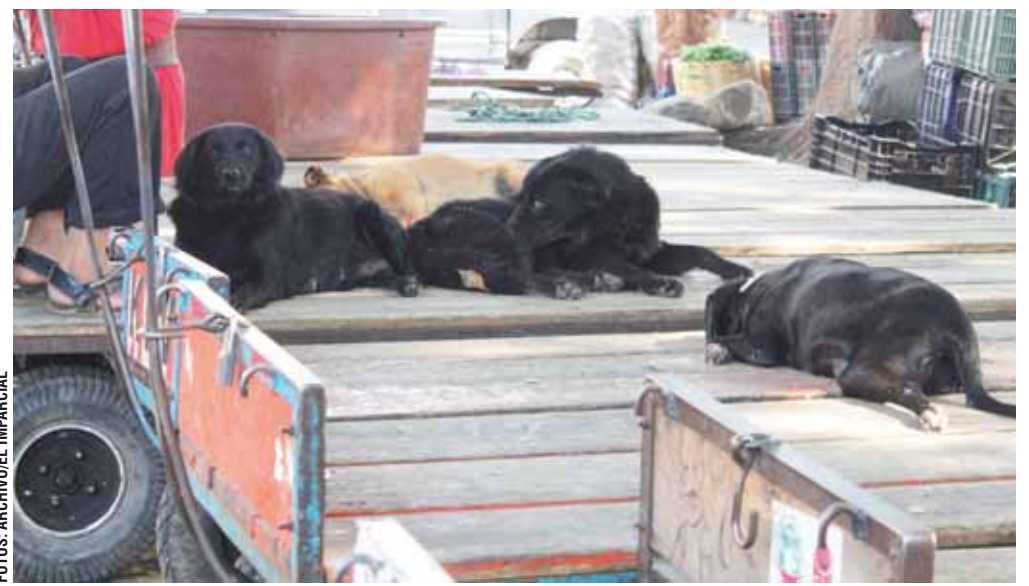
► Los esfuerzos van encaminados a contar con un registro municipal.

En coordinación con la Secretaría de Salud del Estado indicó que se lleva a cabo el Programa de Esterilización de Caninos y Felinos con el objetivo de contribuir en la reducción de la población de estos animales en situación de calle y que no se hayan presentados casos