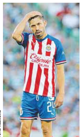
Oribe necesita revivir en su regreso al Azteca y Tena podría tener la solución.

la presión aumentó con la presencia del dueño, Emilio Azcárraga, en el Nido de Coapa.