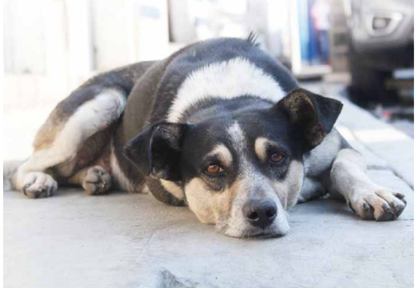
► Buscan concientizar a la sociedad sobre las obligaciones y responsabilidades de los propietarios de animales domésticos.

pañía que fueron vacunados en la Campaña de vacunación antirrábica canina y felina 2019, registrándose hasta el momento un total de 13 mil 058 animales domésticos vacunados.