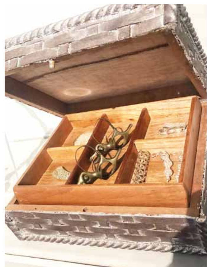
► No hay cédulas porque la intención es que la gente imagine cómo intervino ciertos objetos cotidianos.