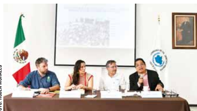
Realizan conversatorio sobre la consulta en los pueblos indígenas.

Ante decenas de asistentes, recordó que la Ley de consulta a los pueblos indígenas debe estar basada en los parámetros propuestos por el sis-