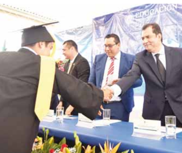
► El conocimiento representa la herramienta más poderosa para generar cambios.

Por sus calles empedradas bordeadas de coloridas casas y arte callejero, Jalatlaco — ubicado en la capital de Oaxaca — fue seleccionado por la guía mundial de ciudades Time Out como uno de los 50 barrios más interesantes del mundo. Jalatlaco aparece en el número 17 de este listado basado en la encuesta Time Out Index 2019, en la que se preguntó a más de 27,000 habitantes de ciudades de todo el mundo sobre los mejores vecindarios.