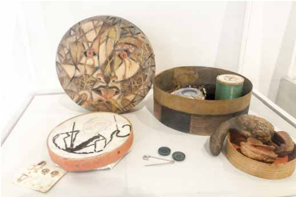
► La mayoría de las piezas pertenecen a su archivo personal.

enesena@imparcialenlinea.com / Teléfono 501 83 00 Ext. 3172