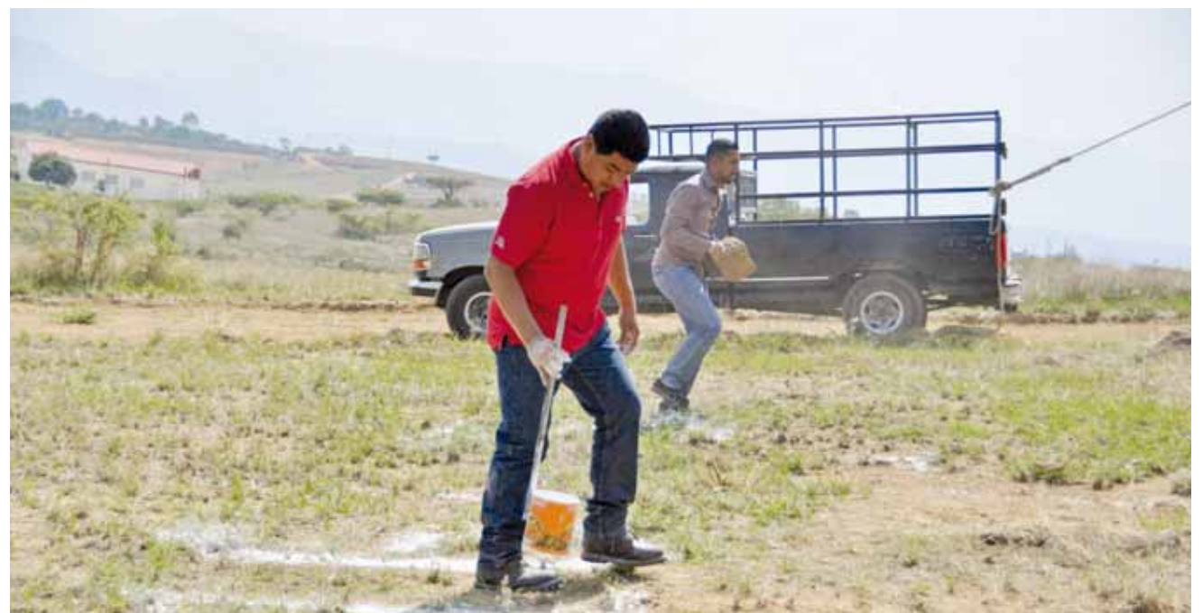
► El 28 de mayo delimitaron los terrenos que les otorgó el gobierno del estado.

No podemos empezar gestiones de servicios porque no tenemos la titularidad de la propiedad al carecer de escrituras, externó.