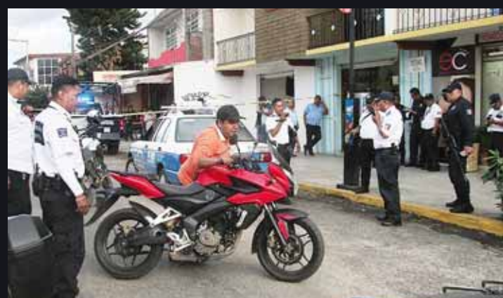
► La motocicleta robada también fue asegurada.