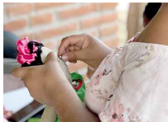
► Es una forma de curar y transformar el miedo.