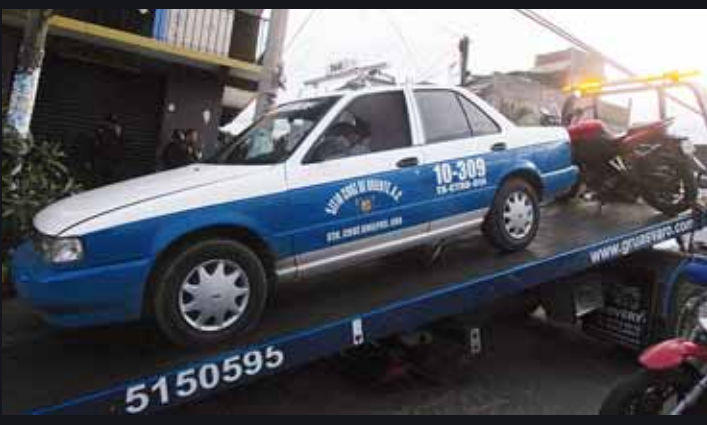
► La unidad asegurada pertenecía al sitio Cruz de Oriente de Santa Cruz Amilpas.

Fue un agente vial que viajaba a bordo de su motopatrulla quien se percató de los hechos y de inmediato comenzó la persecución de estos sujetos alertando a sus compañeros sobre este hecho.