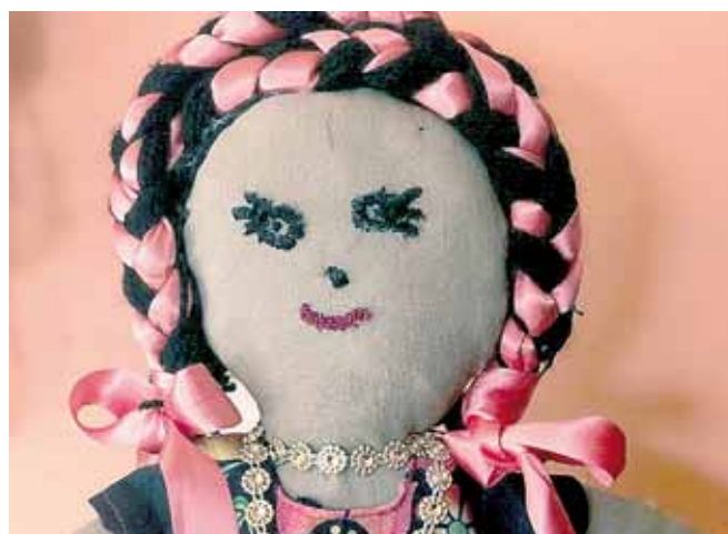
► Su inspiración nace de las abuelas ixtaltepecanas.