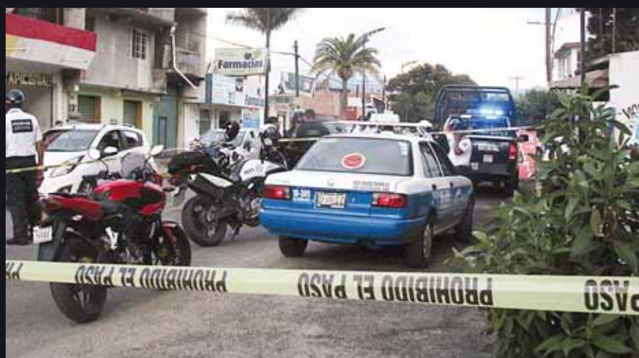
► La zona fue acordonada por la policía.