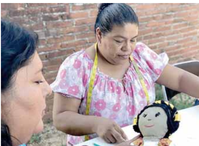
► Cada una aporta telas de varios colores.

Además del compromiso de elaborar un libro que saldrá publicado a finales del año, el cual está dedicado a las abuelas zapotecas de Ixtaltepec.