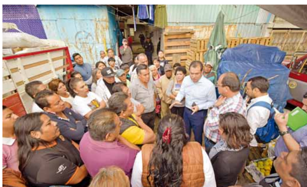
► El edil capitalino sostuvo un diálogo con los dirigentes y pide trabajar en equipo.

“Vamos avanzando cumpliendo con los acuerdos que establecimos y sobre todo para mandar un mensaje