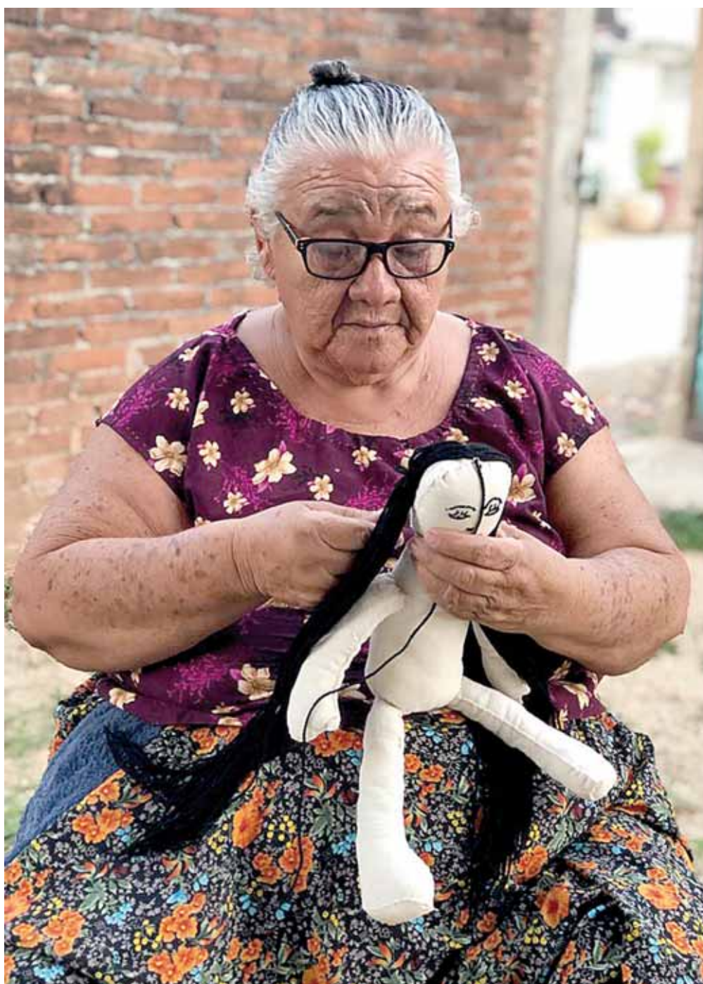
► Con la venta de las muñecas obtienen ingresos para mantener a sus familias.

Las entrevistadas coincidieron en señalar que su inspiración nace de las abuelas ixtaltepecanas, las cuales representan un mensaje de solidaridad a favor del respe-