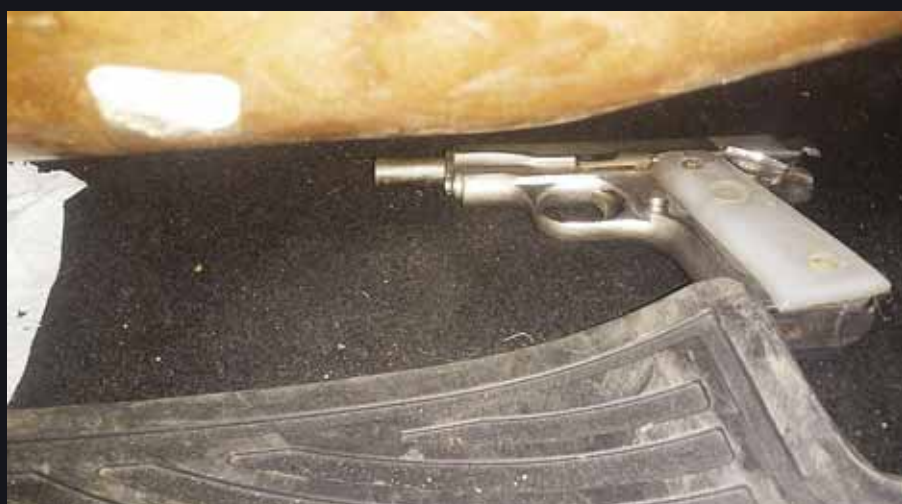
► Un arma de fuego fue asegurada.

Por último en el lugar se comentaba sobre posibles detenciones de arma de fuego, sin embargo esto no fue confirmado por las autoridades.