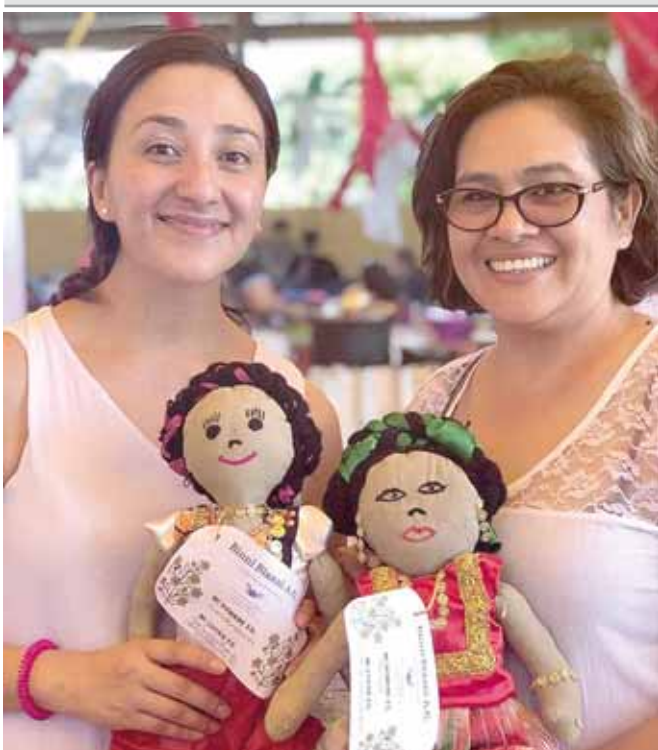
► Basadas en su imaginación elaboran los rostros y les colocan sus accesorios.

enesena@imparcialenlinea.com / Teléfono 501 83 00 Ext. 3172