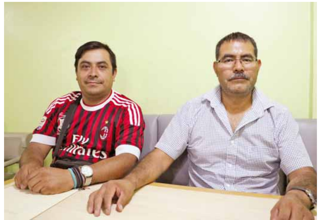
► Los voceadores esperan un tiempo prudente para que el gobernador cumpla.

Recordó que desde el pasado 8 de mayo, el gobernador del estado Alejandro Murat Hinojosa se comprometió a condonar los impuestos por la escrituración, impuesto catastral y registro público de la propiedad; no obstante, se ha incumplido. “Vivimos al día, el