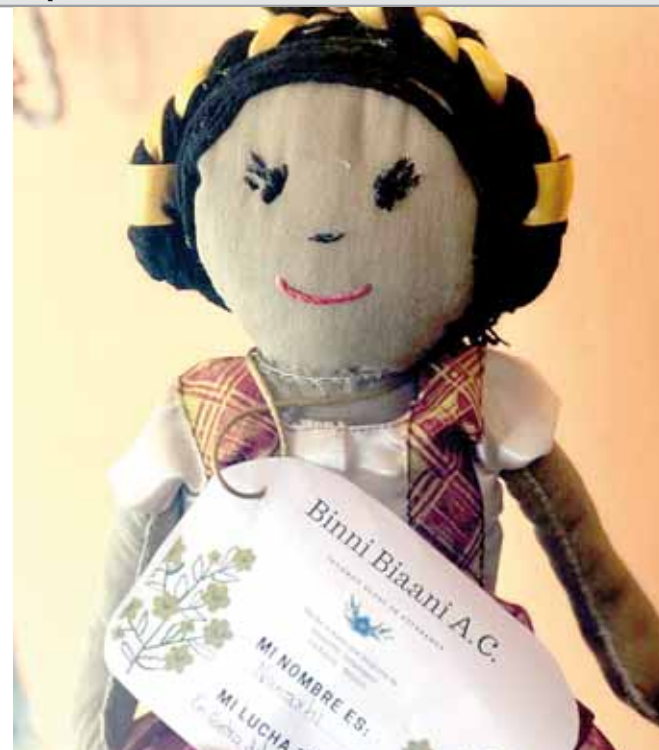
► Las tejen como parte de la protesta contra los feminicidios.