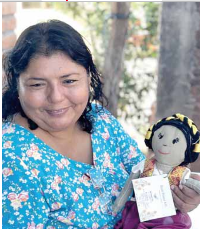
► Todas eligen la causa y las ofertan en un precio aproximado de 250 pesos.