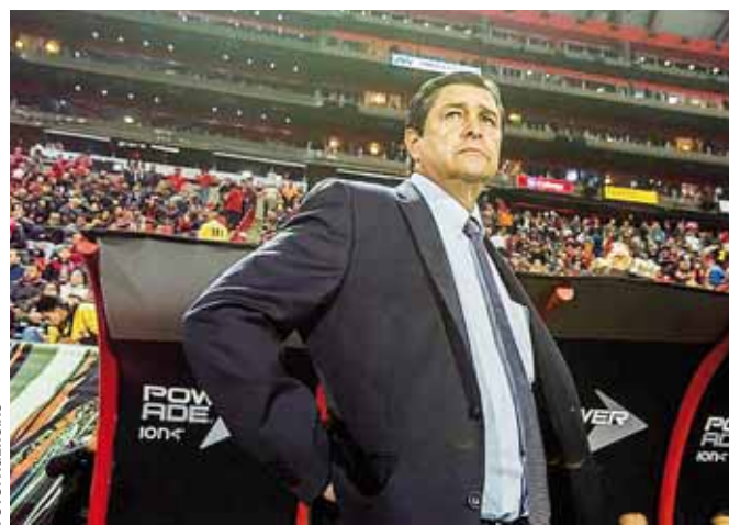
Tena condujo a la selección mexicana a ganar la presea dorada en Londres 2012.

la figura para ganar la medalla de oro hace poco más de siete años.