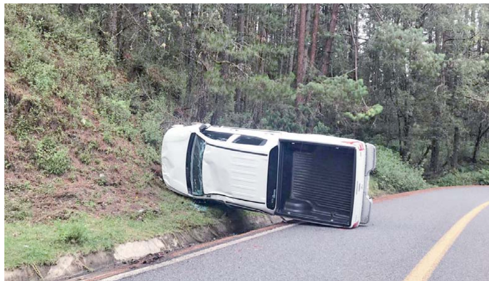
► La Policía Vial Estatal reportó otra volcadura la tarde de ayer, alrededor de las 14:50 horas, a la altura del kilómetro 191, debido al mal estado del camino.