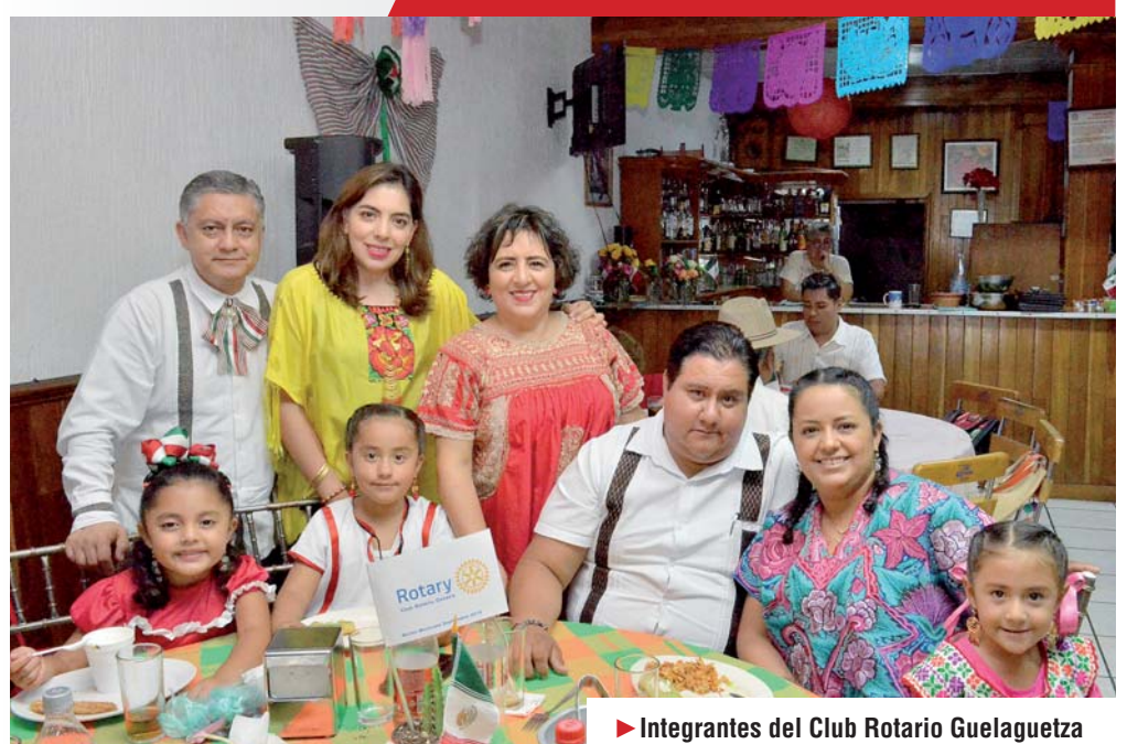
► Integrantes del Club Rotario Guelaguetza asistieron a la velada.