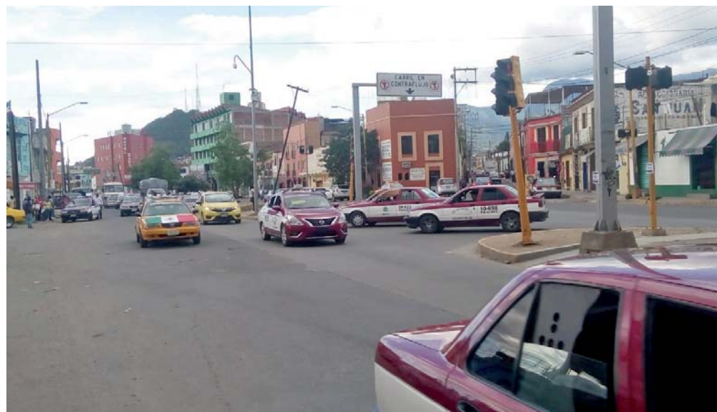
► La mujer fue atacada en el cruce que hacen Periférico y Nuño del Mercado.

momento no hay un sistema de seguridad que permita a las mujeres que son víctimas de violencia puedan ser auxiliadas en tiempo real, pues a pesar de los muchos progra-