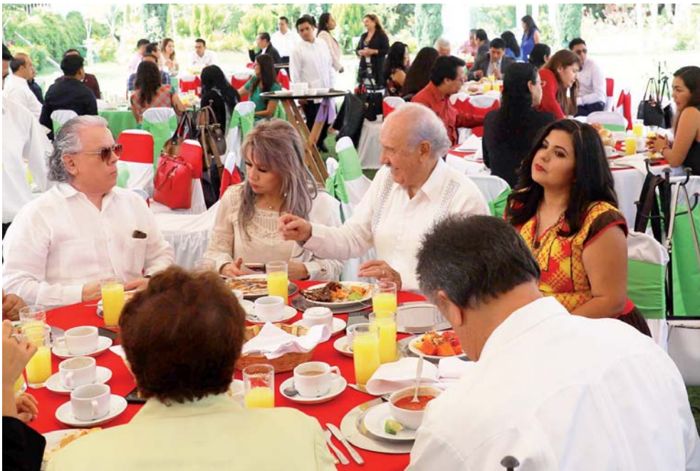
Ayer festejaron en Oaxaca a los comunicadores con la presencia del líder nacional del STIRTT.

DÍA DEL TRABAJADOR DE LA RADIO, TELEVISIÓN Y TELECOMUNICACIONES