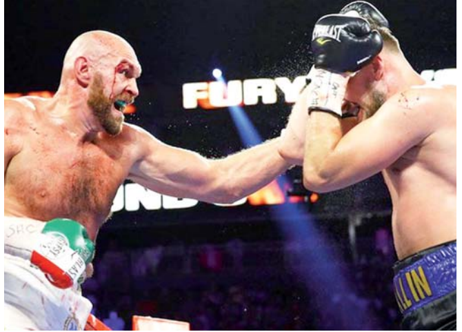
El corte de Fury bañó de sangre a ambos boxeadores.

Fury comenzó a presionar al retador sueco quien se vio traicionado por su estaminaluego de un arranque de gran intensidad.