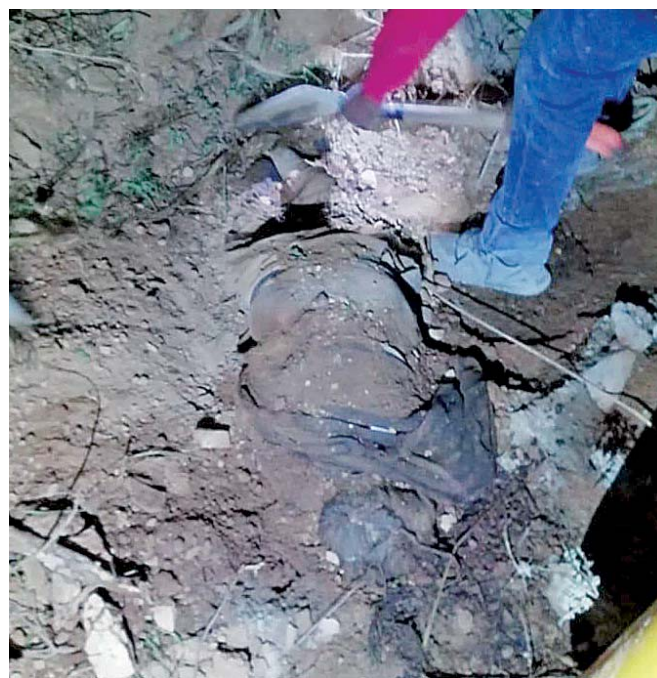
► El hombre murió aplastado por la unidad que conducía, al volcar aparatosamente.

La policía Vial Estatal reportó otra volcadura alrededor de las 14:50 horas, a la altura del kilómetro 191, debido al mal estado del camino, ya que por las intensas lluvias y el agua nieve que cae, está muy resbaloso, tornándose sumamente peligroso.