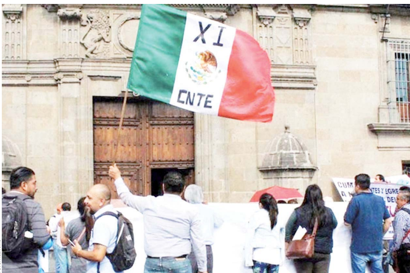
► El fanatismo de la CNTE ha doblegado al gobierno de la 4T. AMLO sigue cediendo. Ello representa un peligro para el país.

Hoy, 15 de septiembre, se conmemora no la cabalgata nocturna de Aldama y Pérez, sino la arenga (llamada "Grito de Dolores") del cura que incendió a la Nueva España y que Agustín de Iturbide (criollo también), once años después, culminara la Independencia y la llamada Imperio Mexicano. (Hay que leer al Dr. Mora y a Lucas Alamán).