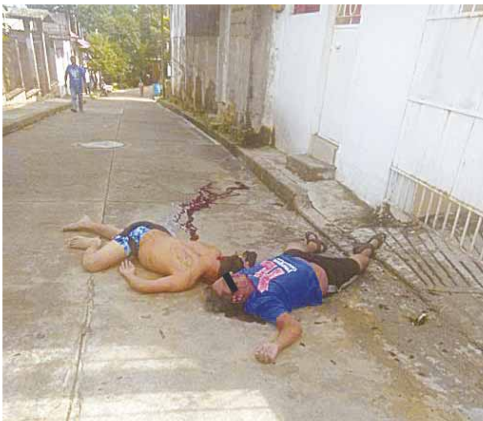
► Los cuerpos de quedaron tirados en la calle Jorge L. Tamayo.

Al lugar se movilizaron policías de las distin-