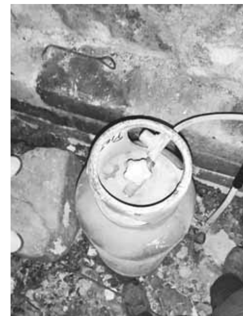
► Los tanques de gas presentan fugas.