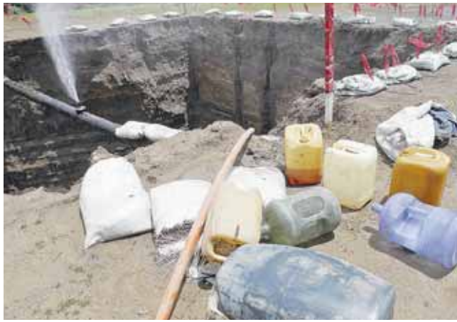
► Pese al peligro que representa y aunado a un grave delito, el huachicoleo no cesa.