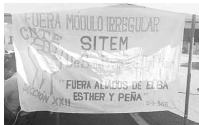
► Parte de sus exigencias.

De acuerdo con los manifestantes, los maestros adhe-