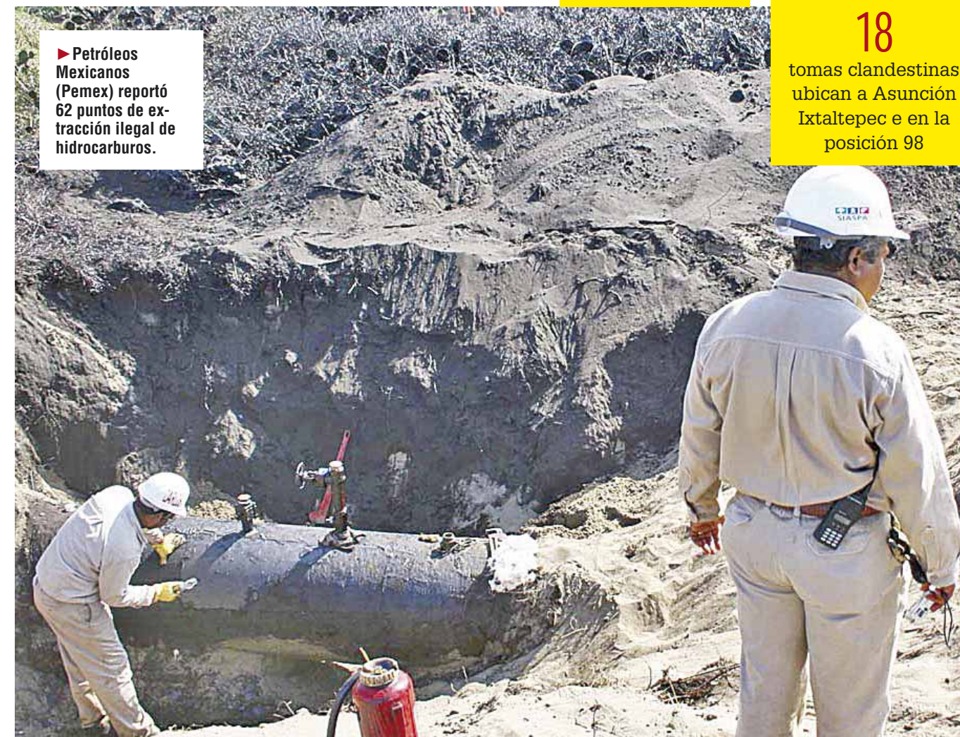
► Petróleos Mexicanos (Pemex) reportó 62 puntos de extracción ilegal de hidrocarburos.