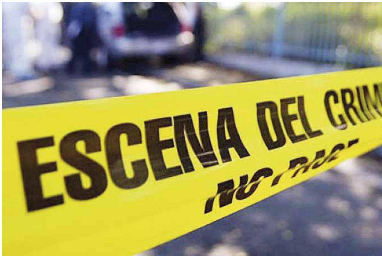
► El crimen tuvo lugar a las 20:00 horas del lunes.