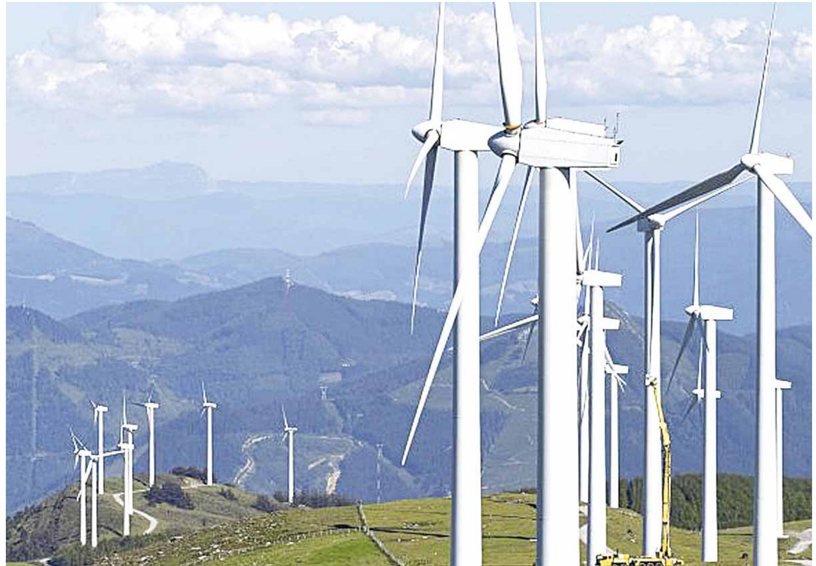
► El proyecto entraría en operación para el 2020.

Luego de que Emilio Montero expusiera el contenido del documento enviado por la Secretaría fede-