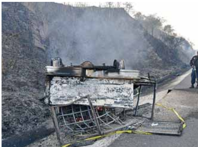
► En marzo de este año, una unidad de motor que llevaba combustible ilegal volcó y se calcinó en Matías Romero.