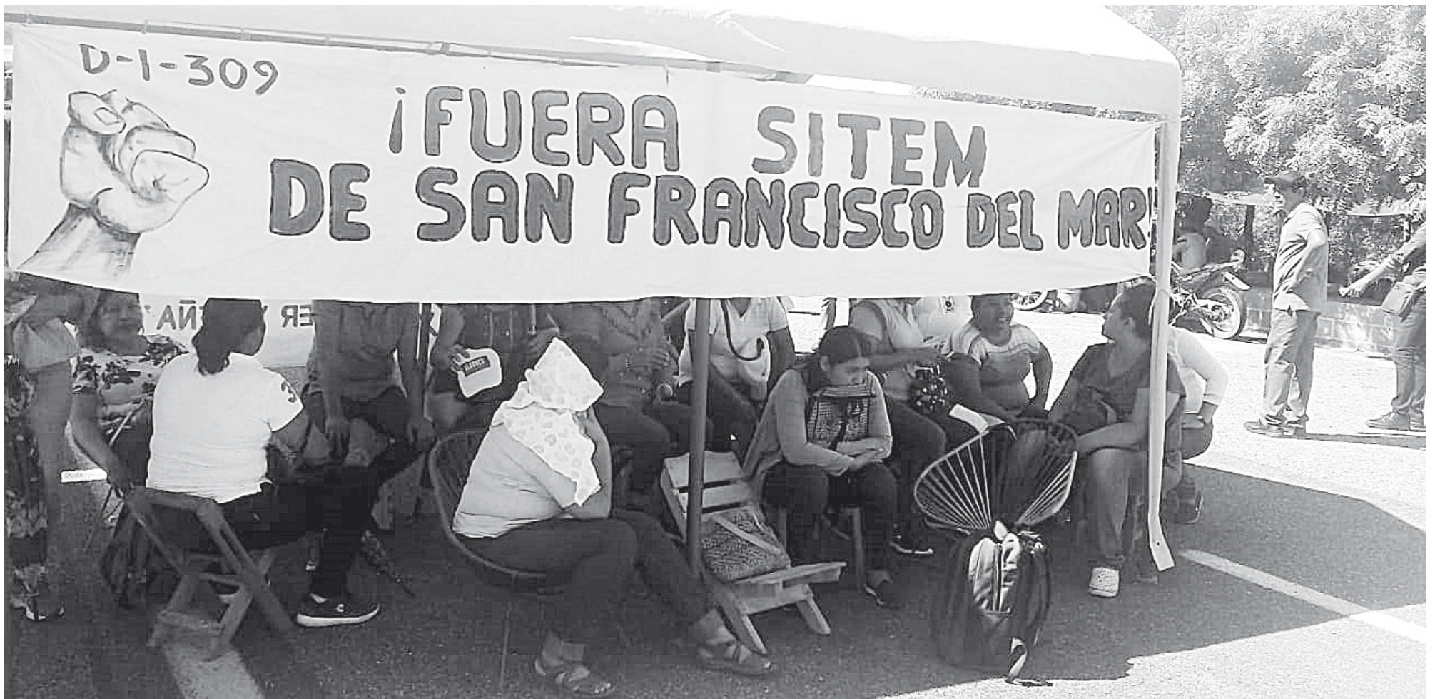
► El bloque inició desde la 9:00 de la mañana.

Exigen el cierre de in módulo del SITEM ubicado en el poblado de San Francisco del Mar