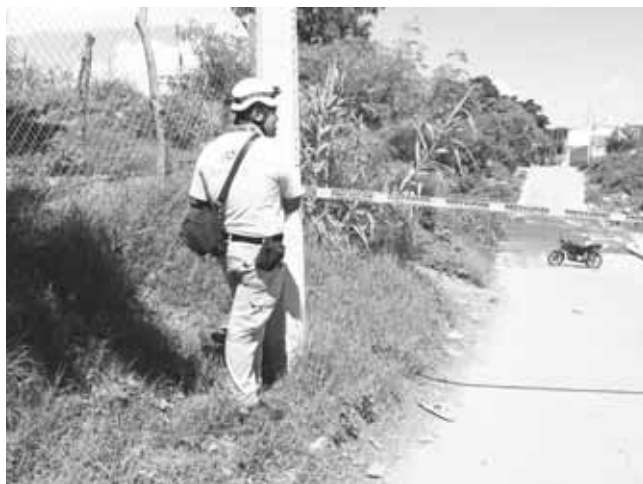
► Protección Civil de Juchitán resguarda la zona.

J UCHITÁN, OAX.- Policía Municipal y Protección Civil de Juchitán acordonaron el vado norte del río Los Perros que comunica la primera con la octava sección de la ciudad ante el escurrimiento que proviene desde la Sierra Mixe-Zapoteca hasta este municipio, por las intensas lluvias en las partes altas del Istmo.