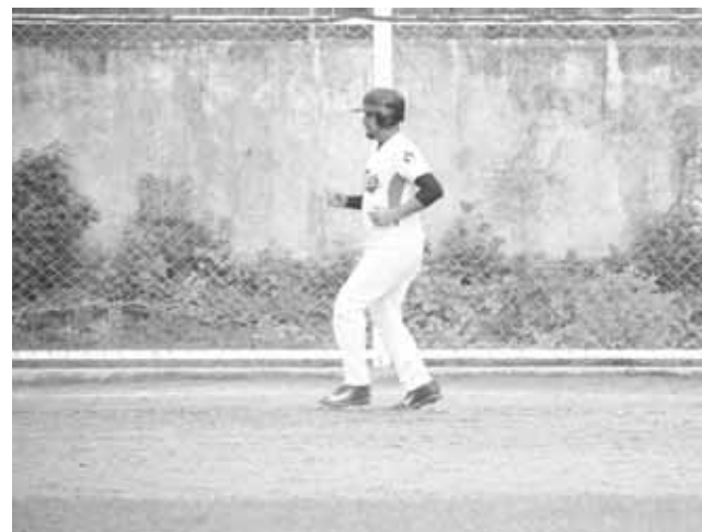
► El Almirante abrió el juego con home run.