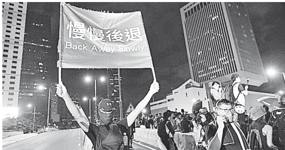
► Las cuentas canceladas estaban vinculadas a una campaña de propaganda del gobierno chino.

El directivo, que habló bajo condición de anonimato por preocupaciones de