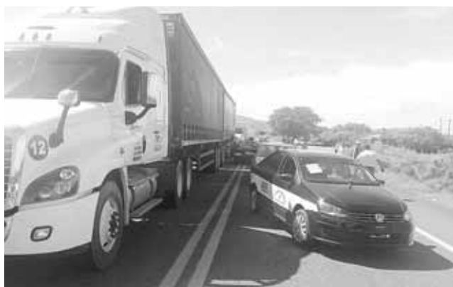
► No hubo paso del Istmo de Tehuantepec hacia el estado de Chiapas y viceversa.

El bloqueo inició desde las 9:00 de la mañana