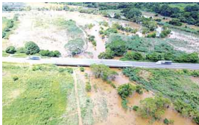
► Dado que el drenaje se tapó, el agua entró a las casas provocando pérdida de electrodomésticos.

Cabe destacar que una inundación como esta no