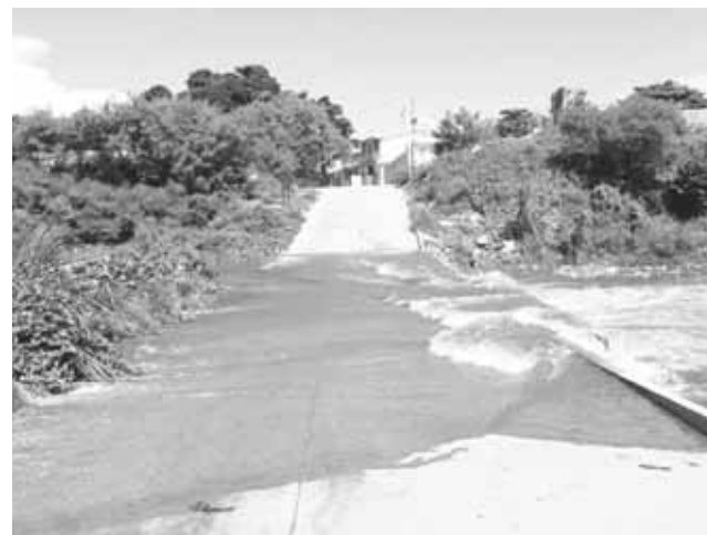
► El desborde del río Los Perros.

traron lluvias en los municipios de la planicie del Istmo sin embargo, en las zonas serranas se presentaron aún precipitaciones importantes por el paso de una zona de