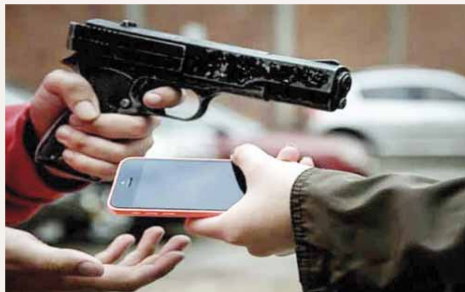
► La ciudadanía exige mayor seguridad.

Horas después a las 15:45 horas un trabajador de la CFE fue saltado, ahora los hechos ocurrieron sobre la calle Ignacio Nicolás de la Séptima Sección, muy cerca del iglesia denominada Cristo Viene, portan-