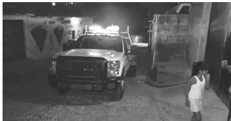
► Se brindó apoyo a los habitantes que lo requirieron.

Dijo que es común que en temporada de lluvias se presente reblandecimiento de la tierra y en algunas zonas las bardas se