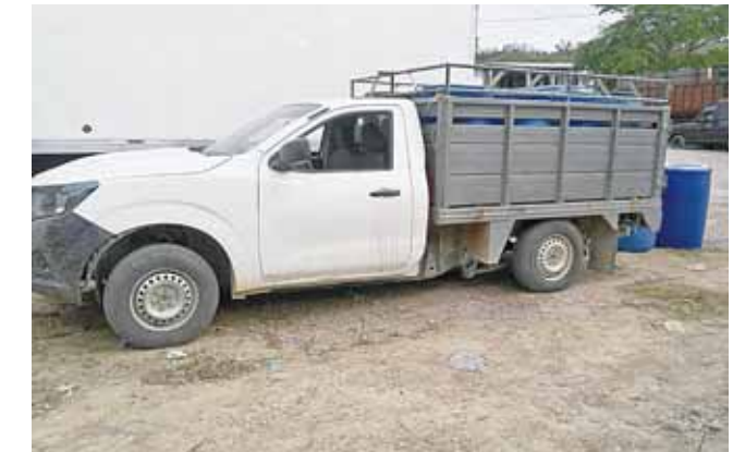
► El traslado del huachicol se da en camionetas particulares.

tomas clandestinas ubican a Asunción Ixtaltepec e en la posición 98