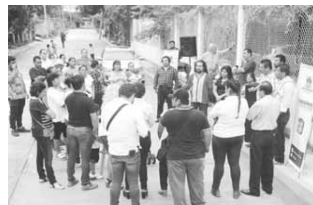
► Los vecinos esperaron 30 años para que el proyecto fuera una realidad.

monto de un millón 434 mil 426 pesos con 23 centavos, fue realizada con recursos del Ramo 33 y tiene mil 167. 62 metros cuadrados de construcción, beneficiando directamente a más de 110 familias que habitan en esa colonia.