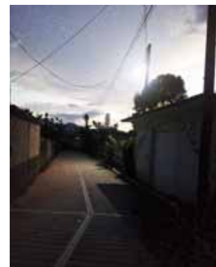
► La calle 20 de Noviembre donde tenía su domicilio la hoy occisa.

Por estos hechos, personal de la Fiscalía General del Estado de Oaxaca (FGEO) se apersonó en el lugar de los hechos para realizar las diligencias correspondientes.