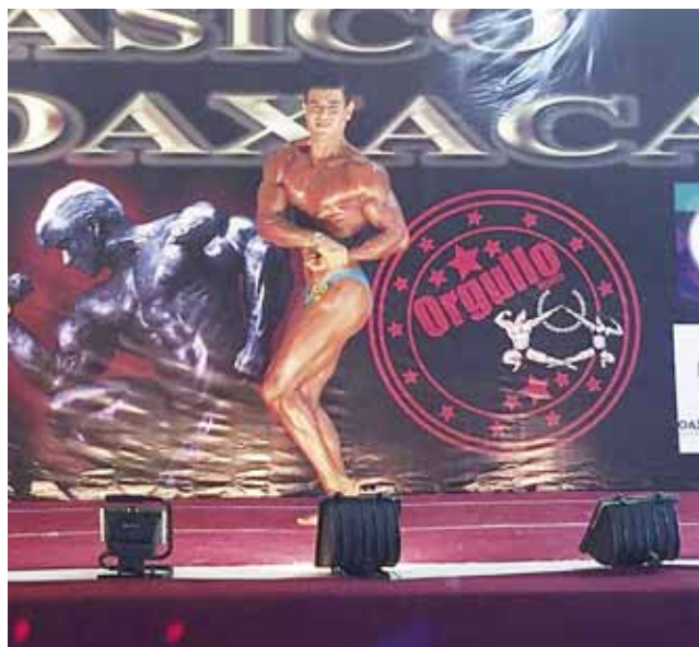
► Erving ya se prepara para el Mr. Ferrocarrilero en la CDMX.