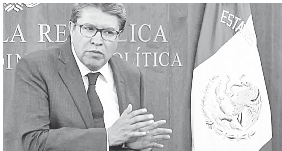
► El senador de Morena, Ricardo Monreal, durante su mensaje de ayer en la Cámara alta.

"Los señalamientos, el presidente Martí Batres debe llevarlos a la denuncia y debe tener pruebas. Ojalá él pueda avanzar, entendiendo su situación", aseveró Monreal Ávila.