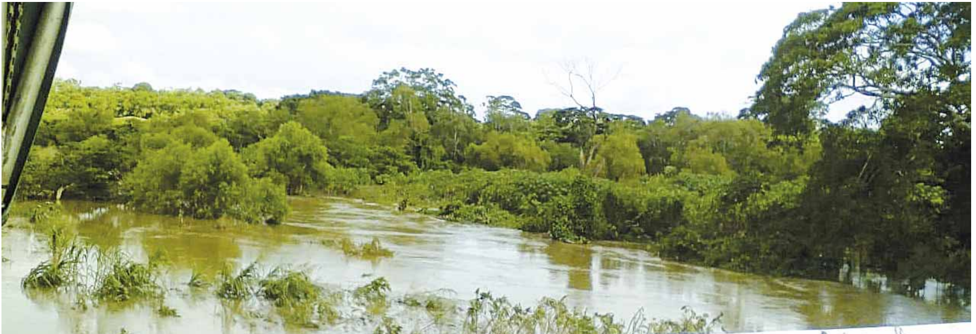
► Hubo afectaciones en ranchos ganaderos y de cultivos.