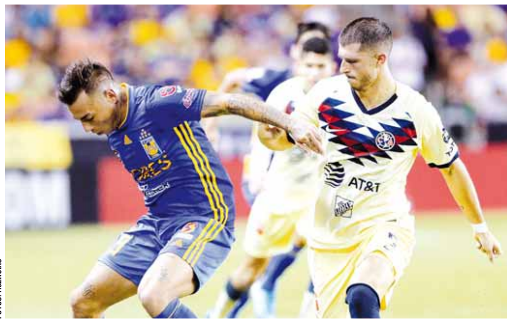
► Los cinco cobradores del conjunto universitario no fallaron.