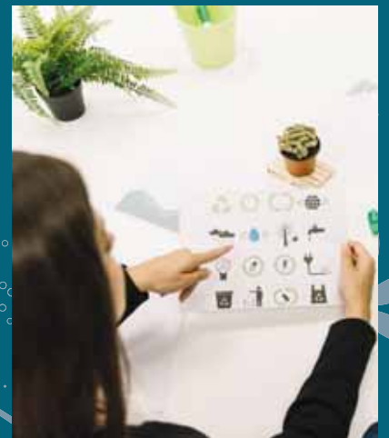
La difusión de acciones en pro del ambiente ayuda a que más jóvenes se unan.

En una sociedad, una menor parte de la población es la que está consciente de los problemas que existen en el mundo y los jóvenes pueden participar en la promoción de la agenda de desarrollo a personas de sus comunidades, y así más personas pueden sumarse a este proyecto que está cambiando el panorama actual de la sociedad.