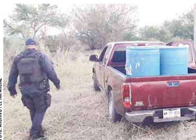
El Istmo de Tehuantepec sigue siendo un "foco rojo" en las tomas clandestinas de hidrocarburos.

Durante el primer semestre del 2019 localizaron 105 tomas clandestinas en Oaxaca, lo que representa un incremento del 69.5 por ciento en comparación del mismo periodo del año anterior, cuando Petróleos Mexicanos (Pemex) reportó 62 puntos de extracción ilegal de hidrocarburos.