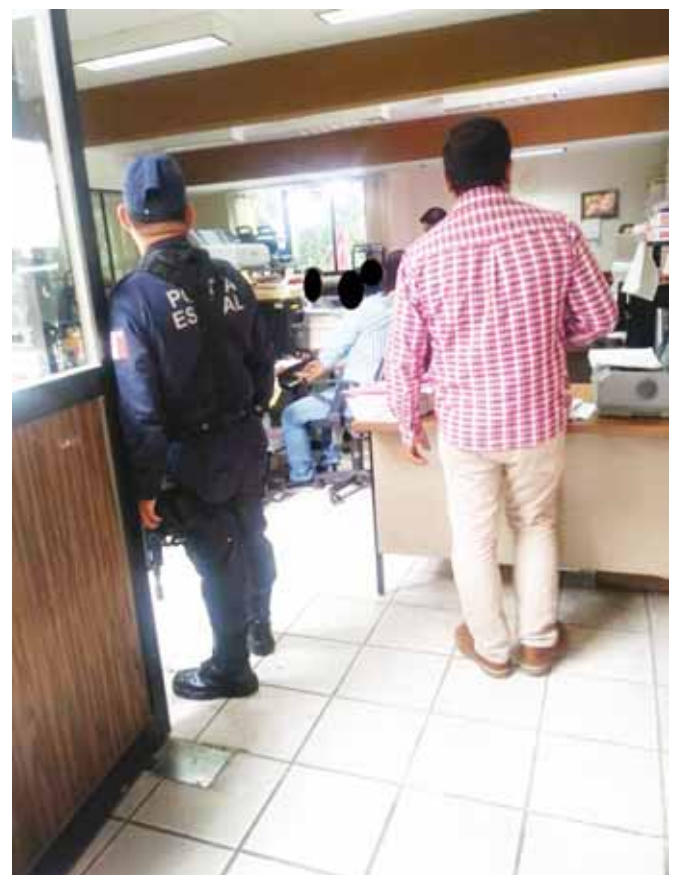
► El sujeto es acusado de violar a un niño en el 2013.

narla ante el juez quinto de lo penal, encontró los elementos suficientes y libró el orden de aprehensión, por lo que fue detenido el pasado 13 de agosto del 2019. El acusado al escuchar las acusaciones negó