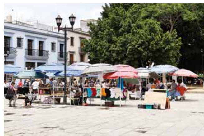
► La inseguridad y el ambulante han crecido juntos.