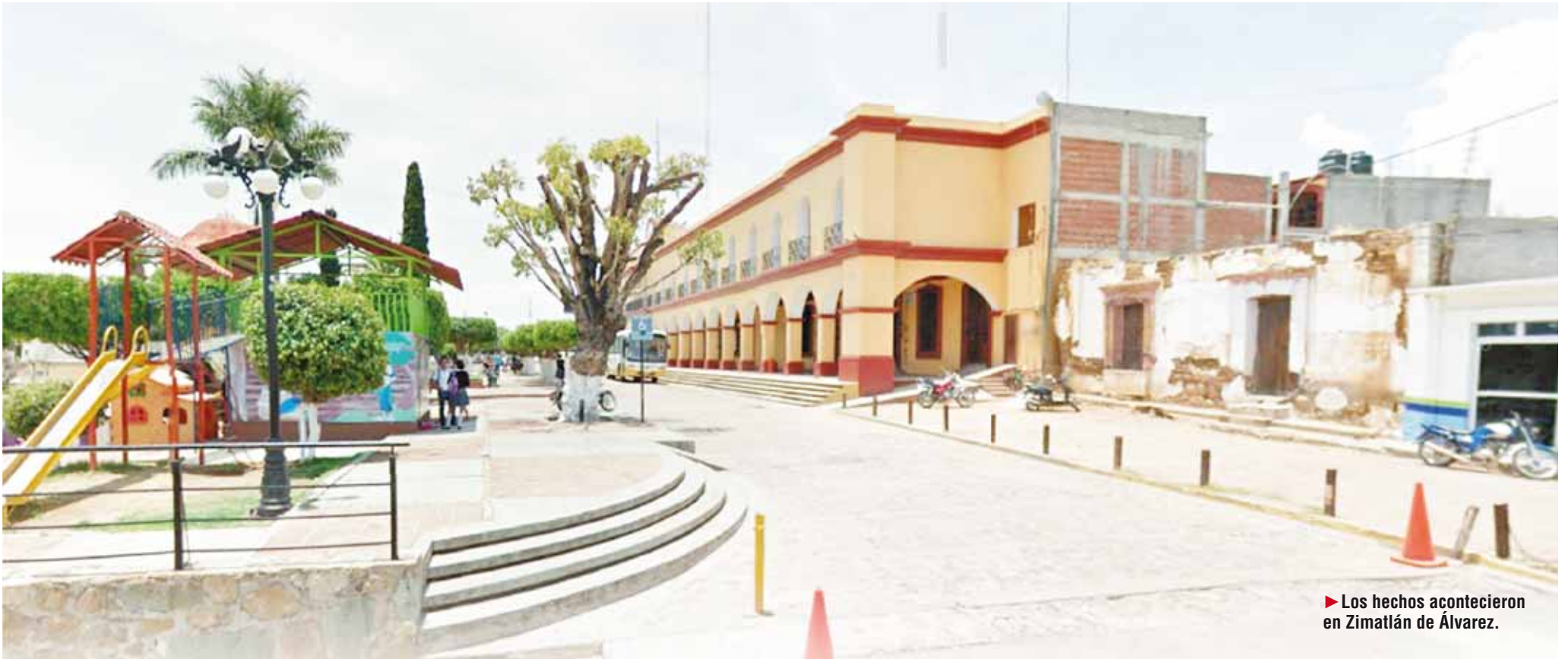
► Los hechos acontecieron en Zimatlán de Álvarez.

policiaca@imparcialenlinea.com / Teléfono 501 83 00 Ext. 3176