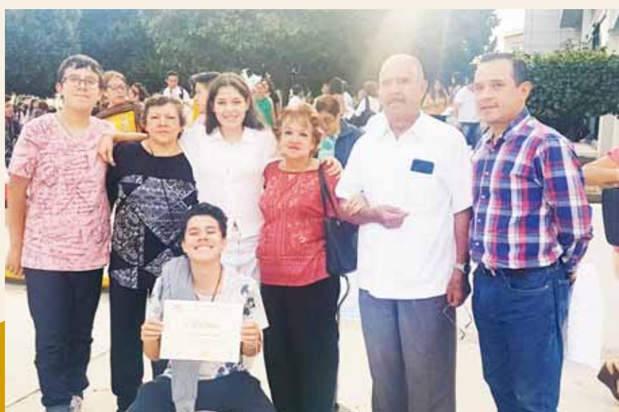
Su familia compartió la alegría de este logro.

La joven, que actualmente cursa el 5º año de medicina, estuvo acompañada de sus papás, abuelos y hermanos, que acudieron para presenciar este importante momento en su vida académica. ¡Enhorabuena!