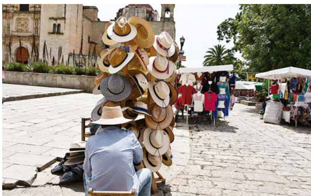
► El ambulante después de la Guelaguetza creció en el Centro Histórico.

"Esta situación afecta mucho a la economía de los que cumplimos con los pagos de impuestos, esto no solamente se da en el Centro Histórico sino en toda la ciudad, donde también se han dispa-