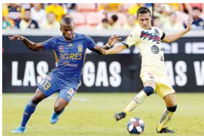
► El cotejo se fue empatado al término de la primera mitad.

que el arquero Nahuel Guzmán no pudo detener.