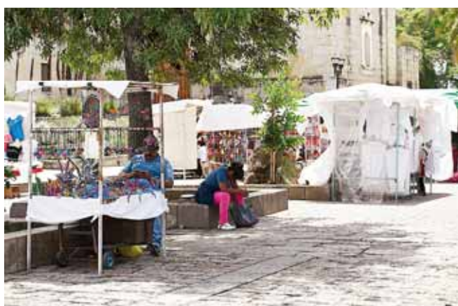
► Llaman a las autoridades para implementar acciones efectivas.