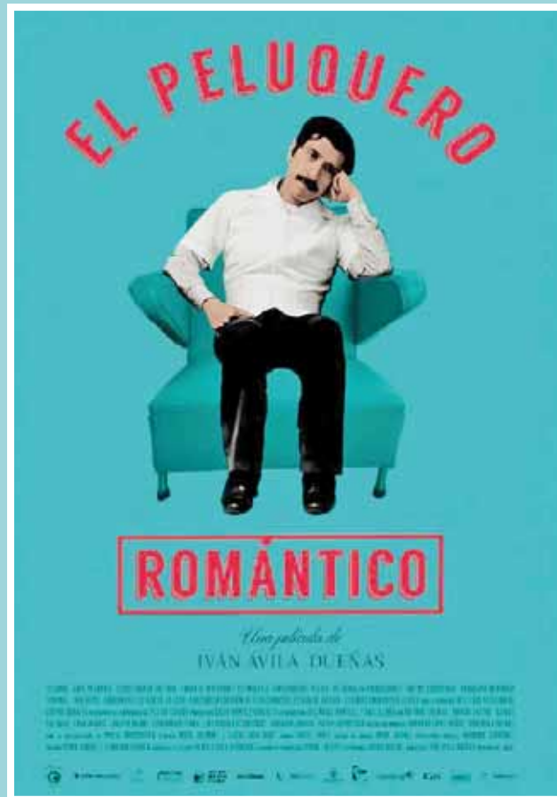
► La cinta se estrenó en la ciudad de Oaxaca a través de OaxacaCine.

Espero que sí, intento que sí. De entrada, no pretendo hacer una comedia, pero sí el drama de una persona en un proceso de restauración, pero con todo el humor, porque los mexicanos usamos el humor para muchas cosas, sobre todo en el contexto masculino, en el proceso masculino de la amistad, la carrilla forma parte fundamental. Es tratar de encon-