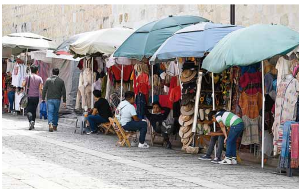
► Han denunciado el aumento de robos a comercios y asaltos a peatones.