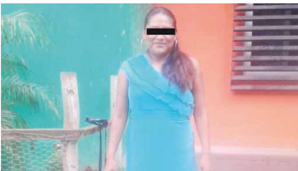
► La mujer había desaparecido, después fue localizada muerta.

los hechos, sin embargo, no presentó pruebas a su favor, motivo por el que el Ministerio Público reforzó lo dicho del menor con dictámenes médicos, y al presunto culpable se le dictó formal prisión.