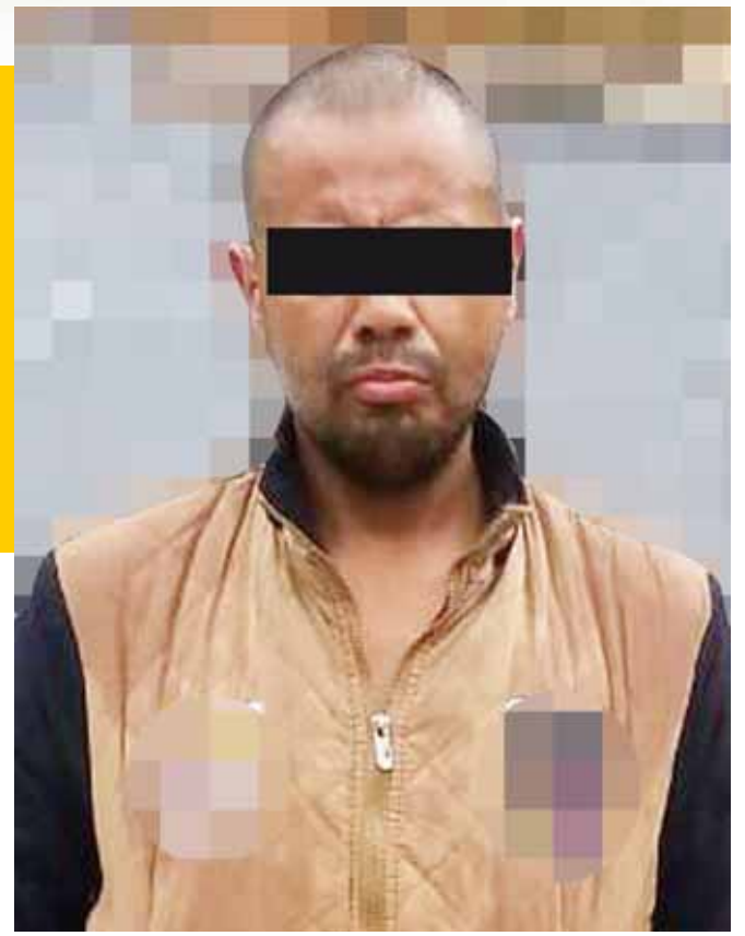
► El hombre es acusado de matar a su papá salvajemente.

Los agentes al indagar con los vecinos sobre la identidad del agresor, nadie supo dar razón y sólo dijeron que escucharon los gritos del maestro que fue lo que los alertó, pero al continuar con las investigaciones los agentes después de varios días del crimen lograron establecer