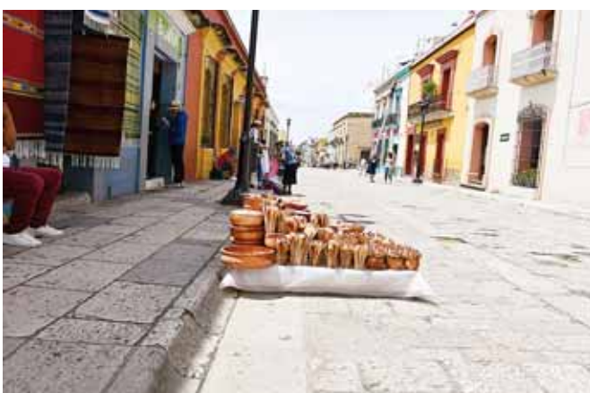
► Varios de los productos comercializados son chinos.

Ante esta situación, hizo un llamado a las autoridades para implementar acciones efectivas para combatir y prevenir la delincuencia. "Hemos platicado con los policías, pero ellos refieren que no tienen las herramientas necesarias para poder operar, por eso deben de trabajar mucho más en la prevención del delito y reactivar las cámaras de seguridad que se encuentran en el Centro Histórico que se quedaron inservibles desde hace muchos años", apuntó.