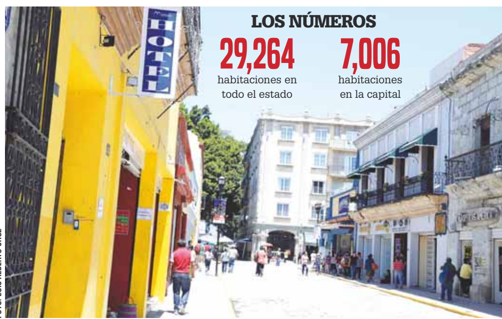
► Oaxaca requiere de más capacidad hotelera, principalmente de gran turismo.

"No podemos precisar el número exacto de habitaciones faltantes porque estamos al límite y se cubre la actual demanda, pero en caso de grandes convencio-