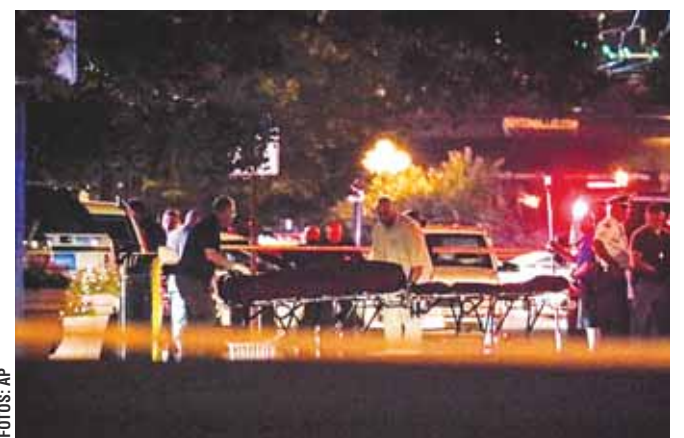
► DAYTON, OHIO: 10 MUERTOS