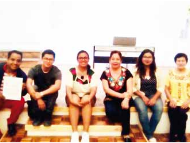
► La música y el altruismo se unieron en Huajuapán.

enesena@imparcialenlinea.com / Teléfono 501 83 00 Ext. 3172