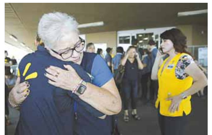
► EL PASO, TEXAS: 20 MUERTOS