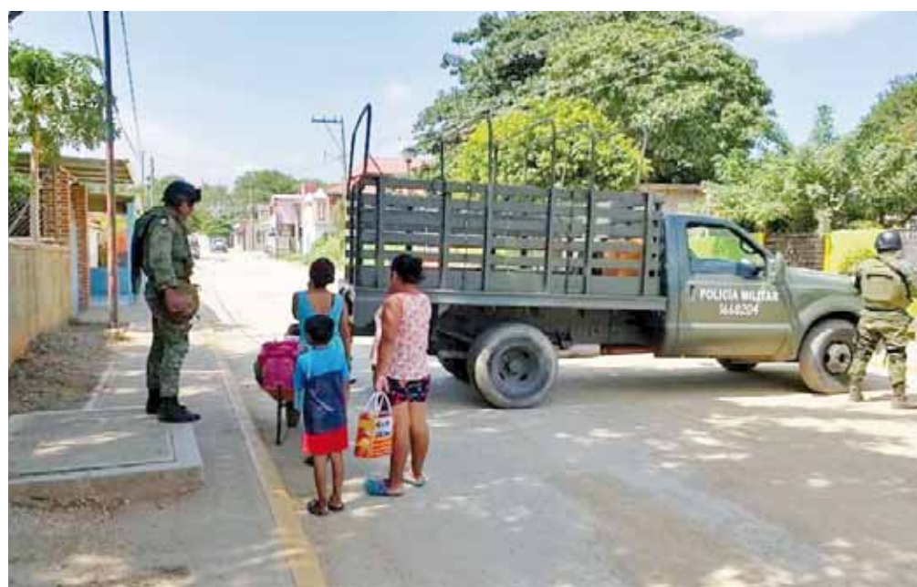
► En Santa María Petapa iniciaron los operativos por los últimos hechos violentos en el lugar.

LO ABSOLVIERON POR MUERTE DE UN PROFESOR