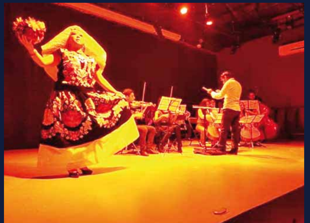
► Hace dos años se conformó el Ensamble Dacapo.

Ejecución de Instrumentos Orquestales del Instituto Superior de Música del Estado de Veracruz (ISMEV).