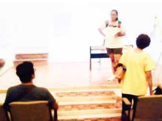
► Invitan a participar a las personas interesadas en el canto.

Por último, invitó a la población a que se acerque y viva la experiencia del canto. Los interesados pueden acercarse al auditorio del Museo Regional, ubicado en la calle Indio de Nuyoó, en el centro de Huajuapán, talleres que tienen un donativo, finalizó.