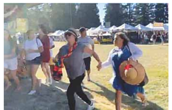
► GILROY, CALIFORNIA: 4 MUERTOS