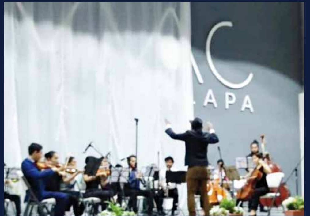
► Esta presentación fue como parte de un intercambio cultural.