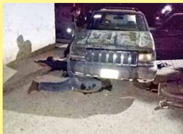
► La masacre consternó a propios y extraños.

ejecutado ayer por la tarde, cuando este se encontraba frente al negocio de