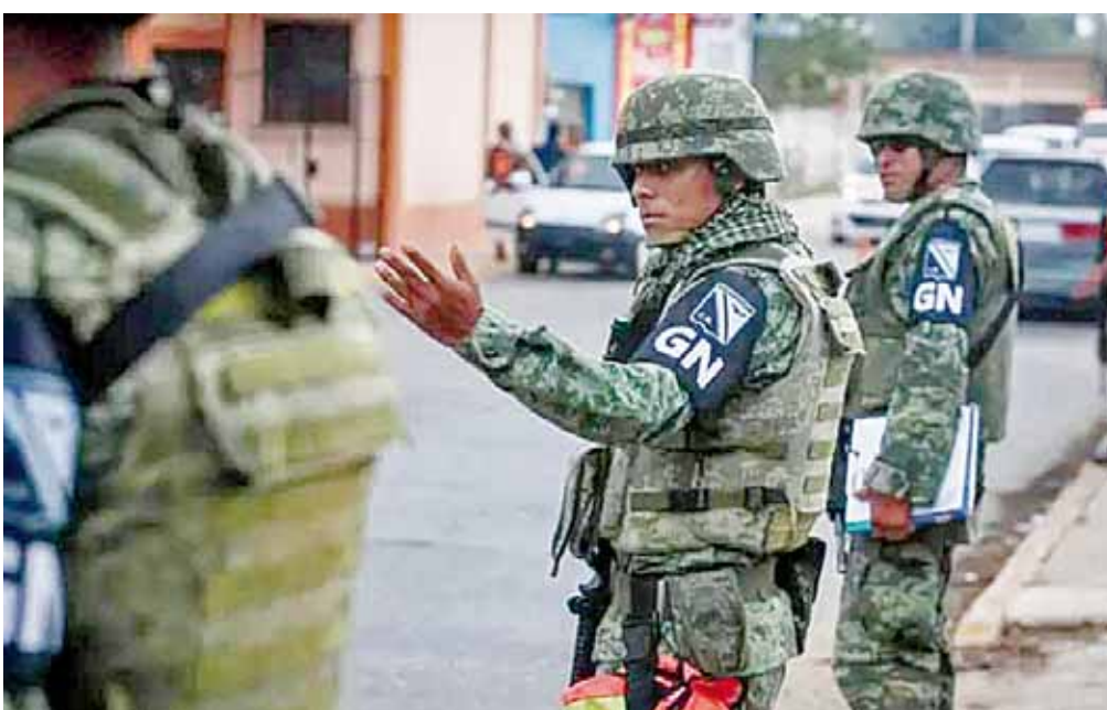
► Elementos de la Guardia Nacional iniciaron con sus acciones en la región del Istmo.

policiaca@imparcialenlinea.com / Teléfono 501 83 00 Ext. 3176