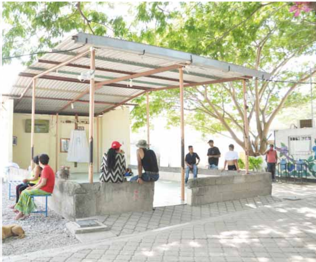
► Cada día llegan menos migrantes centroamericanos al albergue “Hermanos en el Camino”, en Ciudad Ixtepec.

Istmo de Tehuantepec, atraviesa el tren conocido como La Bestia, en cuyo lomo transitan cotidianamente cientos de personas, desde niños, niñas, bebés, hasta personas ancianas.