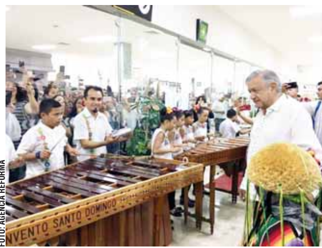
► El presidente Andrés Manuel López Obrador arrancó este fin de semana una gira por hospitales rurales del IMSS de Chiapas, Oaxaca y Veracruz. Ayer visitó la comunidad chiapaneca de Bochil.