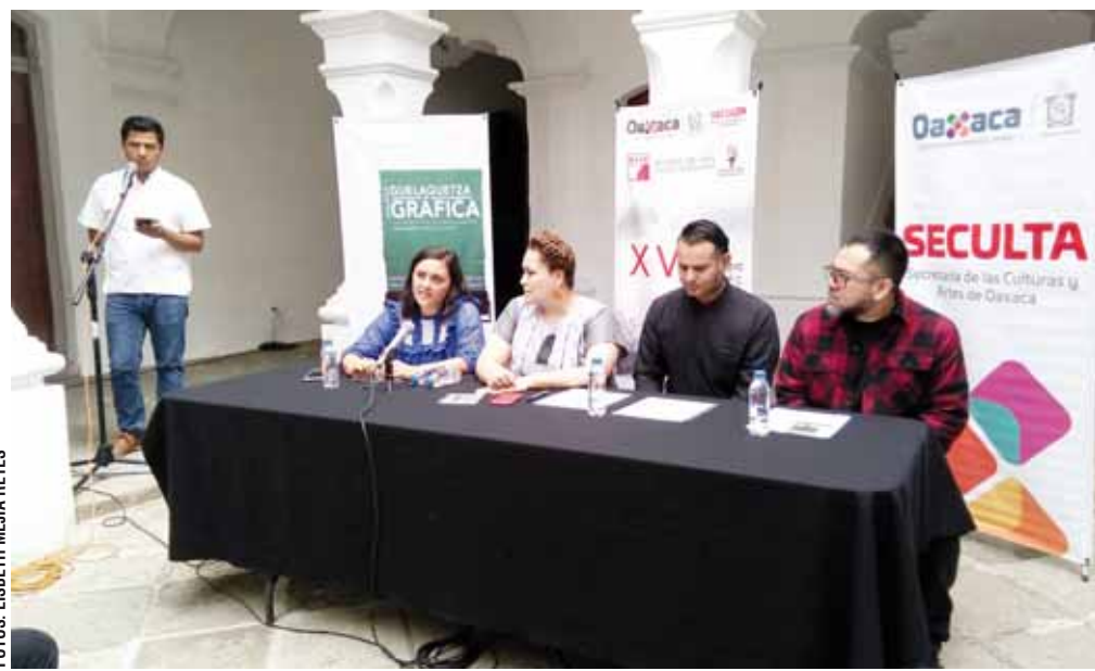
► En conferencia de prensa dieron a conocer los detalles de la programación.