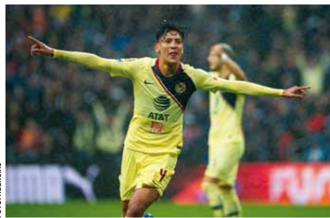
► Vestirá la camiseta de las Águilas por última vez hoy.

El América confirmó ayer la venta del futbolista de 21 años al Ajax de Holanda, club en el que jugará cinco temporadas y que convertiría al canterano azulcrema en una de las exportaciones más caras del futbol mexicano luego de supuestamente ceder 17 millones de dólares, un millón más