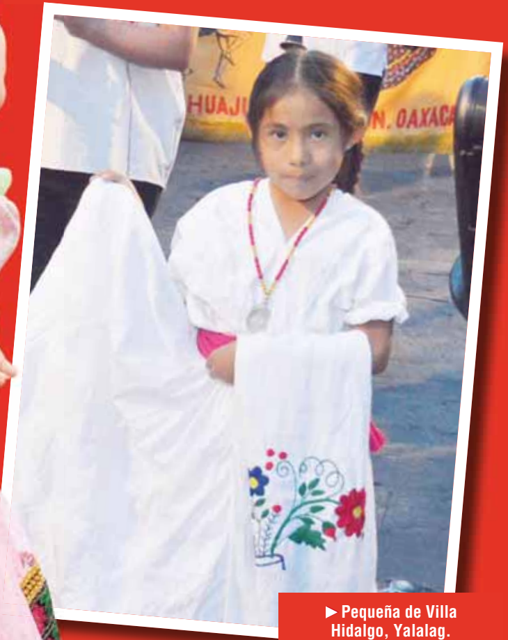
► Pequeña de Villa Hidalgo, Yalalag.