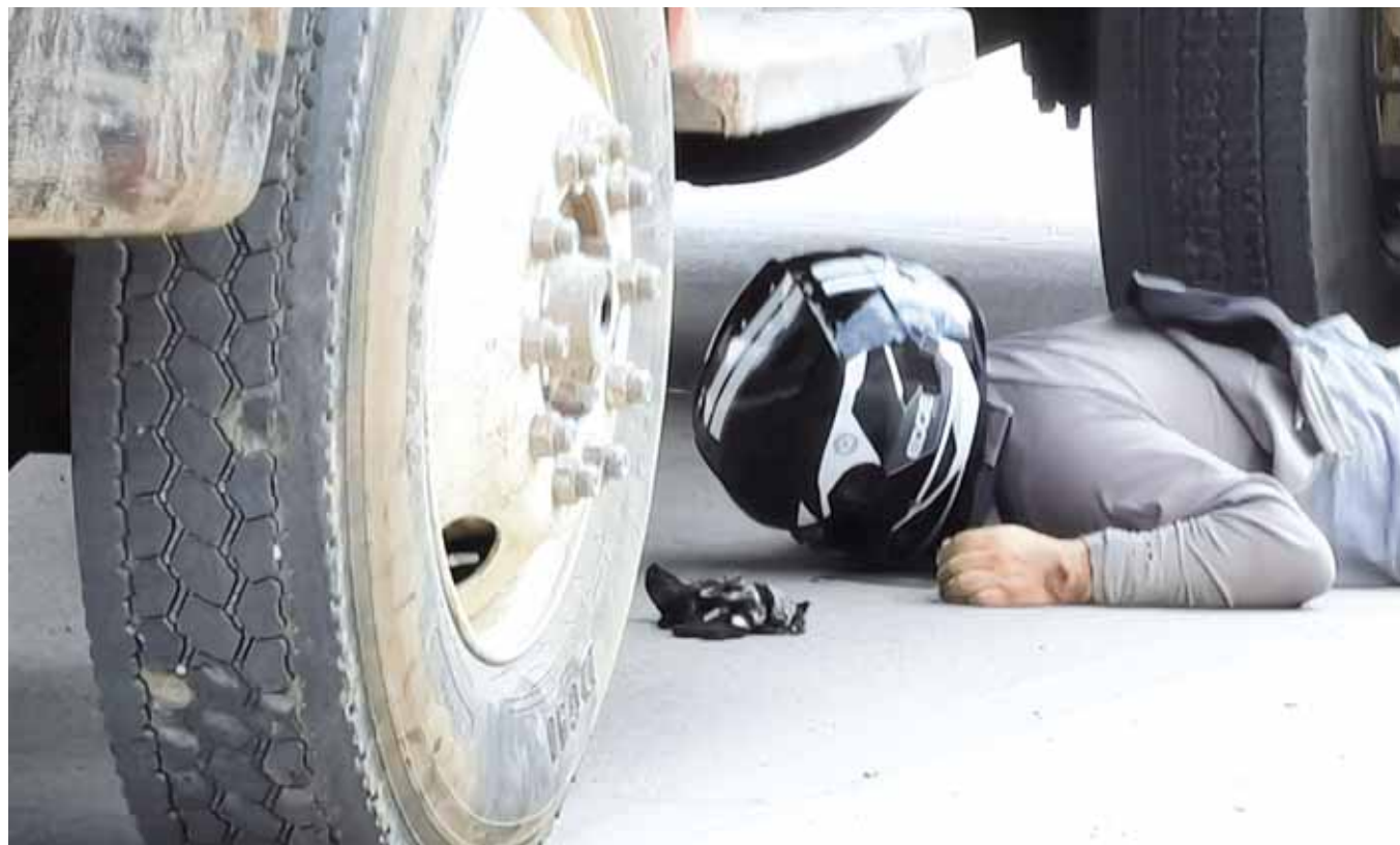
► La víctima murió al instante cuando se dirigía a su domicilio

Según reportes, el joven circulaba sobre la calle de Fresnos a bordo de una motocicleta de color blanco