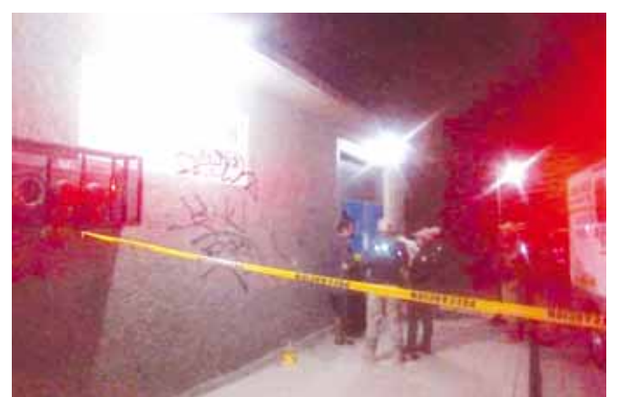
► En este lugar fue el violento atraco.

General del Estado de Oaxaca abrió la carpeta de investigación por el delito de homicidio en contra de quien o quienes resulten responsables.