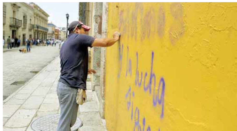
Diversas organizaciones ocasionan pintas en edificios históricos.

80 viviendas catalogadas en la ciudad están en mal estado