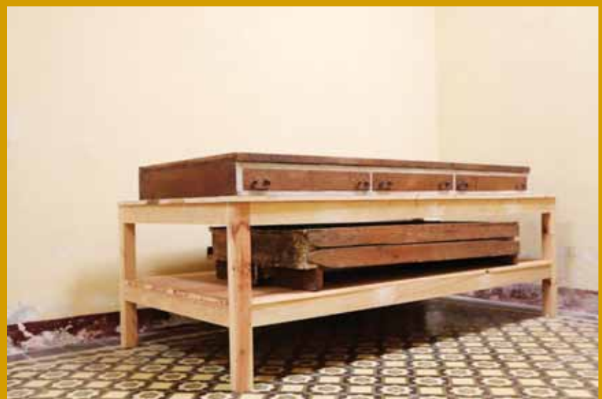
▶ Estuvo casi 20 años en la ciudad de Puebla.