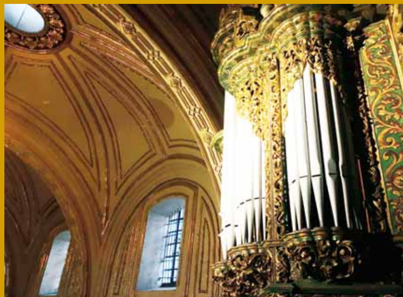
▶ Órgano histórico de la Basílica Menor de Nuestra Señora de la Soledad.

Winter añadió que el 'secreto' original permaneció en Puebla desde el año 2000, tras concluirse el proyecto de la res-