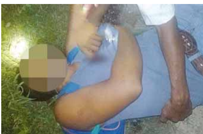
► Un joven fue asesinado en Tapanatepec.