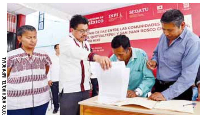
Apenas el 8 de febrero de este año, las autoridades habían firmado un acuerdo de paz.

En las últimas décadas, un añejo conflicto agrario entre San Miguel Quetzaltepec y San Juan Bosco Chuxnabán, en la región mixe, derivó en enfrentamientos, violencia, tensión permanente y ruptura del tejido social. En distintos momentos, permaneció bloqueado el camino de terracería que comunica a ambas comunidades con el resto de la región; es vía de salida a la capital estatal y permite la comunicación con el Istmo