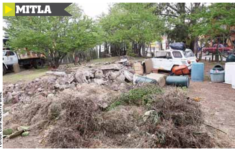
En la zona arqueológica de Mitla se percibe el abandono.

Las carencias abarcan las zonas arqueológicas más importantes como Monte Albán, Mitla, Yagul, Teposcolula, entre otros, lo que queda de manifiesto en un diagnóstico que realizaron los trabajadores y que entregaron a las auto-