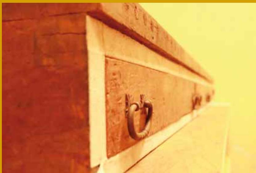
▶ Caja de vientos original del siglo XVIII.

El órgano fue restaurado en la década de los noventa del siglo pasado gracias al apoyo de Fomento Cultural Banamex con el fin de devolverlo en lo posible a su estado original.