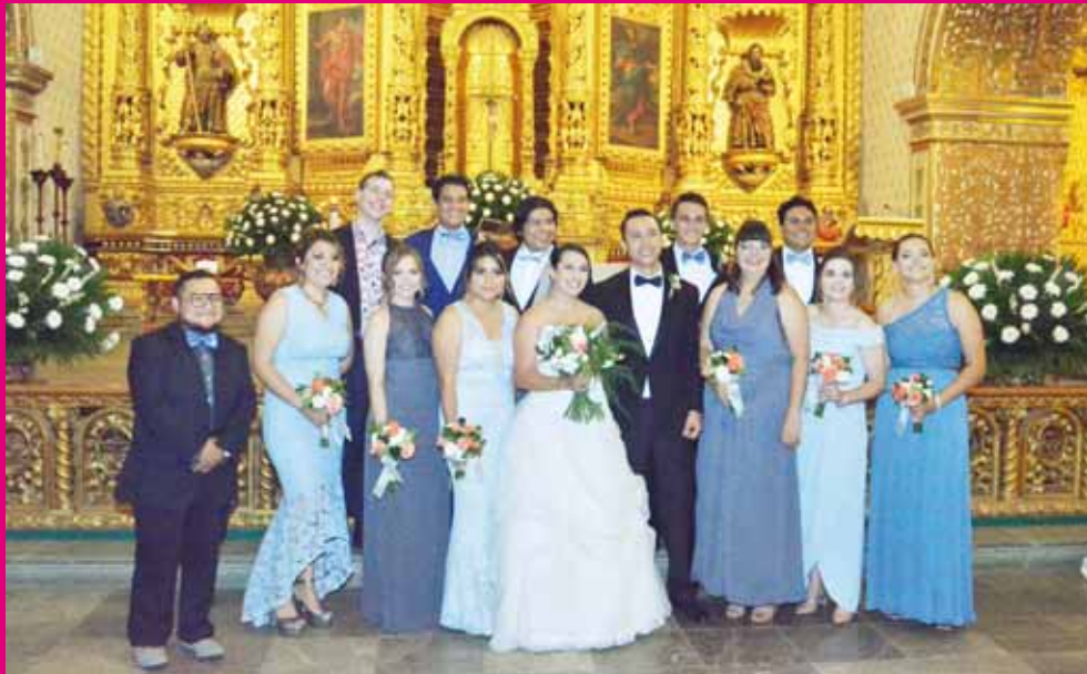
► El nuevo matrimonio junto a sus más allegados.

estilo@imparcialenlinea.com / Teléfono 501 83 00 Ext. 3171