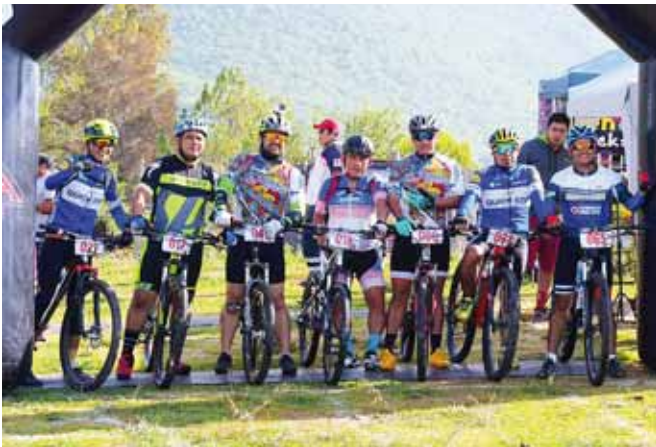
► Los pedalistas desafiaron los 24 kilómetros de senderos, ascensos y descensos de la ruta.

De ahí dieron la vuelta a la altura del mercado de la en esa comunidad zapoteca, siguieron por una recta de unos 10 kilómetros hasta llegar a un arroyo y más adelante hacia la comunidad de