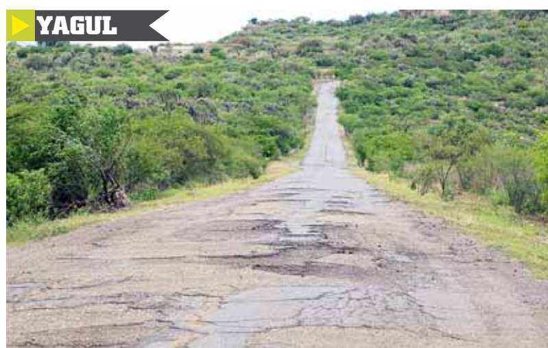
La carretera que lleva a Yagul, sin mantenimiento.