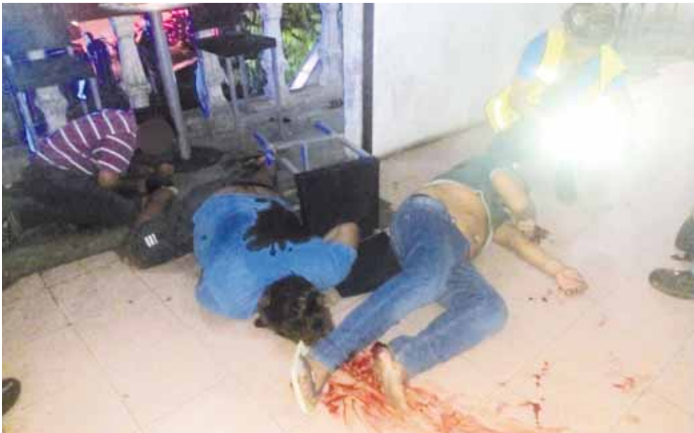
► Dos cuerpos quedaron tirados al interior del antro.

policia@imparcialenlinea.com / Teléfono 501 83 00 Ext. 3176