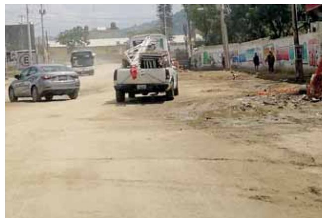
La avenida se encuentra llena de baches.

Algunos inmuebles se encuentran en proceso legal; por ello, están abandonadas o simplemente porque sus propietarios no cuentan con recursos para intervenirlas, pues para poder rehabilitar las casas es un proceso muy largo, se tienen que pagar los derechos ante las instancias municipales y, posteriormente, el trámite ante la instancia federal.