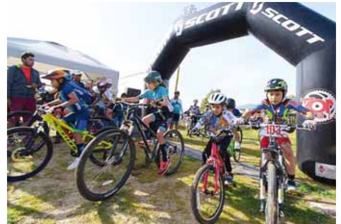
► Las categorías menores también tuvieron participación en el maratón.