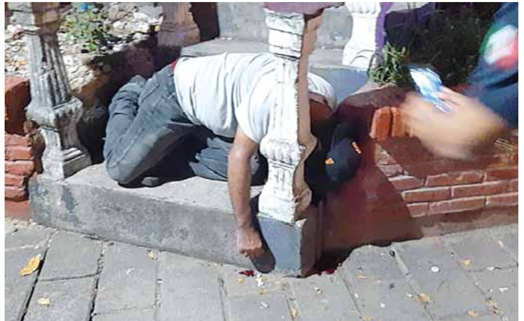
► Una víctima fue abatida en las escaleras.