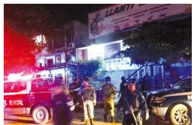
► Elementos policiacos arribaron a la zona.