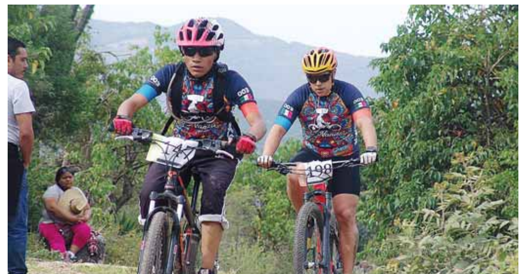
► El equipo Ay Nanita Cycling Team fue el anfitrión de la justa ciclista.