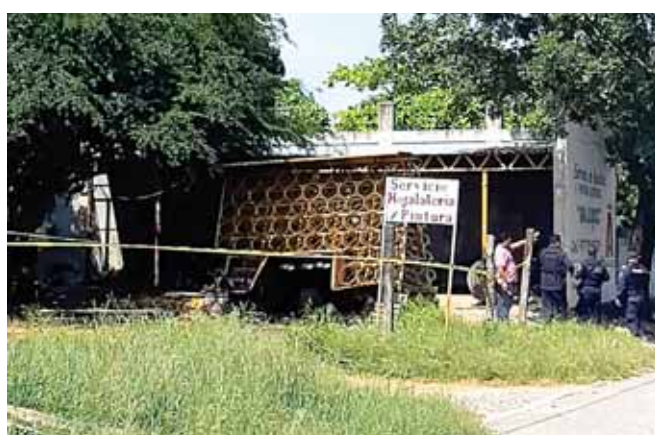
► En este taller de Salina Cruz mataron a cuatro.