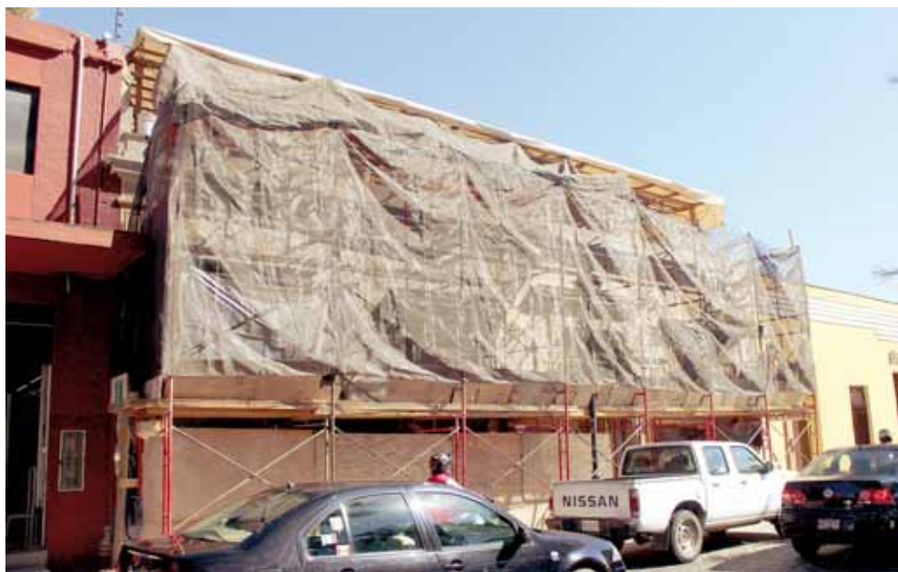
Los inmuebles en mal estado podrían provocar la revocación de denominación de patrimonio.

Recordó que esto ya sucedió con la ciudad de Dresden, Alemania, donde la UNESCO decidió retirar la declaración debido a una serie de agravios y la falta de atención a las recomendaciones. “Lo mismo puede suceder con nuestro país, donde también la desbordante presencia de ambulantes está afectando y coloca en riesgo nuestra denominación”.