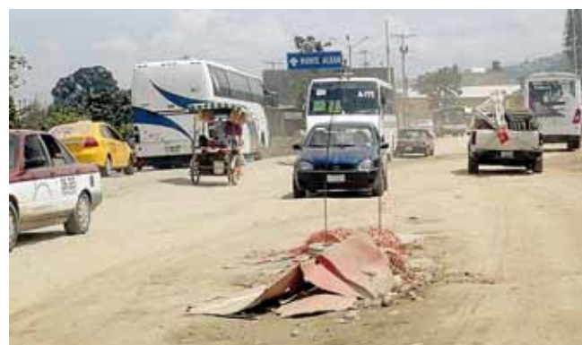
Las obras no se han podido concluir desde el año pasado.