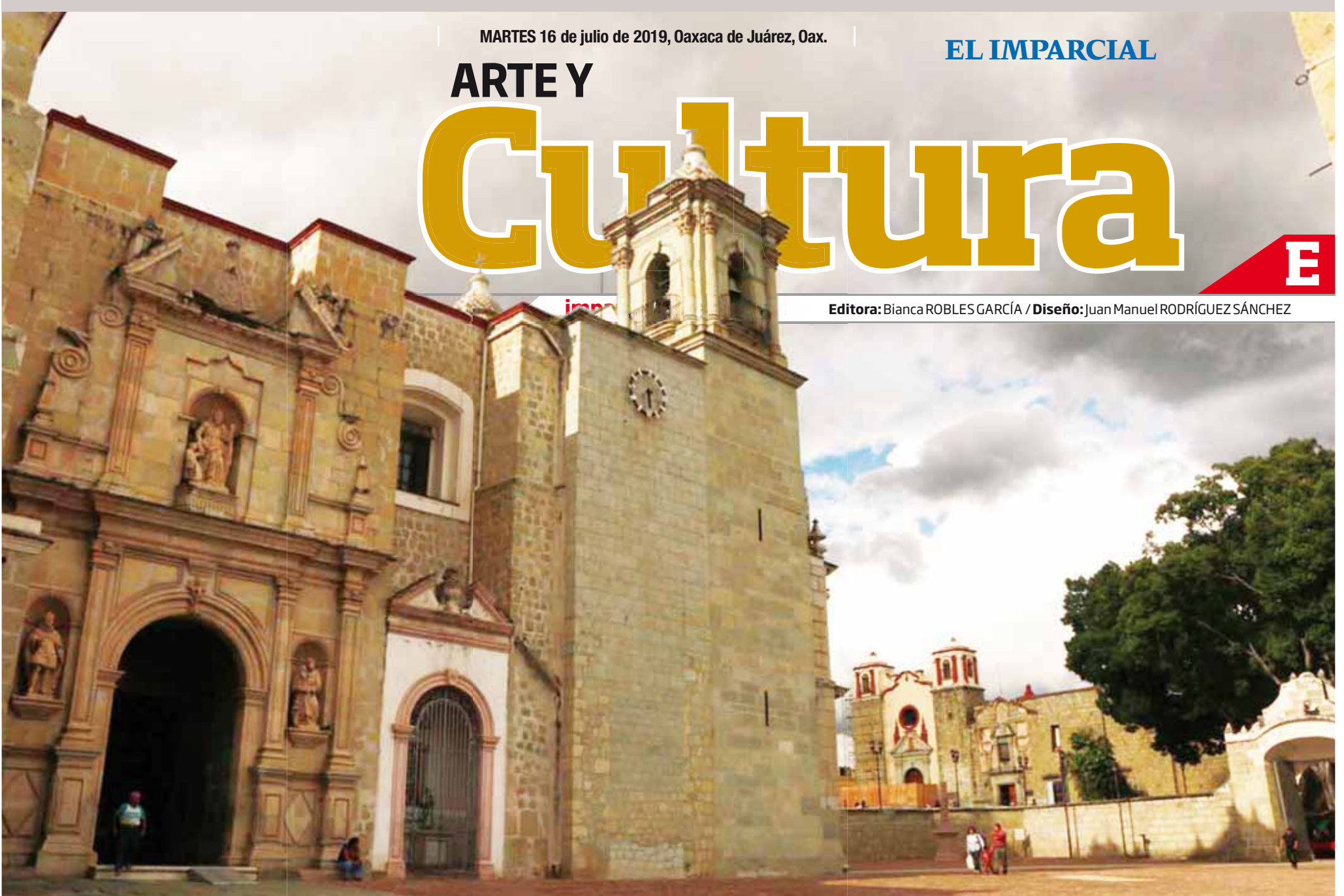
▶ Basílica Menor de Nuestra Señora de la Soledad.