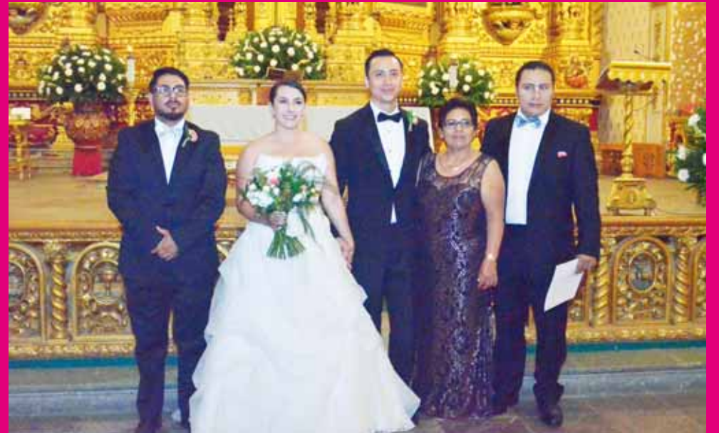
► La pareja estuvo acompañada de su familia.