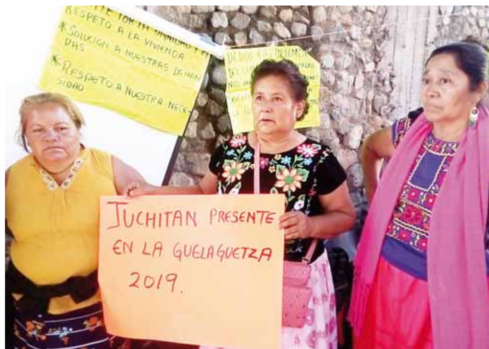
► Alrededor de 5 mil 500 personas no han recibido sus apoyos.

Informó que las personas que fueron tomadas en cuenta en este segundo censo son alrededor de 5 mil 500 y a la fecha no han recibido sus apoyos. “Mucha gente sigue viviendo en la intemperie, duermen entre cartones y