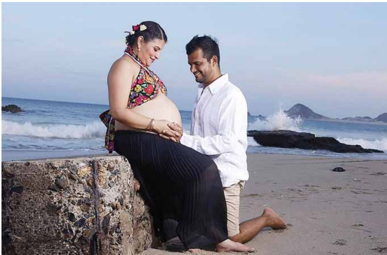
► Los futuros padres en la dulce espera de su bebé.