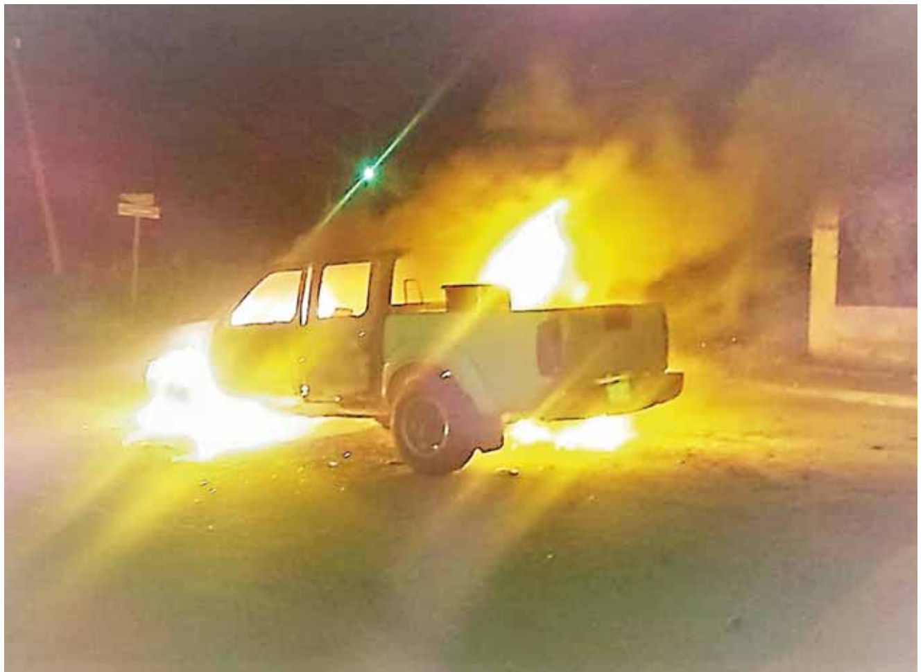
► La unidad fue consumida por el fuego.

Ante estos hechos la ciudadanía está consternada, ya que aseguran que la seguridad no le importa