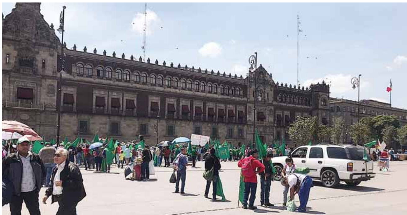
► Se manifestaron frente al Palacio Nacional.

Mencionó que, en esta ciudad, existen más de diez mil Integrantes de Antorcha Campesina, a pesar de los embates que ha recibido del presidente Andrés Manuel López Obrador, no se ha están desintegrando ni mucho menos decayendo en su lucha social.