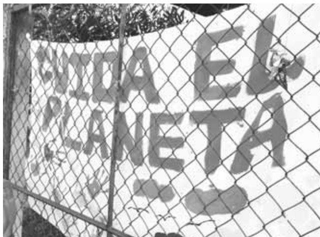
► Contribuyen con pequeñas acciones.