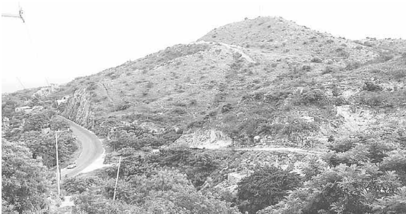
► La colonia Linda Vista trabaja para sobresalir.

A esta capacitación asistieron las representantes de las Instancias Municipales de Huamelula, Tehuantepec, Huilotepec, Unión Hidalgo, sin faltar Salina Cruz.