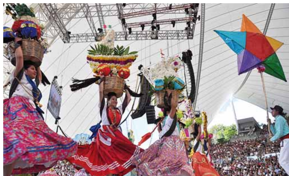
► Las Chinas Oaxaqueñas mostraron lo mejor del estado.

Miles fueron testigos de "El rapto y la llevada del baúl" con Chicapa de Castro, que por más de 10 minutos mostró a los asistentes aquel acto donde el