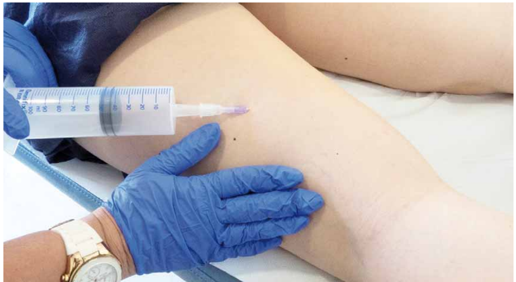
► Los tratamientos médicos son gratuitos.

Una mezcla de ozono y oxígeno que se puede aplicar a través de la sangre o