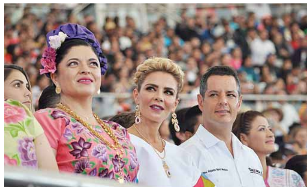
► El Gobernador Alejandro Murat y su esposa Ivette durante el Primer Lunes.