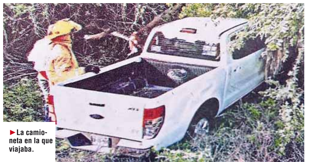
► La camioneta en la que viajaba.

El "Chico Wini" era muy apreciado y querido en ese lugar, por eso todos lamentan esta irreparable pérdida.