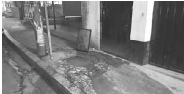
► Las coladeras están tapadas.

Ya son cuatro las ocasiones en lo que va del año que el personal de Obras Públicas labora en el lugar para desazolvar el drenaje que se tapa a consecuencia