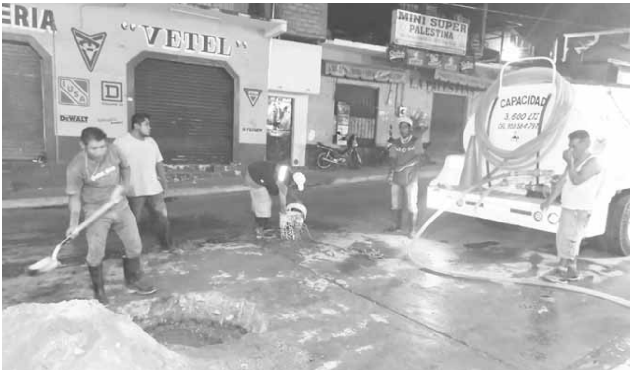
► Los trabajos se realizan de noche, por el fuerte olor que despiden.