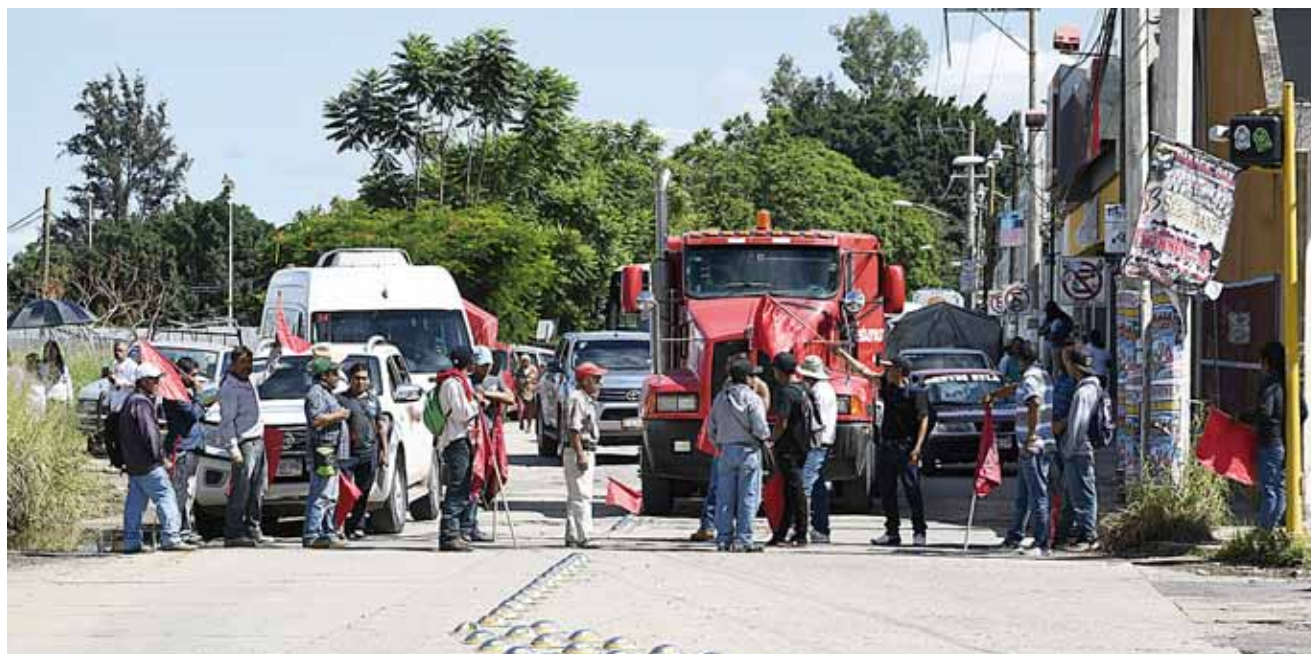
► En la capital del estado también protestaron.