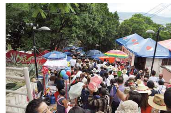
► Buscan hacer negocio.

Por su parte, personal de la Profeco recorrió todos los puestos que se instalaron desde la calle de Crespo hasta el Auditorio Guelaguetza, esto como parte del operativo de Verificación y Vigilancia "Vacaciones de Verano 2019", que se implementa en los principa-