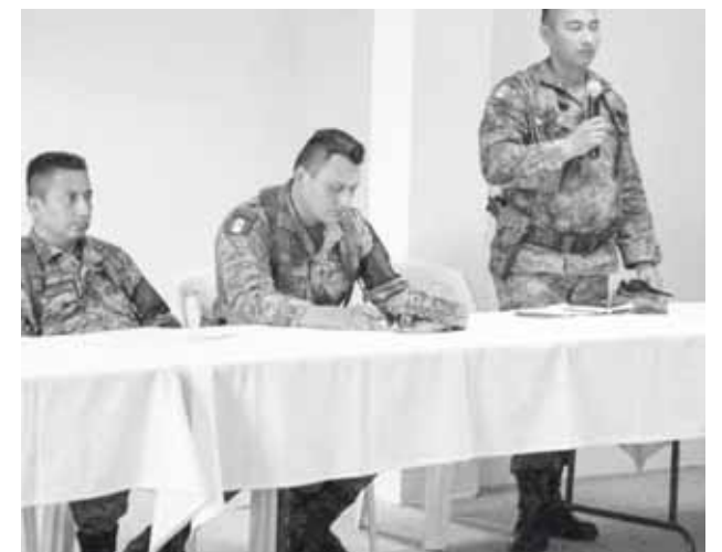
► En agosto próximo se impartirá un curso de capacitación básica a funcionarios.

Al finalizar el encuentro, se acordó que en la siguiente sesión, prevista para llevarse a cabo durante la última semana de agosto próximo, se impartirá un curso de capacitación básica a funcionarios públicos, voluntarios y elementos de la Secretaría de Defensa Nacional (SEDENA), Guardia Nacional y la Secretaría de Marina para el combate de incendios forestales.