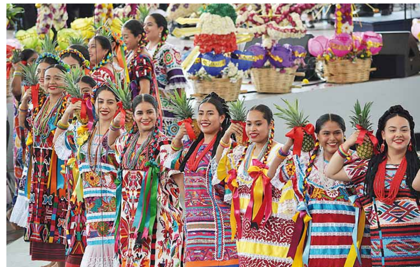
► La Delegación de Flor de Piña y sus hermosas mujeres.

La Danza de la Pluma de la Villa de Zaachila, la boda pochutleca de San Pedro Pochutla, Flor de Piña de San Juan Bautista Tuxtepec y la bajada de la flor de la montaña en honor a San Pedro Mártir, de San Pedro Comitancillo también hicieron vibrar el auditorio, donde los aplausos, gritos y alegría no cesaron en ningún momento.