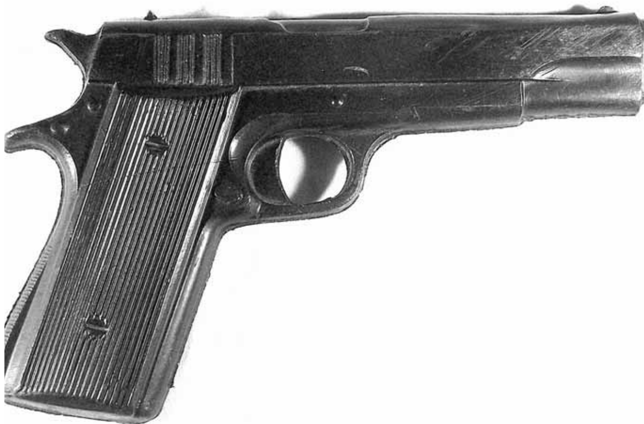
► La pistola utilizada era de juguete.

na droga, arribó frente al palacio municipal con pistola en mano, amenazando a la policía, por lo que los elementos de seguridad al verlo armado pidieron apoyo y gracias a la oportuna intervención de la Policía Estatal lograron asegurarlo, para luego darse cuenta que la pistola era de juguete, de las que disparan aire comprimido, por lo que fue detenido en la cárcel municipal para que sea presentado ante las autoridades correspondientes a fin de llamarle la atención por su actitud, y a su vez requerir a sus padres para darle por enterado sobre el delito que incurrió su hijo.