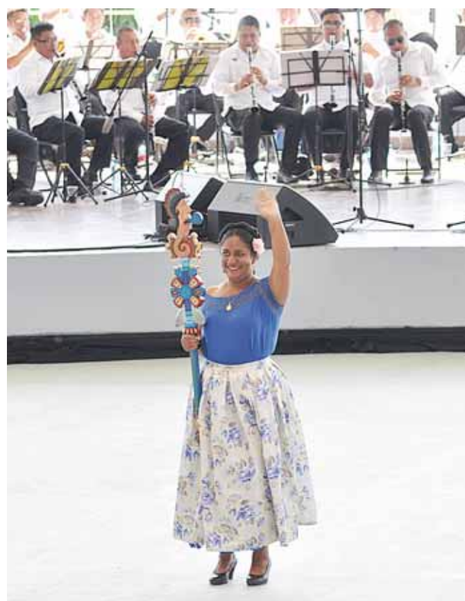
► La Diosa Centéotl dio la bienvenida.

novio convence a la mujer para fugarse a la casa de él, simulando un rapto. Posteriormente se efectúa la boda y se lleva el baúl a la casa del novio, obsequiado por la mamá de la novia.