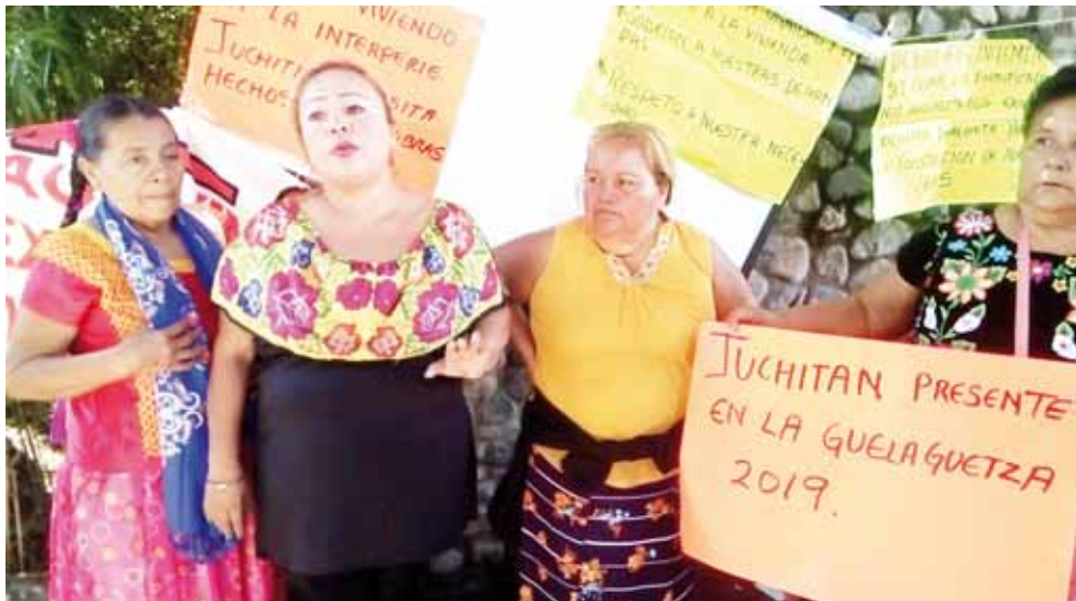
► Llamaron la atención de las diferentes instancias gubernamentales.