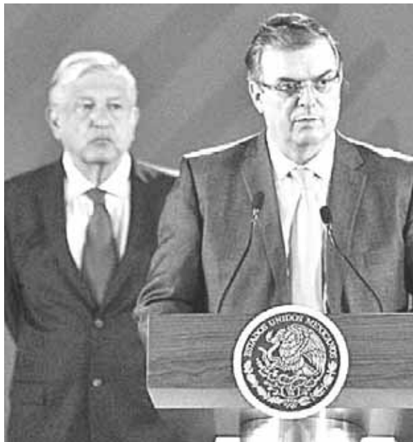
► El secretario de Relaciones Exteriores, Marcelo Ebrard, durante la conferencia de prensa matutina del presidente Andrés Manuel López Obrador.

que ante el reporte que se tiene de un incremento en los decomisos de armas, particulares rifles asalto -que creció en un 122 por ciento-, México planteó la necesidad de instrumentar un operativo conjunto, cada gobierno en su territorio, para detener el flujo de armamentos que ingresa a México de forma ilegal. Se entiende que en Estados Unidos estas armas pueden adquirirse legalmente pero en México eso es ilegal.