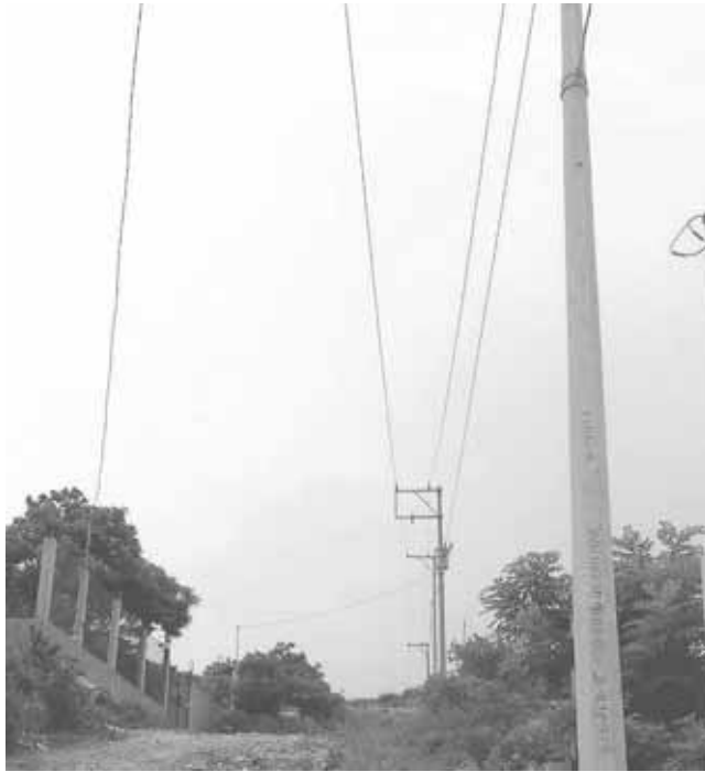
► Los colonos han buscado apoyos para lograr tener electrificación.

Este asentamiento de nueva creación enfrenta una serie de carencias, pero aun