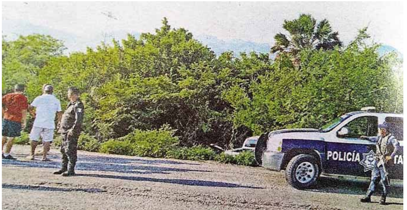
► Policía y familiares arribaron al lugar.

Después de los trámites de rigor, el cuerpo fue reconocido y entregado a sus familiares, quienes lo