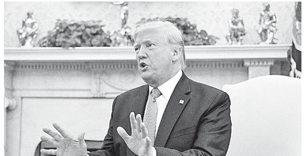
► Donald Trump busca evitar el desarrollo de una bomba atómica por Irán.

El multimillonario republicano, que retiró a su país del acuerdo internacional de 2015 para evitar el desarrollo de una bomba atómica por Irán, que consideraba demasiado laxo, no ha dejado de endurecer las sanciones contra el régi-