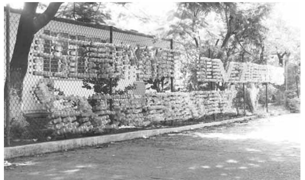
► Los alumnos participan en el taller de reciclaje.

"Esta idea surgió precisamente porque en esta escuela se fomenta el reciclaje y pensé que se podría hacer un letrero en donde estuvieran el nombre y datos de la escuela y a la vez ayudaríamos al reciclaje, sobre todo porque ya lo había visto en otra escuela y se podía imple-