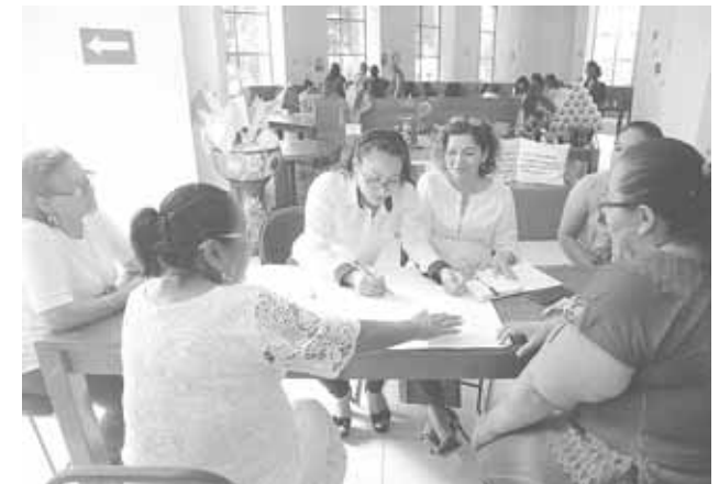
► Se capacitaron a mujeres de Salina Cruz.

Así como esta colonia, dijo hay otras más que demandan mejores servicios, aclarando que no es en esta administración que no le haya cumplido, sino que se viene arrastrando de hace años esta falta de atención municipal.