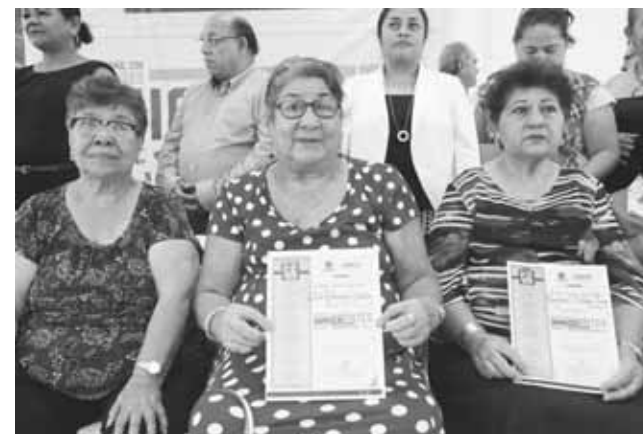
► Se les hizo entrega de un reconocimiento.