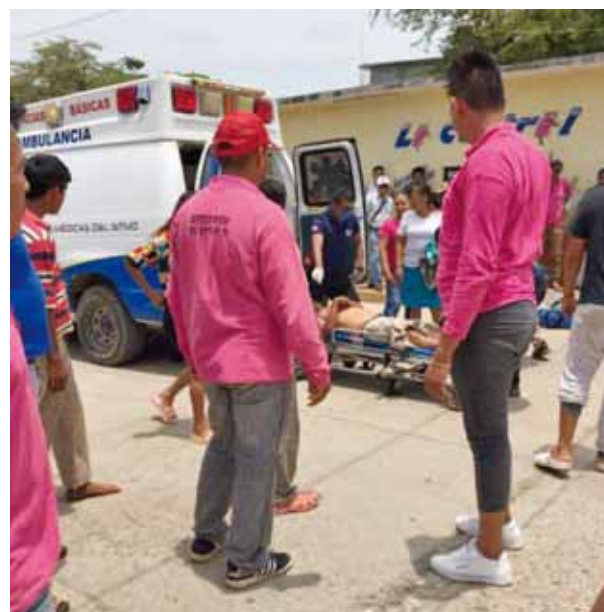
► El conductor fue trasladado al hospital.