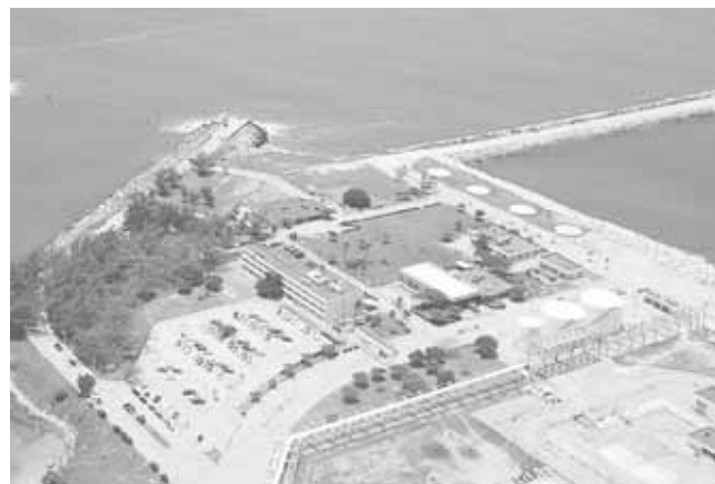
► Se generarían fuentes de empleo.

Aunque una parte importante ya se encuentra invadida por organizaciones sociales, que desde hace