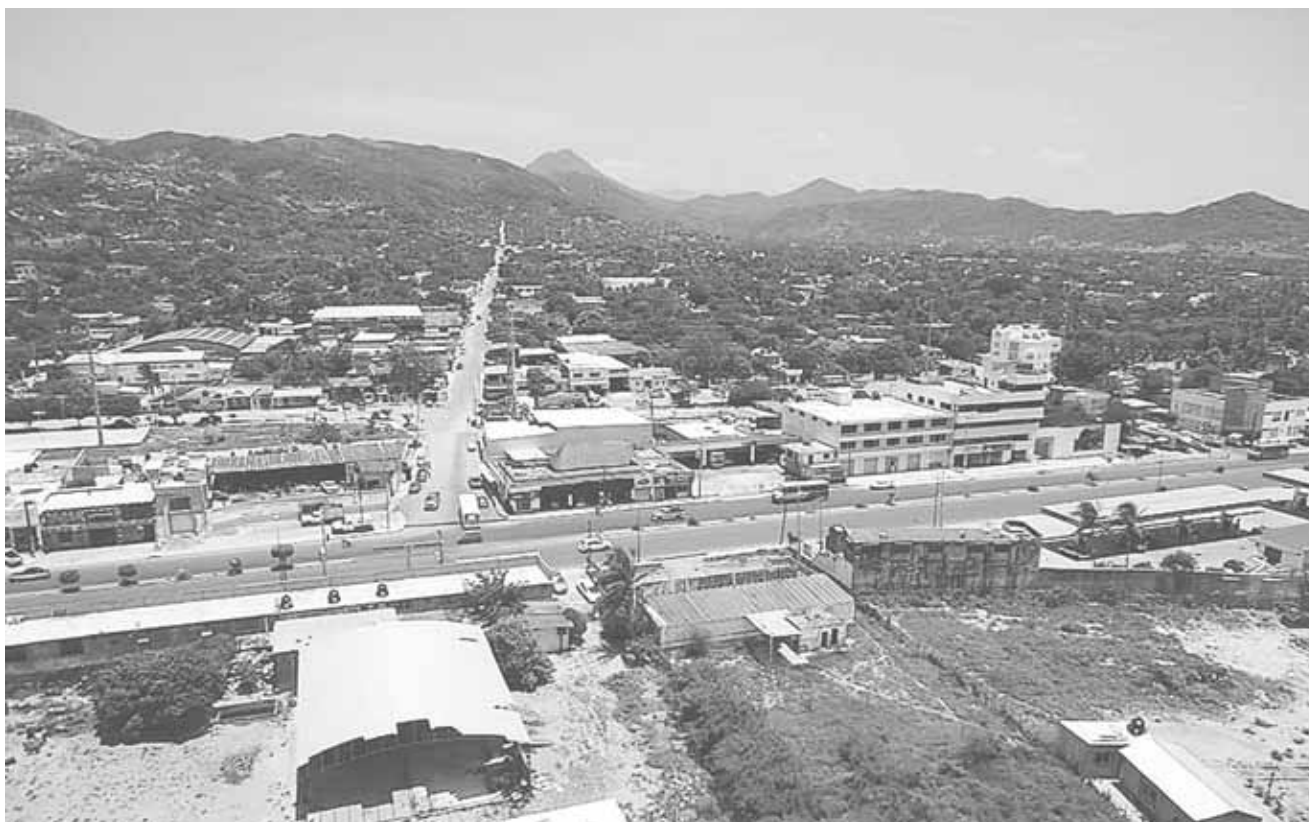
► Boca del Río podría convertirse en una zona industrial debido a un proyecto detonante del gobierno federal.