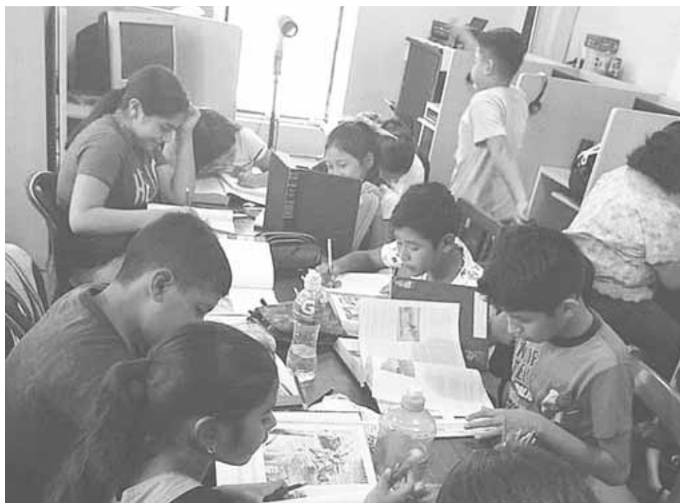
► Los menores aprenden hacer manualidades.

► Los cursos se llevan a cabo en la biblioteca Aries 67.