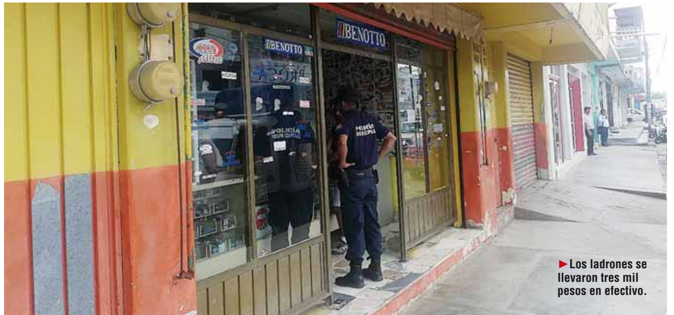
► Los ladrones se llevaron tres mil pesos en efectivo.

Por otro lado, cabe mencionar que otro negocio que se ubica sobre la calle 16 de Septiembre en el centro de la ciudad, también fue visitado, presuntamente por los amantes de lo ajeno, pero no se robaron nada, solo trascendió que el encargado o encargada del establecimiento fueron amenazados, pero las corporaciones de seguridad ni siquiera se dieron por enterados hasta más tarde que acudieron a verificar si había habido algún asalto en ese lugar.