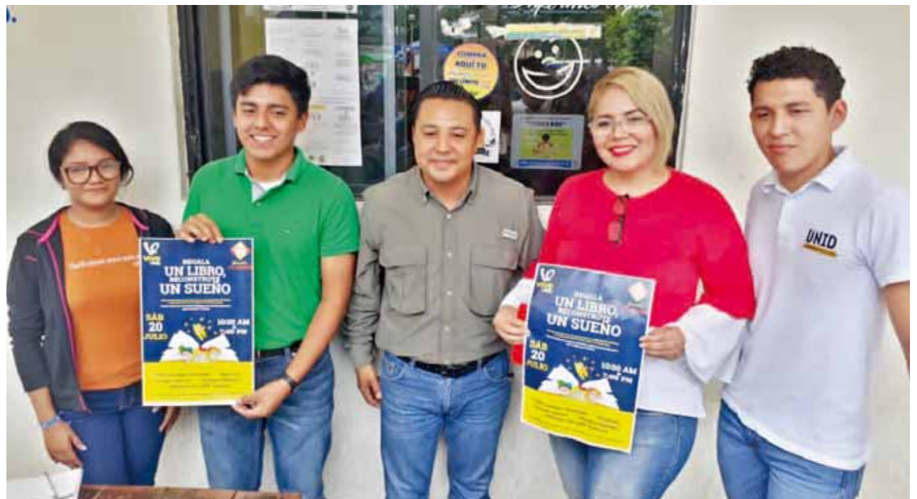
► Los alumnos pretenden obtener 1500 libros para abrir una biblioteca en la comunidad de Camarón Salsipuedes.

Abundó que la meta es llegar a 1500 libros ya que es necesario abastecer la biblioteca en Camarón Salsipuedes, el lema de este librotón es “Regala un libro, construye un sueño” y esperan a que la sociedad les dé una respuesta favorable con este proyecto el cual en caso de cumplir el objetivo pudieran volverlo a realizar para abrir otra biblioteca en otra comunidad.