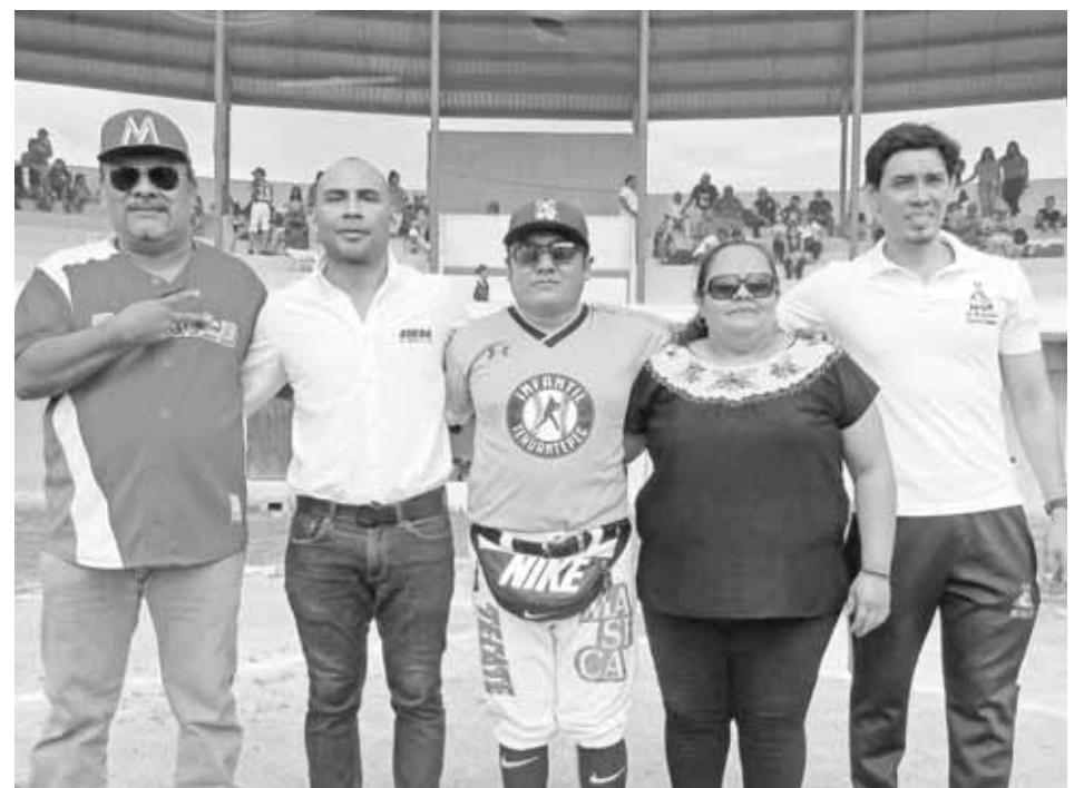
► Invitados de honor.

se enfrentaron Selección IESIT contra Gigantes de Tuxtepec en la categoría Junior con triunfo de los segundos por 6 a 4 y finalmente para cerrar el día se midieron las fuerzas Pingos de Tehuantepec contra Selección IESIT en la categoría Prejunior saliendo empatados con pizarra por 3 carreras a 3.