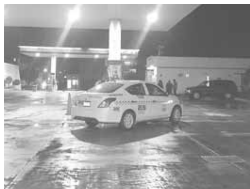
► La unidad involucrada.

Compañeros del atropellado al ver que pasaban los minutos y este no se ponía de pie reportaron el suceso a la línea de emergencias 911, arribando al lugar policías municipales así como paramédicos de la Cruz