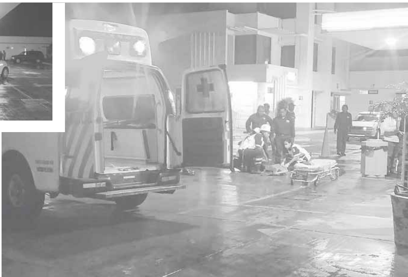
► El lesionado fue trasladado al hospital.

Policías municipales y agentes de vialidad tomaron conocimiento de lo sucedido ordenando que el vehículo tipo taxi del sitio Mazatlán, rotulado con el número económico 205, fuera llevado al encierro oficial en tanto se deslindan responsabilidades.