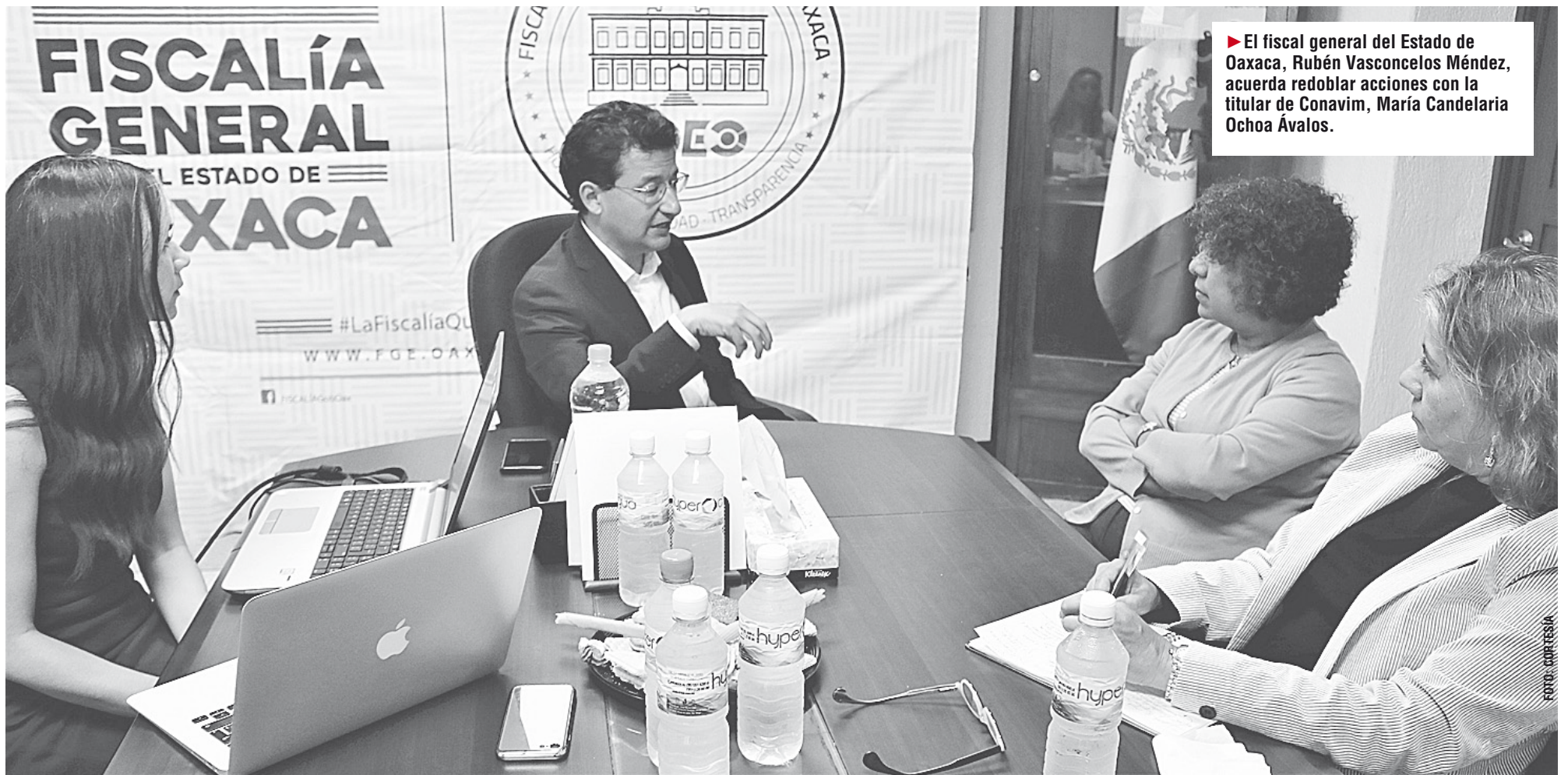
► El fiscal general del Estado de Oaxaca, Rubén Vasconcelos Méndez, acuerda redoblar acciones con la titular de Conavim, María Candelaria Ochoa Ávalos.