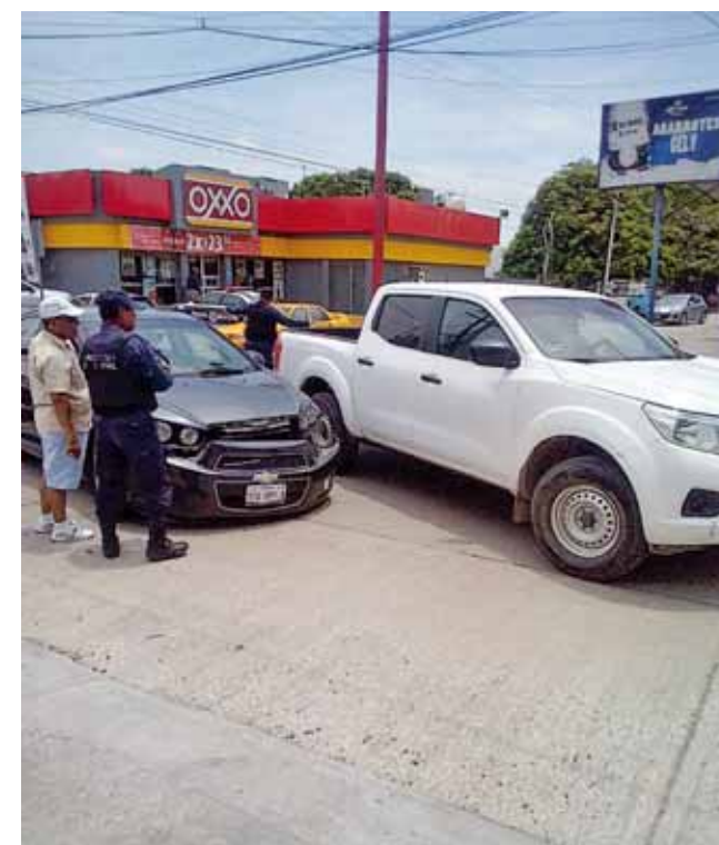
► La Policía arribó al lugar de los hechos.

Cabe resaltar que en este choque no se reportaron personas lesionadas solo cuantiosos daños de cuyo valor se desconoce.