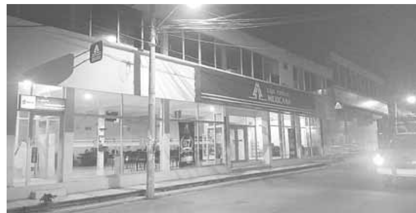
► Durante la noche, una de las puertas del establecimiento se ubica casi esquina con la avenida Mariano Abasolo, se encontraba abierta.

Aunque la alarma nunca sonó, elementos policiacos notificaron poco después que la puerta da el acceso al techo de dicho negocio, y