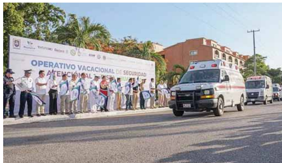
► Alrededor de 300 personas que participan para resguardar y brindar seguridad a los paseantes.