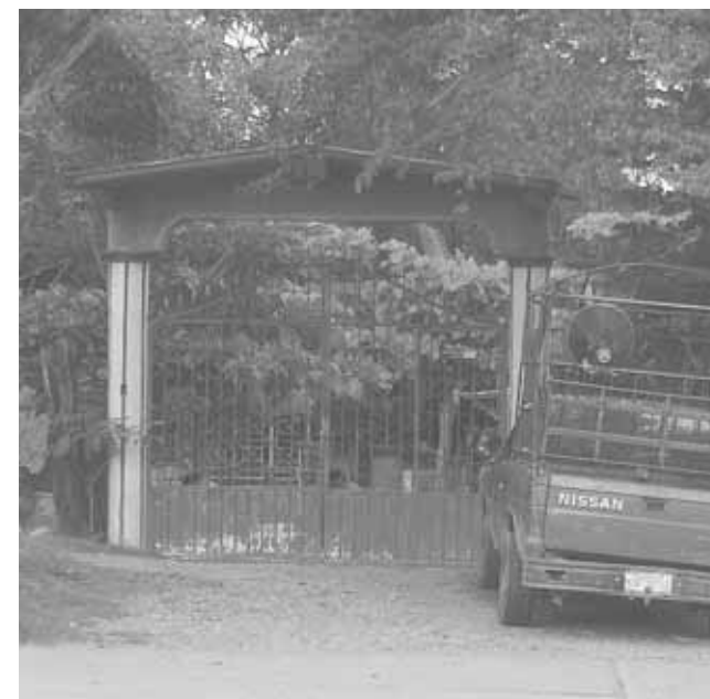
► La orden de aprehensión se ejecutó el pasado jueves las 14:30 horas sobre la calle 16 de Septiembre.

Cabe mencionar que estas personas han sido señaladas de estafadores ya que no es la primera vez que cometen este tipo de acciones fraudulentas, por lo cual se pide a quienes hayan sido afectados, se presenten ante la Fiscalía a realizar su denuncia correspondiente.