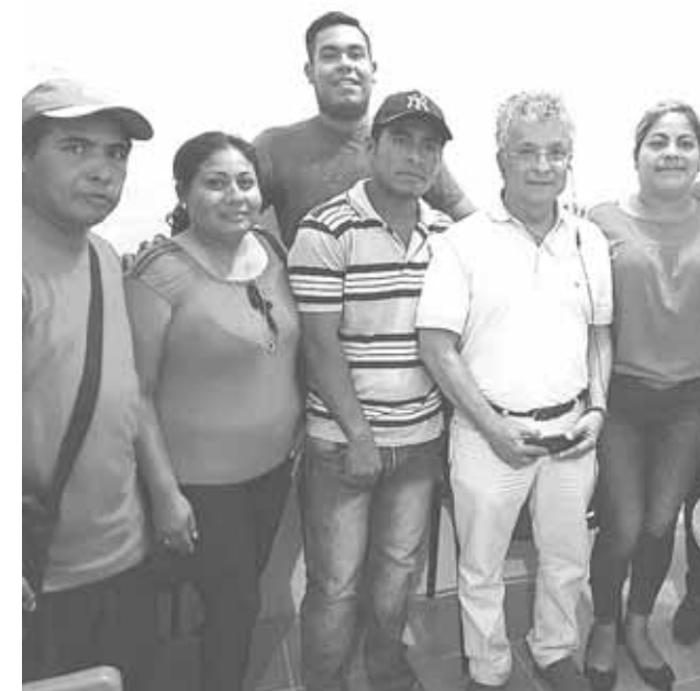
► Trabajan de forma coordinada con el Fideicomiso para el Desarrollo Logístico del estado de Oaxaca y Coreturo.

La autoridad auxiliar aseguró que se gestionó también la construcción de una casa de salud que tanta falta necesitaban las familias para poder tener acceso a los servicios de salud y además que esté al alcance y no tengan de viajar a otros puntos.