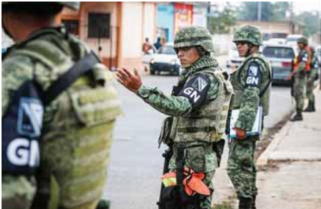
► La Guardia Nacional lleva menos de dos meses que se instaló en Tuxtepec.