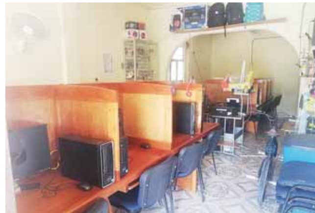
► El establecimiento que fue robado.

unos pasos del plantel de Nivel Medio Superior (CBTis 31) cuando, como siempre,