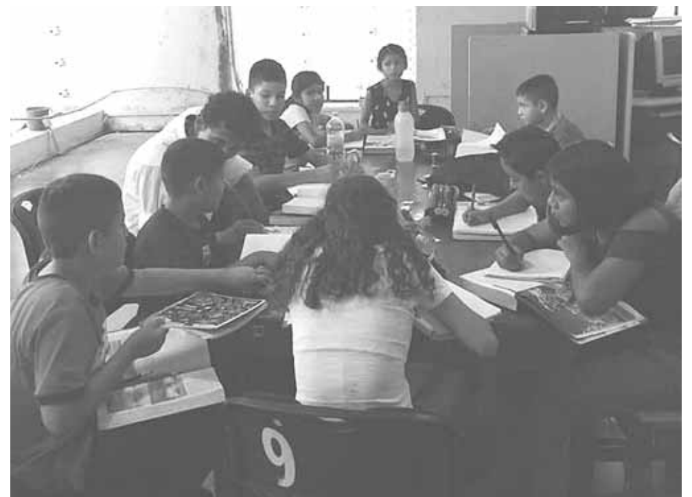
► También se dan cursos de matemáticos, español entre otras actividades.