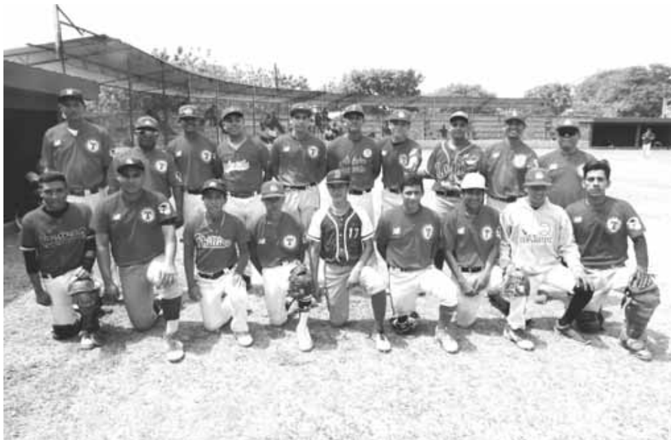
► Guerreros gana en extra inning.