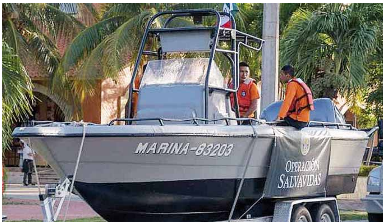
► Efectivos de la Marina brindarán una estancia segura y feliz a los miles de turistas que visitan el destino de playa.

Entre los miles de turistas que visitan durante ésta temporada de verano hay paseantes provenientes de varios estados de la República como Chiapas, Ciudad de México, Estado de México, Puebla, Monterrey, Guadalajara, Oaxaca, entre