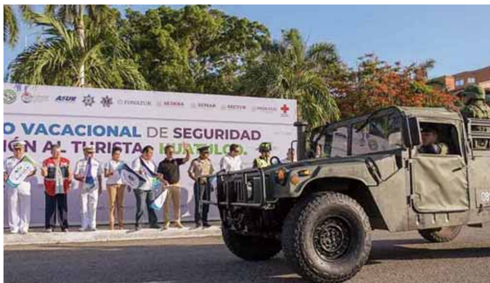
► Participan corporaciones policiacas y de rescate.