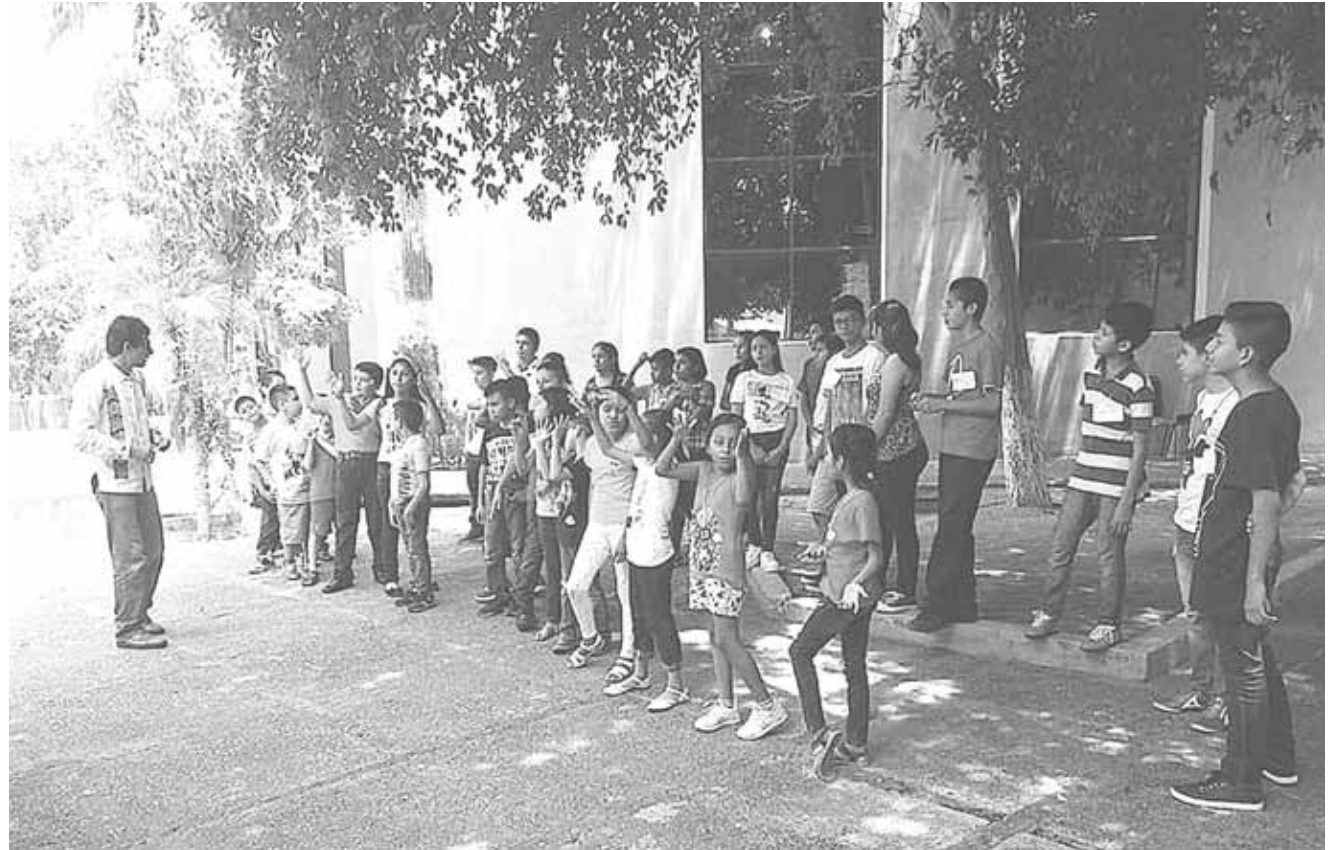
► Los talleres se imparten por profesores capacitados.

En ese sentido, los padres de familia aplaudieron estas actividades que realizan las autoridades, porque estos permiten que sus hijos tengan un espacio de sano