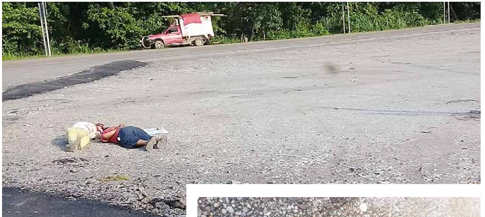
► Los hechos se registraron la tarde del jueves en el kilómetro 180+300 de la carretera federal 185.