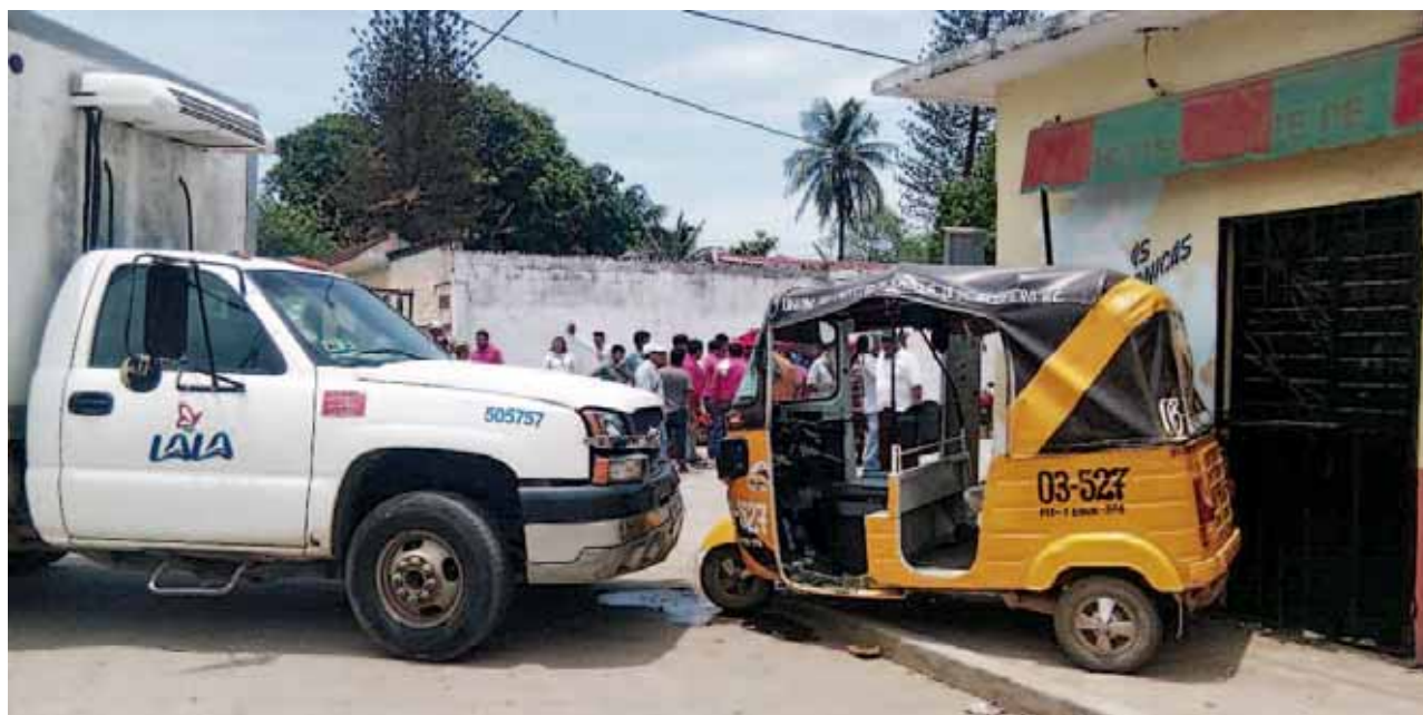
► Los vecinos dieron aviso a los cuerpos de emergencia.