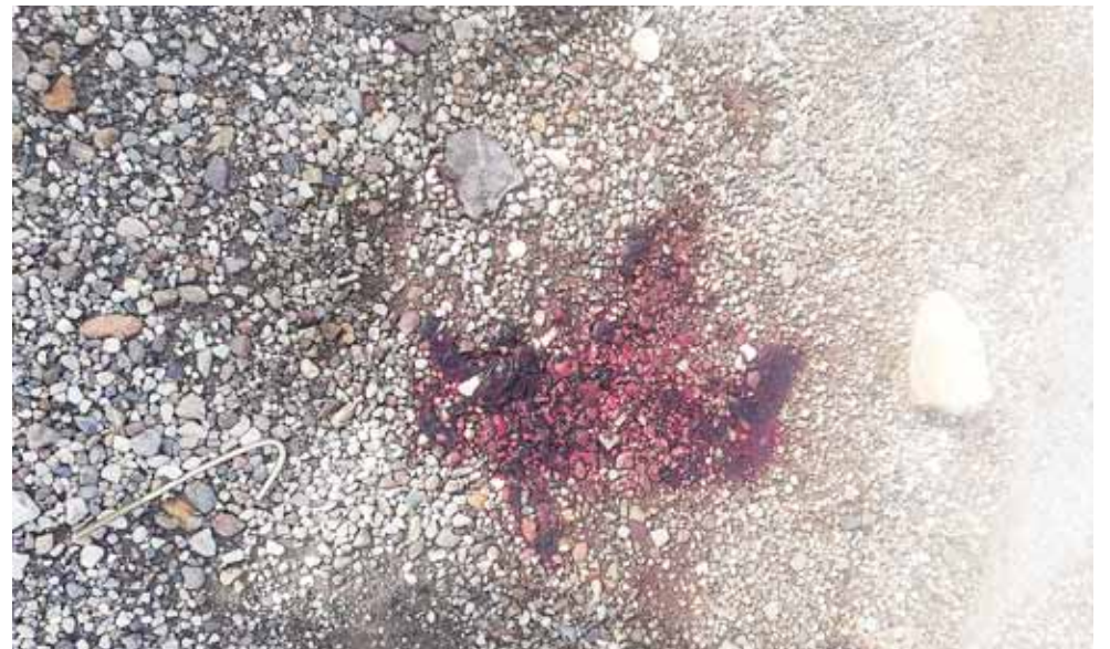
► Alrededor de las 20:00 horas los cuerpos fueron levantados por la autoridad correspondiente.

Los hechos se registra- ron aproximadamente a las 18:30 horas del jueves y ayer por la mañana fueron iden- tificados; se presume que al lado de los cuerpos ejecuta- dos les fue dejada una cartu- lina con un narco mensaje.