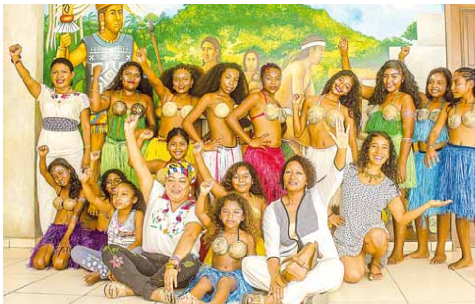
► El encuentro se realizará del 19 al 21 de julio.