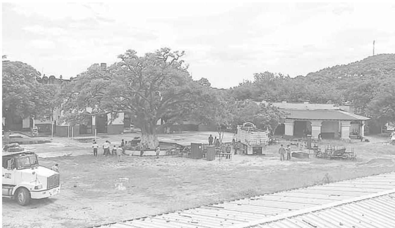
► Los alumnos son los más afectados.