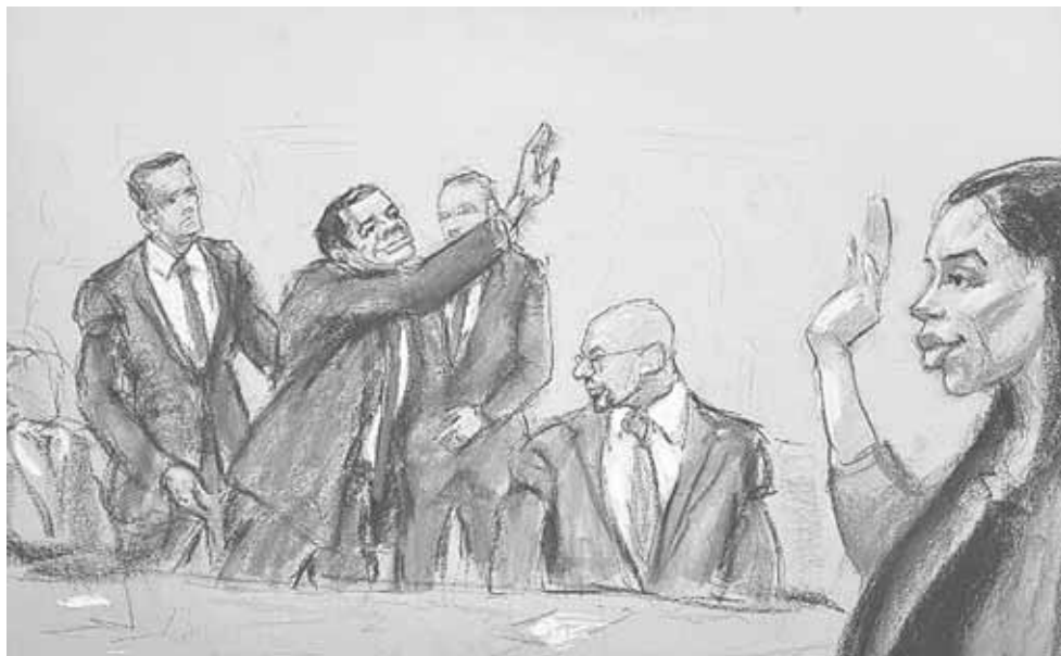
► Joaquín Guzmán Loera fue sentenciado a cadena perpetua; no se le permitió despedirse de su esposa Emma Coronel, por miedo a que tramara un plan para fugarse.

mantendrán los acuerdos internacionales para extraditar a delincuentes entre ambos países, y los traslados no serán discrecionales.