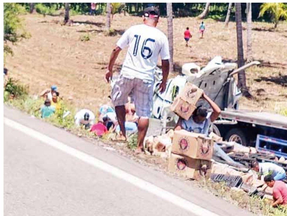
► Los automovilistas que transitaban por el lugar detuvieron su marcha para llevarse varios cartones de cerveza.

Los presuntos delincuentes quedaron libres, ya que la parte afectada no quiso continuar con la denuncia