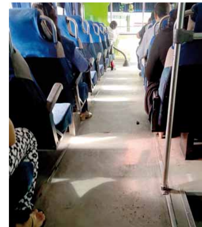
► Al interior de las unidades se observa el descuido.

En el PED 2016-2022 se establecen estrategias para dignificar el transporte público en la entidad oaxaqueña, en el cual resalta la capacitación de los operadores y la renovación del parque vehicular en todas sus modalidades, pero a la fecha esto no ha sido posible.