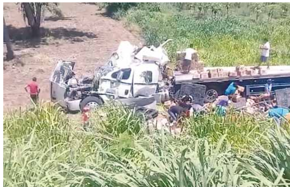
► El percance se registró sobre la carretera federal 200 Pinotepa-Acapulco.

desconocen las causas por las que el tráiler propiedad de la empresa Corona, se salió de la carretera federal 200 Pinotepa-Acapulco.