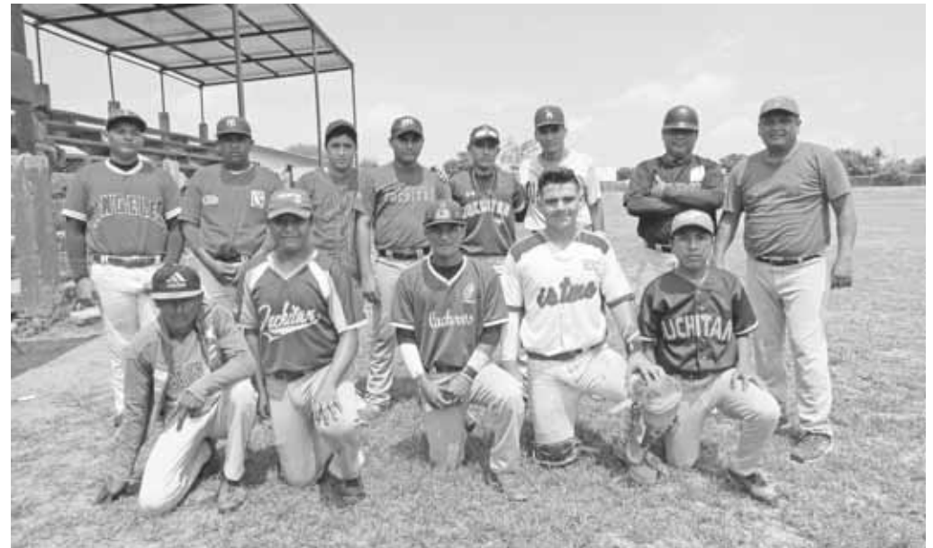
► Xhauis triunfó en el terreno de juego.