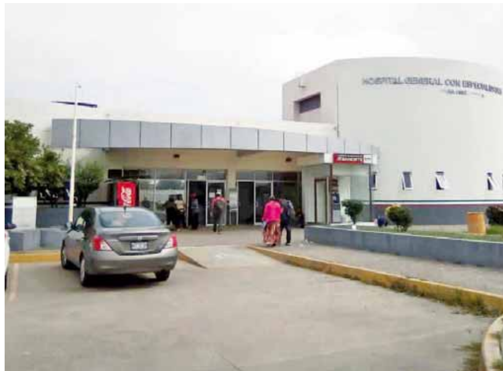
► Los hospitales requieren de un mayor número de donadores de sangre.

“Muchos hospitales cuentan con su banco de sangre que en situaciones en que el paciente lo requiera, por la gravedad que padezca, acceden a proveerlo, siempre y cuando la familia lo reponga”, expresó.