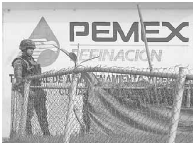
► Se presume que Herrera Pegueros colaboró con grupos de huachicoleros en la sustracción ilegal de combustibles en ductos de Pemex.

Con la aprehensión de Herrera Pegueros ya suman cinco los militares que han sido capturados por su presunta vinculación con grupos de huachicoleros que operan en distintas zonas del país.