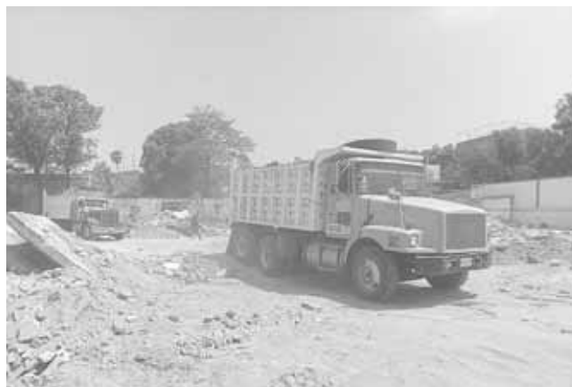
► Por falta de recursos las constructoras abandonaron las obras.

S ALINA CRUZ, OAX.- A paso lento más de 20 escuelas dañadas siguen aún sin poder ser concluidas, lo que ha generado inconformidad entre los padres de familias quienes han tenido que pagar renta donde