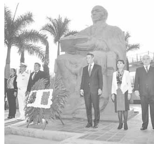
► El mandatario encabezó la guardia de honor frente a la estatua del benemérito de las Américas en Ciudad Administrativa.

Ante funcionarios y titulares de diferentes dependencias, como el Instituto Estatal de Educación para Adultos (IEEA), los Servicios de Salud de Oaxaca (SSO) y la Secretaría de Seguridad Pública de Oaxaca (SSPO), entre otros, se destacó la importancia de la lealtad a las instituciones, sobre todo con honestidad, con diálogo constante y cercano a la gente.