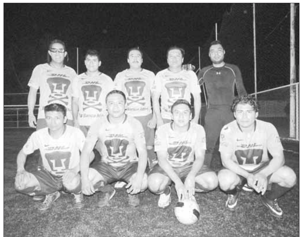
► Apolo bajó la guardia en la recta final.

Sucursal: Manuel Ávila Camacho 609 Centro Salina Cruz, Oaxaca. Tel. 7141376