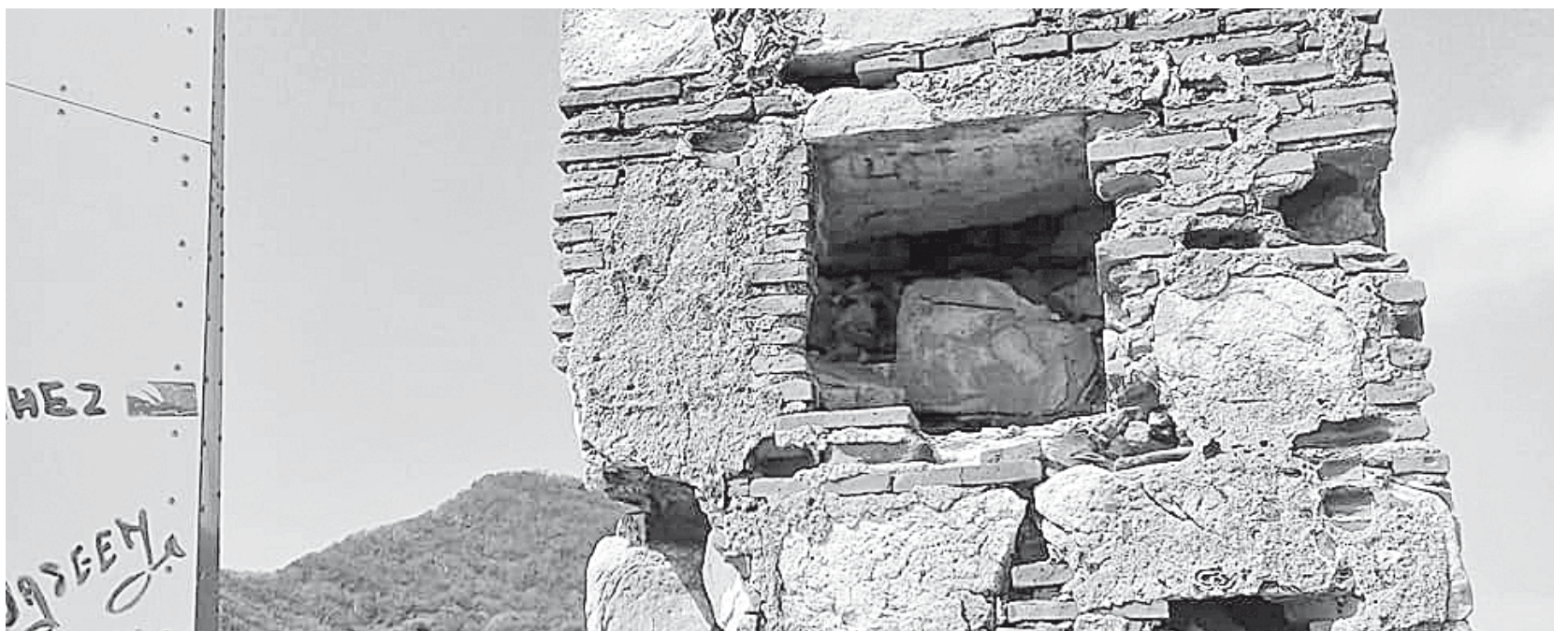
► Conaculta y el INAH ya autorizaron la restauración.