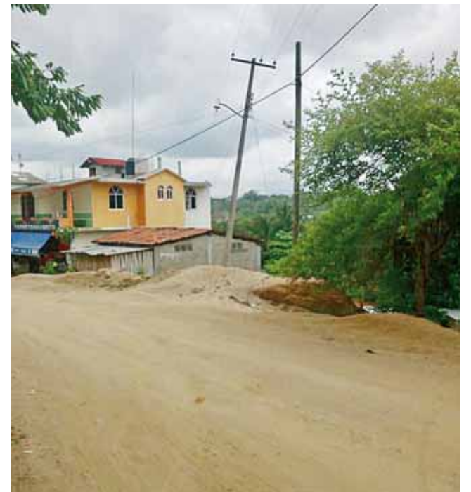
► En la comunidad de El Carrizo llevan dos meses con apagones.