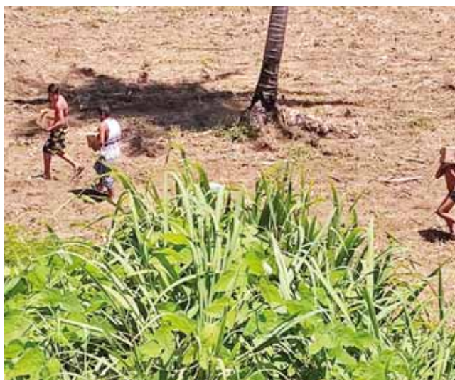
► Acabaron con la mercancía.

La rapiña de pobladores y automovilistas no se hizo esperar