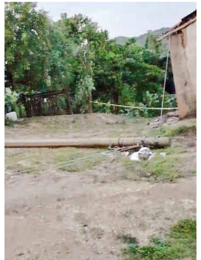
► Algunos postes están en mal estado.

El poste en mal estado, está ubicada sobre la calle principal de la comunidad del Carrizo, vía principal que utilizan tanto peatones como vehículos para realizar sus actividades cotidianas.