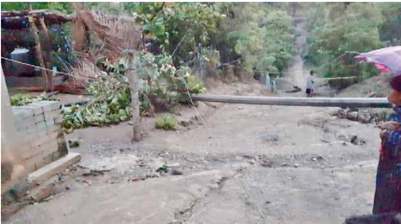
► Exigen a la CFE que repare el servicio de energía.