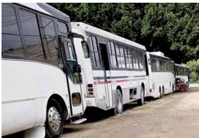
► Camiones con más de 12 años de antigüedad deberían salir de circulación.