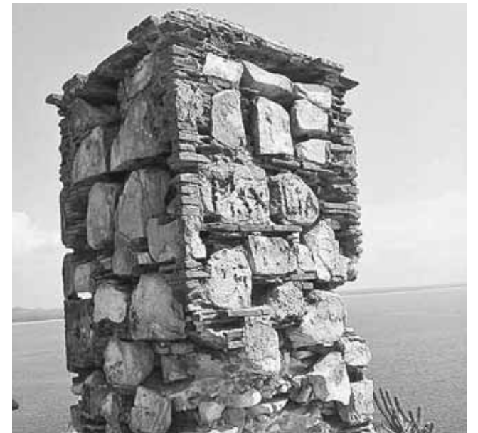
► El Faro de Cortés es el primero que se construyó en Latinoamérica, y es uno de los emblemas de Salina Cruz.