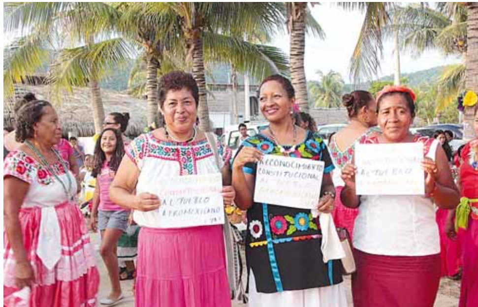
► La Asociación de Mujeres de la Costa de Oaxaca (AMCO) A.C., coordinará el evento junto con el Colectivo Ñaa Tunda.