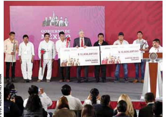
El presidente Andrés Manuel López Obrador entrega dos cheques a las autoridades municipales de Santa María Zaniza y Santos Reyes Yucuná.

Subrayó que al Sureste se trasladarán a 10 mil elementos de la Guardia Nacional para atender el tema de tránsito de migrantes, en su mayoría hondureños, salvadoreños y guatemaltecos. INFORMACIÓN 3A