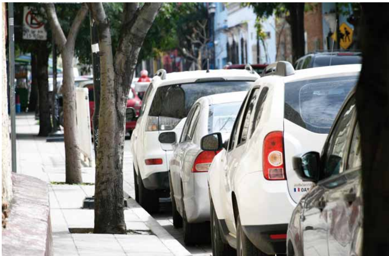
► Las calles del Centro Histórico y otras partes de la capital se han vuelto muy inseguras.

Apenas el domingo en la noche, una familia fue asaltada en conocido restaurante de la colonia Reforma,