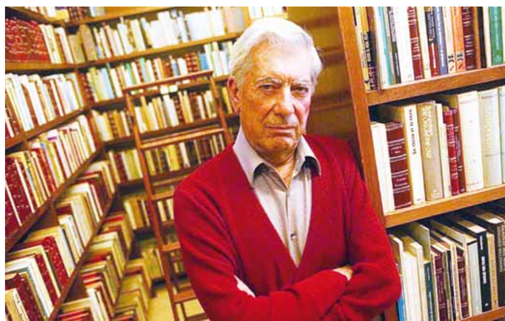
► Su llegada a librerías será el próximo 8 de octubre y llega bajo el sello Alfaguara.

sación en la Catedral reconoció, citado por la agencia EFE, que la historia en que se basa la novela le llegó a través de un amigo dominicano, por lo que su vinculación con el país caribeño se mantiene tan viva como en 1975, cuando el autor pisó ese suelo por primera vez. “Yo llegué para hacer un documental con la radio televisión francesa, y apenas llegué fue amor a primera vista. Me sentí en casa, inmediatamente forjé muy buena relación con mucha gente”, relató Vargas Llosa, quien dijo sentirse sorprendido por “la libertad con que los dominicanos” hablaban sobre la dictadura de Trujillo.