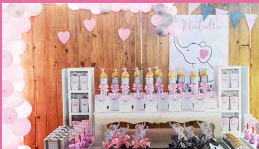
► Organizaron un muy bonito festejo.