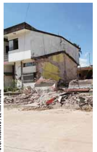
Oaxaca en riesgo.