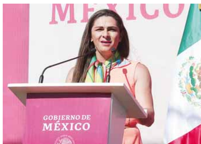
► Ana Guevara se defendió de las acusaciones de corrupción que circulan en torno al organismo que preside.

la investigación y se presente aquí el resultado".