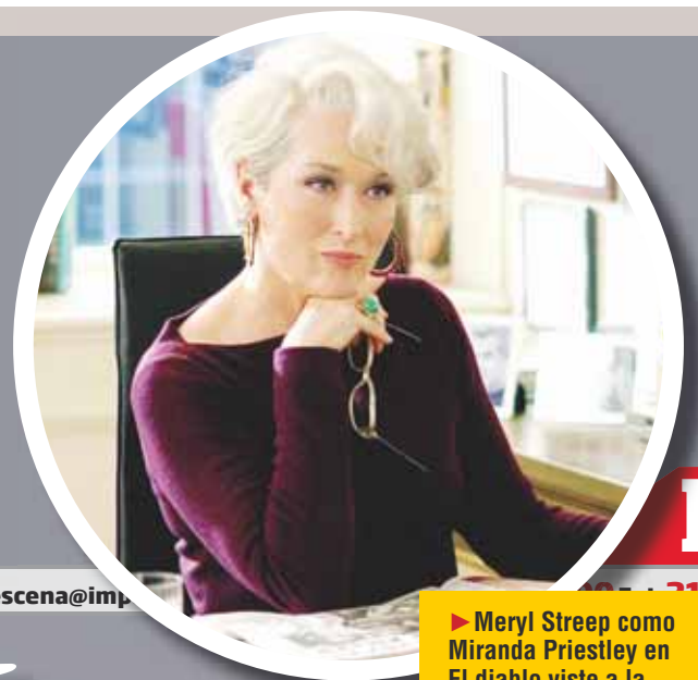
► Meryl Streep como Miranda Priestley en El diablo viste a la moda .