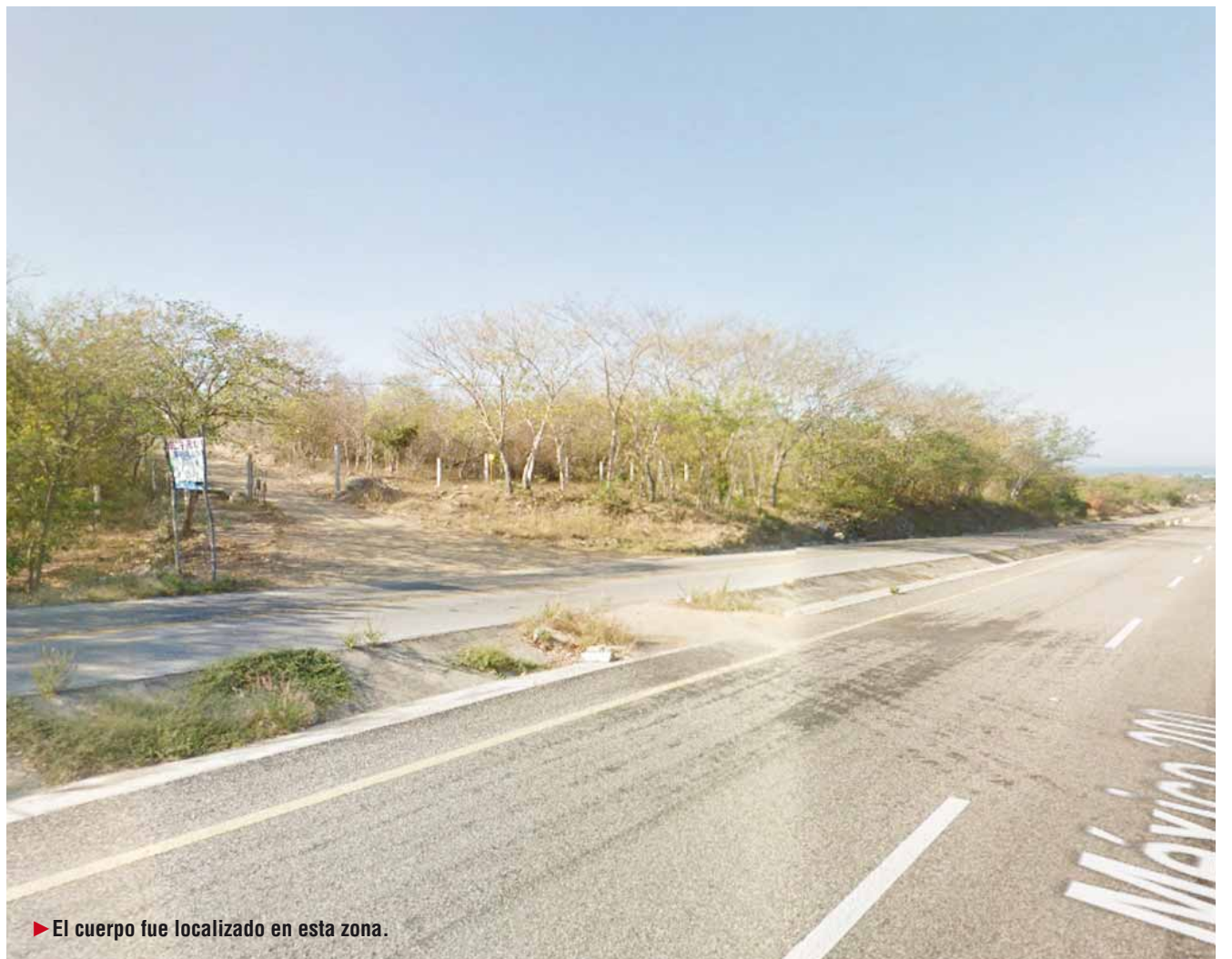
► El cuerpo fue localizado en esta zona.

Del caso la Vicefiscalía regional abrió la carpeta de investigación por el delito de homicidio, en contra de quien o quienes resulten responsables.