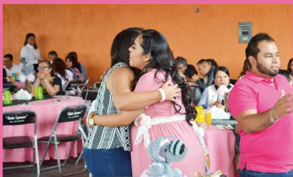
► La futura mamá recibió muchos abrazos y apapachos.