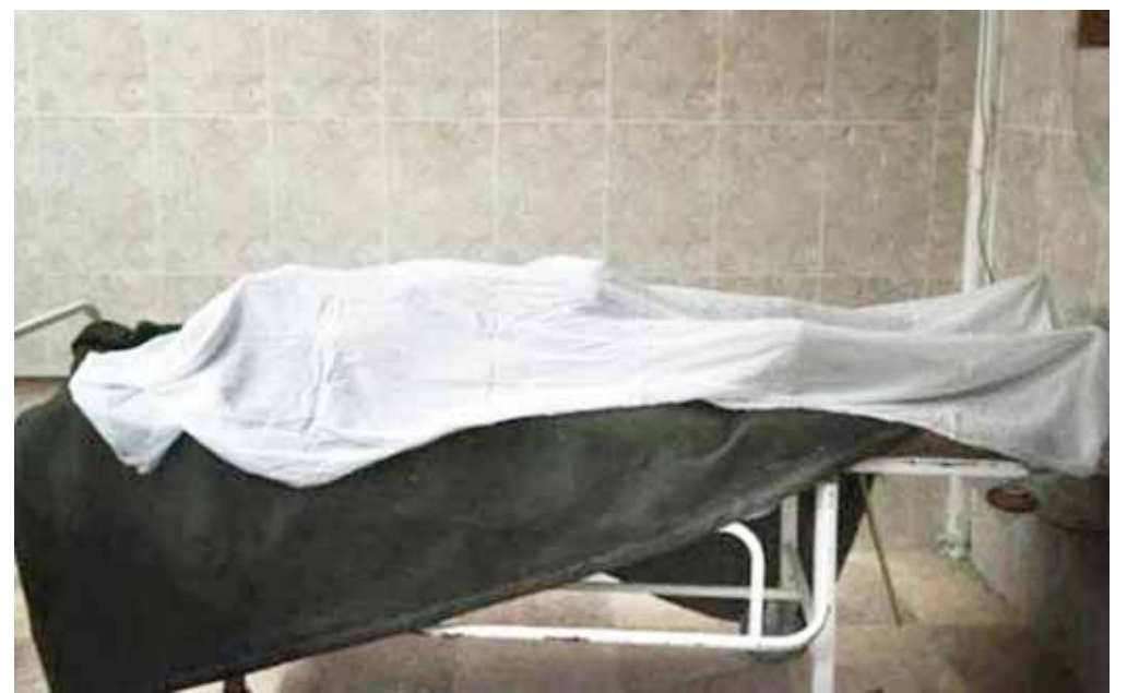
► Las ejecuciones en la Costa van en aumento.

Se trataba del cuerpo de un hombre cuyo olor nauseabundo alertó a los veci-