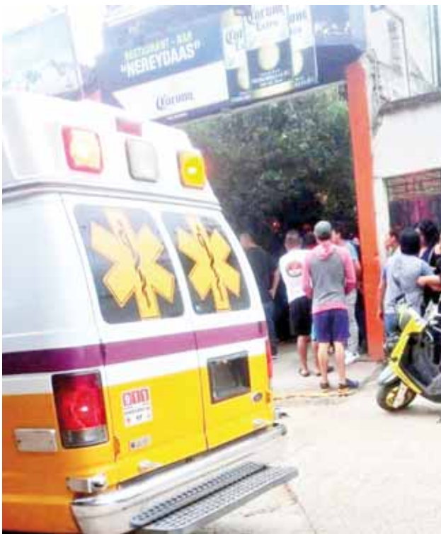
► Vecinos llegaron al lugar de los hechos.

policiaca@imparcialenlinea.com / Teléfono 501 83 00 Ext. 3176