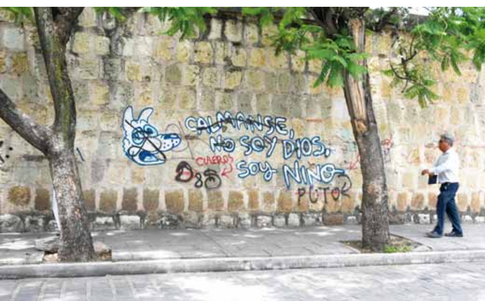
► El vandalismo también ha afectado a construcciones como el Jardín Etnobotánico.

Le siguen la falta de pruebas, la poca importancia que le dan al delito, los trámites largos y difíciles, por miedo al agresor, la actitud hostil de la autoridad, miedo a que los extorsionaran y otros motivos.