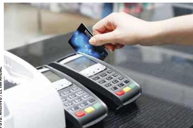
La clonación de tarjetas, un delito en auge.

La Comisión Nacional para la Protección y Defensa de los Usuarios de Servicios Financieros (Condusef) informó que el robo de identidad o clonación de tarjetas es un fenómeno que ha ido en aumento de forma considerable y se puede hablar