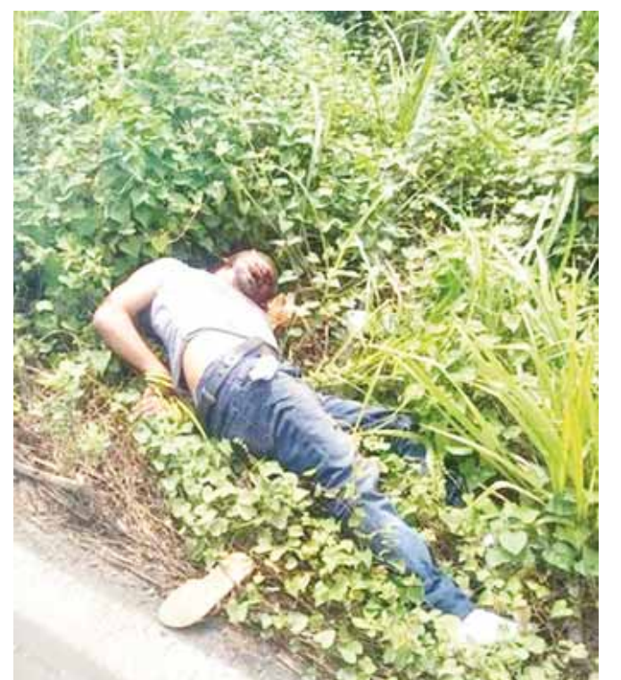
► El hombre fue localizado con signos de tortura.

Mientras tanto, las autoridades del estado de Oaxaca ya indagan con sus homólogos del estado veracruzano, para saber si tienen denuncia de la desaparición de alguna persona que, coincida con las características de la recién encontrada sin vida.