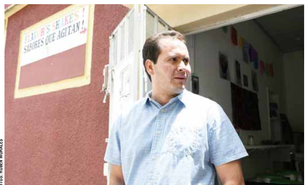
► Los comerciantes están preocupados por la situación de inseguridad.