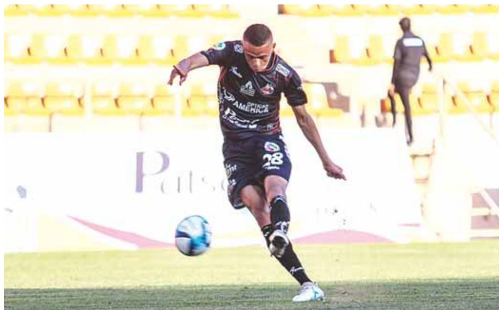
▶ El conjunto que defenderá los colores de Oaxaca tendrá una reestructuración.

Por el momento estos son los cambios más sonados, pero se espera que en próximos días se anuncien