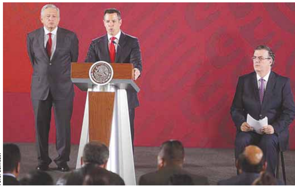
El gobernador Alejandro Murat Hinojosa participa en la conferencia mañanera del presidente Andrés Manuel López Obrador, donde el canciller Marcelo Ebrard presentó el Plan Migratorio en la frontera sur.

El mandatario oaxaqueño participó en la conferencia de prensa mañanera, en donde el jefe del ejecutivo