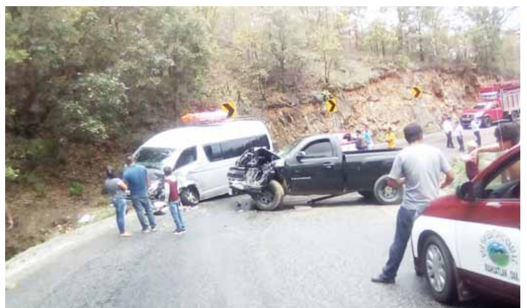
► El fuerte percance se dio antes de llegar a Miahuatlán.

Paramédicos voluntarios arribaron al lugar, quienes les brindaron los primeros auxilios a los dos pasajeros heri-