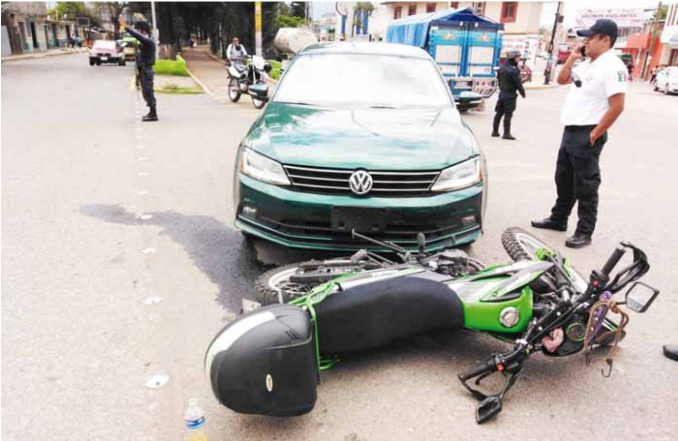
► Los vehículos involucrados en el accidente.

policiaca@imparcialenlinea.com / Teléfono 501 83 00 Ext. 3176