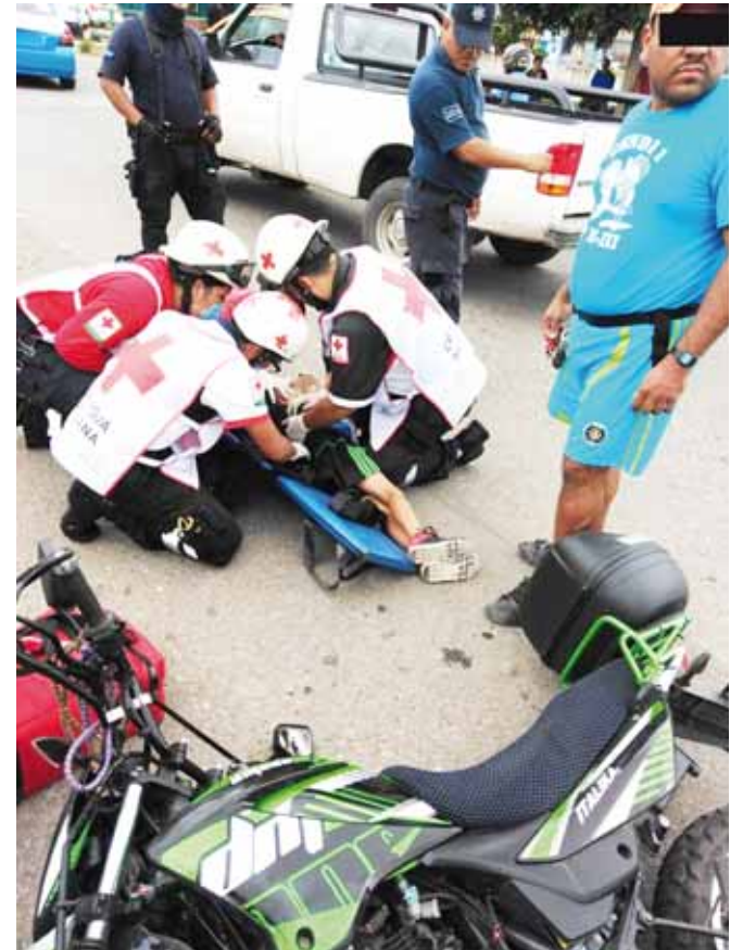
► Paramédicos auxiliaron al menor.