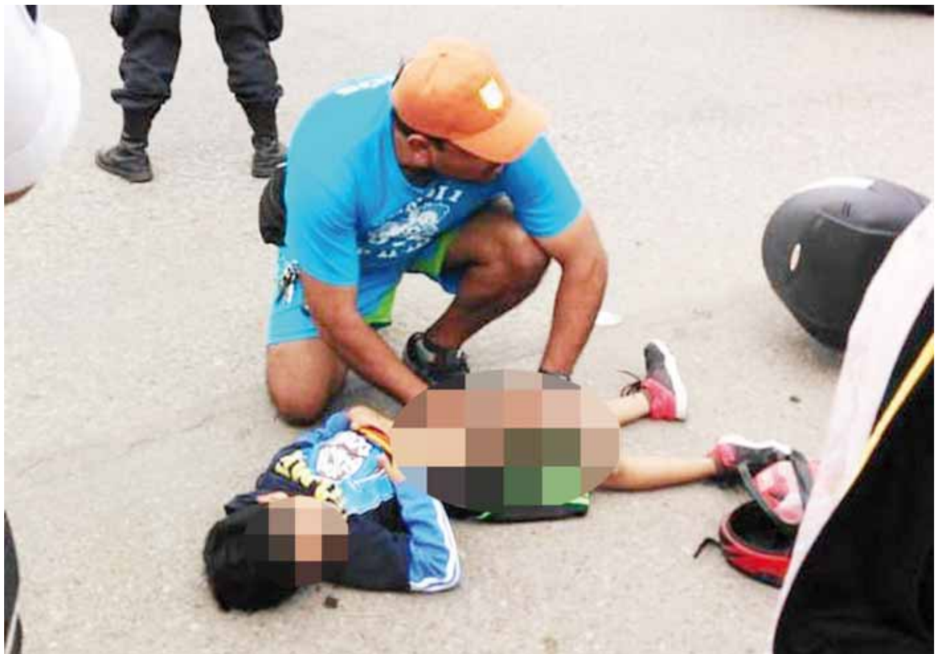
► Un niño quedó con lesiones de consideración y fue llevado a un hospital.

El motociclista al llegar a la esquina de la calle 5 Norte de la colonia América, lugar en donde no hay semáforos y se aglomera el tráfico trató de pasar a prisa al igual que el conductor del auto, por la imprudencia de los dos conductores al no ceder el paso y no detener su marcha ocasionó que el automovilista arrollara al motociclista, quien por el fuerte impacto perdió el control de la unidad y derrapó aparatadamente, resultando su menor hijo con lesiones de