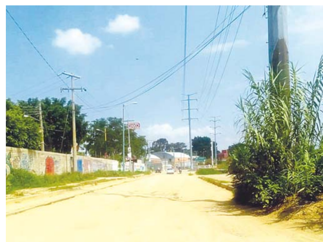
► Deben tomar el camino de terracería, lo que los pone en peligro.

Ambos hicieron un llamado al Gobierno del Estado y Municipal, con el fin de que se atienda la citada carretera, “en esta vía en varios lugares los registros del drenaje ya no están; asimismo, existen una gran cantidad de baches, para todas las personas es un peligro caminar o circular a bordo de sus automóviles”.