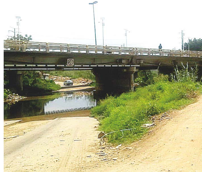
► Aún continúa el agua encharcada de las pasadas lluvias.

Destacaron que lo que la asociación civil busca que una vez que los jóvenes terminen con su capacitación, éstos se conviertan en emprendedores, es decir, pongan un negocio. “Los jóvenes no han querido irse a las empresas y muchos de ellos, se quejan de como los tienen trabajando las empresas”, dijo la capacitadora.