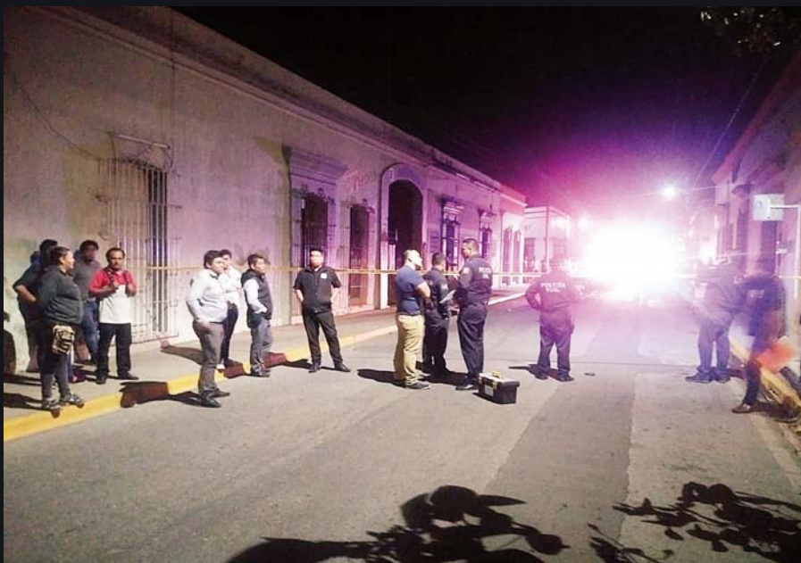
► Policías, familiares y curiosos se acercaron a la zona de la tragedia.