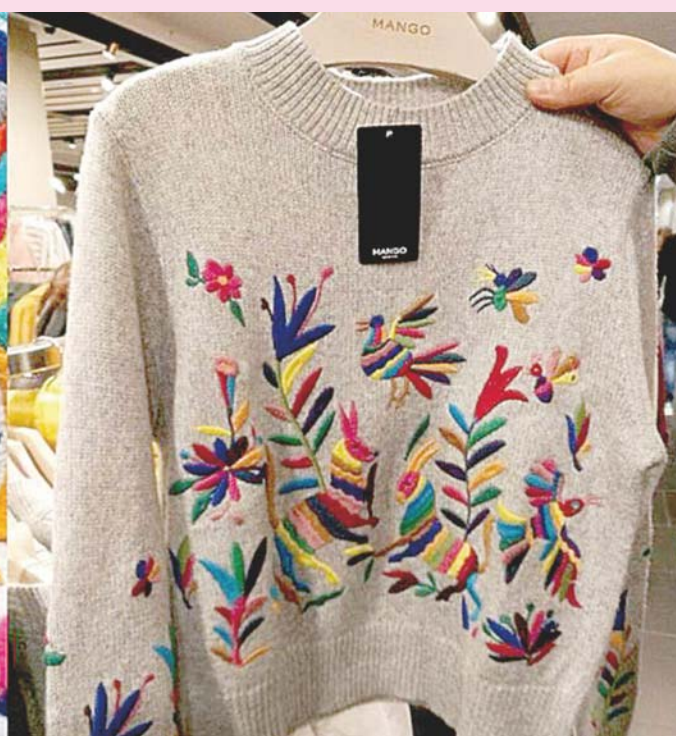
► La marca Mango usó bordados de Tenango de Doria; sin embargo, es la única marca que se disculpó públicamente.