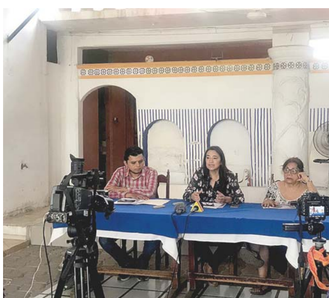
► Los trabajos ganadores de cada categoría serán publicados.

En lo que va de 2019, los bordados de Tenango de Doria han sido objeto de apropiación en tres ocasiones, contando la última detectada en la nueva colección de la firma Carolina Herrera. Las otras dos corresponden a la marca española Desigual y la casa de alta moda francesa Louis Vuitton.