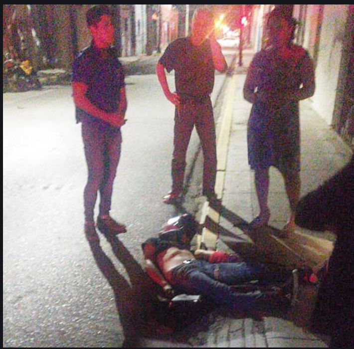
► El joven murió en el asfalto.

con placas de circulación TXE-1630 del estado de Puebla, propiedad de Gregorio C. P., y por el exceso de velocidad con la que conducía no le permitió esquivar la unidad y se impactó brutalmente contra ella, saliendo pro-