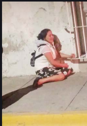
► La madre del occiso estaba inconsolable.