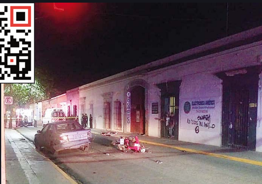
► La moto quedó siniestrada al lado del auto involucrado en el percance.