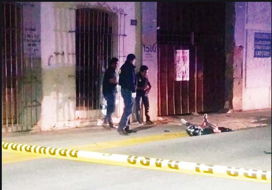
► Peritos levantaron los incidios y el cuerpo.

Por los hechos se levantó una carpeta de investigación para deslindar responsabilidades de los trágicos hechos.