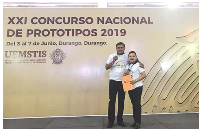
► El CBTis 91 obtuvo el 1er lugar en modalidad de prototipo de desarrollo de software.

a los proyectos con los tres puntajes más altos.