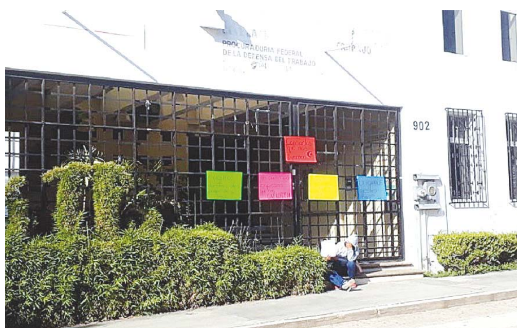
► Becarios cumplen dos meses sin recibir apoyo del programa federal.

“No somos la única asociación que han dado