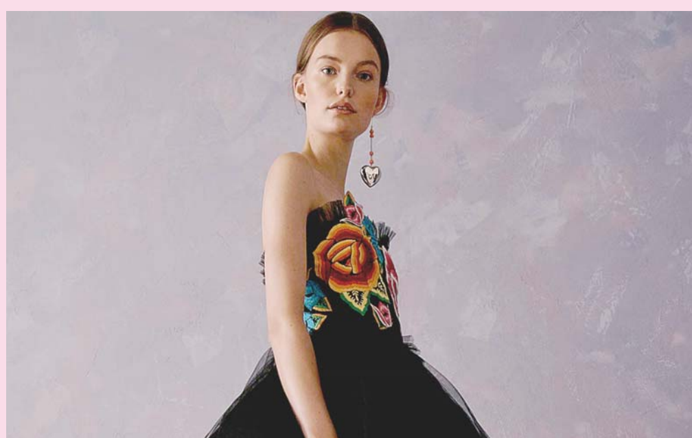
► Las flores del Istmo de Tehuantepec fueron usadas por la marca Carolina Herrera.

A las reacciones por el caso se suma la senadora Susana Harp, presidenta de la comisión de cultura