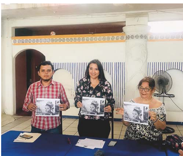
► Los participantes deberán ser originarios de Tehuantepec y no hay límite de edad.