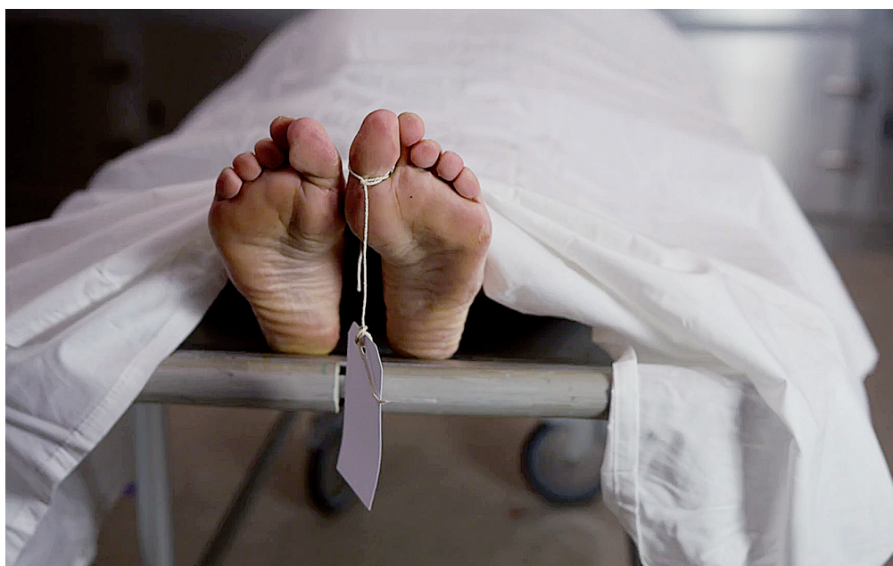
► La mujer fue atacada con saña en su casa.

El cadáver de la mujer presentaba una herida pro-