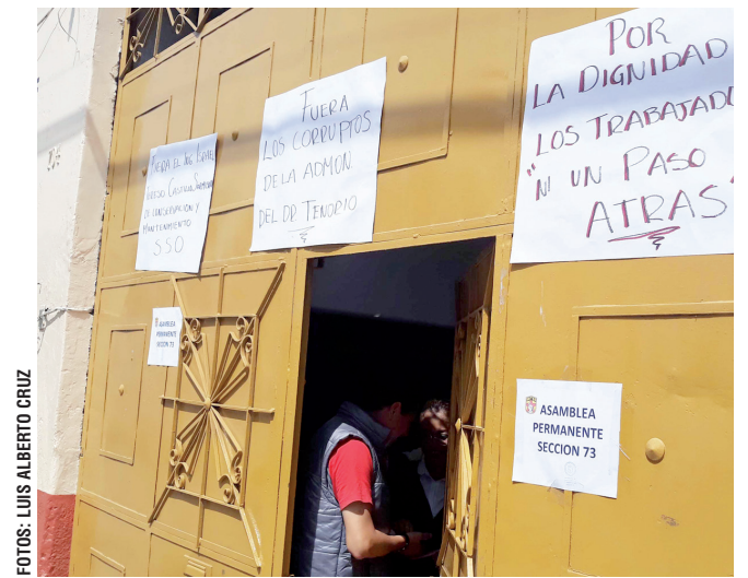
Se concentraron en el Departamento de Conservación y Mantenimiento.