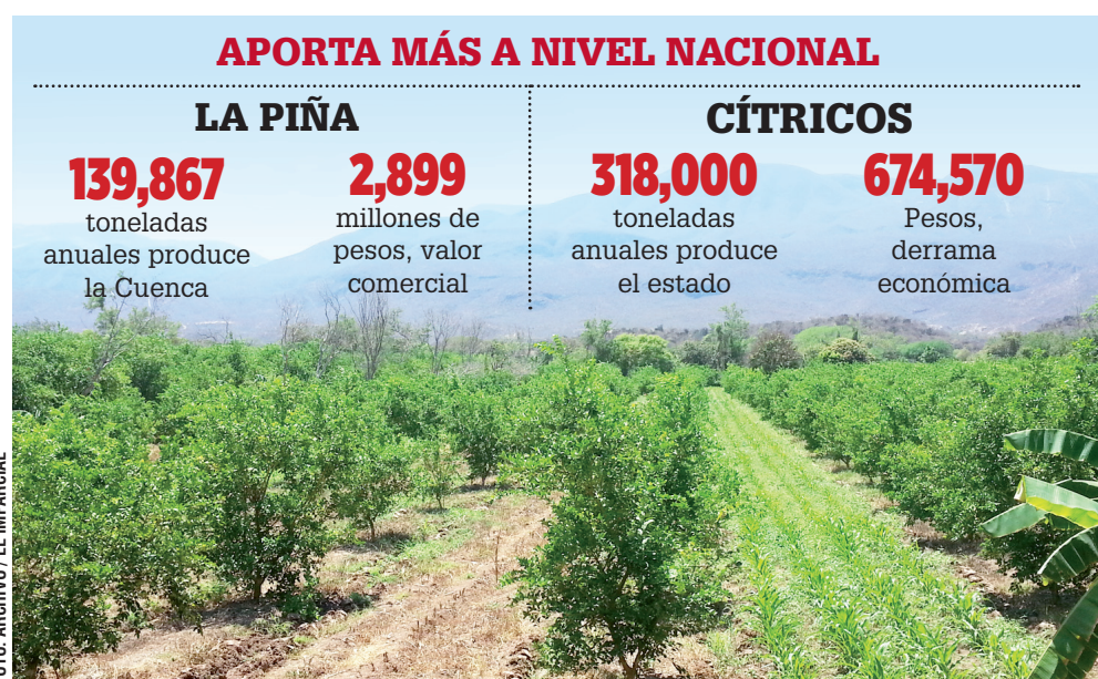
La producción de cítricos como el limón, se consolida en regiones como la Cañada y el Istmo.

En tanto, la Secretaría de Desarrollo Agropecuario, Pesca y Acuicultura (Sedapa), confirmó que Oaxaca