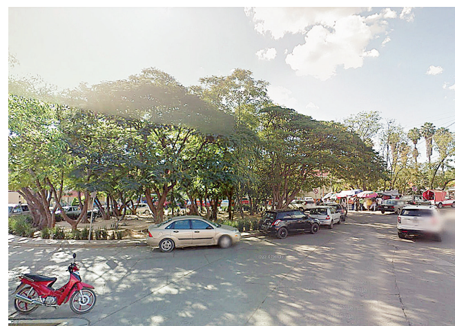
► El atraco aconteció en la glorieta que está frente a Chedraui y el Periférico.

Corporaciones que arribaron al lugar realizaron recorridos por la zona para dar con la ubicación del o los responsables, pero hasta el cierre de la edición, los