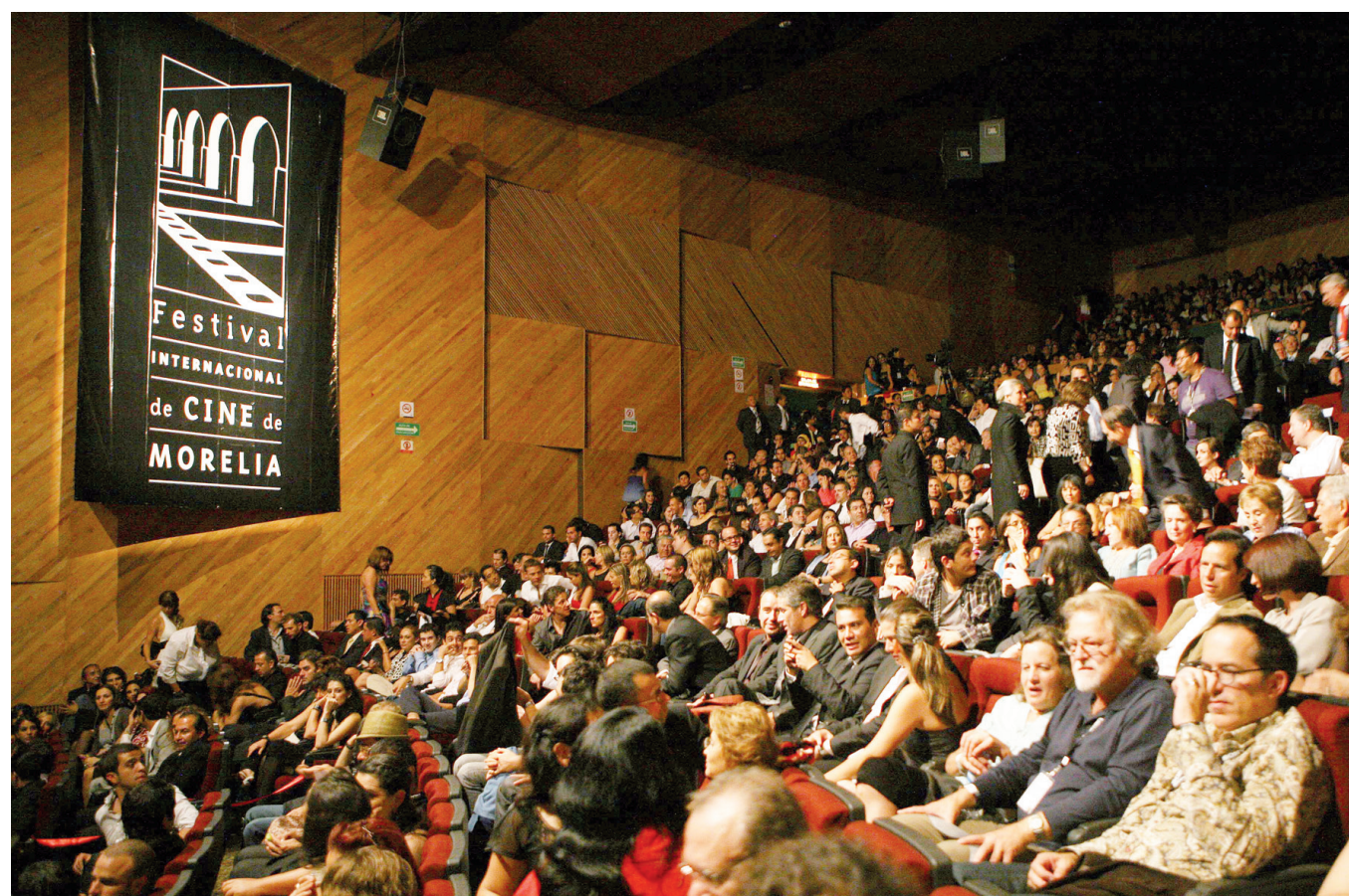
► El Festival Internacional de Cine de Morelia quedó fuera.

"Por eso se decidió abrirlo también a festivales de todas