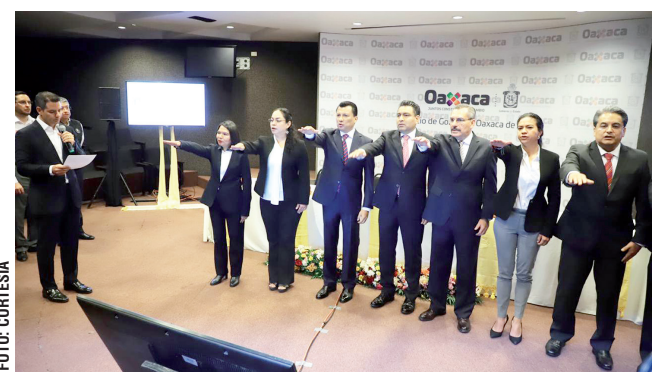
El gobernador Alejandro Murat Hinojosa realizó cambios en su gabinete.

Lo anterior derivado de las acciones fitosanitarias implementadas por el SENASICA a través de la Campaña Nacional contra Moscas de la Fruta, que logró la disminución de la plaga y como consecuencia se obtuvo una buena cosecha así como un producto de calidad idóneo para la exportación.