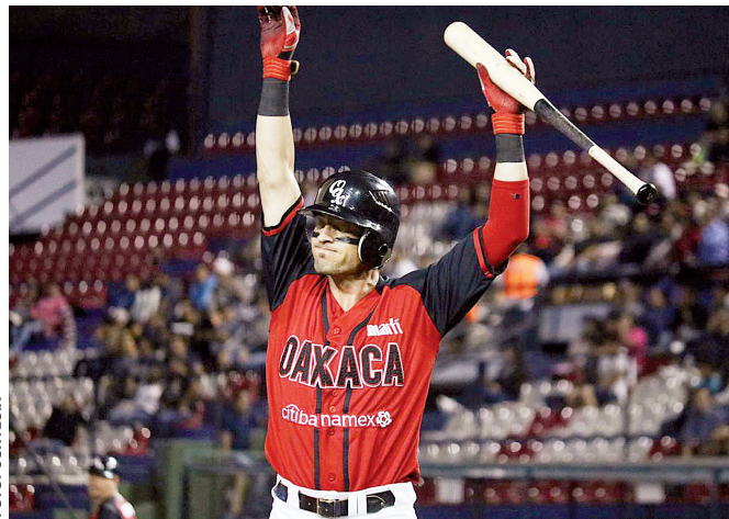
Las acciones se desarrollaron en el parque Lic. Eduardo Vasconcelos.

Sin embargo, los locales se pusieron a trabajar y en el cierre del mismo, Guerreros se metió en el partido