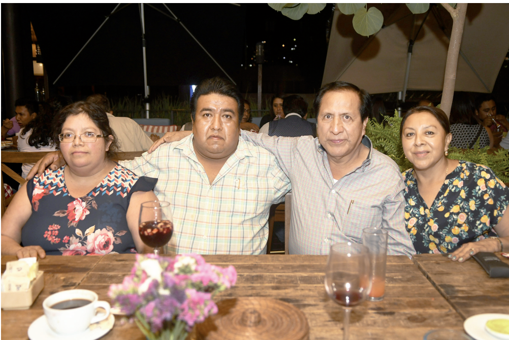
▶ Sus compadres lo acompañaron a celebrar su onomástico.

Al final les agradeció por haberlo acompañado en esta fecha especial para él. ¡Muchas felicidades!