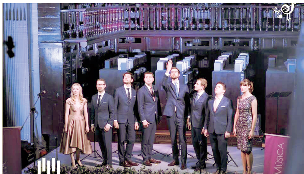
► El Festival de Música Miguel Bernal Jiménez, de Morelia también quedó fuera.