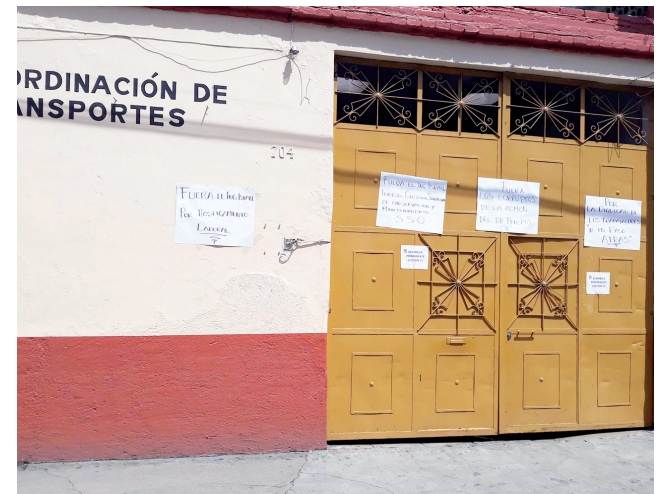
Suspendieron algunas de sus actividades.