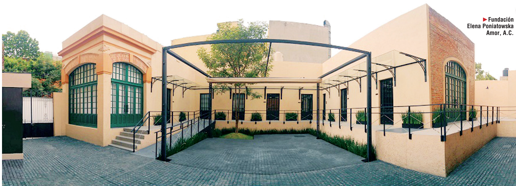
► Fundación Elena Poniatowska Amor, A.C.

enesena@imparcialenlinea.com / Teléfono 501 83 00 Ext. 3172