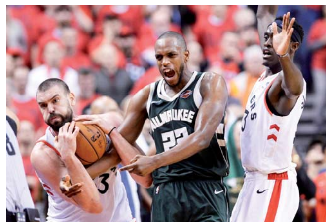
► La victoria de los Raptors se extendió hasta el segundo tiempo extra.