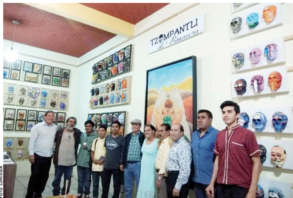
► La muestra reúne 224 obras.

Como aquellos tzompantlis realizados por culturas prehispánicas, 108 artistas colaboran en uno actual. En él también aluden al ciclo de la vida y la muerte, a la vez que rinden tributo a los tlahuillos de Monte Albán y Mitla, los pintores mixtecos y zapotecos que nos legaron el colorido oaxaqueño.