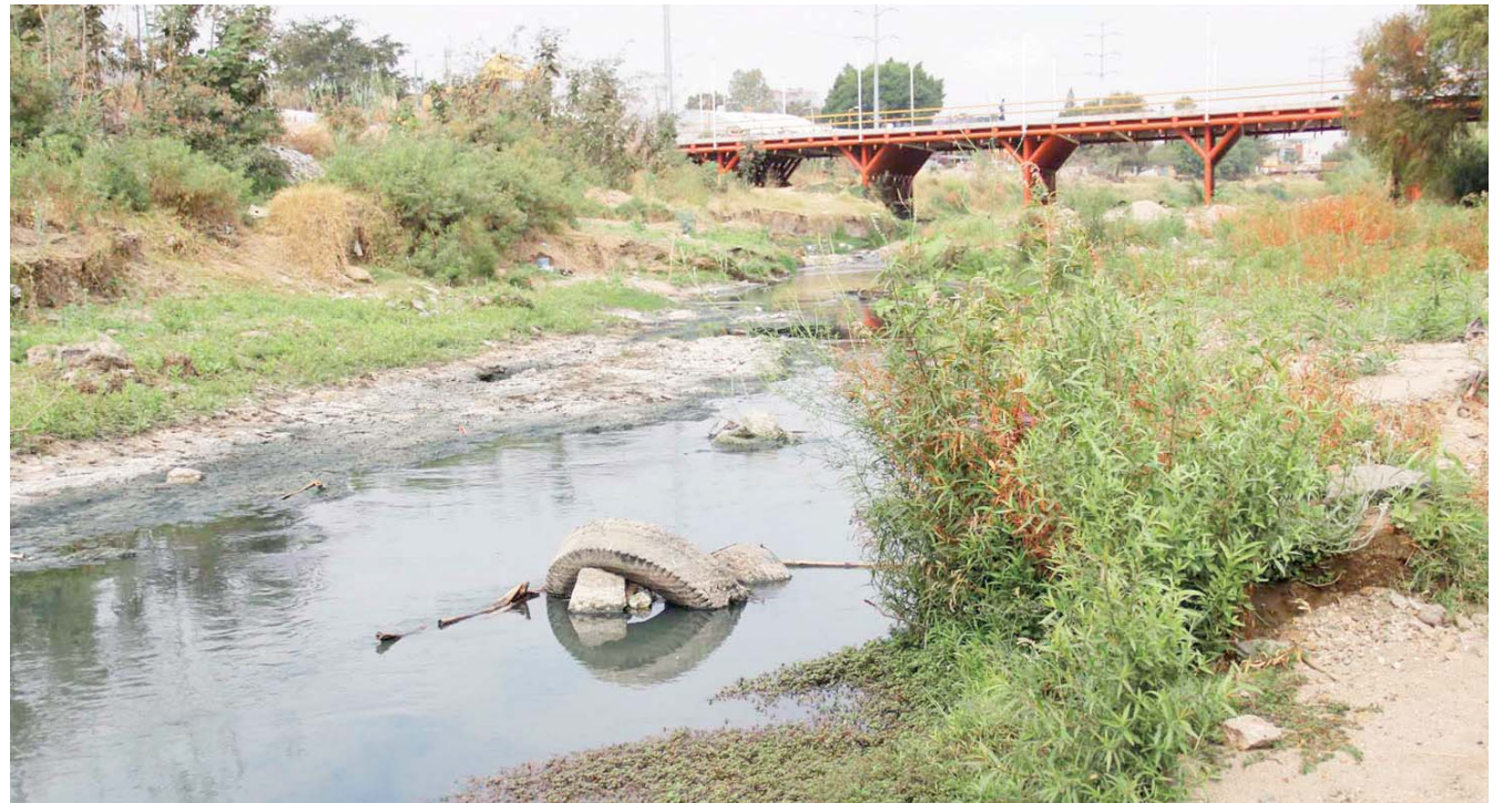
► La contaminación del agua se ha vuelto un problema serio en la ciudad.

Debido a que cuidar los recursos naturales es asegurar el futuro de Oaxaca, es tarea que compete a la sociedad en su conjunto y que puede ejecutarse desde los hogares con pequeñas acciones como cuidar el agua, disminuir el consumo de energía eléctrica o desplazarse en medios de transporte no contaminantes.