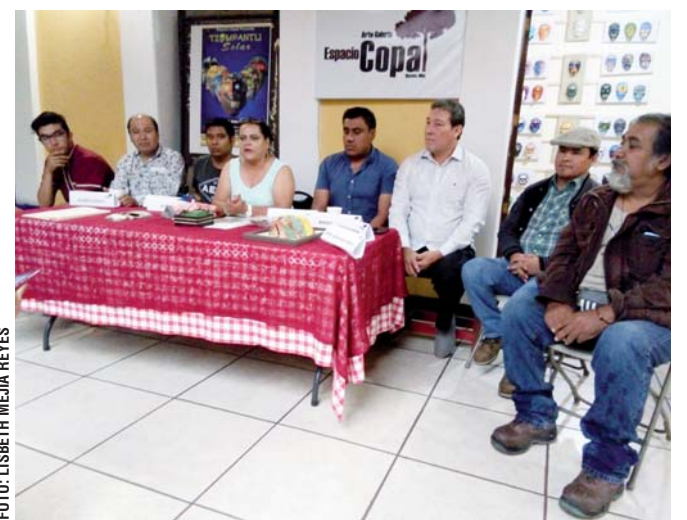
► En la exposición participan más de un centenar de autores.