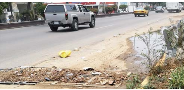
► Alcantarilla colapsada en la 190, en Santa Rosa.

Una de las alcantarillas con mayor cantidad de basura acumulada es la que se ubica en la 190, a la altura de la colonia Cuauhtémoc en Santa Rosa Panzacola, en las rejeras se observan desde bolsas de plástico hasta llantas que se abandonan en la vía pública.