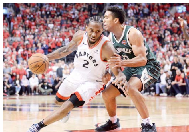
► Toronto ganó pese a que sus bases Kyle Lowry y Powell fueron expulsados.

Hoy, a las 20:00 horas, los Golden State Warriors enfrentarán su cuarto duelo ante los Portland Trail Blazers, los comandados por Stephen Curry tienen la oportunidad de cerrar la final del oeste con marca perfecta lo que les reportaría un merecido descanso antes de la gran final de la NBA.