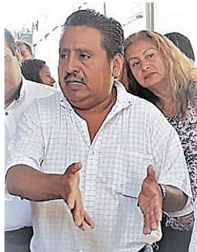
► El comerciante asesinado, así era en vida.

Sin embargo, serán los efectivos de la AEI los que