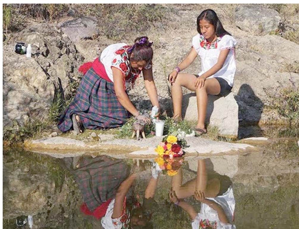
► El video será estrenado en Santa Ana del Valle.

La presentación del videoclip será este lunes, a las 19 horas, en el municipio de Santa Ana del Valle, Tlaxiaco de Matamoros.