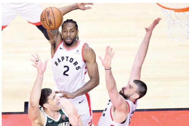
► Giannis Antetokounmpo tuvo que marcharse tras cometer su sexta falta.