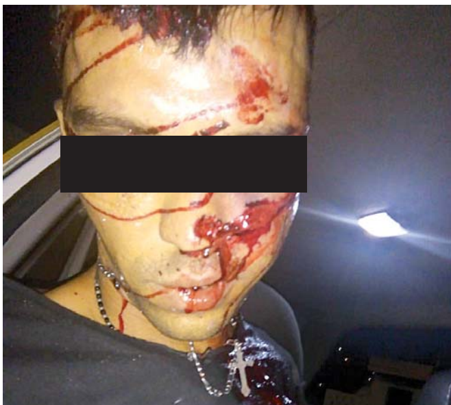
► Uno de los hombres acribillados.

policiaca@imparcialenlinea.com / Teléfono 501 83 00 Ext. 3176