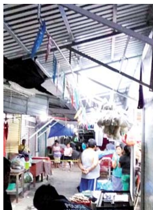
► En el mercado fue el ataque.

Según versión de los testigos presenciales, los hechos ocurrieron alrededor de las 20:30 horas del pasado sábado, cuando ya los mercantes comenzaban a cerrar sus establecimientos. Al lugar llegaron