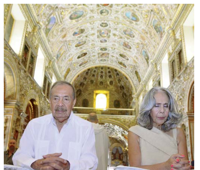
► Agardcieron a Dios por la bendiciones brindada.