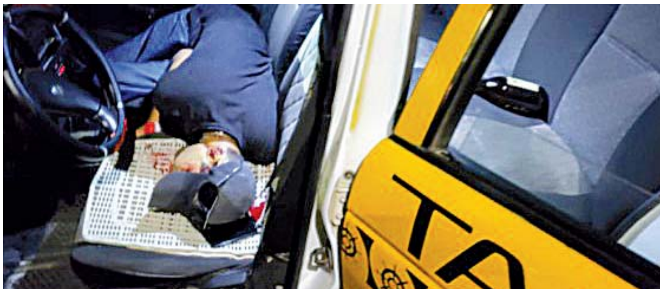
► Las víctimas viajaban en un taxi cuando fueron atacadas.

Dos hombres fueron acribillados a balazos en la carretera conocida como "Cuatro Carriles"