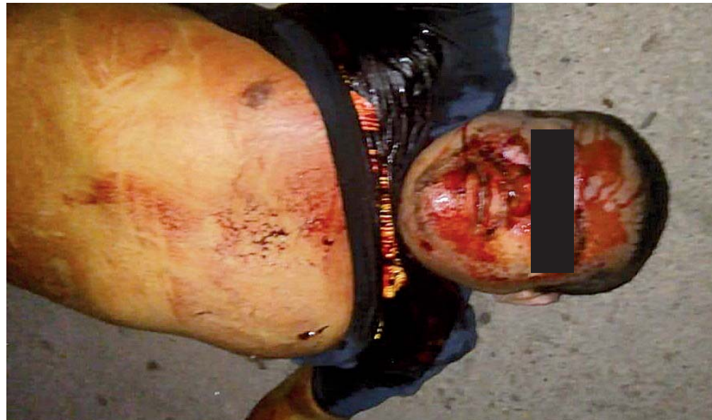
► Otro de los abatidos quedó tirado cerca de un vehículo.

Elementos de la Agencia Estatal de investigaciones (AEI) y el vicefiscal de la región llegaron a la zona de los hechos, en donde realizaron las diligencias de ley, para después ordenar el