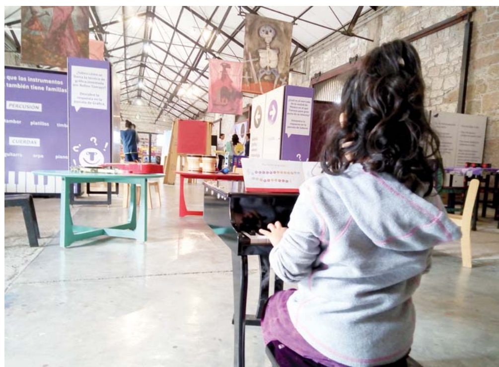
► La inauguración fue el domingo 19 de mayo.