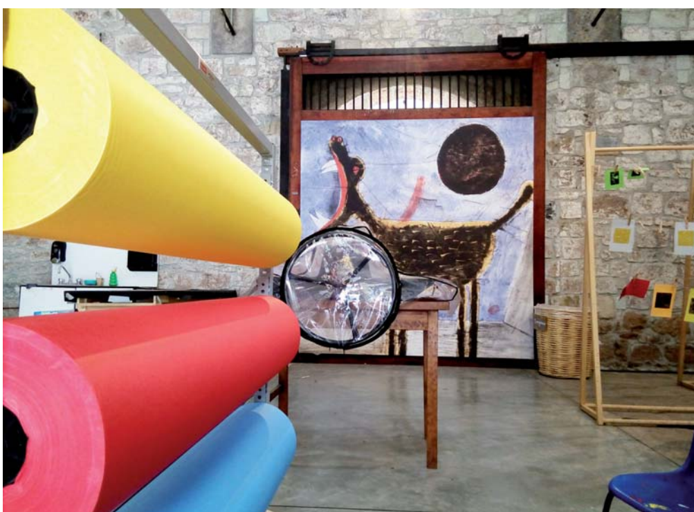
► Se estima que son cerca de 80 las obras de Tamayo.

enesena@imparcialenlinea.com / Teléfono 501 83 00 Ext. 3172