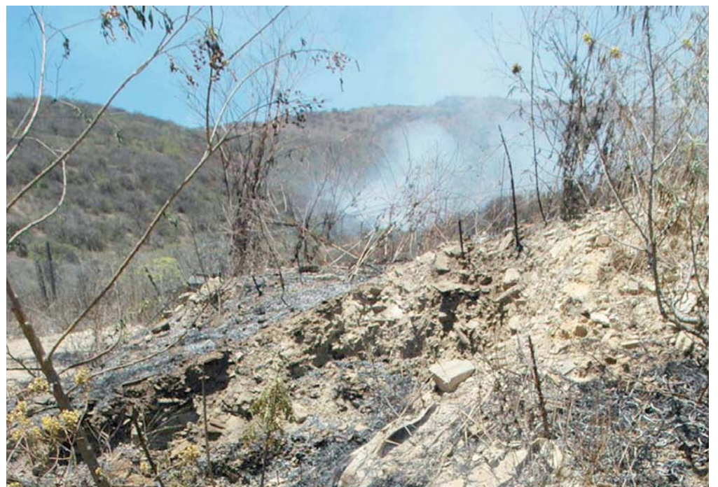
► La acelerada deforestación en Oaxaca ya es alarmante.