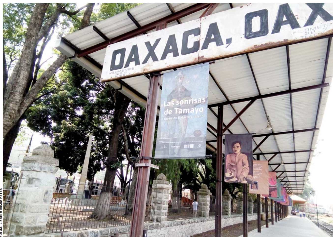
► Tanto el programa como la exposición comparten nombre.

En su nuevo programa, el MIO cuenta con el apoyo de la Fundación Olga y Rufino Tamayo, así como el Consejo Oaxaqueño de Ciencia, Tecnología e Innovación (Cocitei) y el Taller de Artes Plásticas Rufino Tamayo. Con la primera, para el uso de las imágenes y otros elementos empleados en el programa.