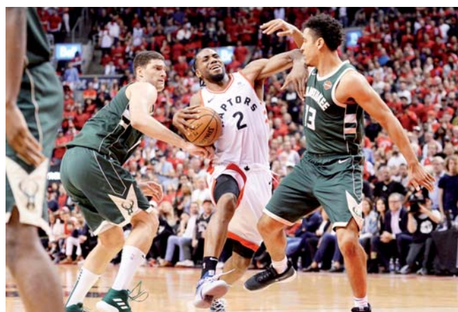
► Los de Toronto se acercaron a los Bucks en la final del este.