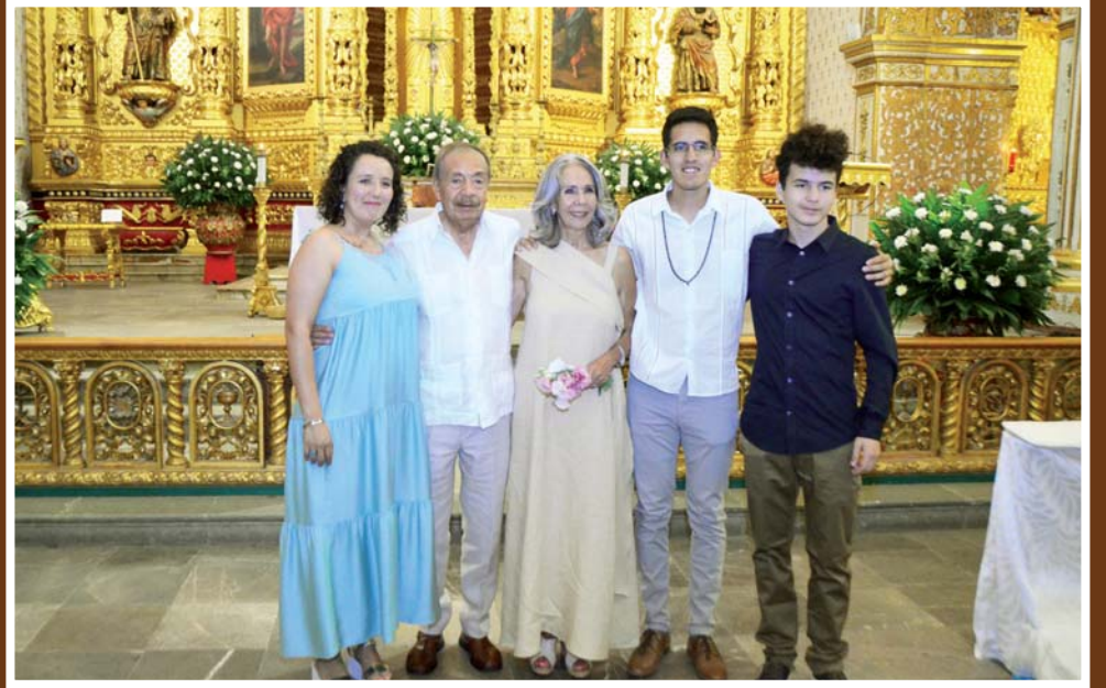
► Acompañados de sus nietos.