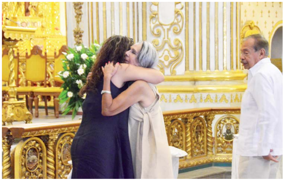
► Fueron felicitados por sus seres queridos.