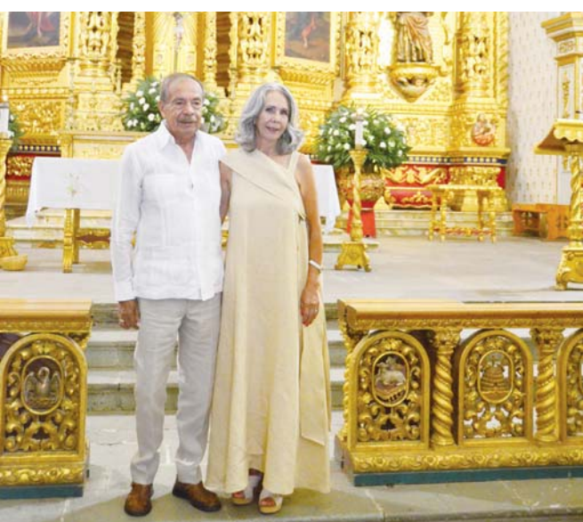
► La pareja festejó 50 años de matrimonio.