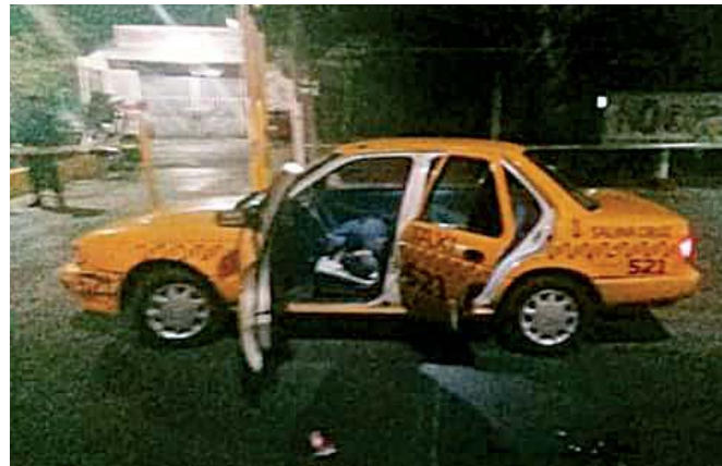
► La unidad en la que fueron atacados.

Oaxaca, el otro cuerpo yacía a un costado de una camioneta Suzuki.