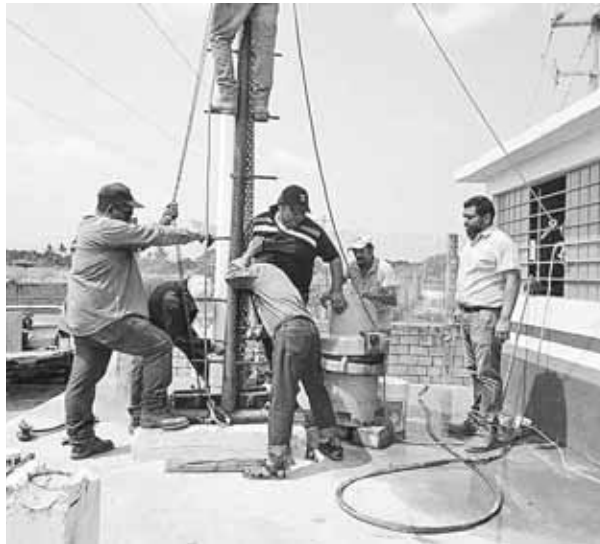
► Desde el jueves se reanudó la asistencia de agua.

Además de las colonias como la Tercera Sección, Luis Donaldo Colosio y Santa Cruz Tagolaba para darle continuidad a este servicio y permita que las familias asentadas en estas zonas puedan contar con el agua potable.