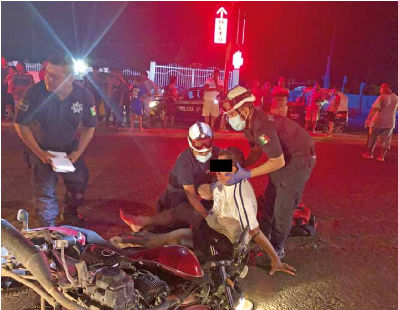
► El lesionado fue trasladado al hospital.