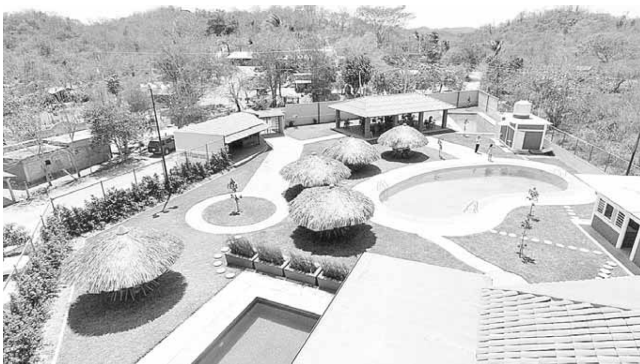
► El balneario público, El Infinito, un complejo acuático.

Se puede llegar en vehículo particular o en su