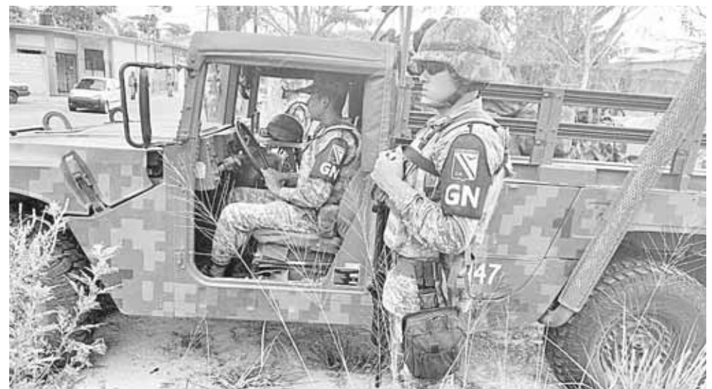
► Se realizan los cursos de capacitación y formación de integrantes.

“Nos va a ayudar a que se enfrente el problema de la inseguridad y de la violencia, protegiendo a los ciudadanos, que haya paz, seguridad pública”, expuso.