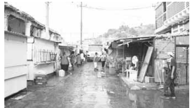
► El divisionismo impera al interior y exterior del mercado.