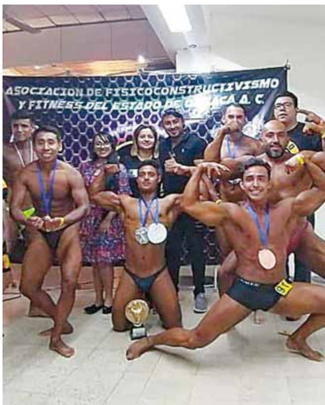
► Orgullosos representaron a la región del Istmo.