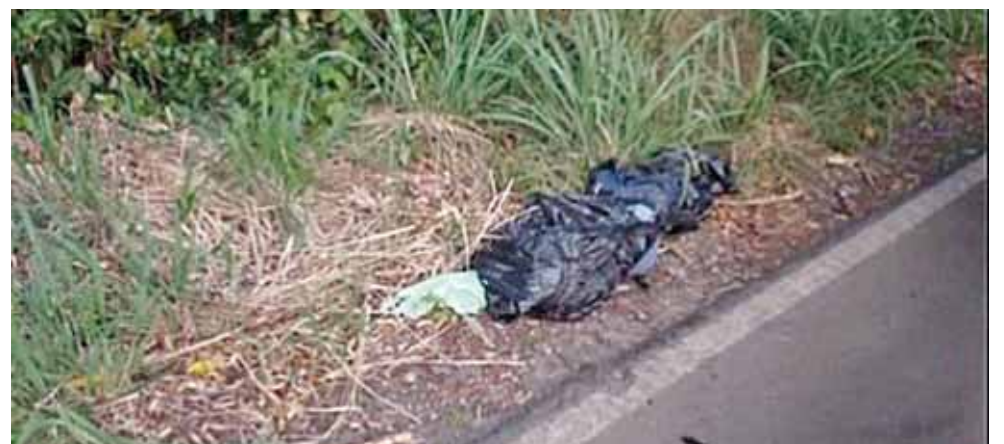
► El cuerpo presentaba huellas de violencia.

Agentes de los tres niveles de gobierno se movilizaron a un costado de la carretera federal que une al municipio Oaxaqueño San Miguel Soyaltepec y Las Granjas, del municipio de Tierra Blanca.