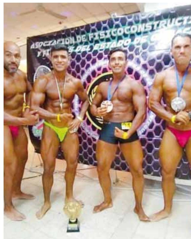
► Equipo "Istmo Team" de Salina Cruz.

Como ya es costumbre se vivió un gran ambiente con las porras integradas por familiares y amigos de los atletas.