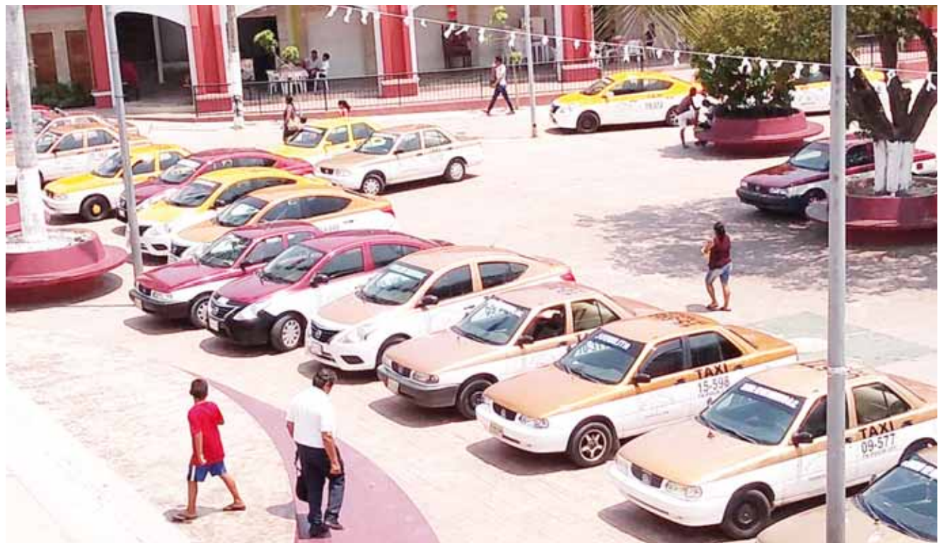
► Los transportistas buscan garantizar certeza jurídica de sus unidades.

Con lo anterior, los concesionarios de los Naranjos Esquipulas, con el curso recibido, cuentan con la nueva normatividad para una Movilidad Segura e inclu-