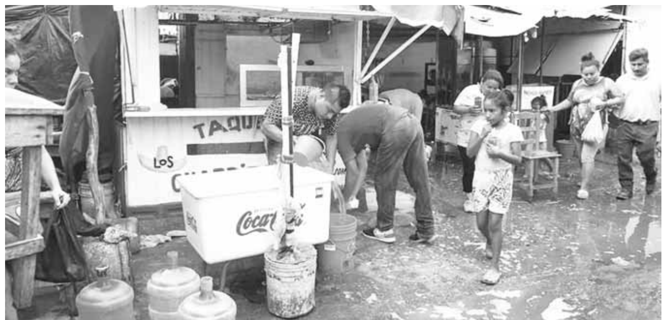
► Se ha provocado un foco de infección y contaminación en el inmueble.

que si estuvieron de acuerdo contribuyeron en la limpieza de sus locales, aunque las calles lucían repletas de aguas negras y otros desechos.