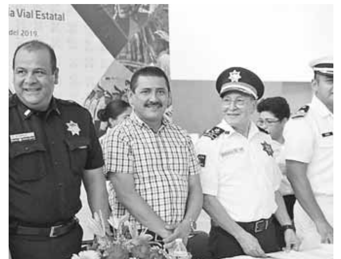
► El munícipe acompañado del Director General de la Policía Vial del Estado, José Guzmán Santos.

Esta entrega de paquetes de uniformes está compuesta por camisas, playeras, faldas, pantalones, corbatas para dama y caballero, gorra, quepí, impermeable tipo gabardina, cinturón y zapatos que beneficiará a más de 30 elementos.