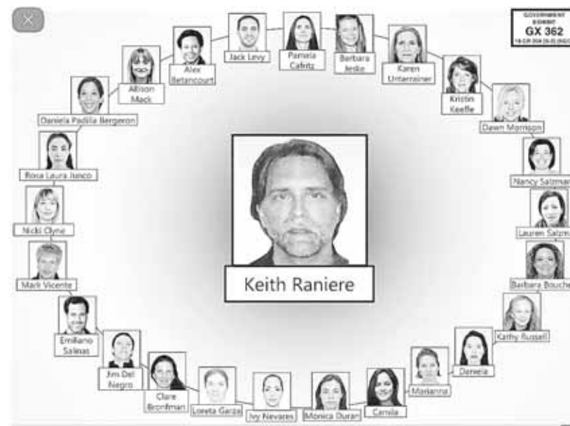
► Lista 'VIP'.

Según testimonios, las mujeres reclutadas eran marcadas con las iniciales de "gurú" y obligadas a ser sus esclavas sexuales dentro del esquema piramidal.