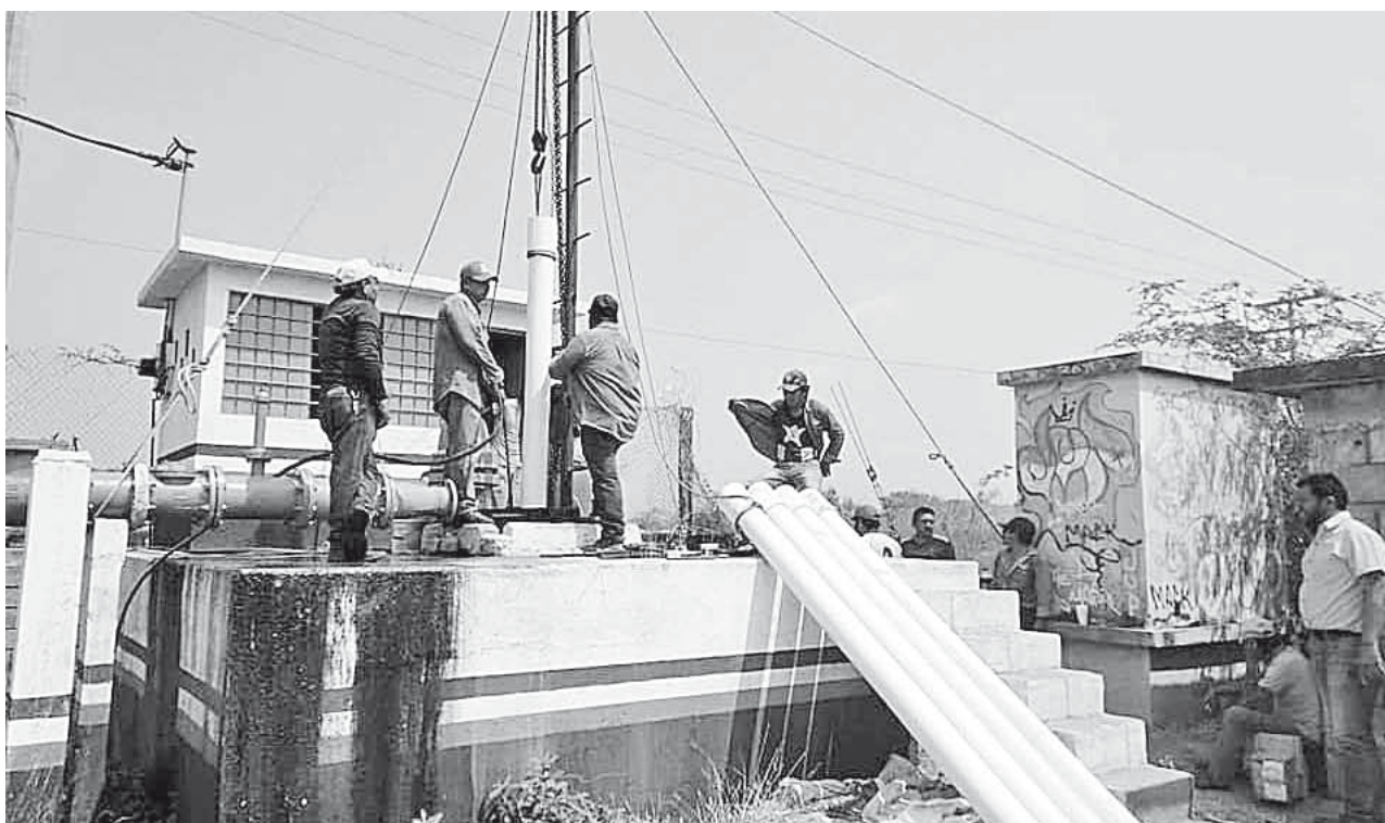
► Se busca que la ciudadanía cuente con el vital líquido.

Por último invitó a la ciudadanía a contribuir con sus pagos por el servicio que se les proporciona con la finalidad de que permita al sistema contar con recursos para seguir reparando los equipos que se dañan y resolver problemas financieros al interior de la dependencia.