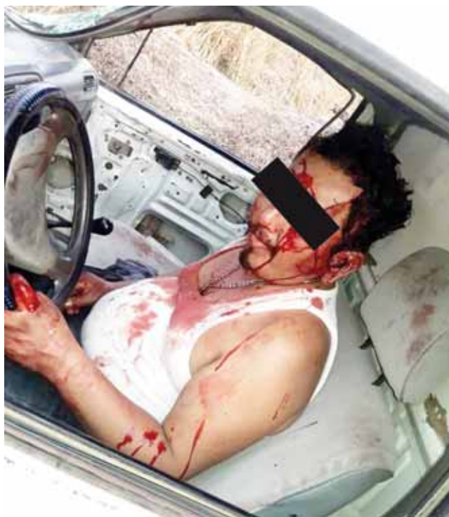
► El conductor resultó con severas lesiones.

Es importante señalar que muchos conductores manifiestan que ebrios manejan mejor, pero con esta acción se demuestra lo contrario, por lo que tránsito del estado invita a los conductores que si toman no manejen, pues los resul-