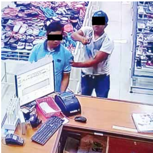
► Los delincuentes fueron captados por las cámaras.

Dentro de la unidad no se encontró a ninguna persona, pero el hecho es investigado a fondo por las fuerzas policiales, ya que se descubrieron chalecos tácticos con insignias de un grupo delictivo del crimen organizado.