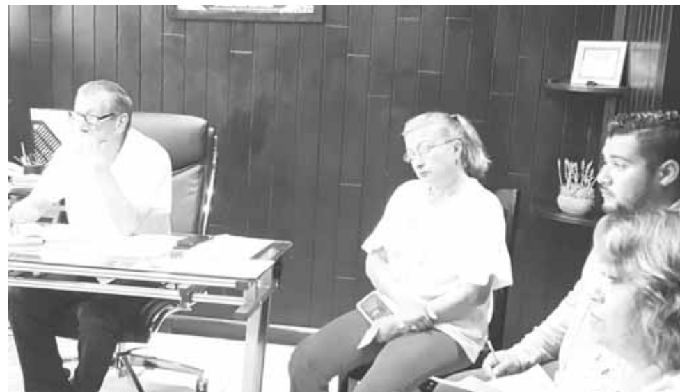
► El Ayuntamiento actuará conforme a la ley.