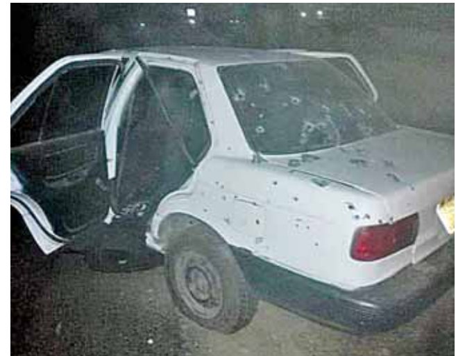
► Presuntamente el vehículo pertenece al capitán secuestrado.

En dichos casos esta vez no hubo personas detenidas a pesar de que elementos policiacos llegar a un lugar implementaron el dispositivo de búsqueda para dar con el paradero de estas personas.