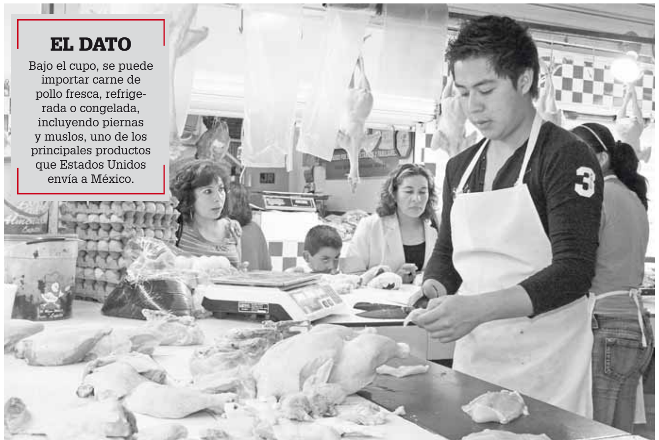
► Brasil ha incrementado las compras del producto en los últimos años.

Bajo el cupo, se puede importar carne de pollo fresca, refrigerada o congelada, incluyendo piernas y muslos, uno de los principales productos que Estados Unidos envía a México.