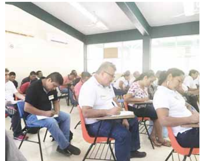
► Sus datos ingresan a una base de datos digitalizada.

CATEM debe de apoyarnos a que no estemos pagando por tanto requisitos y que nos dejen trabajar; nuestros papeles siempre los tenemos en regla, sino, no nos dejarán mover nuestras unidades", aclararon.