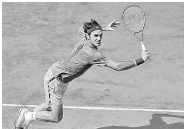
► Federer prefiere ir despacio, ganando confianza partido a partido.

que estoy jugando un buen tenis, ¿pero será suficiente contra los mejores cuando lleguen las cosas serias? No estoy seguro”, afirmó.