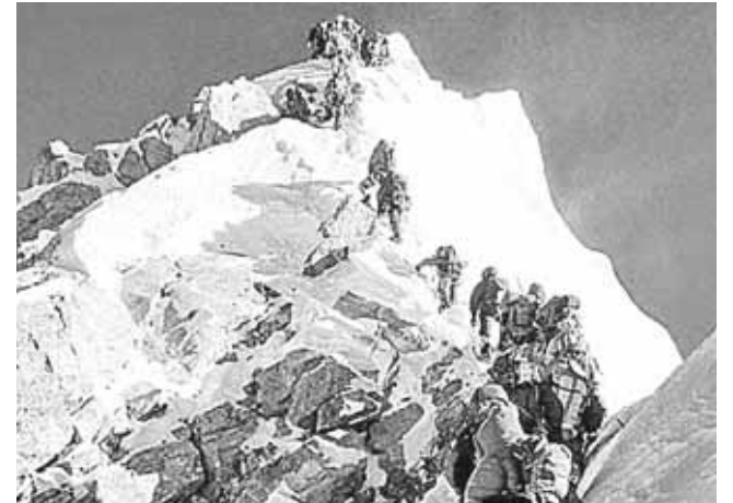
► Decenas de personas hacían fila en un tramo estrecho para llegar a la cima.

“Muchas cosas han cambiado. La pista central es diferente. Hay muchas mejores, hubo inversiones y se nota. Es algo bueno. Pero sin dejar de ser el viejo Roland Garros, con sus peculiaridades. Es muy agradable encontrarme con amigos aquí. Estoy feliz por estar de vuelta”, sonrió.