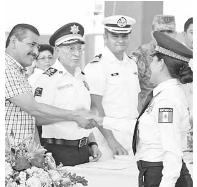
► Los exhortó a seguir trabajando a favor de la población.