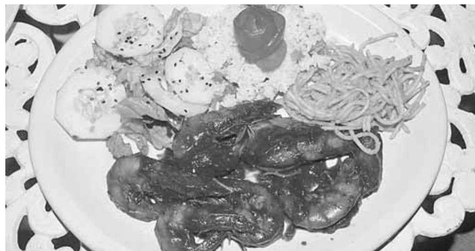
► Y saborear deliciosos platillos.

La alberca es visitada en cualquier época