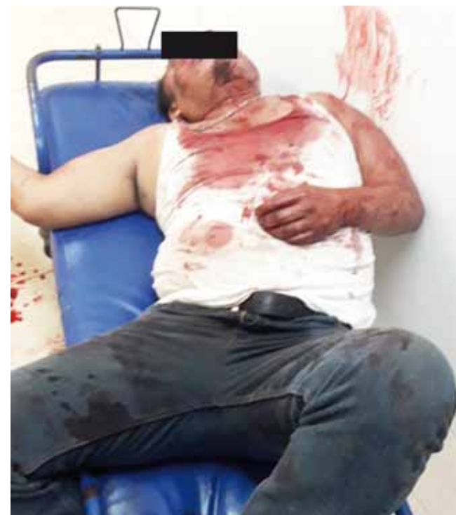
► Fue trasladado al hospital.

tados son lamentables, aunque en esta ocasión no pasó a mayores, pero es de tener cuidado con las consecuen-