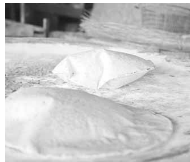
► Deliciosas tortillas hechas a mano.

dejan en la entrada a Paso Lagarto que queda a unos dos kilómetros de distancia.