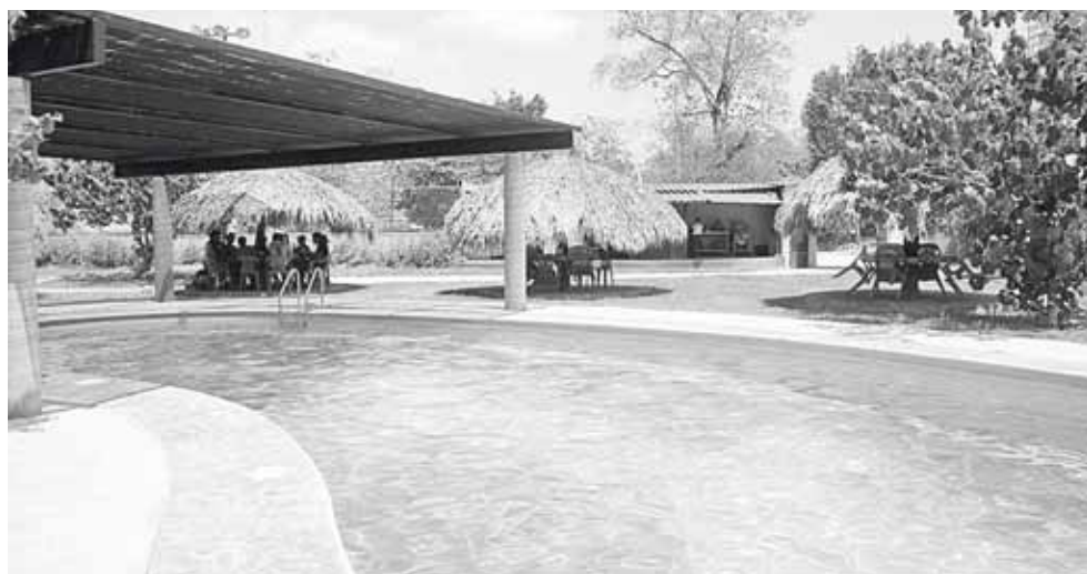
► Los visitantes pueden disfrutar en cualquier temporada de sus cálidas aguas.