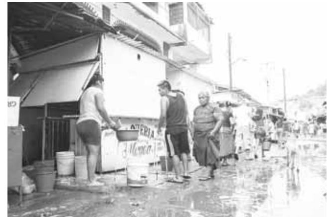
► El mercado alberga más de 600 comerciantes.

que si estuvieron de acuerdo contribuyeron en la limpieza de sus locales, aunque las calles lucían repletas de aguas negras y otros desechos.