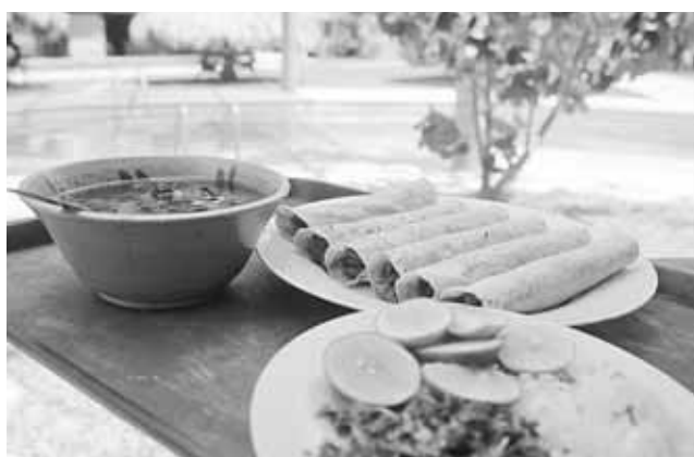
► La rica barbacoa es un manjar.

caso, tomar un taxi colectivo o camioneta pasajera de Pochutla a Tonameca que te