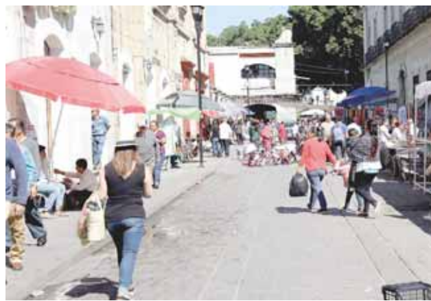
► Los puestos y estructuras de los vendedores han afectado las fachadas de los edificios.