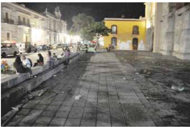
► La presencia de basura también ha dañado parte de algunas estructuras.