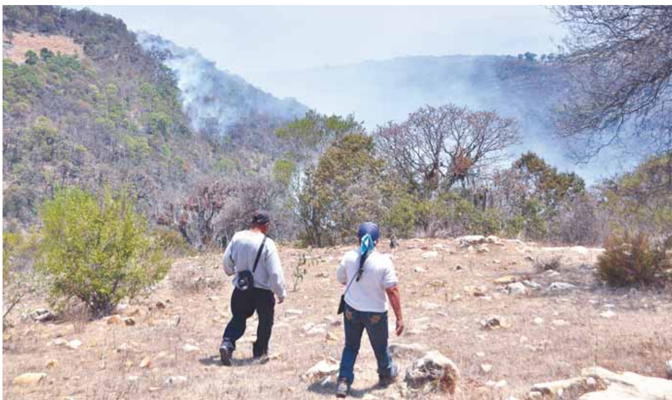
► Un incendio forestal que inició hace ocho días, sigue consumiendo el bosque del municipio de Santiago Tilantongo. Campesinos de Hermenegildo Galeana combaten el fuego como pueden.

MIGUEL ÁNGEL MAYA ALONSO