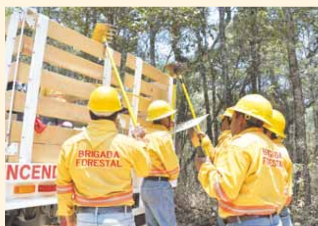
► Brigadistas de Coesfo llegaron ayer a Tilantongo.

sitamos el trabajo, nuestras familias tienen que comer”, dice uno de los brigadistas mientras los demás lo apoyan con gestos y palabras de aprobación; “ya sabemos cómo cuidarnos, pero no estamos exentos de una tragedia”.