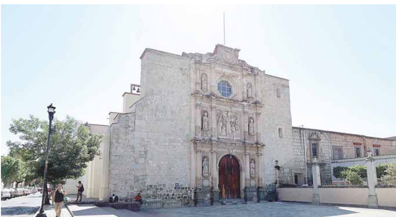
► Exhortan a los ambulantes a evitar daños al patrimonio histórico.

De acuerdo a comerciantes establecidos, la presencia de ambulantes ha crecido en más del 20% en los últimos meses, sobre todo en las inmediaciones de los templos o iglesias, con la complacencia de las autoridades.