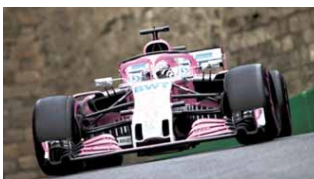
Sergio Pérez con buenos augurios para el GP Azerbaiyán.

Esa acción provocó que el tapatío perdiera su posición y debiera entrar a pits para reparar los daños, ya un-