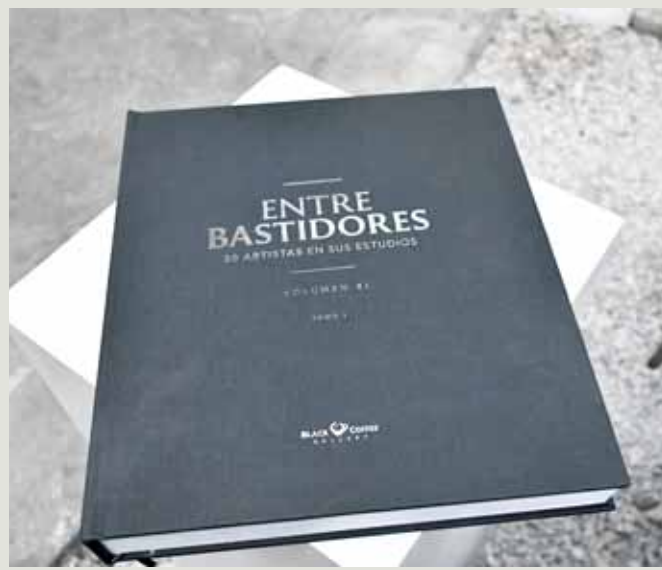
► El título comprende crónicas basadas en los estudios de los 30 autores incluidos en el ejemplar.