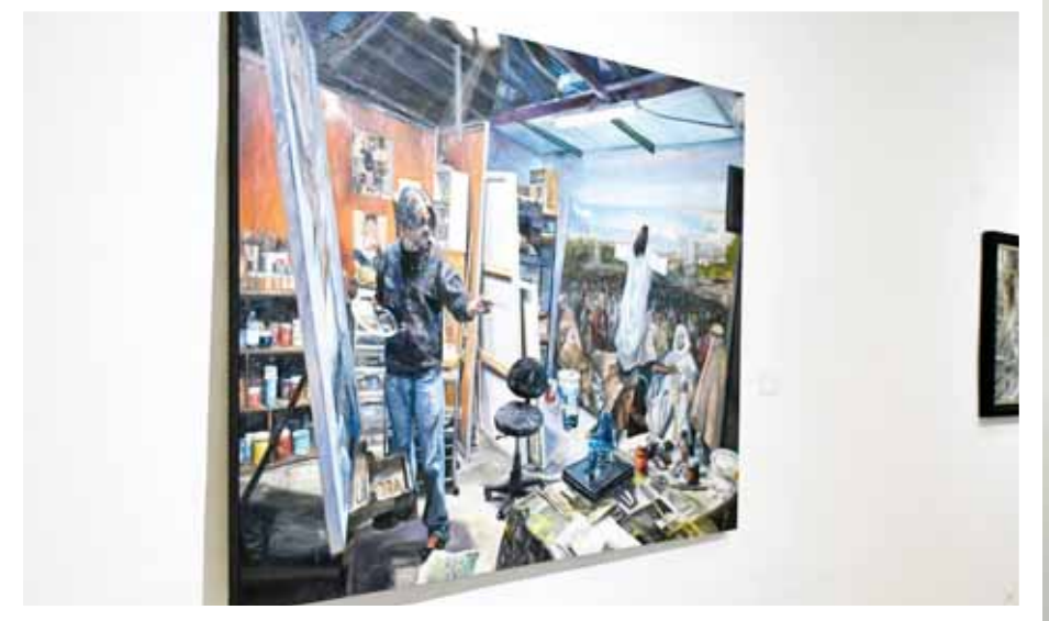
► La editorial Black Coffee Gallery ofrece un panorama amplio del arte que se está desarrollando en el país.