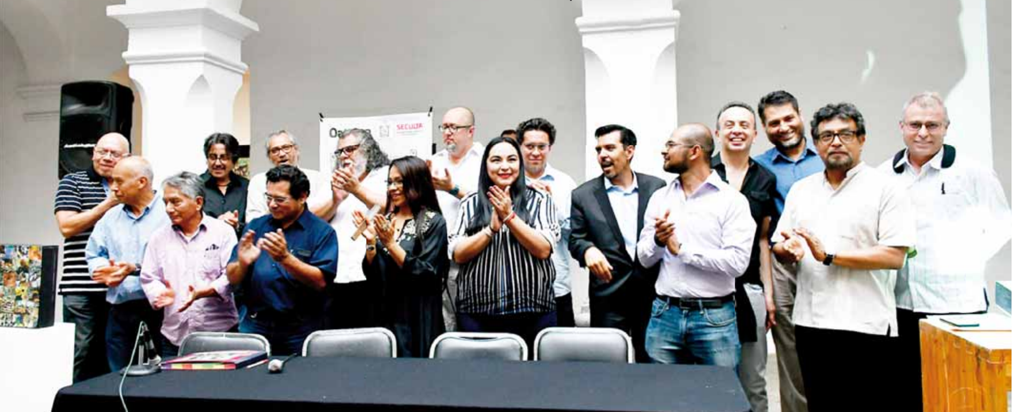
► Tanto en la exposición como la publicación se encuentran nueve artistas oriundos de Oaxaca.