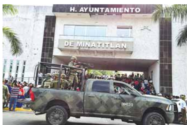
► Inicia operaciones la GN en Minatitlán, Veracruz.