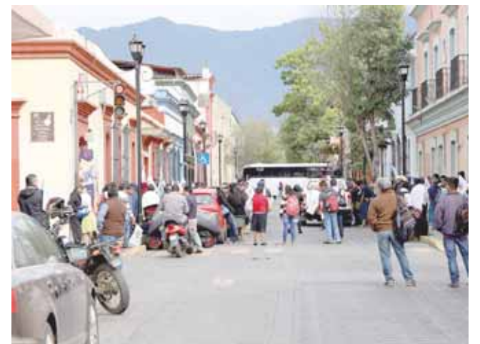
► En la ciudad de Oaxaca de enero a marzo del 2019 se contabilizaron 21 marchas, 74 bloqueos y 45 mítines.

El municipio reportó 189 reuniones y mesas de trabajo con organizaciones sociales, líderes de comerciantes ambulantes y vecinos de colonias, además de 617 casos de ciudadanía en general atendida en audiencia.