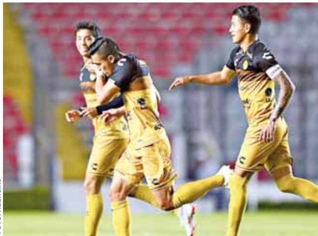
Dorados tiene un pie en la final.