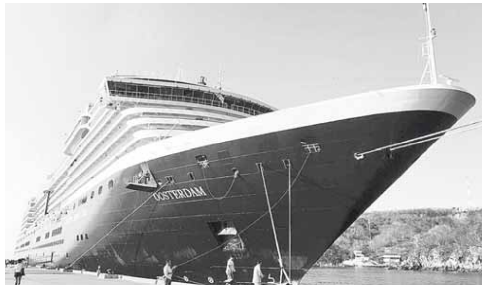
► El miércoles arribó el Oosterdam con mil 698 visitantes a bordo.