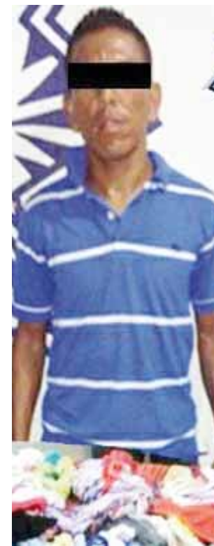
► "El Biche" fue asegurado por elementos policiacos.

Al ser asegurado "El Biche", ahora conocido en la Cuarta Sección como "El Roba Calzones", fue puesto a disposición de la Fiscalía Local de ésta ciudad en donde se determinó su