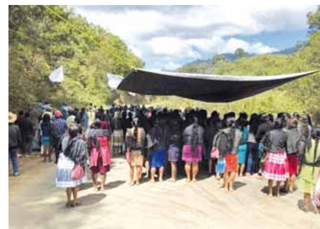
► Bloqueo carretero en Santiago Yaitepec.

mil 248.80 pesos. Cabe resaltar que el conflicto entre Santa Catarina Juquila y Santiago Yaitepec por terrenos agrarios del paraje El Pedimento no ha logrado solucionarse, pues la carretera estatal que lleva