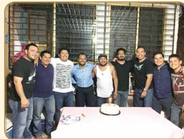
▶ Se tomó la foto del recuerdo con sus amigos.