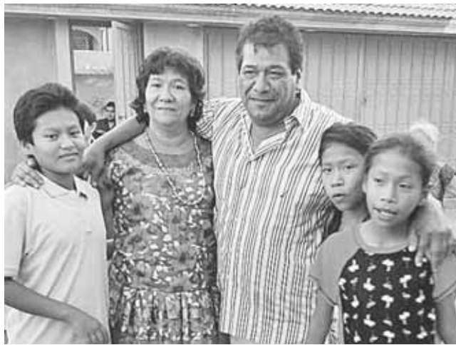
► Junto a su esposo e hijos.

Desde este espacio le enviamos nuestros mejores deseos.