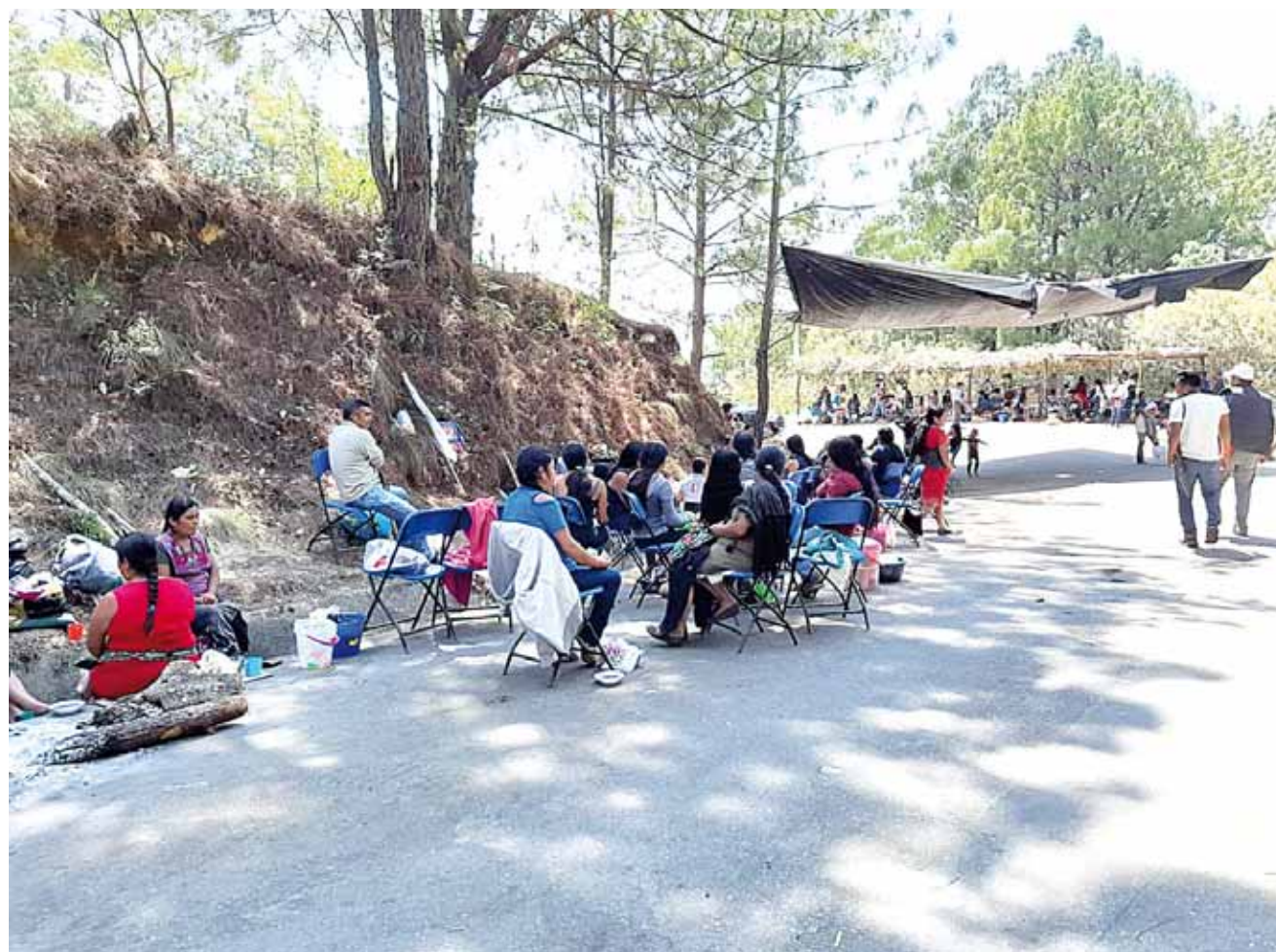
► El conflicto entre Santa Catarina Juquila y Santiago Yaitepec no ha logrado solucionarse.