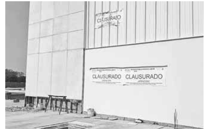
► Llevaba varios meses suspendida

Dijo que estos incendios acaban con la vegetación, los animales y los árboles que crecen de manera natural.