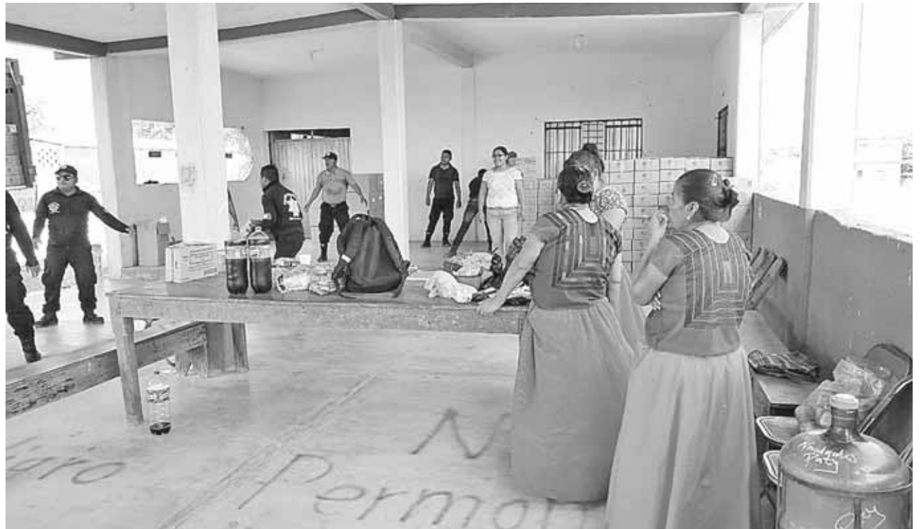
► Los jóvenes abandonan la escuela porque carecen de recursos para poder continuar con su educación.

“Aunque le compre zapatos que no pasen de los 300 pesos, sigue siendo un problema porque no alcanza el dinero pues mi marido