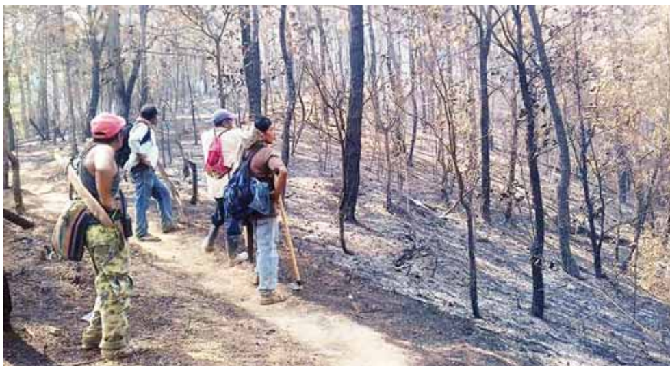
► Más de 300 hectáreas de bosques y fauna que habitan en seis comunidades de la Sierra Mixe-Zapoteca, fueron consumidas por el fugo.

Los habitantes siguen luchando en esa zona para evitar que este incendio se reactive y provoque nuevamente daños a la vida silvestre en esas montañas que ha sido difícil poder acceder.