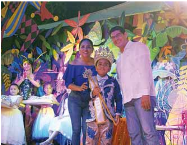
► El momento de la coronación.