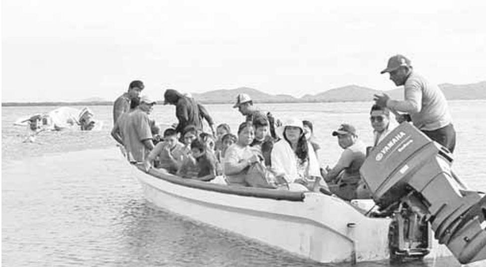
► El conflicto agrario continúa.

En la zona de San Mateo viven un promedio de 10 mil familias quienes enfrentan problemas por falta de mejores oportunidades de vida para sobrevivir.