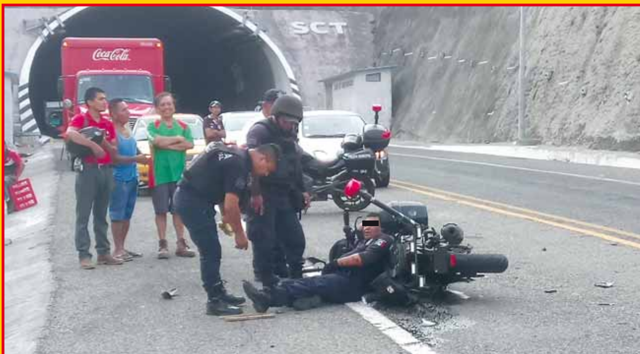
► Uno de los policías lesionados.

Por lo que será la autoridad competente la encargada de investigar y deslindar responsabilidades de este brutal accidente que enlutó al cuerpo de la Policía Municipal.