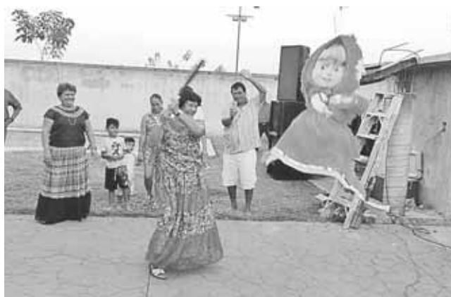
► La cumpleañera rompió la piñata.