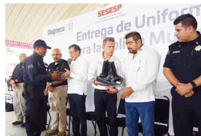
► Entregaron uniformes a los policías municipales.