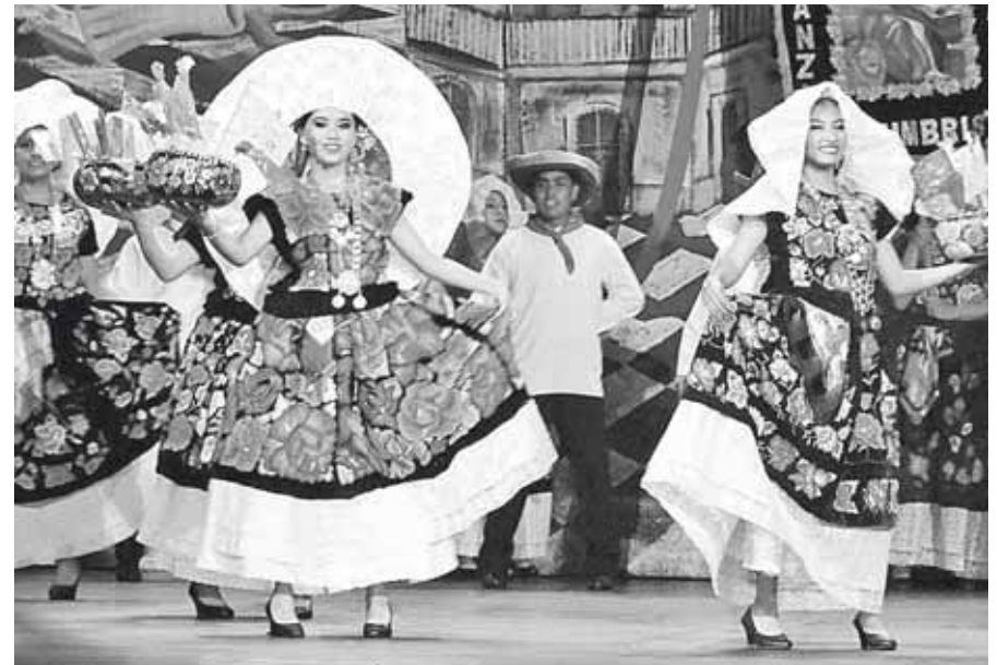
► Hermosas tehuanas.

Las autoridades brasileñas también acusaron a Rosell de usar una de sus compañías para beneficiarse ilegalmente de un amistoso entre Brasil y Portugal en 2008. Fue absuelto en ese caso.