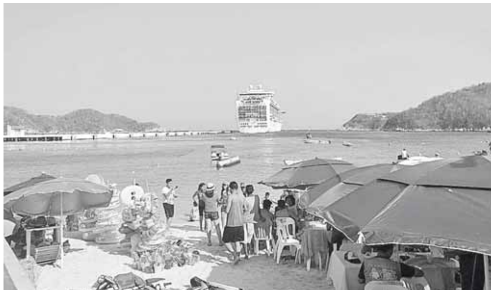
► Fueron recibidas 4079 personas, entre pasajeros y tripulantes del crucero EmeraldPrincess.