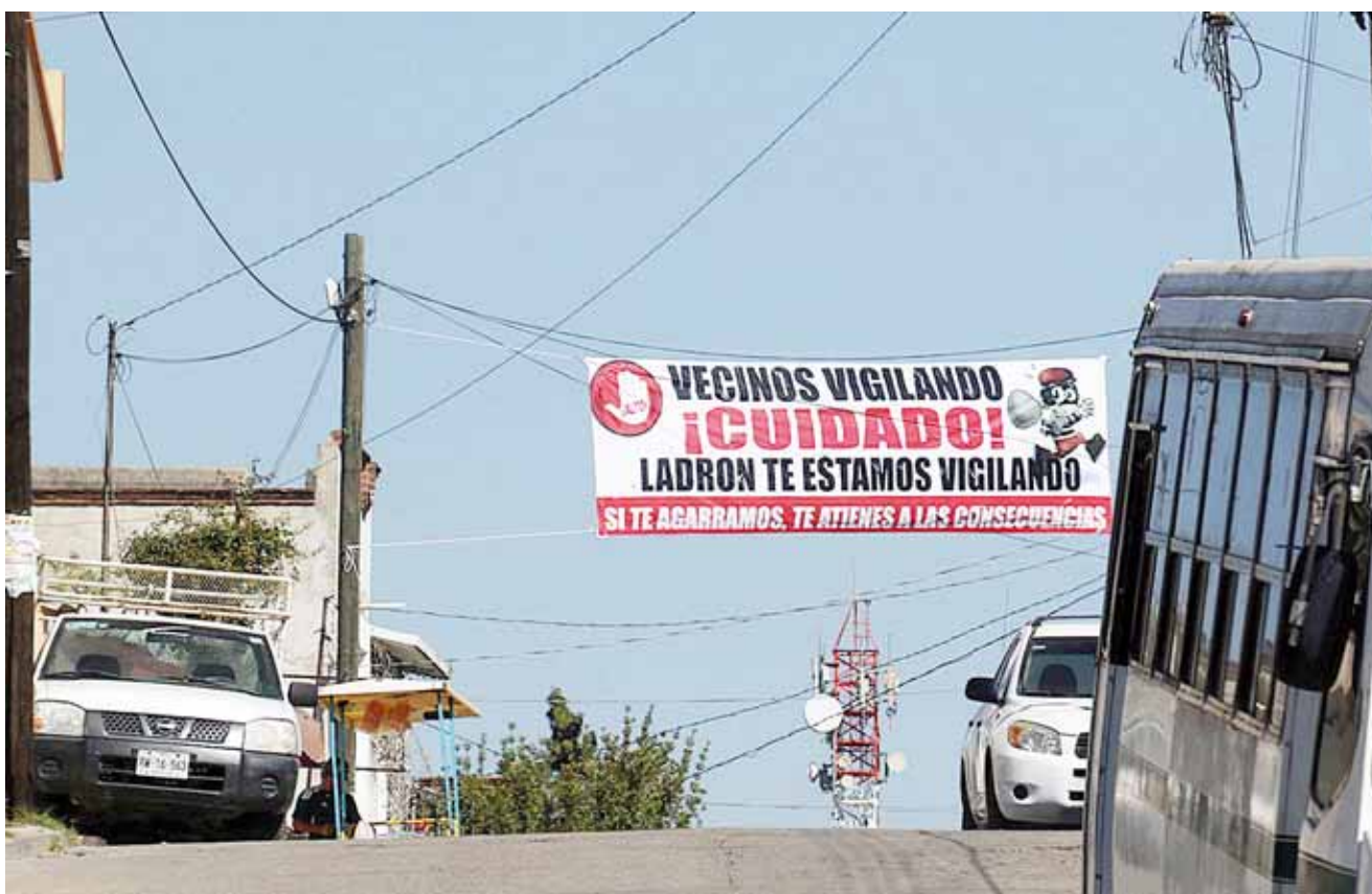
► Colonos de la ciudad de Oaxaca se han organizado contra la delincuencia.

Posteriormente en la explanada municipal de este lugar, el secretario ejecutivo del Sistema Estatal de Seguridad Pública en Oaxaca, José Manuel Vera Salinas entregó a nombre del Gobierno de Oaxaca, 80 uniformes a elementos de la Policía Municipal, por un monto de 275 mil 400 pesos del Fondo de Aportaciones para la Seguridad Pública, los cuales constan de pantalón tipo comando, playera y botas tácticas.