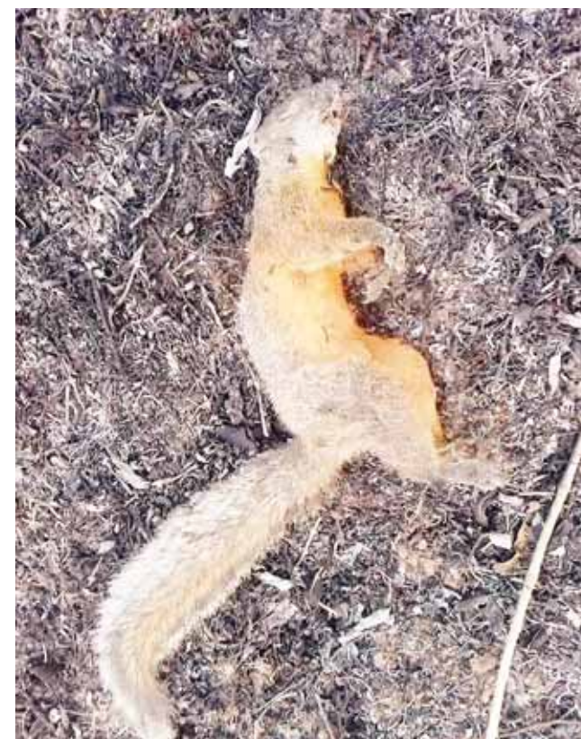
► Huellas de dolor y tristeza.

tero de la Comisión Nacional Forestal se comenzó el sobrevuelo para evaluar los daños e iniciar con las labores para sofocar el incendio que se había salido de control.