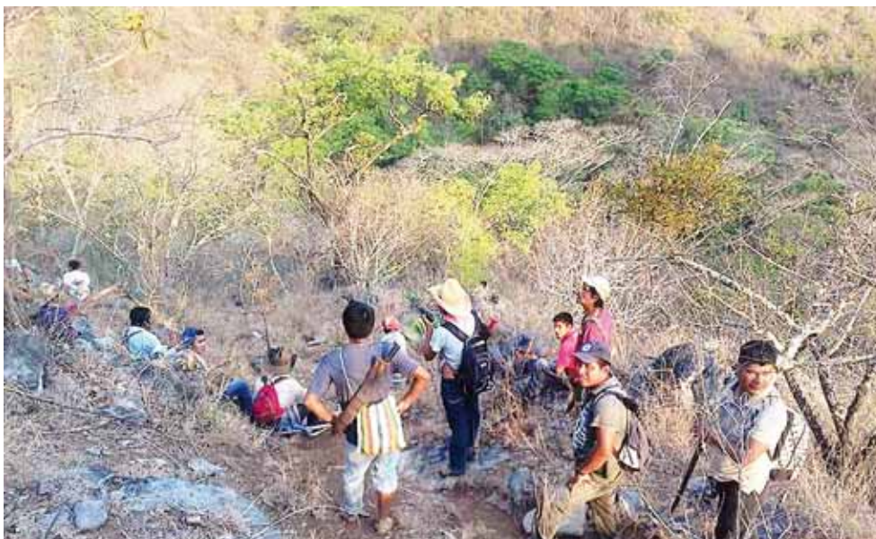
► Con rastrillos, machetes y palas, los pobladores trabajaron durante días para intentar detener el fugo.

avanzaban e iban acabando con las especies de animales que se encontraban a su paso y que intentaban huir del incendio.