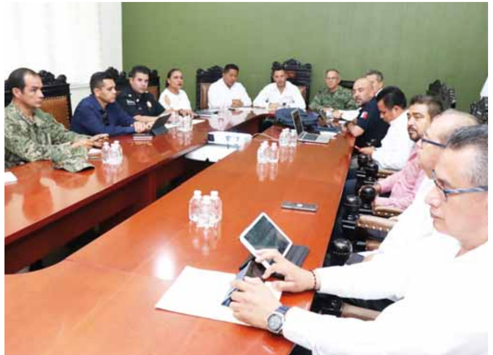
► El gobernador Alejandro Murat instaló la Primera Reunión de Seguridad.

ca, Andrés Manuel López Obrador, estará arribando la Guardia Nacional a Tuxtepec en junio próximo, pues es será la primera región a donde la Guardia Nacional venga a sumarse a estas acciones coordinadas para dar a la ciudadanía la seguridad que demandan.