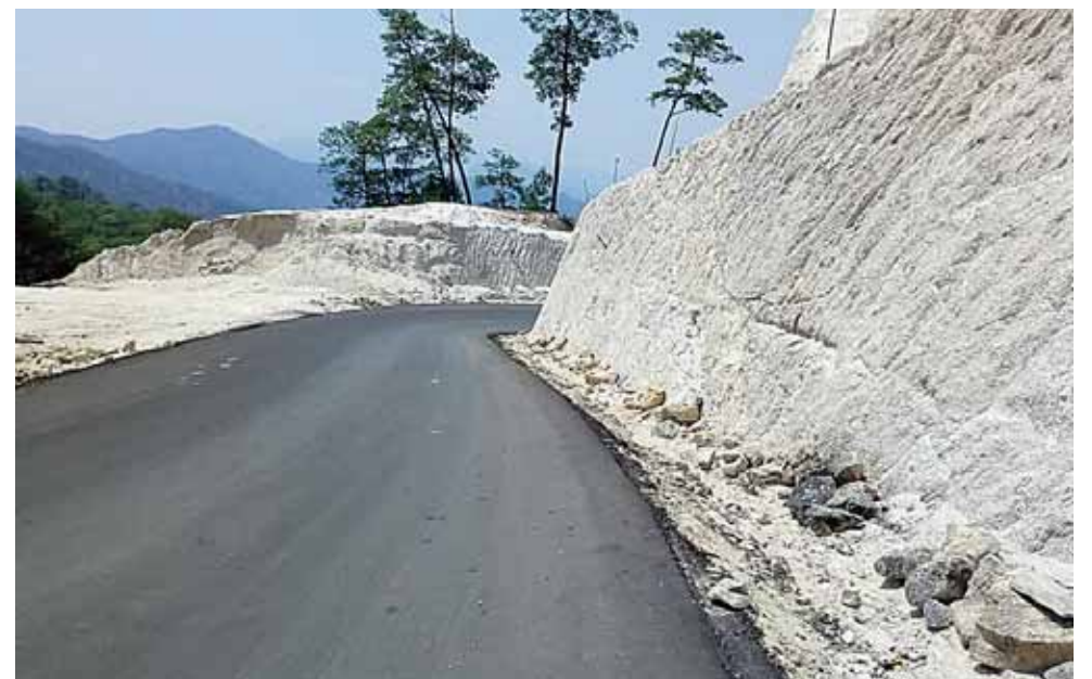
► Exigen pronta terminación de la carretera.

Dijo que los caminos se realizarán a base de concreto hidráulico y con mano de obra de los pobladores del municipio; y que los recursos se administrarán por las autoridades municipales.