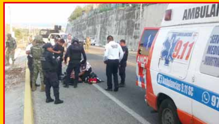
► El suceso se reportó a la línea de emergencias 911.

tas debido a la gravedad de sus lesiones.