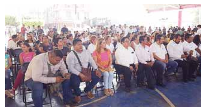
► Los asistentes fueron testigos de este magno evento.