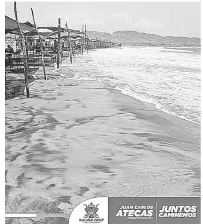
► Hubo vigilancia en agencias y playas de las Salinas del Marqués.