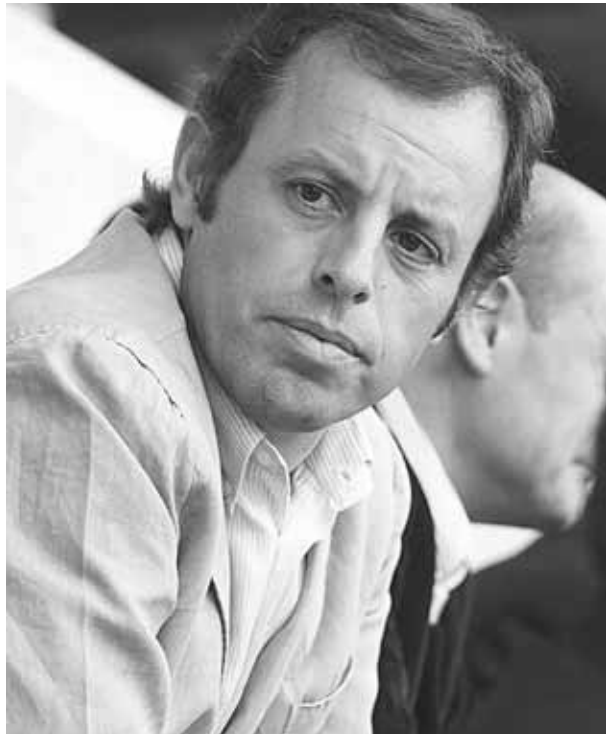
► Sandro Rosell fue acusado vender derechos de transmisión televisiva de partidos relacionados a la selección de Brasil.

Rosell, de 55 años, ex ejecutivo de Nike en Brasil, presidió el Barcelona entre 2010 y 2014. Los cargos en su contra no estuvieron directamente relacionados al período que fungió como presidente del club catalán. El actual presidente del