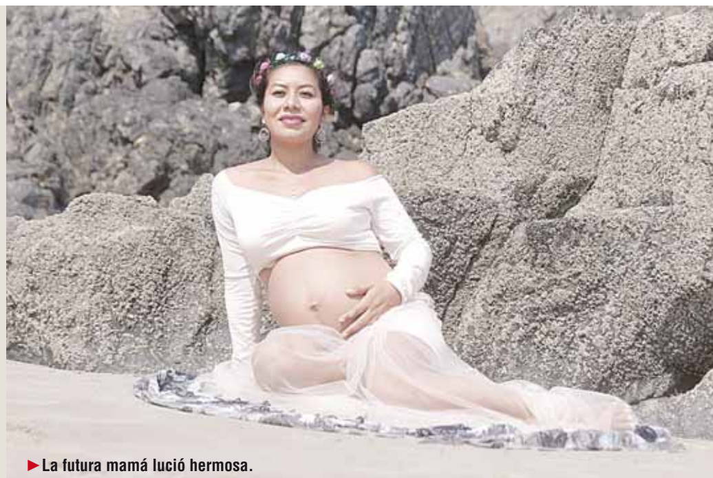
▶ La futura mamá lució hermosa.

Para conservar un bonito recuerdo compartió este momento en una sesión fotográfica en la que Mamis Boutique fue cómplice, ya que la futura mamá lució hermosos modelos de vestidos.