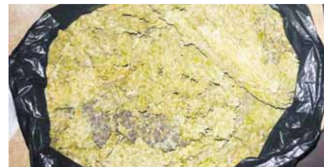
► Los elementos policiacos le encontraron que en una bolsa de nylon de color negra llevaba hierba seca con las características de la marihuana.

de un peso aproximado de un kilogramo, por lo que fue asegurado y trasladado a San Pedro Pochutla en donde fue puesto a disposición de la autoridad correspondiente para que se determine su situación jurídica.