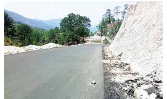
► Total abandono.

carretera no cuenta con señalizaciones ni las líneas en el asfalto, por lo que pidió a alguna autoridad competente aclarar esta situación.