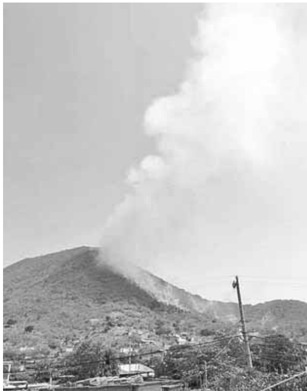
► Se puso en riesgo la vida de 200 habitantes.

Poco más de 30 hectáreas se quemaron a consecuencia del incendio que iba avanzando con rapidez entre el cerro las Palomas