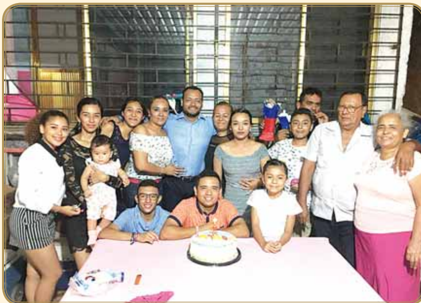
▶ Acompañado de sus padres, hermanas y demás familiares.