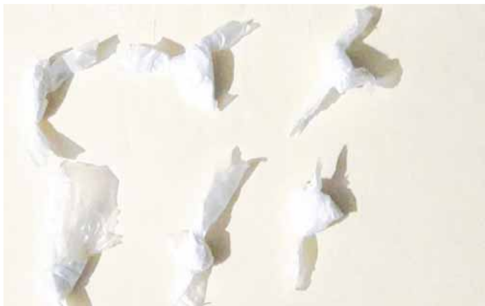
► La droga fue asegurada.