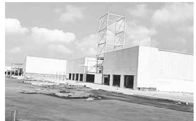
► Ya cumple con requerimientos necesarios.