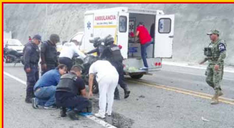
► Cuerpos de rescate arribaron al lugar.