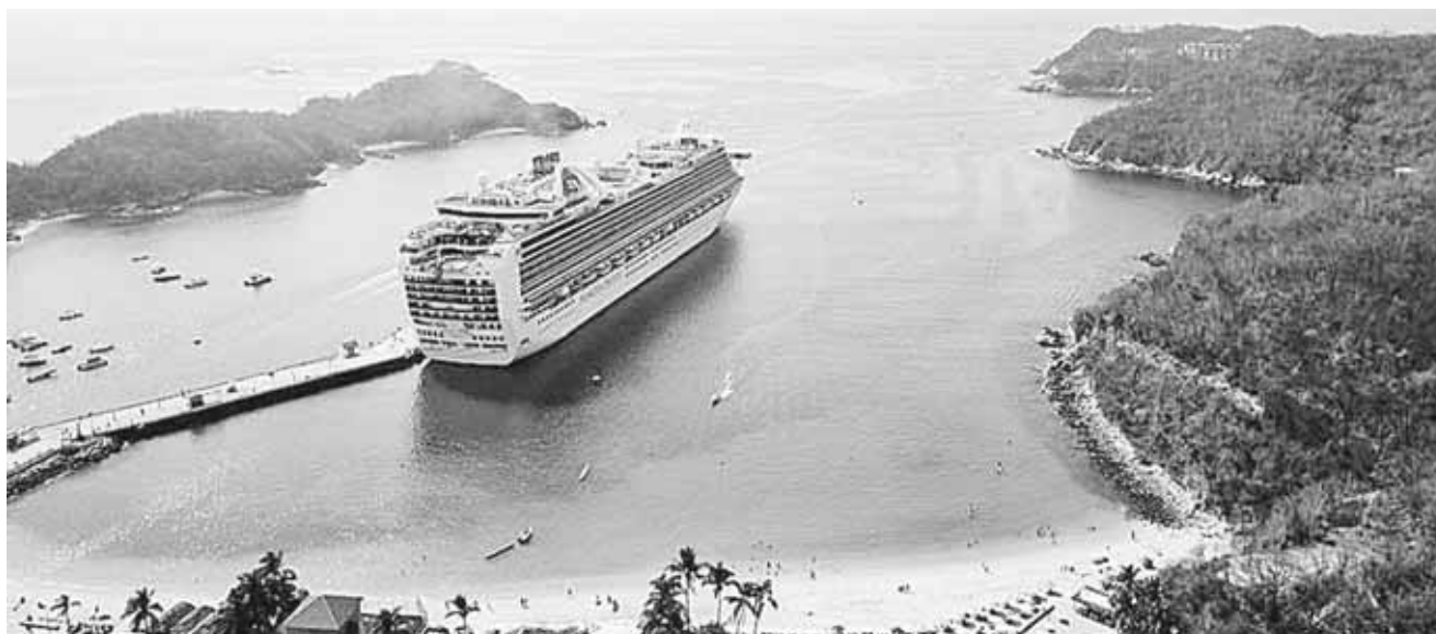
► Con la llegada de cruceros, el destino recibe más derrama económica.