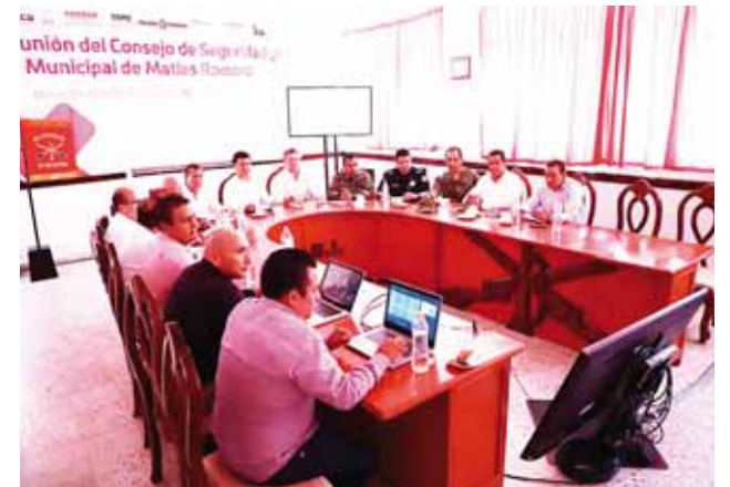
► El fiscal general del Estado, Rubén Vasconcelos, encabezó la reunión.

Es importante señalar que de los 85 homicidios dolosos ocurridos en marzo, 68 fueron con armas de fuego; en el primer trimestre se acumulan 204 asesinatos con arma de fuego, por 20 con arma blanca y 11 con otro elemento.