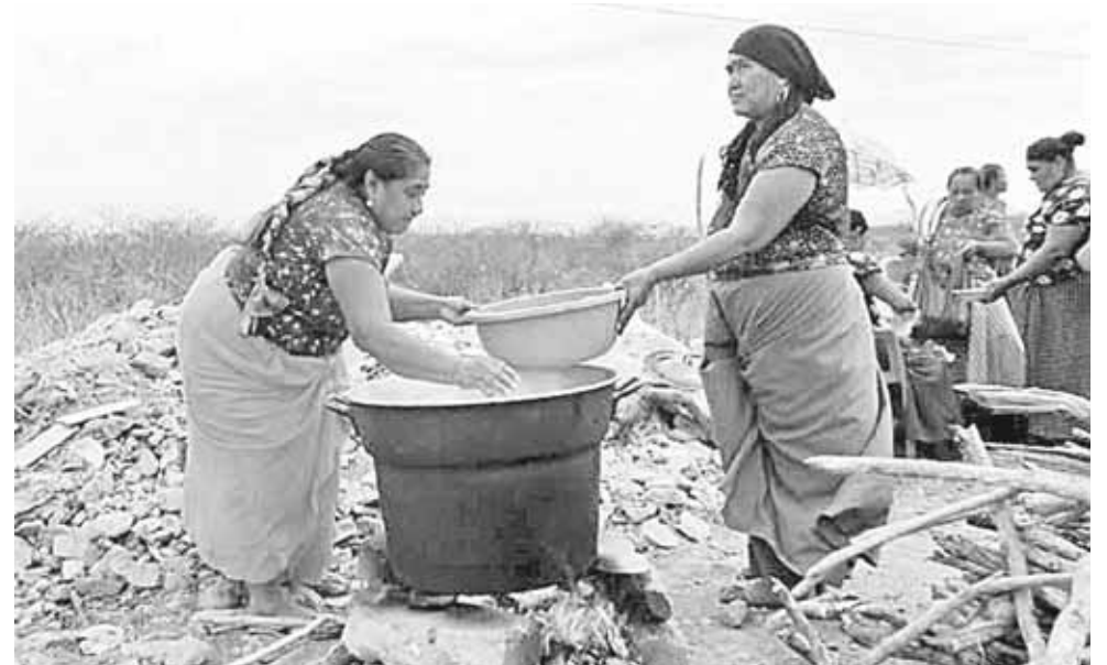
► Las mujeres se dedican al hogar.