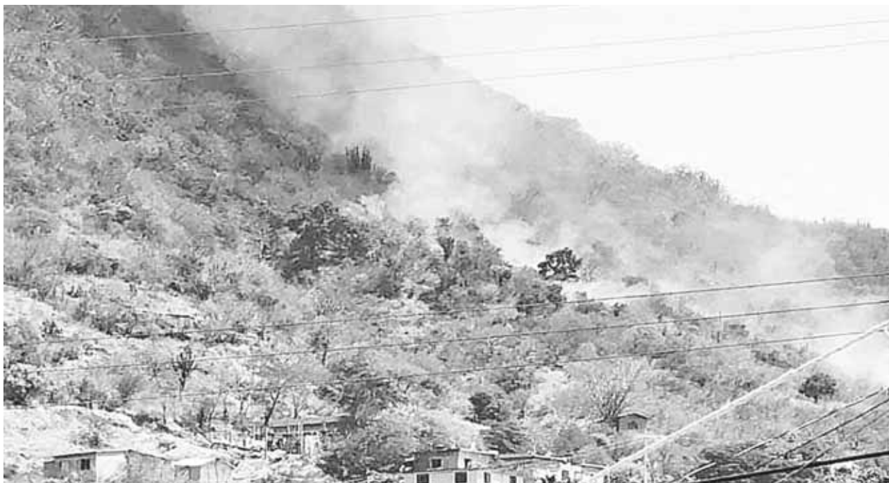
► El incendio arrasó con parte del cerro las Palomas.

Y añadió que se ha estado vigilante del cumplimiento de todas las normas para dar todas las facilidades a los empresarios y entre en operaciones la plaza a la brevedad posible.