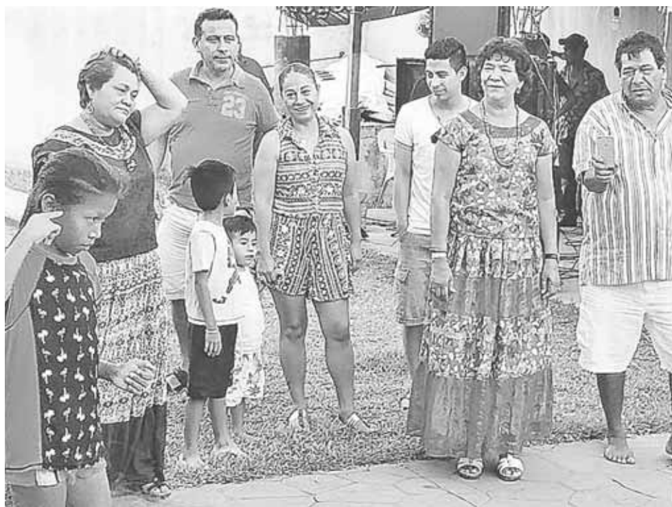
► Rodeada de amigos y familiares.