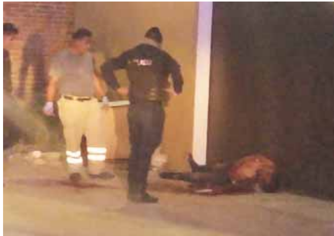
► La víctima quedó tendida en la banqueta.

levantado y llevado al anfiteatro de la ciudad, en donde le sería practicada la necropsia de ley.