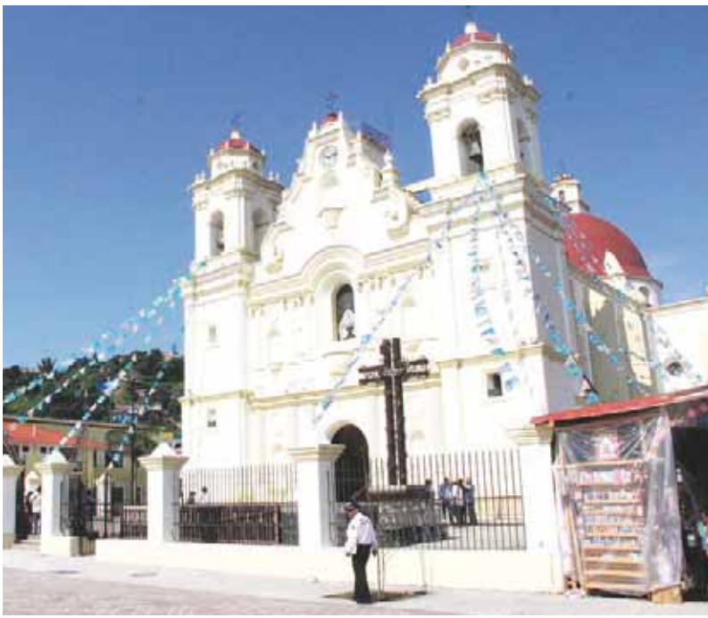
► Desolación en Juquila ante el nuevo bloqueo carretero de Santiago Yaitepec.

La instancia defensora lamentó que una de las partes incumpliera el acuerdo de paz que ya se había establecido con la mediación de la autoridad estatal, e hizo votos porque los representantes de los gobiernos federal, estatal y municipales encuentren un método pacífico que involucre a los tres órdenes en el proceso para salvaguar-