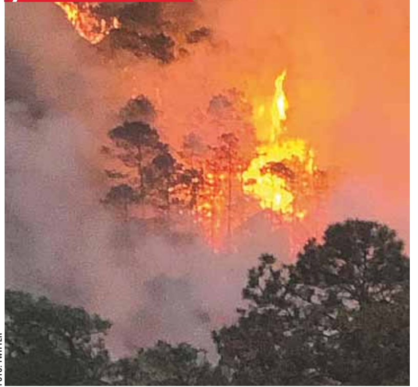
► Los incendios forestales siguen arrasando con los bosques de Oaxaca.