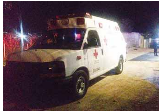
► La ambulancia llegó al lugar de los hechos.

ción, el hombre no había sido identificado y fue depositado en calidad de desconocido, se esperaba que en las próximas horas familiares identificaran el cuerpo y lo reclamaran.