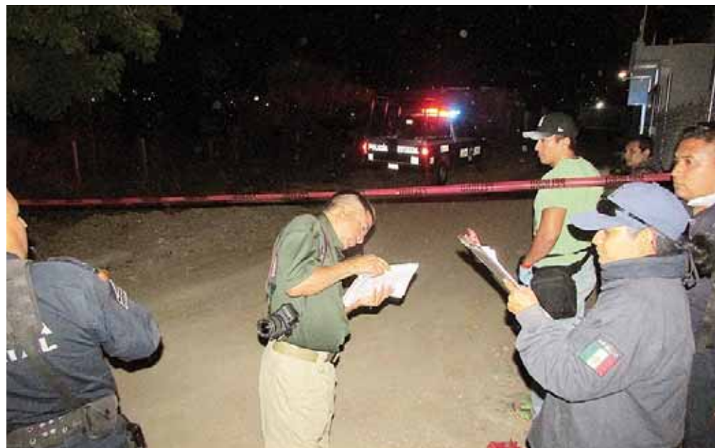
► La Policía resguardo la zona del incidente.