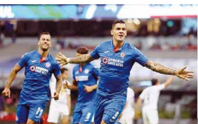
Cruz Azul llega a 26 puntos y es cuarto.

Con esto, Cruz Azul llega a 26 puntos y es cuarto, además de que está casi calificado. Los Pumas, por su parte, se quedan con 16 unidades y sería un gran milagro que se pueda meter a la Liguilla.