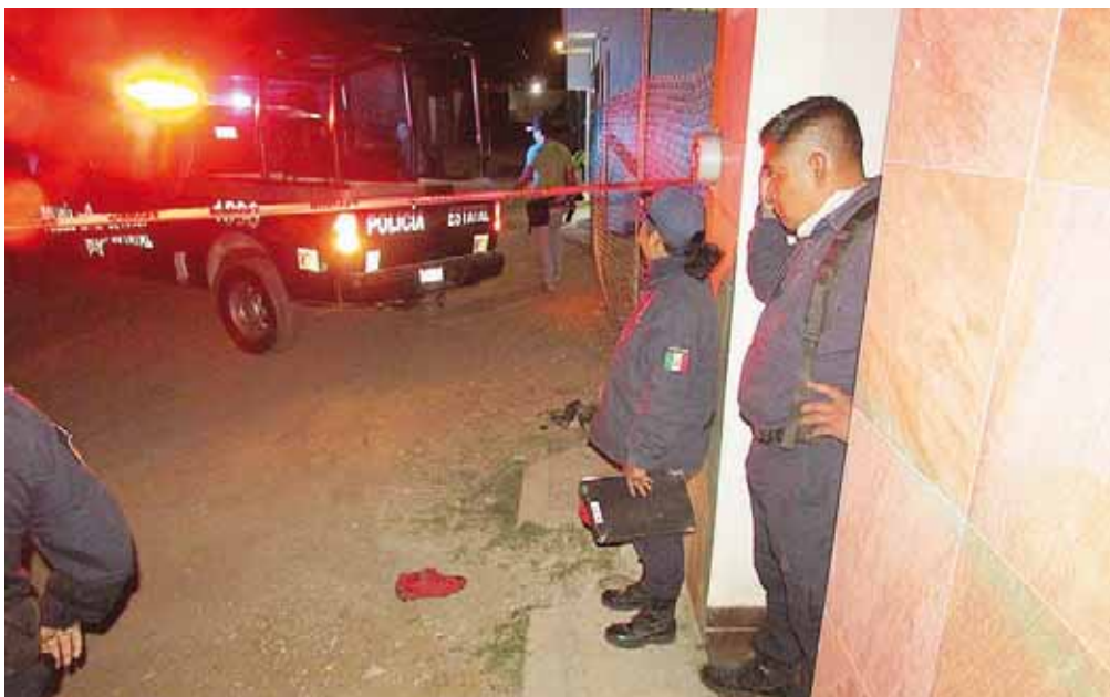
► La zona fue acordonada para las diligencias de ley.

policiaca@imparcialenlinea.com / Teléfono 501 83 00 Ext. 3176