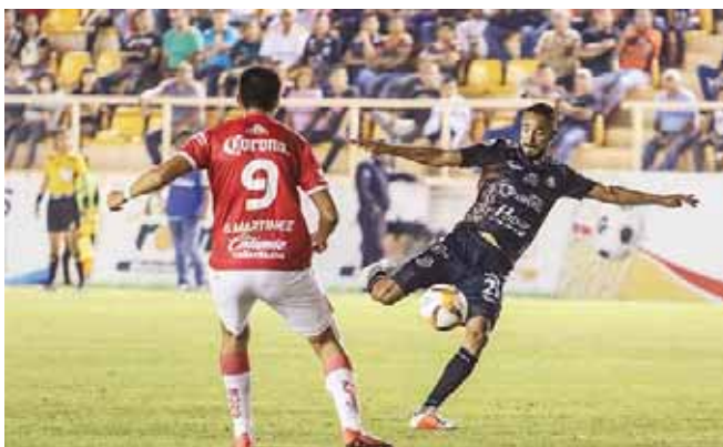
Los zacatecanos se llevaron el pase por su posición en la tabla.