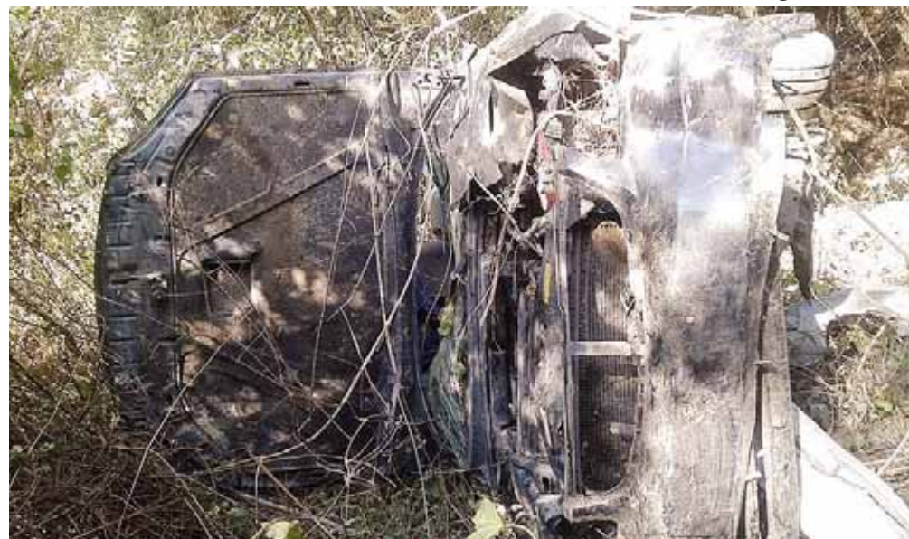
► El vehículo quedó siniestrado.