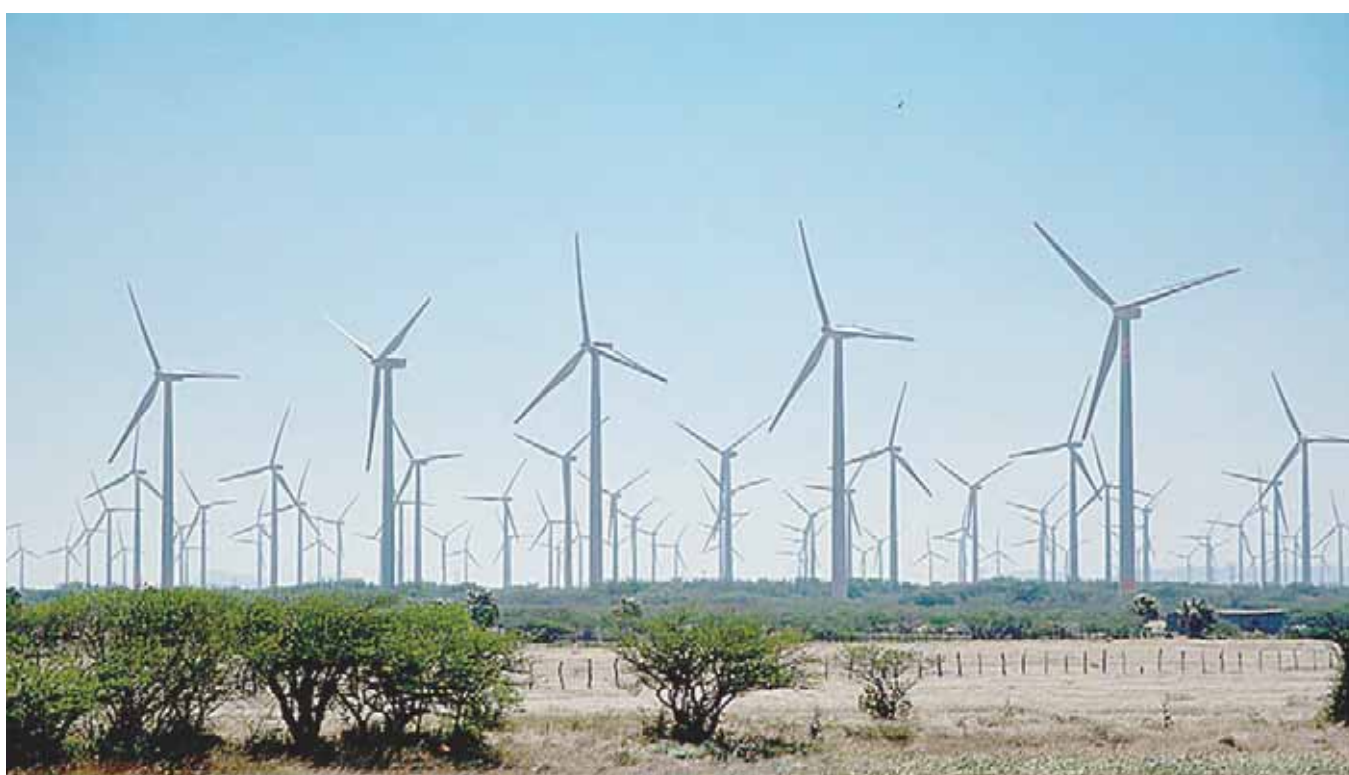
► El crecimiento industrial que se dice registra Oaxaca, debe ser relativo y en ciertos rubros.