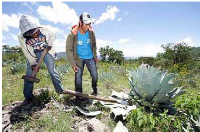
► La sobreexplotación de algunas especies de agaves y de árboles por la industria mezcalera, tiene un alto costo ambiental.

algunas especies de agaves y de árboles para tener leña disponible, indicó, tiene un impacto severo en esa interrelación.