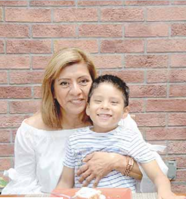
► Su nieto no dejó de apapacharla.