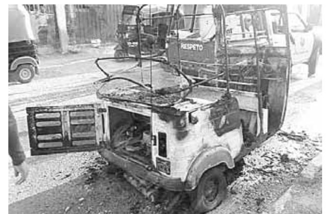
► Los vecinos ayudaron a controlar el fuego.