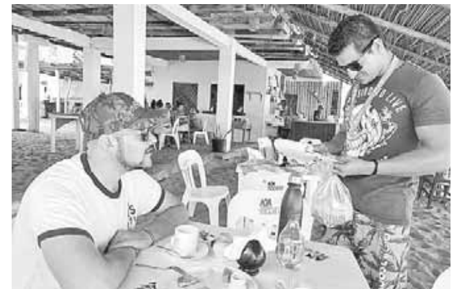
► Buscan conocer el segmento de mercado.

“Vamos a seguir monitoreando, porque ha sido una de las instrucciones de la autoridad municipal con la finalidad de garantizar la seguridad de la población y las personas que visitan las playas en este periodo vacacional”, concluyó.