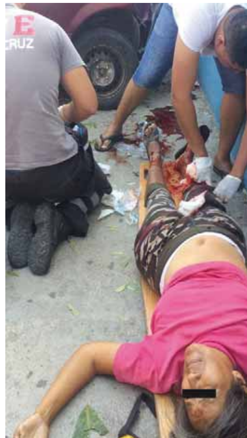
► La mujer resultó gravemente lesionada.