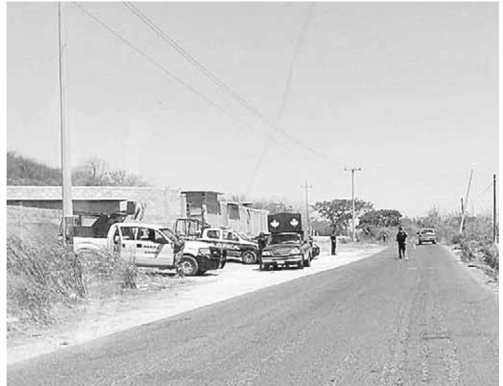
► Los agentes federales realizan una revisión a las unidades de motor.

Estas acciones continuarán de forma permanente en las playas y los accesos carreteros en Salina Cruz y la región del Istmo.