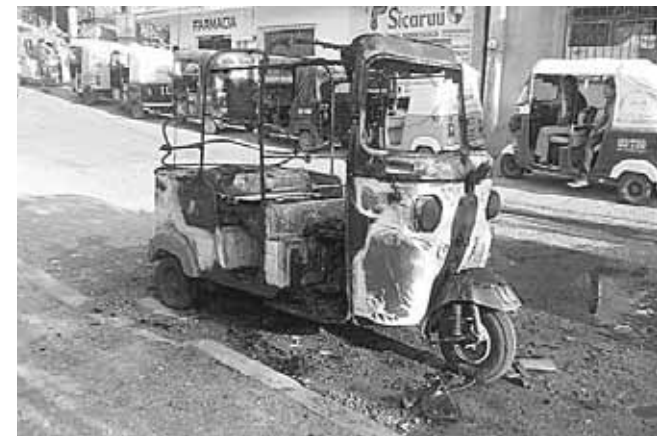
► Los hechos ocurrieron a las 17:30 horas del viernes.

Cabe agregar que a pesar de lo aparatoso del incidente, no se reportaron personas lesionadas, sólo cuantiosos daños materiales fue el saldo de este voraz incendio.