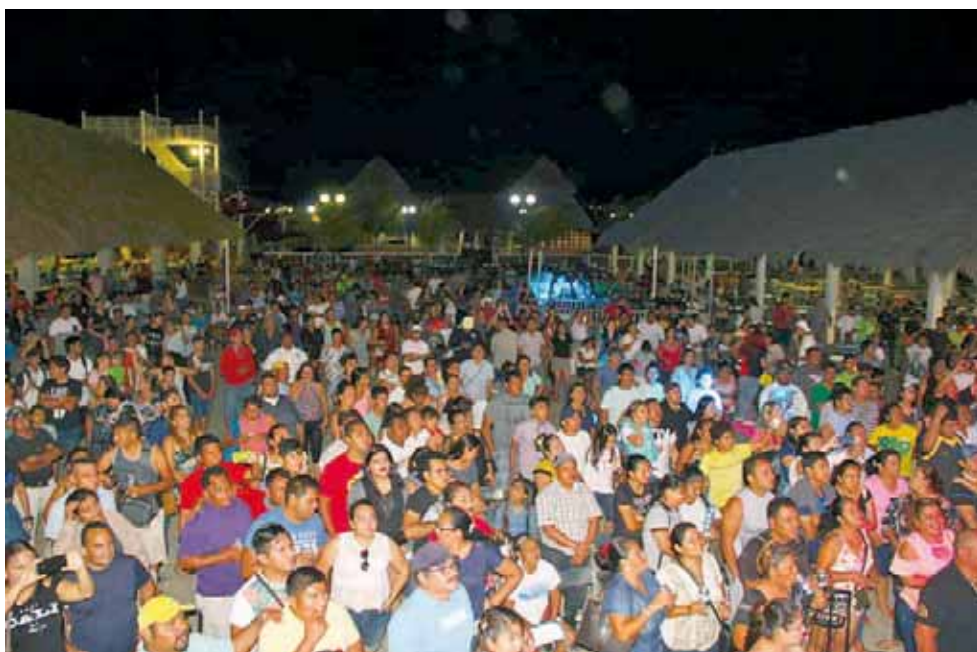
► Los vacacionistas disfrutaron de los conciertos musicales.