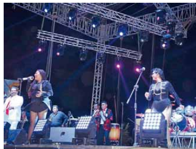
► Internacional Kumbia Show.