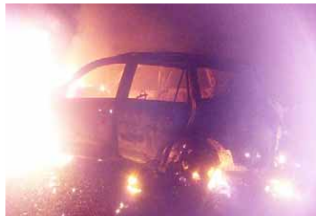
► La policía encontró dos camionetas calcinadas.

Los hechos que ocurrieron la noche del viernes dejó consternada a la sociedad veracruzana, por esta gran masacre en esta importante e industrial ciudad de Minatitlán Veracruz, donde los cuerpos quedaron en medio de un charco de sangre y de acuerdo a reportes periódicos fueron 14 los ejecutados, entre ellos a un bebé, cinco mujeres y siete