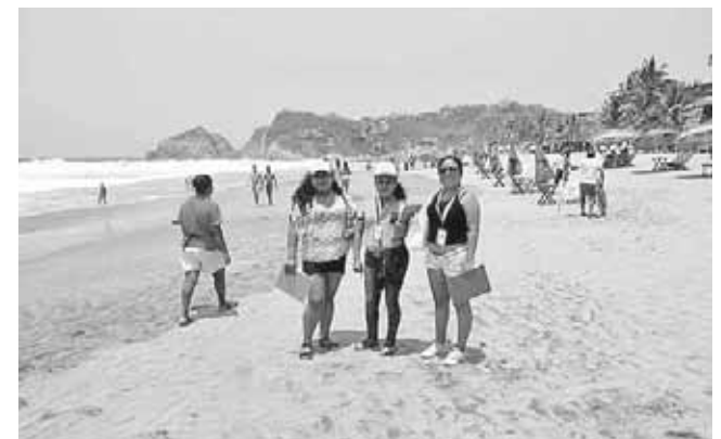
► El objetivo es atraer más turistas a dichos destinos turísticos.