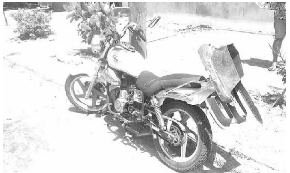
► La motocicleta en la que viajaban.