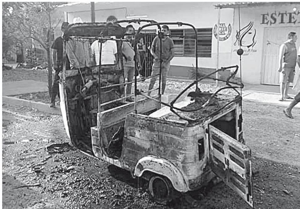
► El mototaxi quedó reducido a cenizas y fierros viejos.

mentos de Protección Civil y Bomberos de esta ciudad que lograron combatir en su totalidad el incendio, que al parecer fue provocado por algún corto en su instalación eléctrica.