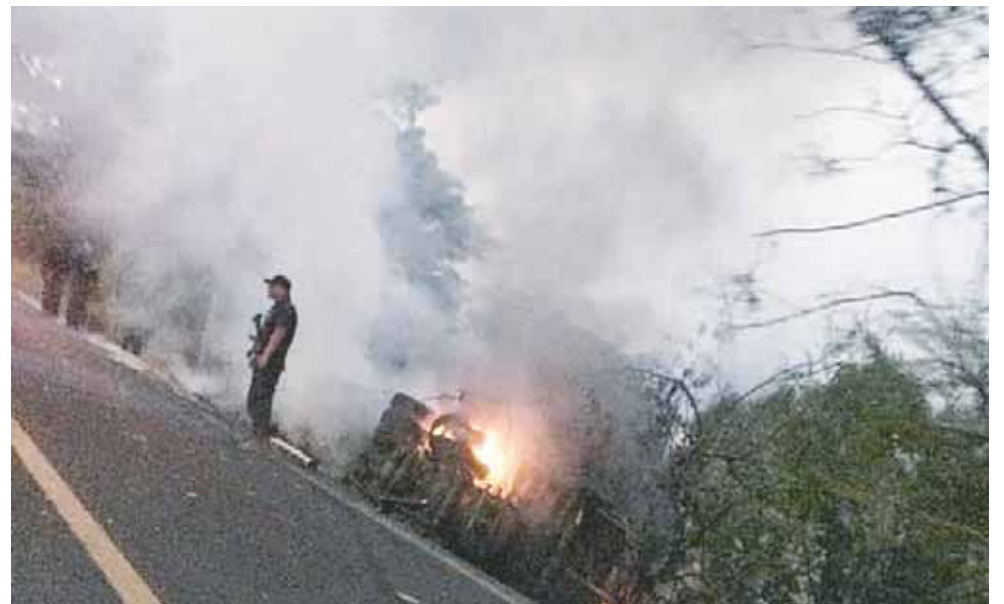
► La unidad transportaba fierros de la Ciudad de México a Puerto Escondido.