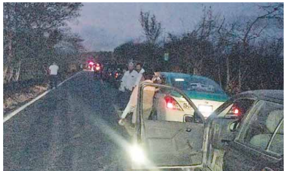
► Según el reporte, los hechos ocurrieron en entre las 6:30 y 6:40 horas.

Las maniobras para levantar a la unidad pesada, provocó que se interrumpiera la circulación vehicular por varios minutos.