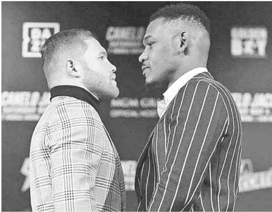
► La pelea entre Álvarez y Jacobs se realizará el próximo 4 de mayo.