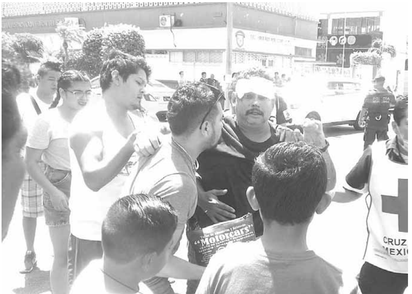
► El fuerte accidente se registró sobre la calle 5 de Mayo del barrio Cantarranas.

De estos hechos tomaron conocimiento elementos de vialidad Estatal y será la autoridad correspondiente la encargada de deslindar responsabilidades, cabe destacar que hasta el cierre de esta edición se desconoce el estado de salud del motociclista lesionado.