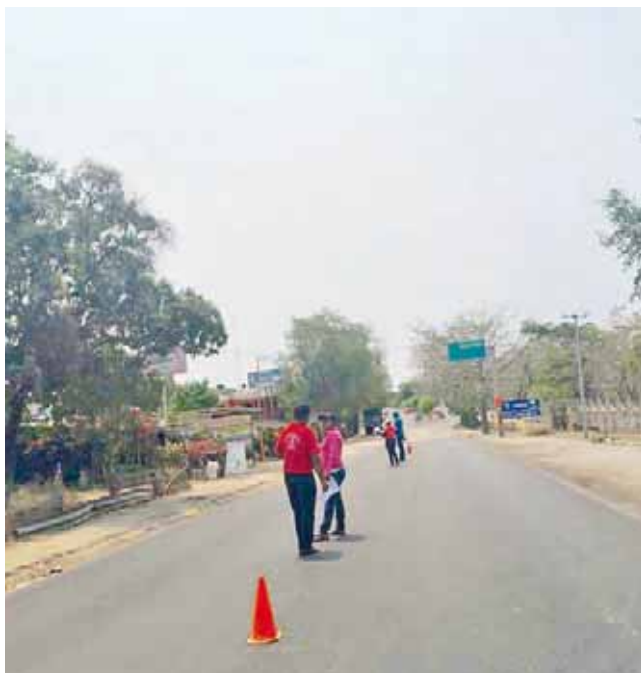
► Piden apoyo económico para gestionar obras públicas.