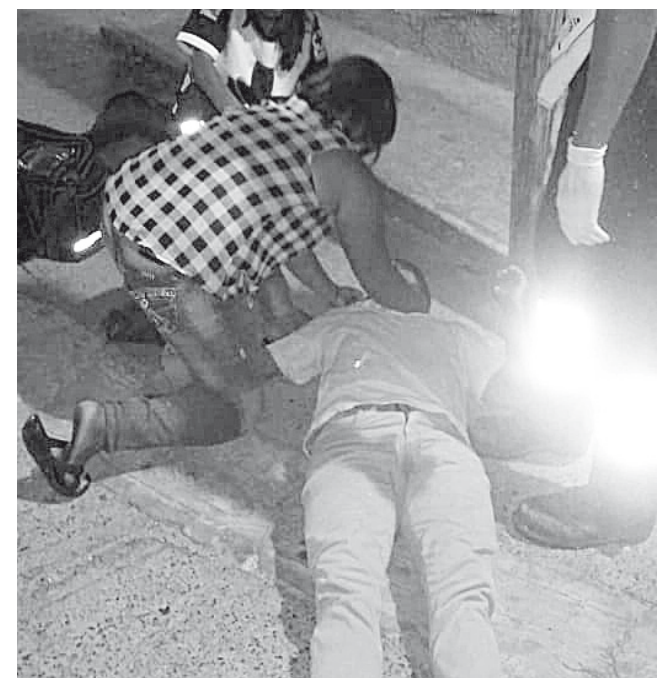
► El joven fue salvajemente golpeado.