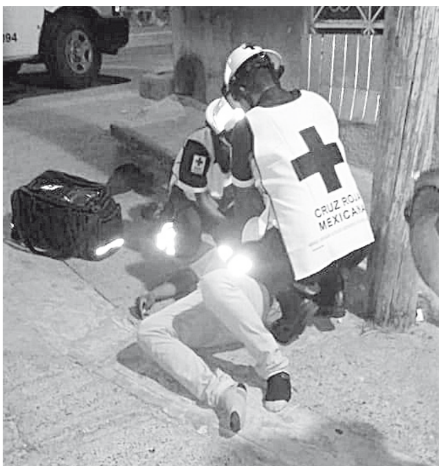
► El lesionado fue trasladado al hospital.

Tras el arribo de la policía municipal quien acudió al llamado de auxilio, se implementó un operativo logrando asegurar al presunto ladrón que fue llevado a los separos municipales, donde más tarde sabría sobre su situación jurídica.