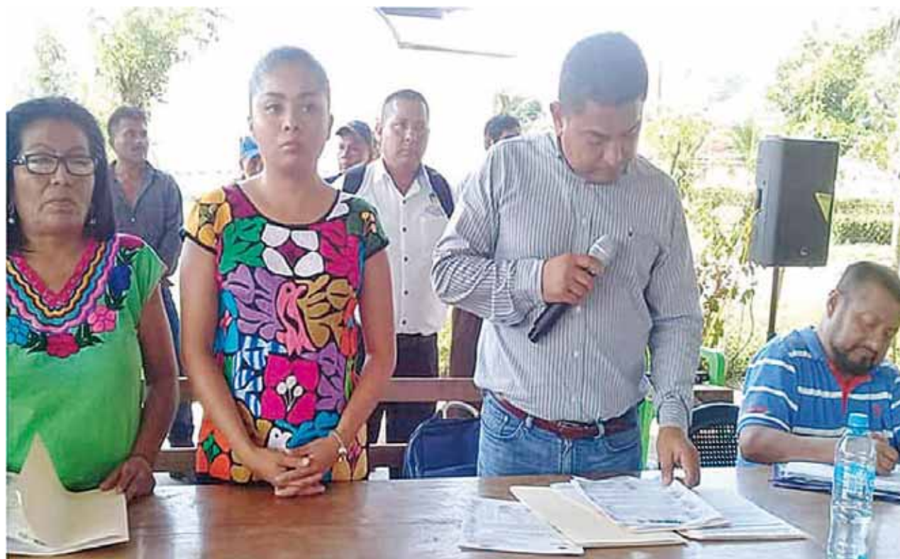
► Supuestamente firmaron una minuta en donde indica que se les entregará el 35% de la participación del Ramo 28.

Cabe mencionar que este movimiento se hizo porque se enteraron a través del periódico oficial de la federación del monto que recibe el Ayuntamiento de Jacatepec, y que nunca se aplica en un 100 %, porque quienes han sido presidentes municipales.