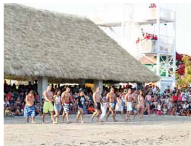
► Presentación de concursos: Chico Piel Dorada y Súper Modelo 2019.