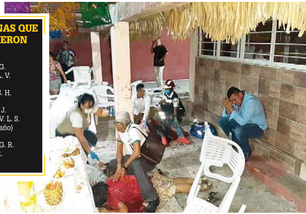
► 14 personas fueron ejecutadas, entre ellos a un bebé.