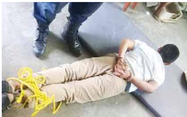
► Un joven de 14 años fue detenido.

Vecinos comentaron a elementos policíacos que el joven en compañía de su hermano conocido en el bajo mundo como El Niño Sicario, se han salido de control, pues en diversas situaciones han sido detenidos por delinquir en esta ciudad, robando en domicilios particulares y asaltando a personas para poder mantenerse en el vicio.