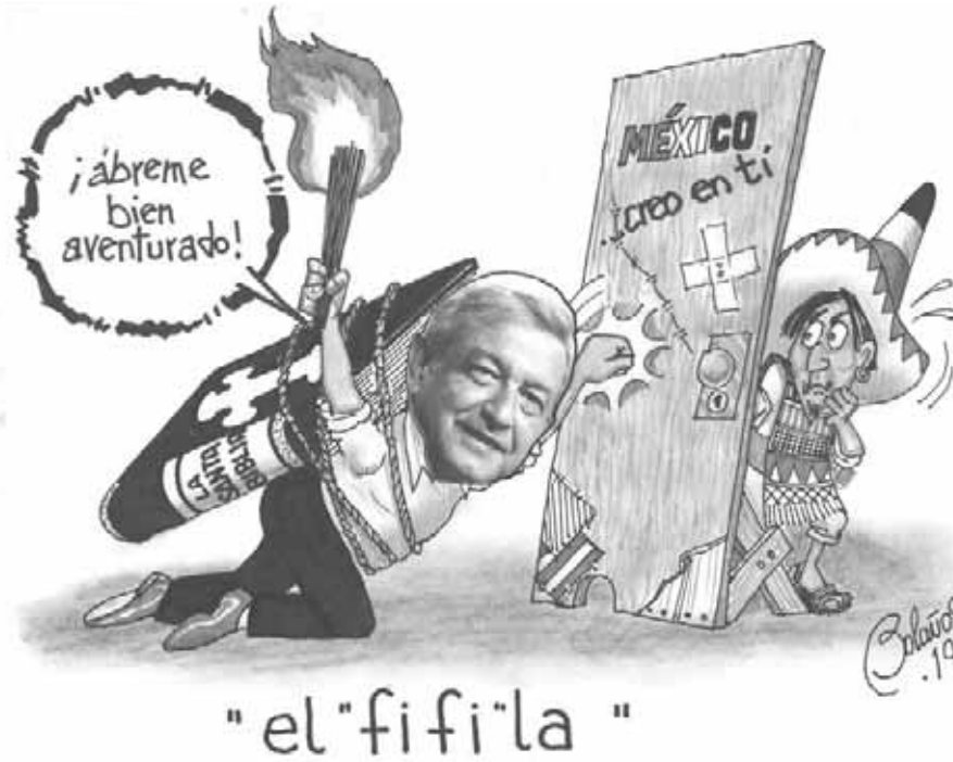
"el "fifi"la "