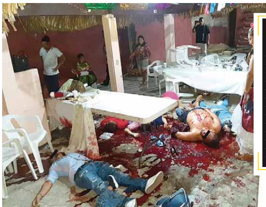
► Los sangrientos hechos ocurrieron la noche del Viernes Santo.

La sociedad veracruzana condena este lamentable hecho y hace un llamado al gobernador de su estado para que tome cartas en el asunto, ya que varios grupos delictivos han ocasionado sangrientos hechos.