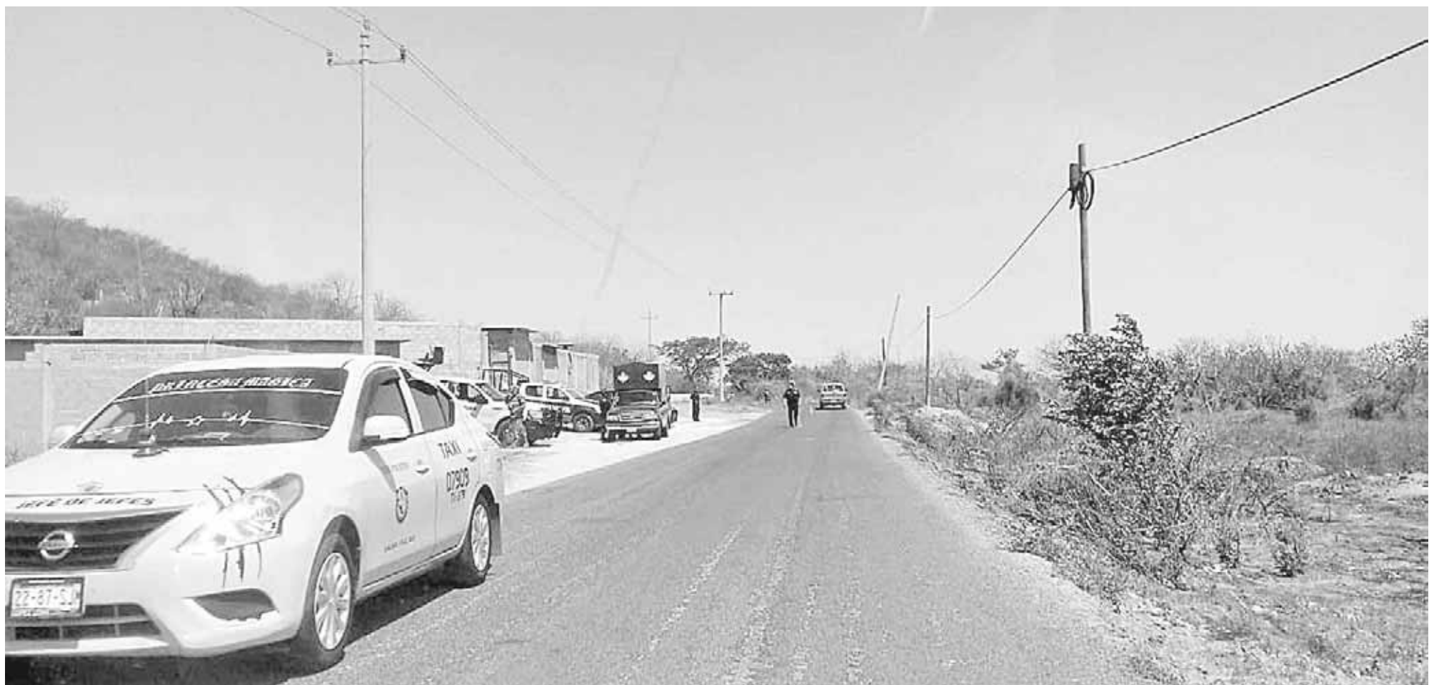
► Estas acciones continuarán de forma permanente en las playas y los accesos carreteros.

En Bahía La Ventosa, policías federales apoyados por elementos de la policía municipal y la Secretaría de Marina, pusieron un