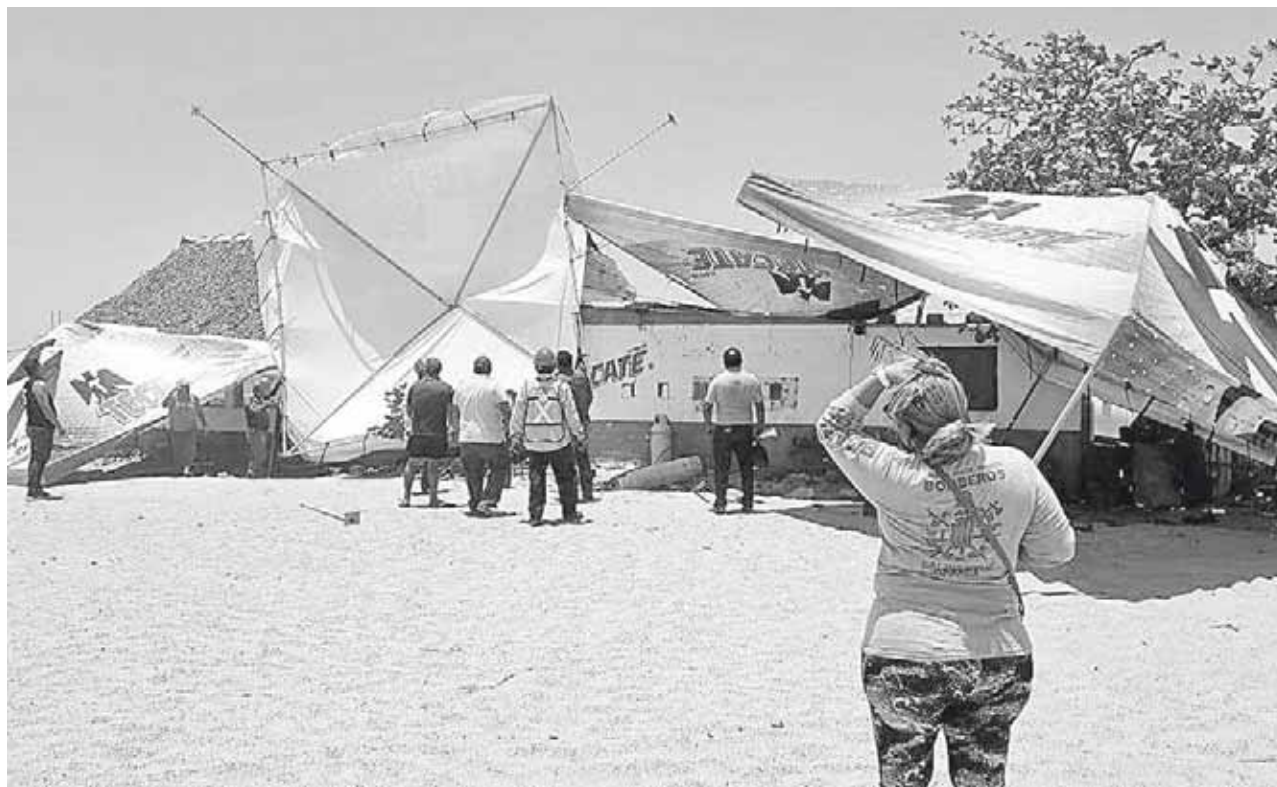
► En Las Escolleras, algunas estructuras metálicas fueron desprendidas sin que se reportaran personas lesionadas.

La iniciativa es apoyada por el gobierno municipal y para los prestadores de servicios es buena ya que eso les permitirá ofrecer sus productos a los turistas durante ésta y las siguientes temporadas vacacionales.