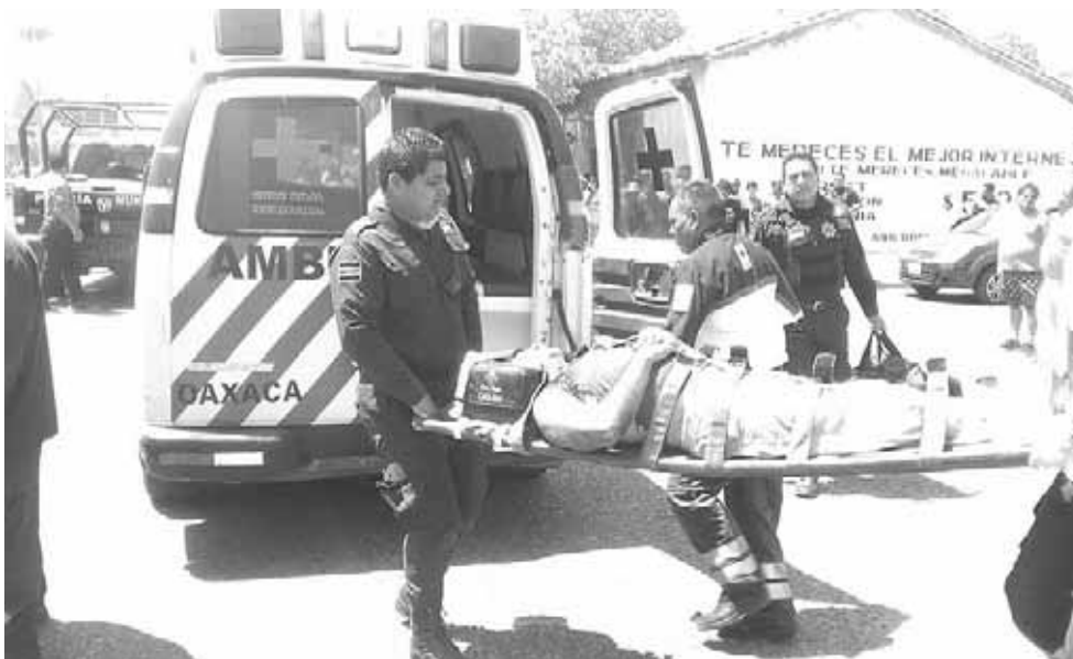
► Uno de los lesionados fue trasladado al hospital.