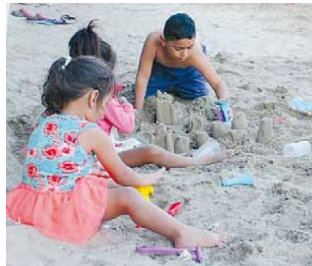
► Los pequeños disfrutaron de los eventos familiares y deportivos.