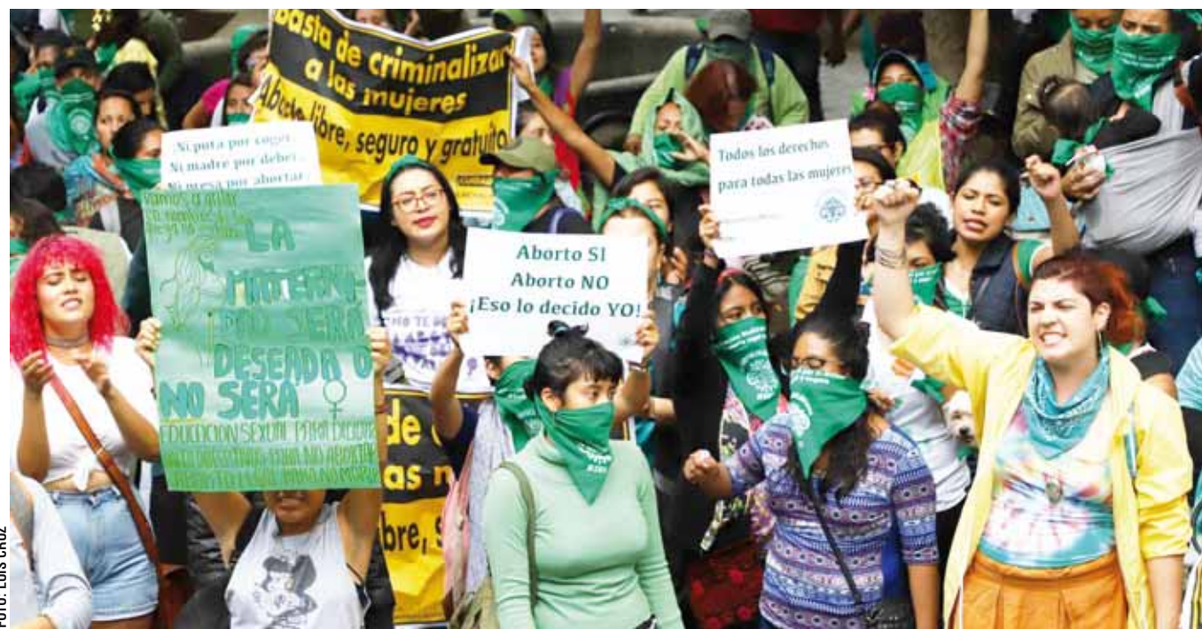
Mujeres en Oaxaca exigen que se respete su derecho a decidir.