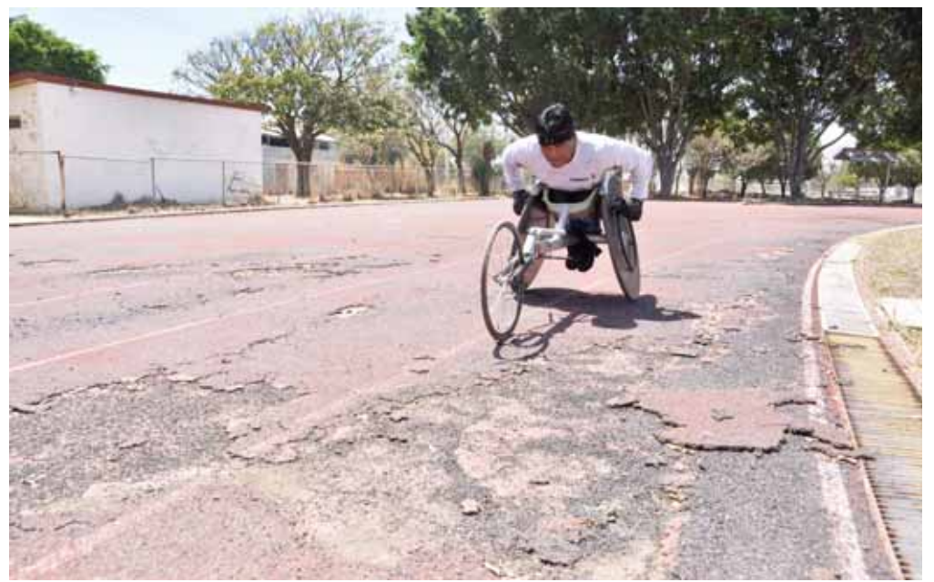
► La pista de tartán está muy deteriorada; requiere mantenimiento para que vuelva a ser funcional.

TEXTO: ANDRÉS CARRERA PINEDA