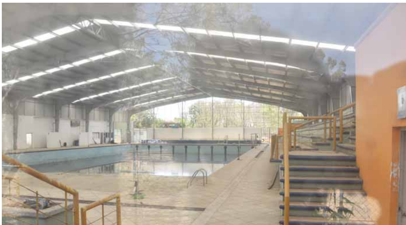
► La alberca olímpica está abandonada y cerrada al público.

Los espacios que componen este complejo están descuidados y destruidos, lo que representa un riesgo para atletas