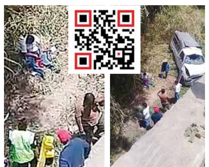
► La camioneta quedó volcada en un barranco.

Elementos de la Policía Vial Municipal tomaron conocimiento del percance, ordenando el traslado de la camioneta al encierro de la corporación.