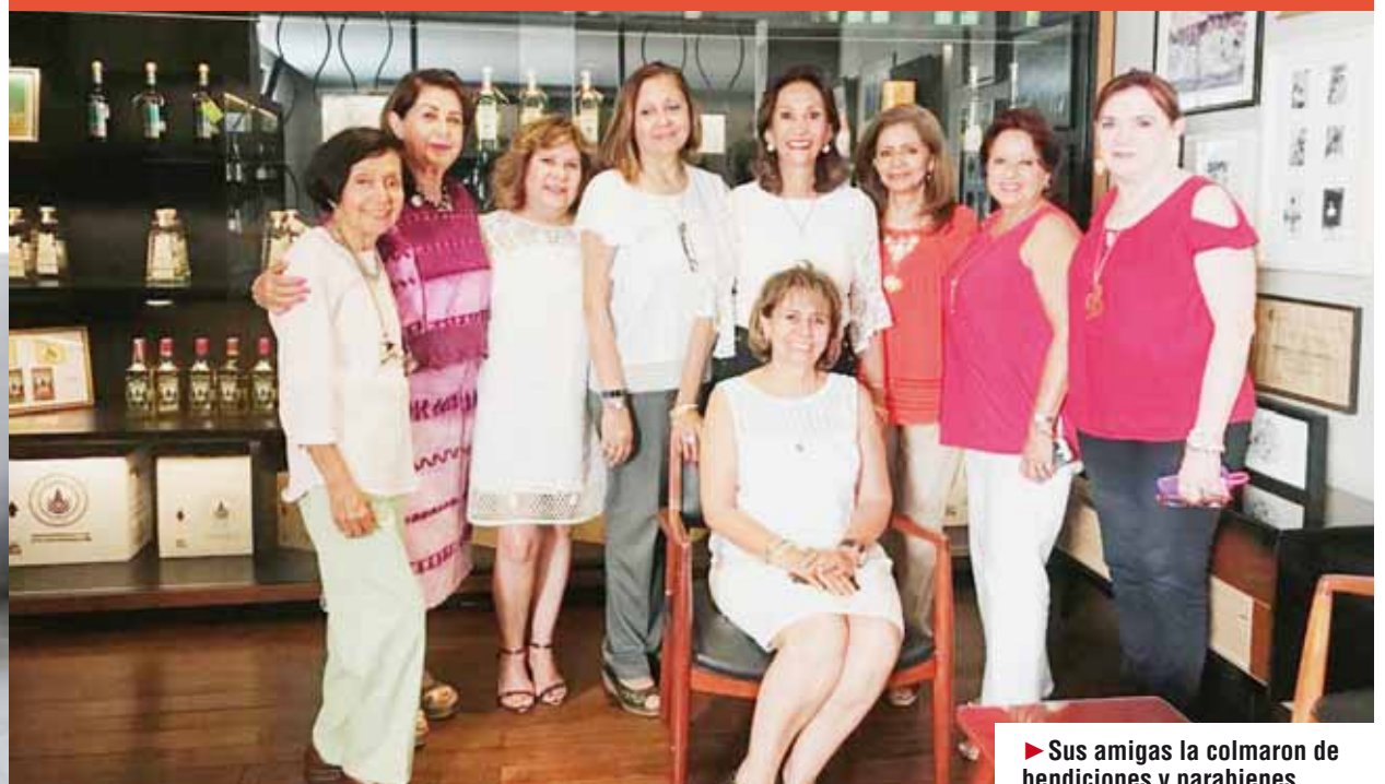
► Sus amigas la colmaron de bendiciones y parabienes.