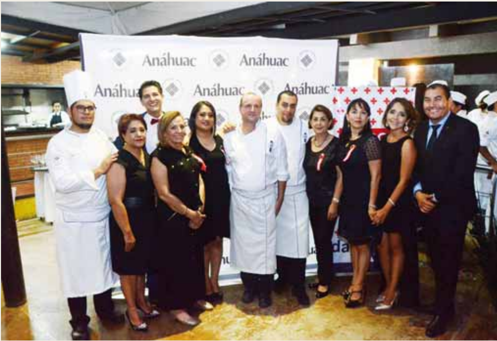
► Las Damas Voluntarias de la Cruz Roja coordinaron el evento.

estilo@imparcialenlinea.com / Teléfono 501 83 00 Ext. 3171