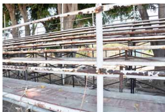
► Las gradas ya están oxidadas.

En algunos tramos de la pista de tartán está a punto de desaparecer por los múltiples hundimientos que ya presenta. “Tengo más de 6 años que vengo a entrenar