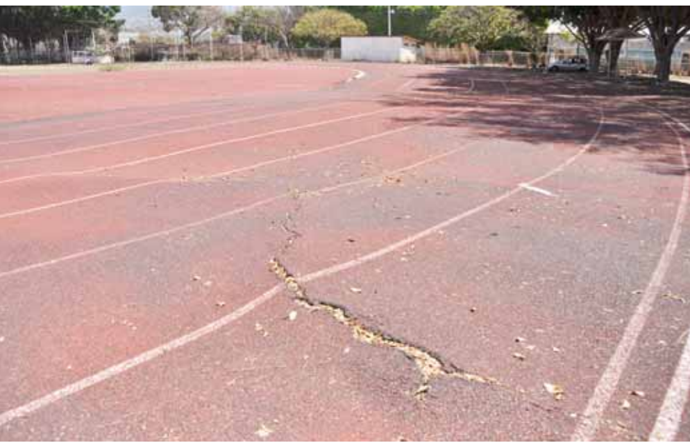
► Se formaron grandes grietas en la pista, lo que representa un riesgo.