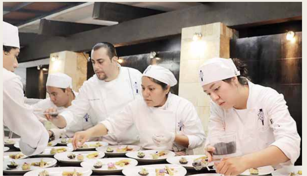
► Alumnos de la Universidad Anáhuac prepararon los platillos.