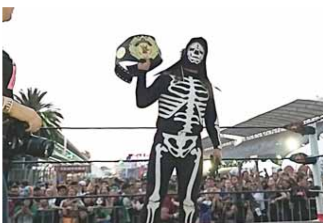
► La Parka se proclamó campeón en el 20 aniversario del Festival Iberoamericano de música Vive Latino.

El NoaNoa.Style fue el más apoyado por la gente, por lo que recordó su paso por el bando rudo con tal de llevarse la victoria. Sin embargo, aunque Texano intentó ayudarlo utilizando una tabla, La Parka aprovechó esto para romper la cama de madera y llevarse la victoria y el cinturón del campeonato.