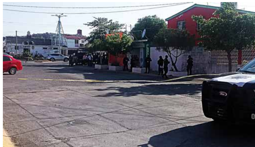
► El atentado se registró alrededor de las 16:00 horas de ayer.

En tanto el comunicador permanece bajo resguardo de las autoridades correspondientes.