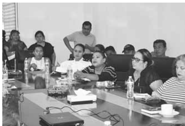
► Dentro de los trabajos a realizar por este Consejo Municipal, destaca el Programa de Trabajo Integral.