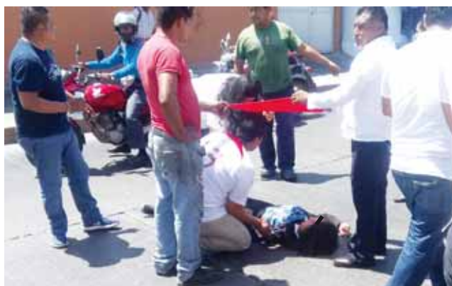
► Maestros corrieron para auxiliarla.