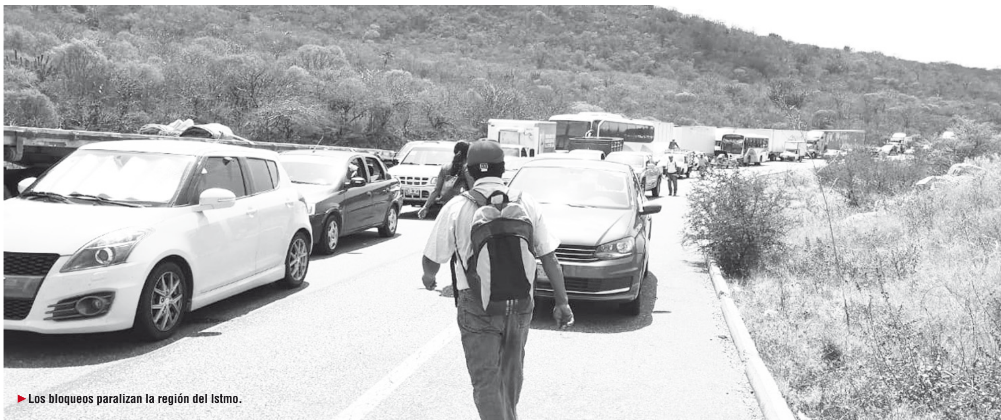
► Los bloqueos paralizan la región del Istmo.

La Canaco y Canacintra piden a los gobiernos atender este grave problema que afecta la economía de la región