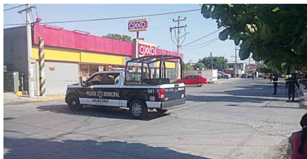
► Al lugar arribaron elementos de seguridad quienes acordonaron el área.