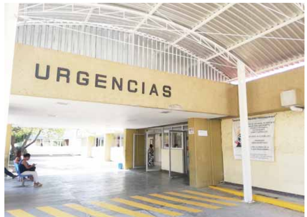
► Familiares que pernoctaban a las afueras de la sala de urgencias recibieron el apoyo.

“Lohacemosdecorazón, vemos el apoyar a nuestra gente, es como acompañarlos en su dolor, acompañarlos durante su estancia a las afueras de la sala de urgencias, es necesario estar con ellos y apoyarlos”, comentó un altruista que omitió su nombre.