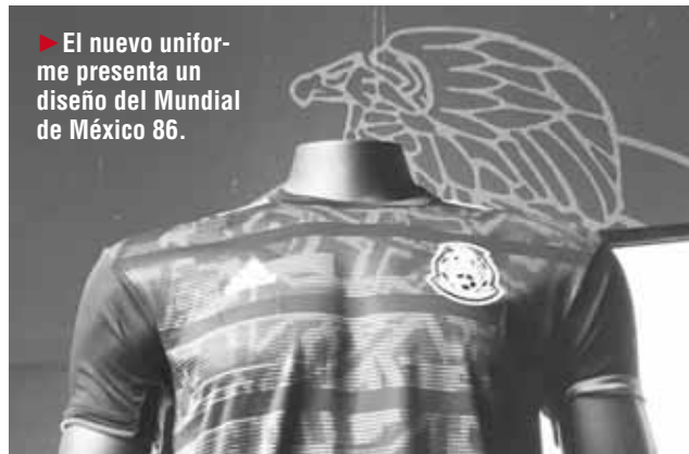
► El nuevo uniforme presenta un diseño del Mundial de México 86.