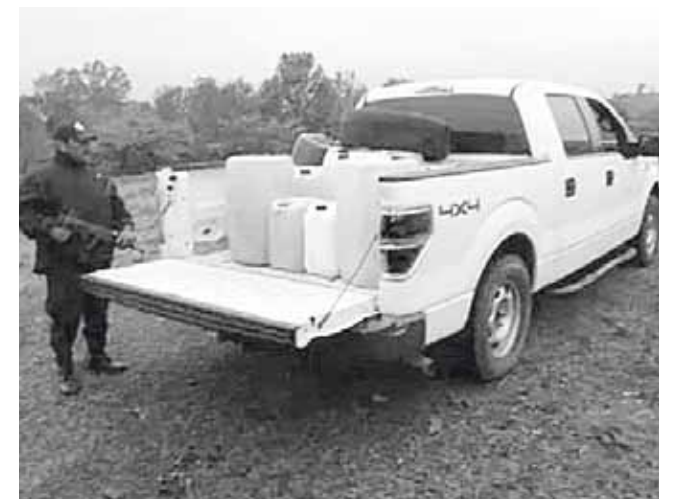
► La policía arribó al lugar.

Con estas acciones, se combata de manera frontal el robo de hidrocarburo en la entidad.