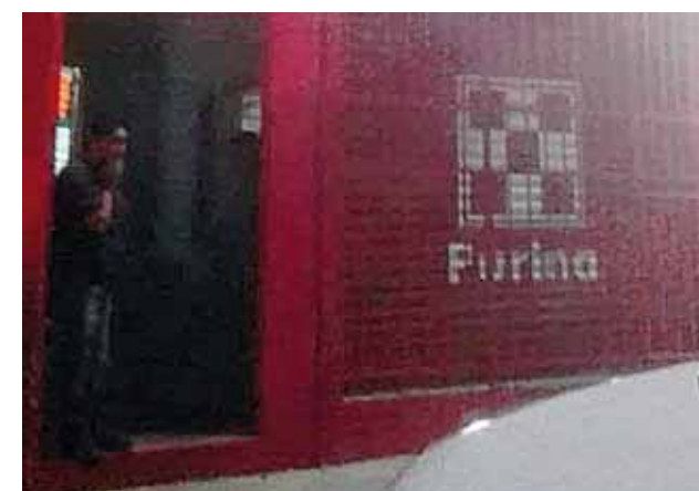
► El asalto ocurrió sobre la carretera Transístmica.

Elementos municipales arribaron al lugar, y tras tener las características de los tres hampones, implementaron un operativo en los alrededores sin tener resultados positivos, por lo que se espera que en las próximas horas representantes de esta empresa interpongan la denuncia correspondiente ante el Agente del Ministerio Público, para dar con los presuntos ladrones de este violento asalto.