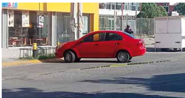
► Cerca de su vehículo quedaron tirados casquillos percutidos.

El periodista resultó con lesiones que no ponen en riesgo su vida, al ser víctima de los proyectiles por arma de fuego tras el ataque armado de un sujeto que huyó a bordo de una motocicleta, según se dijo en el