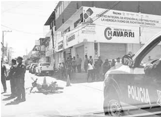
► Fue puesto en libertad por falta de pruebas.