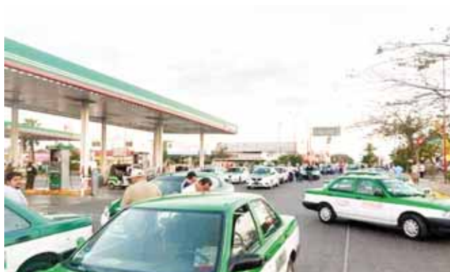
► Los transportistas bloquearon todos los accesos y salidas, así como en diversas calles de la población juchiteca.