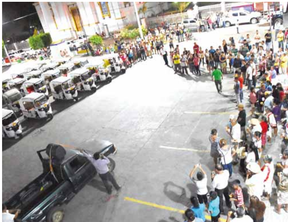
► Una grúa regresó a las unidades.

municipal llevando a cabo una asamblea con los ciudadanos, donde se propuso que el servicio se restablezca.