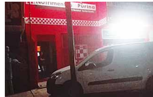
► Al verse amenazados, los empleados entregaron el botín.