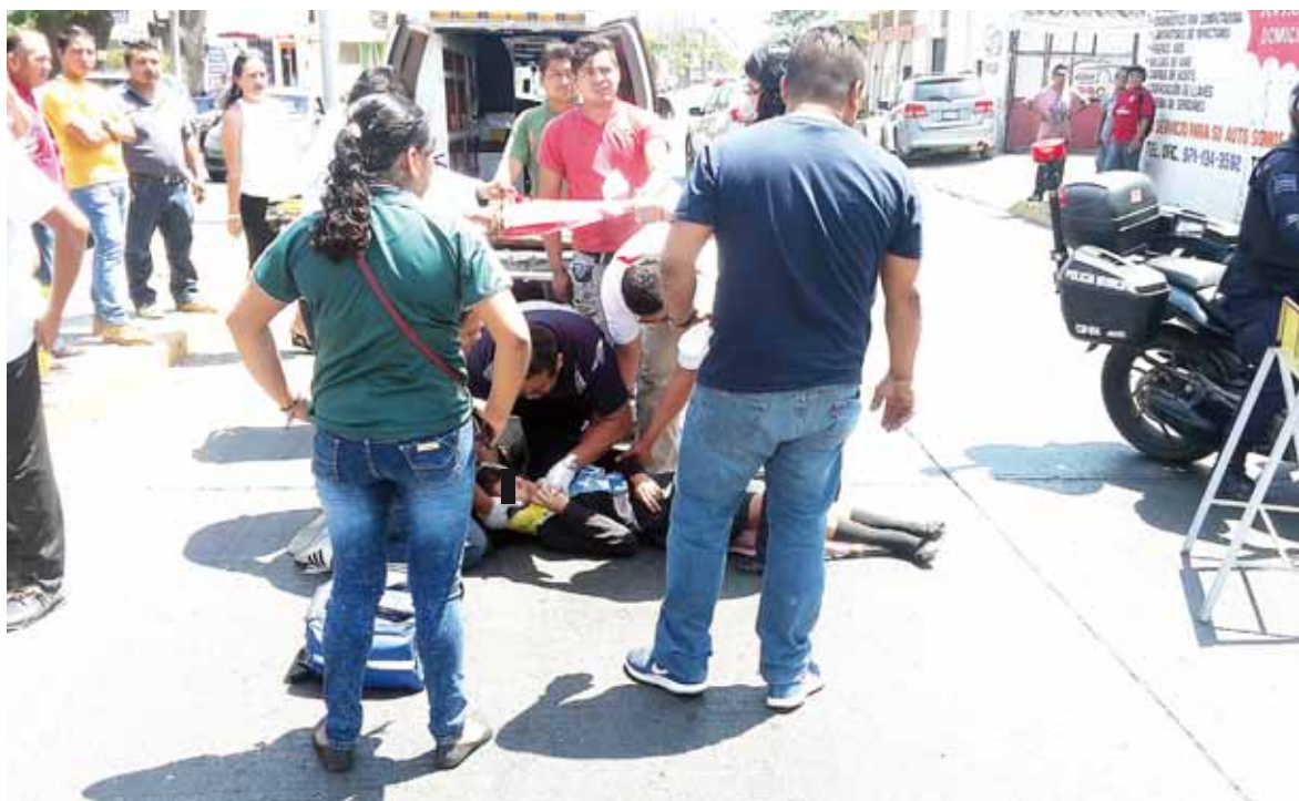
► La estudiante descendía del urbano cuando ocurrió el accidente.

Al verla tirada y quejándose de un fuerte dolor, fue en bus-