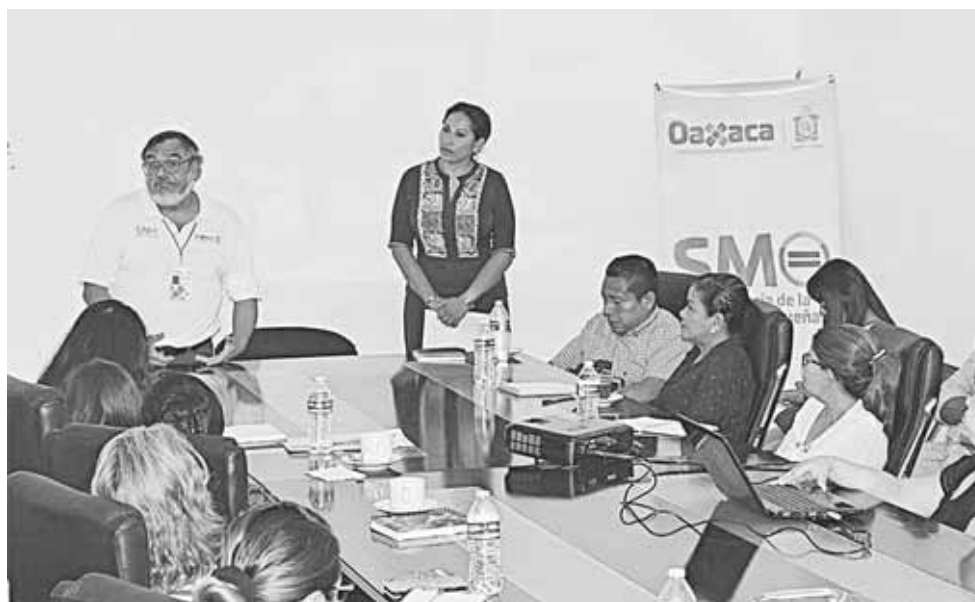
► Salina Cruz es uno de 40 municipios de Oaxaca donde existe la violencia contra la mujer.

Dentro de los trabajos a realizar por este Consejo Municipal, se señalan nueve resoluciones de las que des-