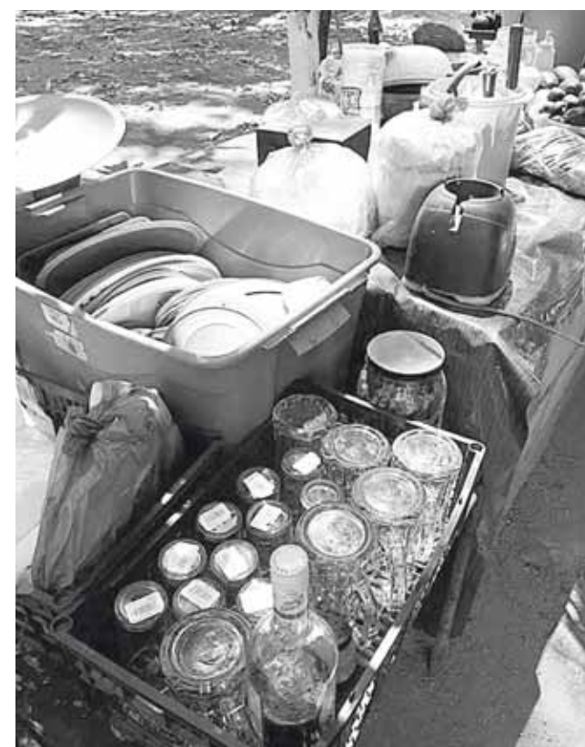
► Ofrecen los productos en trastes reutilizables.