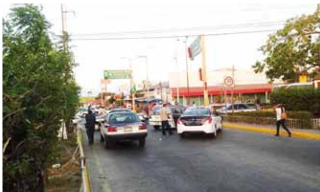
► Exigen que la SEMOVI atienda el tema de los trámites.

Por su parte los productores de sorgo de la región del Istmo bloquean la carretera Transistmica en el kilómetro 281 en el tramo Tehuantepec-Juchitán en el paraje conocido como "El Calli", en la carretera federal panamericana 190 en el kilómetro 246 Panamericana tramo Jalapa del Marqués-Tehuantepec y el kilómetro 22 + 700 de la autopista 185 D, sin paso a la Ciudad de Oaxaca.