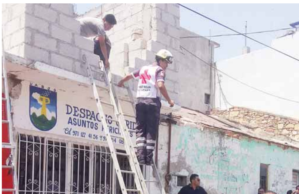
► La policía arribó al lugar.