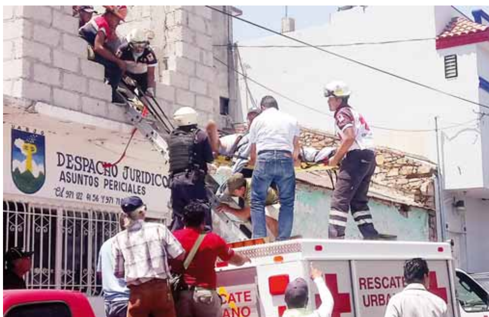
► Paramédicos realizaron maniobras para trasladar al lesionado.

Cabe resaltar que según versión de personas cercanas el lesionado había sido intervenido quirúrgicamente.