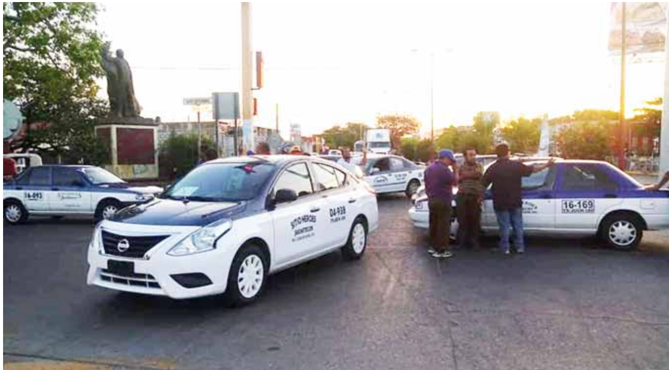
► Taxistas bloquearon desde las 5:30 de la mañana.

los transportistas cumplan con sus trámites, en relación al pago de derechos, el cual se ha rezagado por varios años.