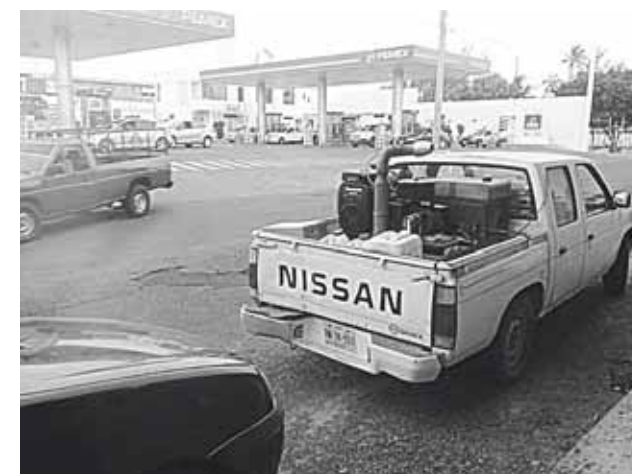
► La unidad recorre barrios y colonias.