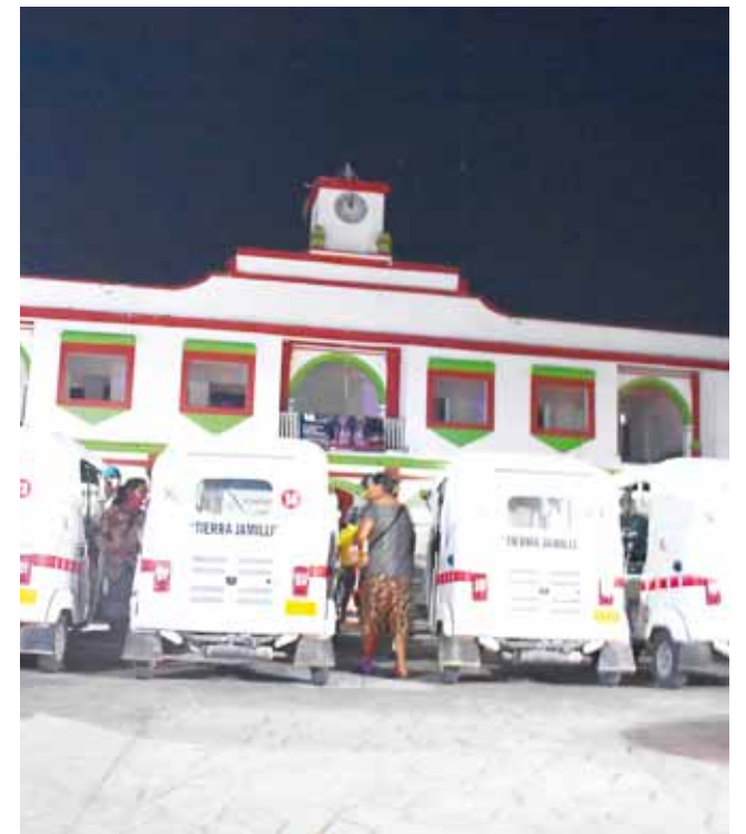
► Los 10 mototaxis frente al palacio municipal.