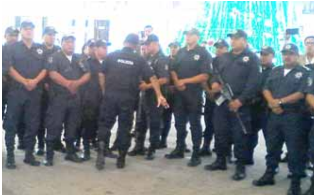
► La convocatoria para pertenecer a esta corporación policíaca sigue vigente.