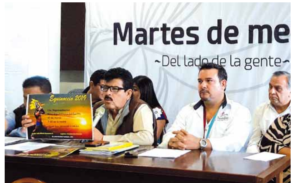
► Organiza la Dirección de Educación Cultura y Deportes del Ayuntamiento.

Mencionó que las antiguas culturas como la Egipcia y la Maya, festejaban a su modo este fenómeno natural, por lo que Tuxtepec no es la excepción, ya que en la colonia El Castillo de esta ciudad existen vestigios de la cultura la Mexica,