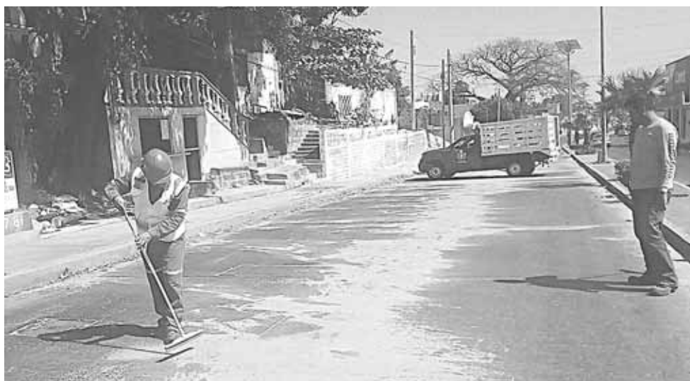
► Policía Vial y Municipal participaron en la limpia.

Indicó que estos trabajos se realizaron con el apoyo del personal de la Policía Vial Municipal y Policía Municipal para