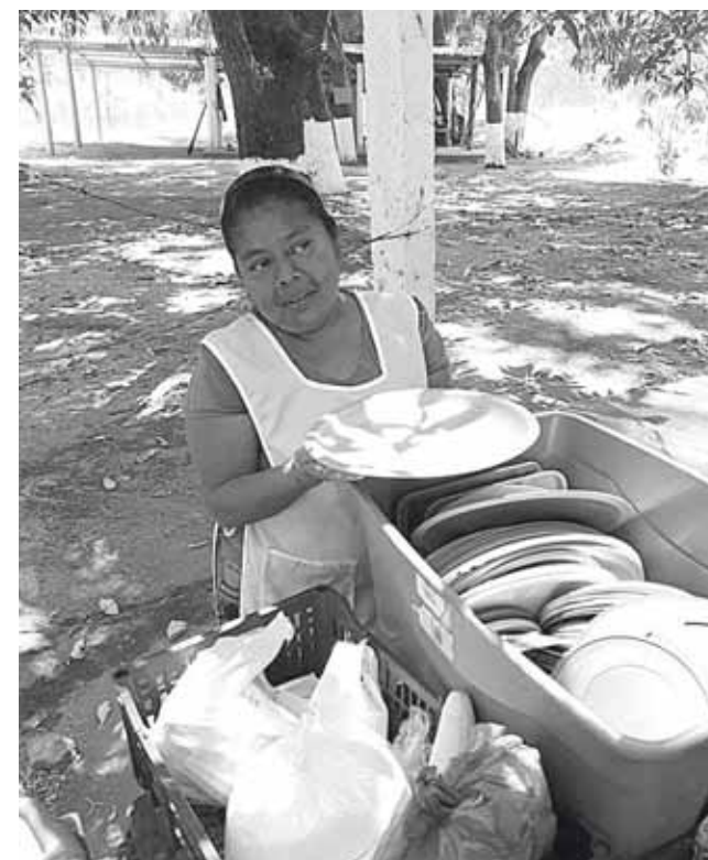
► Los vendedores apoyan esta iniciativa.