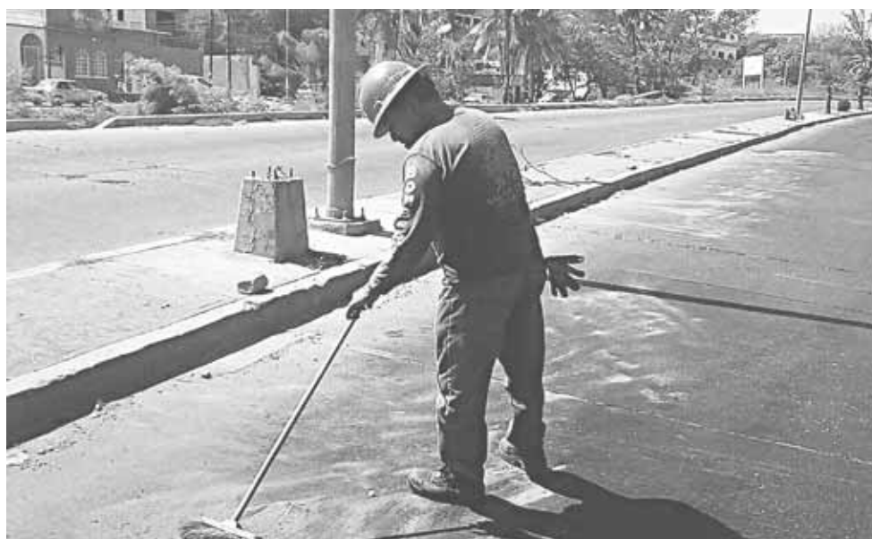
► El derrame se registró frente a Cuatro Carriles.