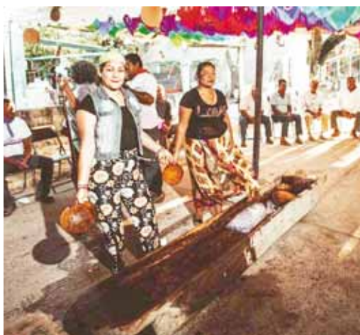
► Labrada de Cera en el Espinal.