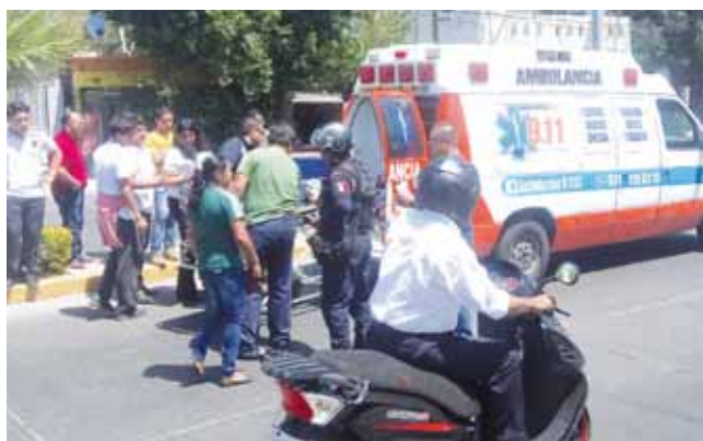
► Paramédicos arribaron al lugar.

Hasta el cierre de esta edición, se desconoce el estado de salud de la menor atropellada.