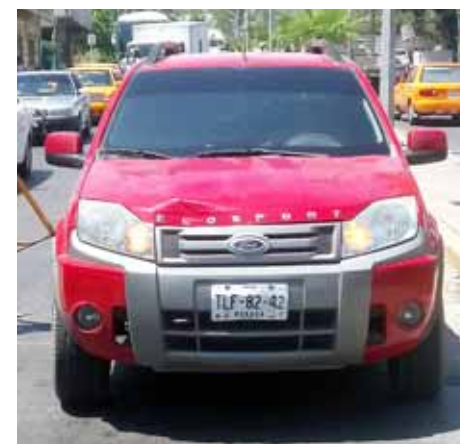
► La unidad de motor responsable fue asegurada.