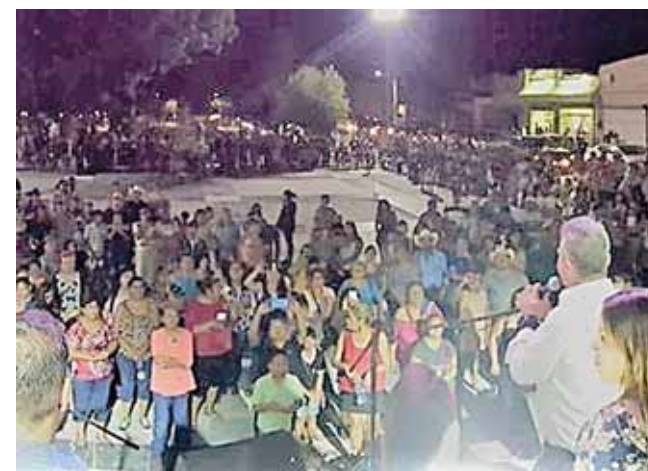
► Disfrutaban del baile cuando ocurrió la balacera.

Cabe mencionar que horas más tardes cundía el pánico en Palomares, esto debido a la circulación de un mensaje que circuló por Whatsapp en donde se daba a conocer que se iban a "levantar" a 150 niños, situación que alarmó a los Palomareños, sin embargo las corporaciones policia-