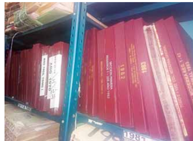
► Buscan preservar los registros.