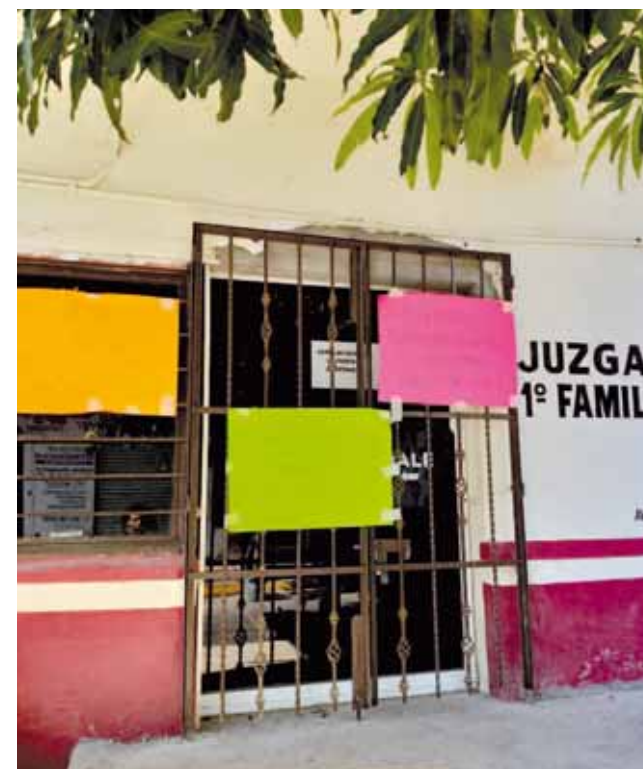
► Los trámites litigantes se vieron interrumpidos.

Estas manifestaciones son parte de una serie de movilizaciones que han iniciado durante este año para denunciar que se revise el contrato colectivo de trabajo.