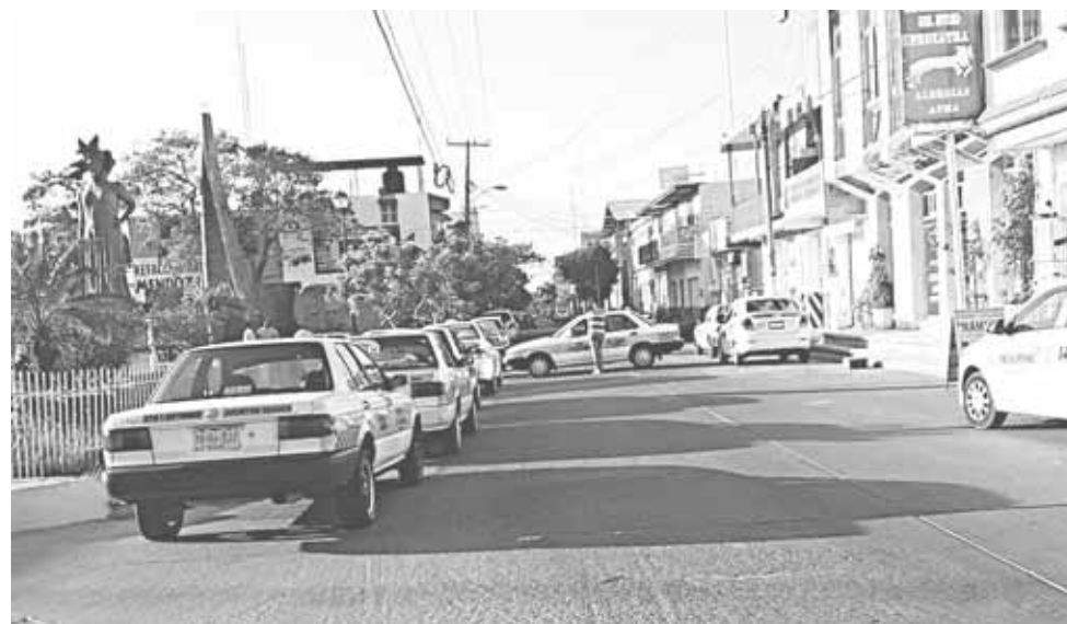
► Al menos 13 organizaciones de taxis se encuentran inconformes con la Semovi.

nomía de los compañeros, porque ahora hay que pagar multas extemporáneas, hay que pagar otros derechos que el Gobierno está implementando con tal de recaudar más, pero eso es imposible porque ya es de todos conocido la competencia desleal que se vive en Juchitán principalmente por los más de 5 mil moto taxis que circulan ilegalmente, se vive en la total anarquía y con la complacencia de las autoridades", aseguró.