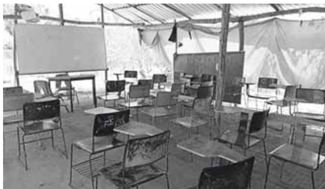
► Las “aulas” se encuentran cubiertas con techo de lámina y al pizarrón lo sostiene una madera. Cubren con pedazos de tela para evitar los rayos del sol.