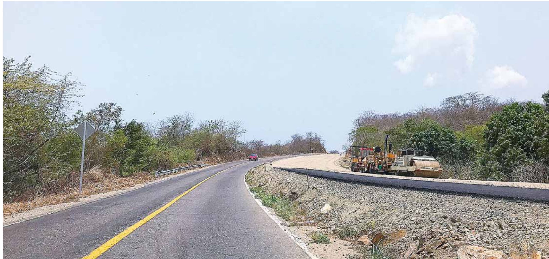
► Con la ampliación de la carretera federal 200, se esperan grandes beneficios.