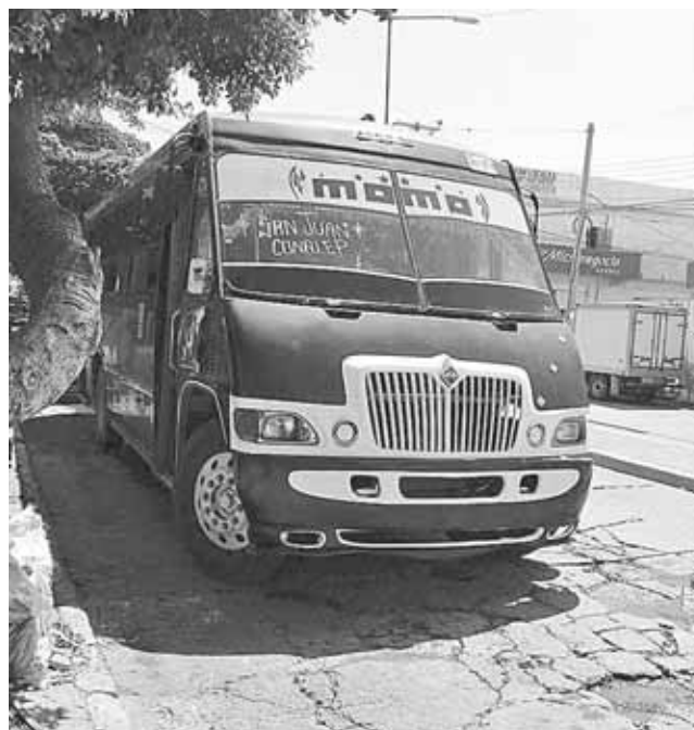
► Uno de los urbanos que aumentó el pasaje a 7.00 pesos.