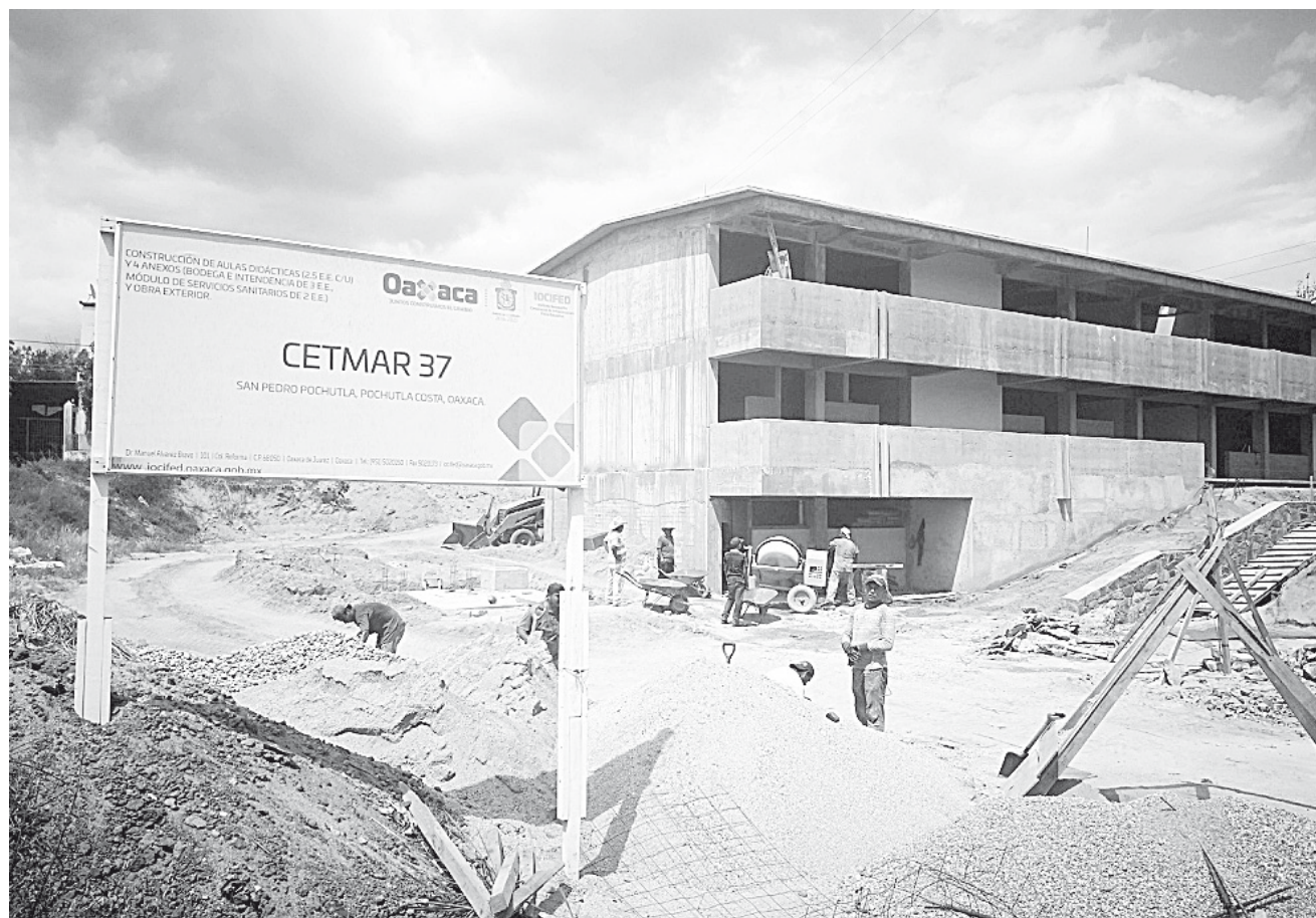
► Maestros señalan lentitud en el avance de la construcción.

Algunos padres de familia y docentes calificaron de urgente contar con 21 aulas, baños y administrativos, subestación eléctrica, laboratorios de las carreras tecnológicas: mecánica naval, preparación de alimentos y bebidas, acuicultura de aguas marítimas, refrigeración y climatización, y electrónica; biblioteca, sala audiovisual, orientación vocacional, servicio médico, cooperativa, intendencia, prefectura, laboratorio múltiple, dirección, administración, red de cómputo, espacios recreativos para hacer deportes con los alumnos, malla perimetral, material didáctico, deportivo, de aseo y banda de guerra.