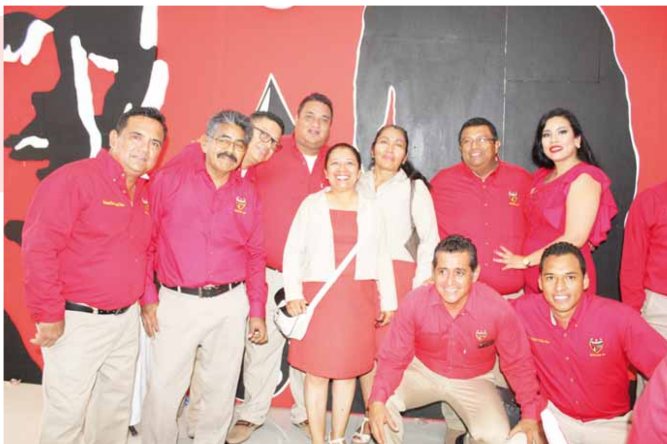
► La festejada con sus compañeros de Terminal Refrigerada.