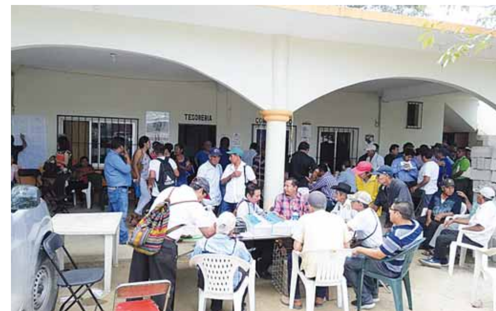
► La Asamblea General de Comuneros se llevará a cabo el próximo 24 de marzo.