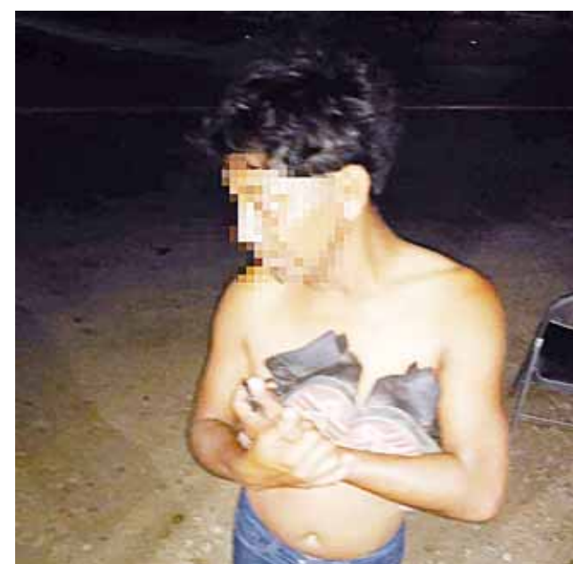
► Les quitaron sus cosas de valor.

El par de infortunados sujetos acudieron a pedir auxilio con las autoridades correspondientes, donde con las manos cruzadas les dijeron que debido a la hora y a trámites burocráticos por las festividades, no había quien los apoyara y la denuncia tendría que ser tomada hasta el día de ayer martes en Salina Cruz, puesto que Astata pertenece a ese municipio.