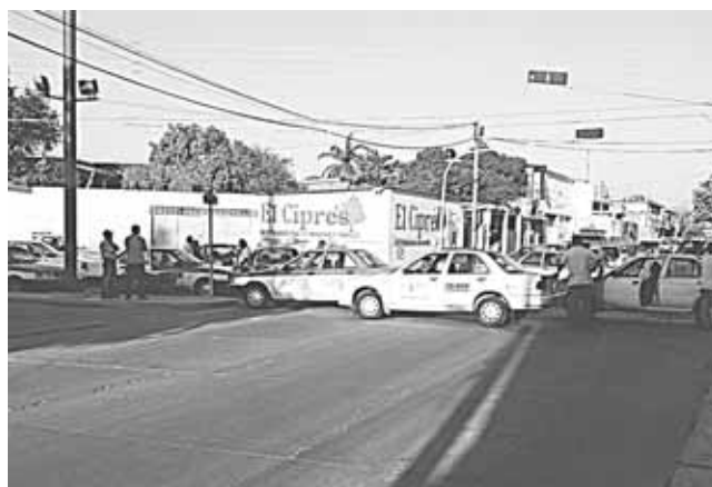
► Mantendrán bloqueo desde las 5:30 horas.