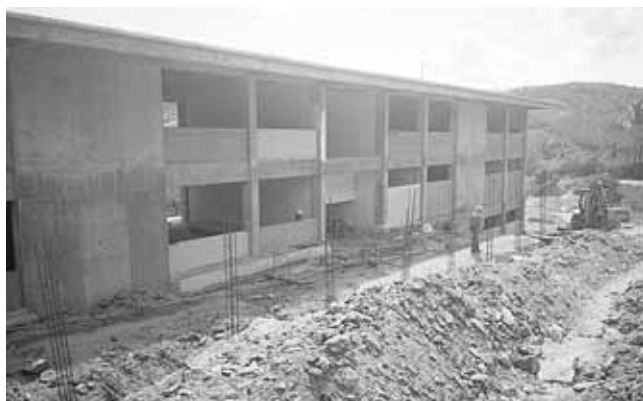
► La obra lleva un retraso de cinco años.