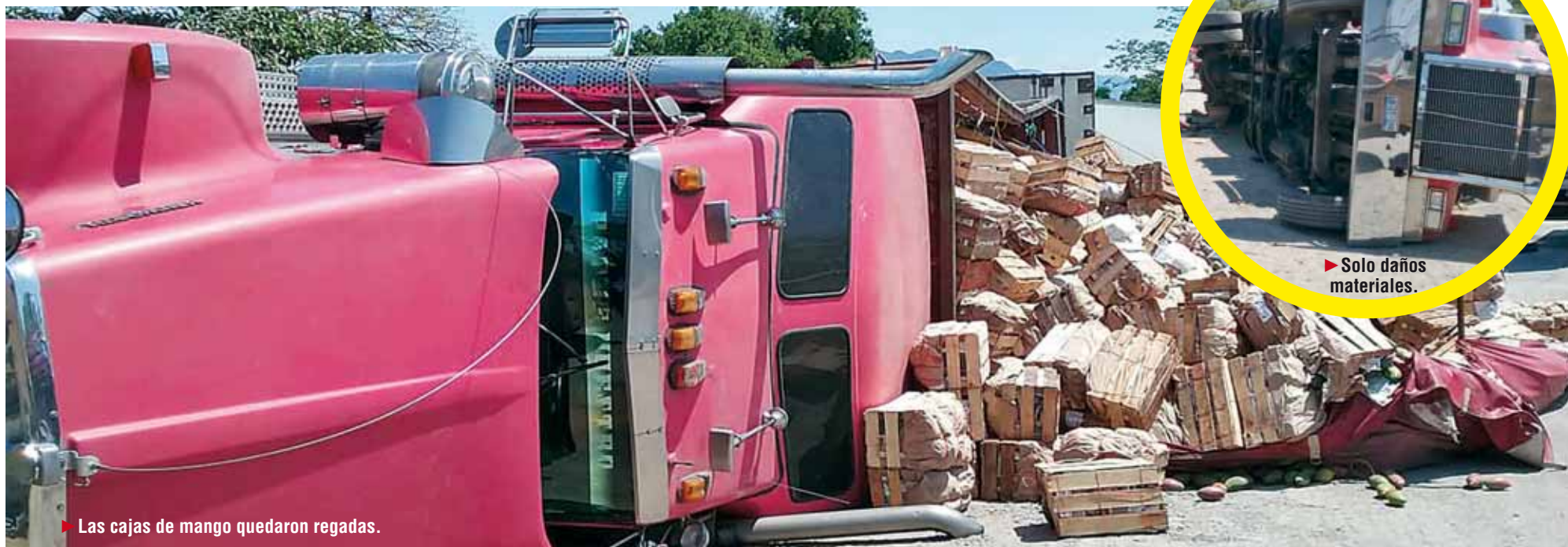
► Las cajas de mango quedaron regadas.

Elementos de la Policía Federal confirmaron que no hubo personas lesionadas, por lo que no fue necesaria la intervención de alguna unidad de rescate.