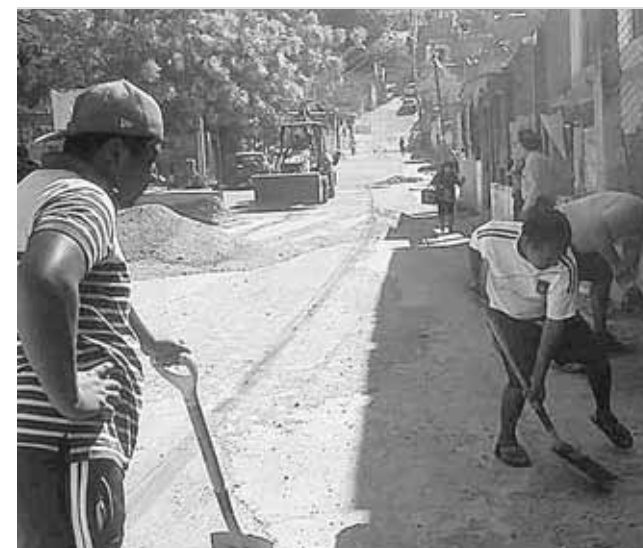
► Vecinos quitan escombros.