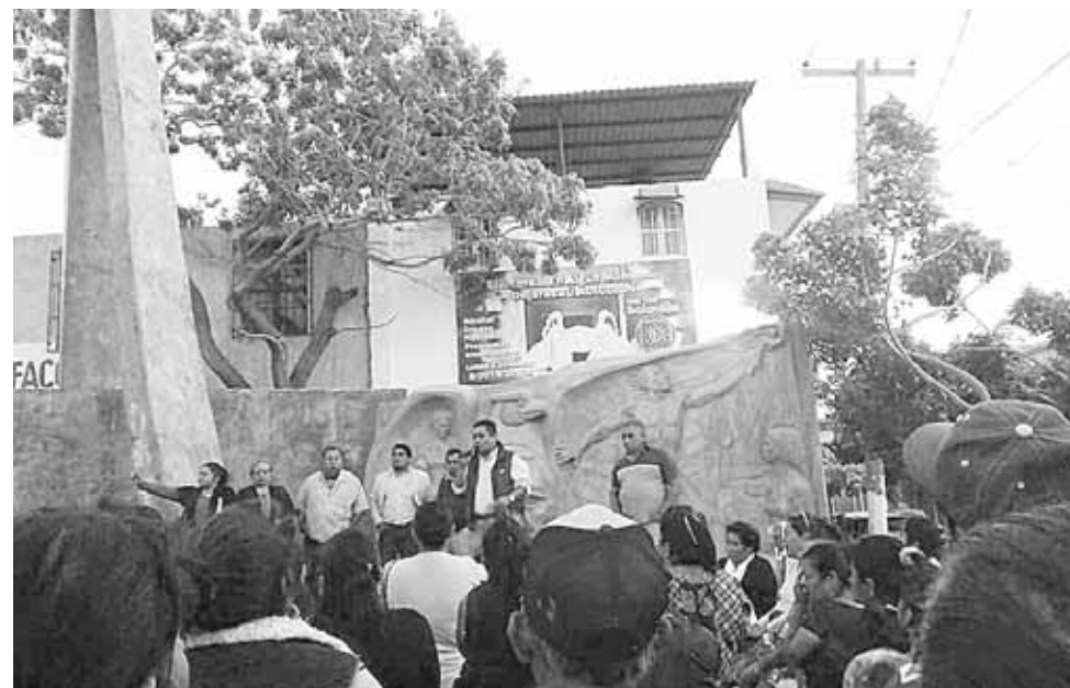
► Mañana se cumplen dos semanas de que se firmó el acuerdo.