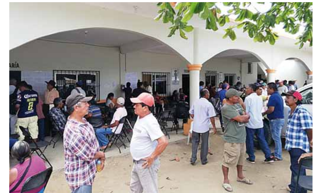
► Comuneros de San Pedro Pochutla.