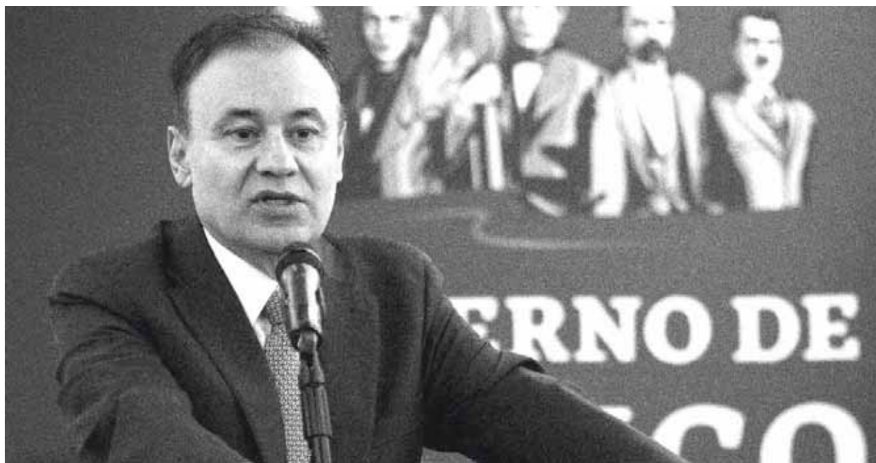
► Alfonso Durazo, titular de la Secretaría de Seguridad y Protección Ciudadana, instaló la mesa del Comité de Vigilancia de Transparencia dentro de la dependencia, el 19 de marzo de 2019.

Sánchez Cordero recalcó “por mi conducto, el Estado Mexicano hace el compromiso de garantizar la reparación integral del daño que provocaron las autoridades desde el 19 de marzo del año 2010.