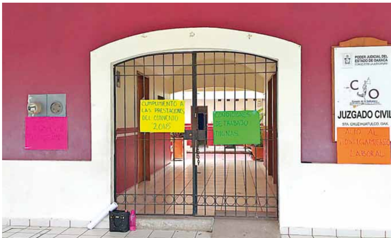
► Los Juzgados de Garantía, Civil y Familiar, fueron tomados.