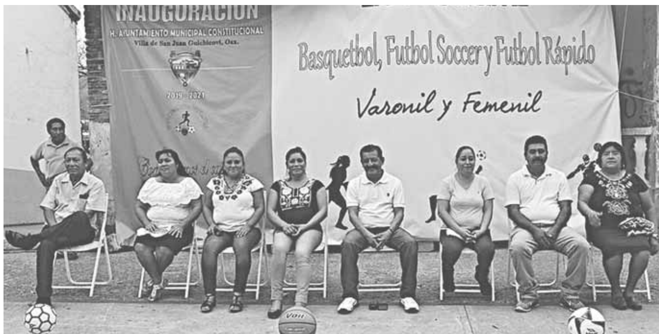
► Las autoridades municipales buscan prevenir el alcoholismo en la comunidad.