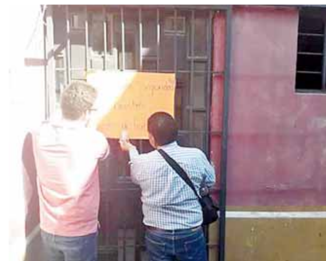
► Colocaron pancartas.