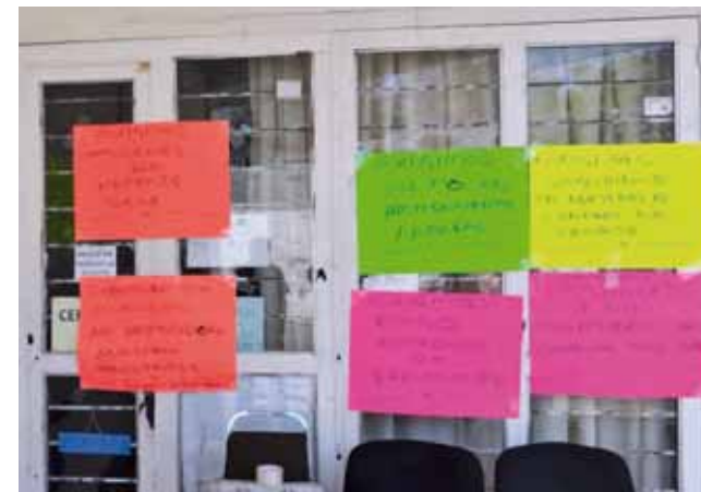
► Parte de sus exigencias.