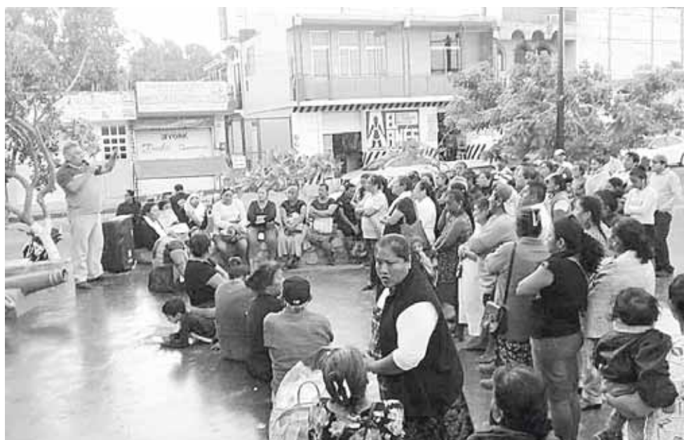
► El gobierno no ha cumplido con los damnificados.