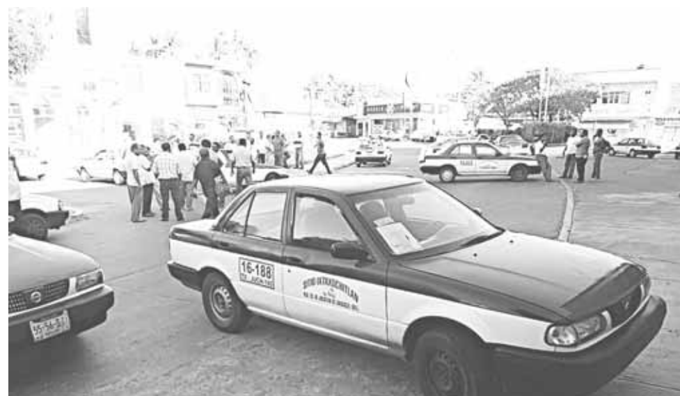
► Exigen atención del gobierno del estado para resolver problemas con la Secretaría de la Movilidad, respecto a que los transportistas cumplan con sus trámites y pago de derechos.

"Todo derivado la situación en la que se ha visto la Secretaría por todos los cambios que ha habido en los responsables y esto ha recaído en el tema de la eco-