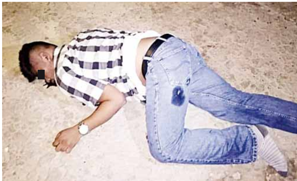
► Los jóvenes fueron encontrados sin vida al interior de la vecindad.

En la avenida Manuel Ávila Camacho y la Avenida del Trabajo del citado barrio quedó cerrada a la circulación luego de que el lugar fuera abarrotado por elementos municipales, estatales y fuerzas castrenses, luego de que al interior de la también conocida "maldita vecindad", ubicada sobre la calle Constanza fueran hallados los cuerpos de tres jóvenes. Hasta el cierre de esta edición los cuerpos se encuentran en calidad de desconocidos, mis-