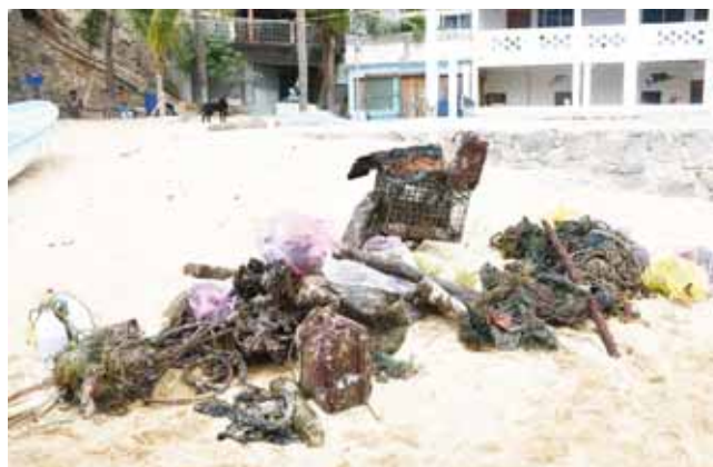
► Para la limpieza de fondos marinos, pescadores y buzos de Puerto Ángel y Zipolite; se sumaron para sacar desechos.