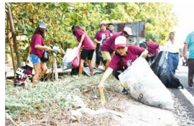
► La autoridad municipal informó que ésta mega limpieza es la primera de cuatro que se realizarán durante el año.