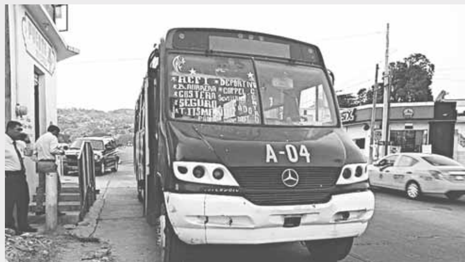
► Deberán pagar una multa además de ser detenidos.