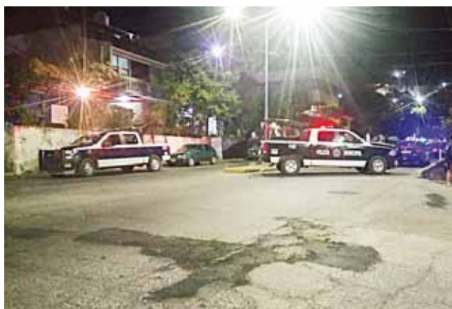
► Autoridades acordonaron la zona.

Tras varias horas ordenaron el levantamiento de los cuerpos para que les fue-