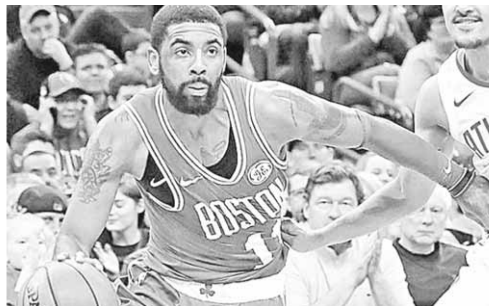
► Kyrie Irving cargó con la ofensiva de los Celtics con 30 puntos.