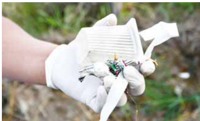
► Invitan a la comunidad en general a no tirar basura.