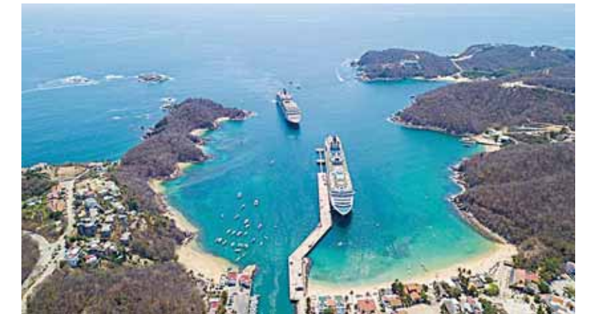
► De visita, los cruceros Nieuw Amsterdam y Coral Princess en Bahías de Huatulco.