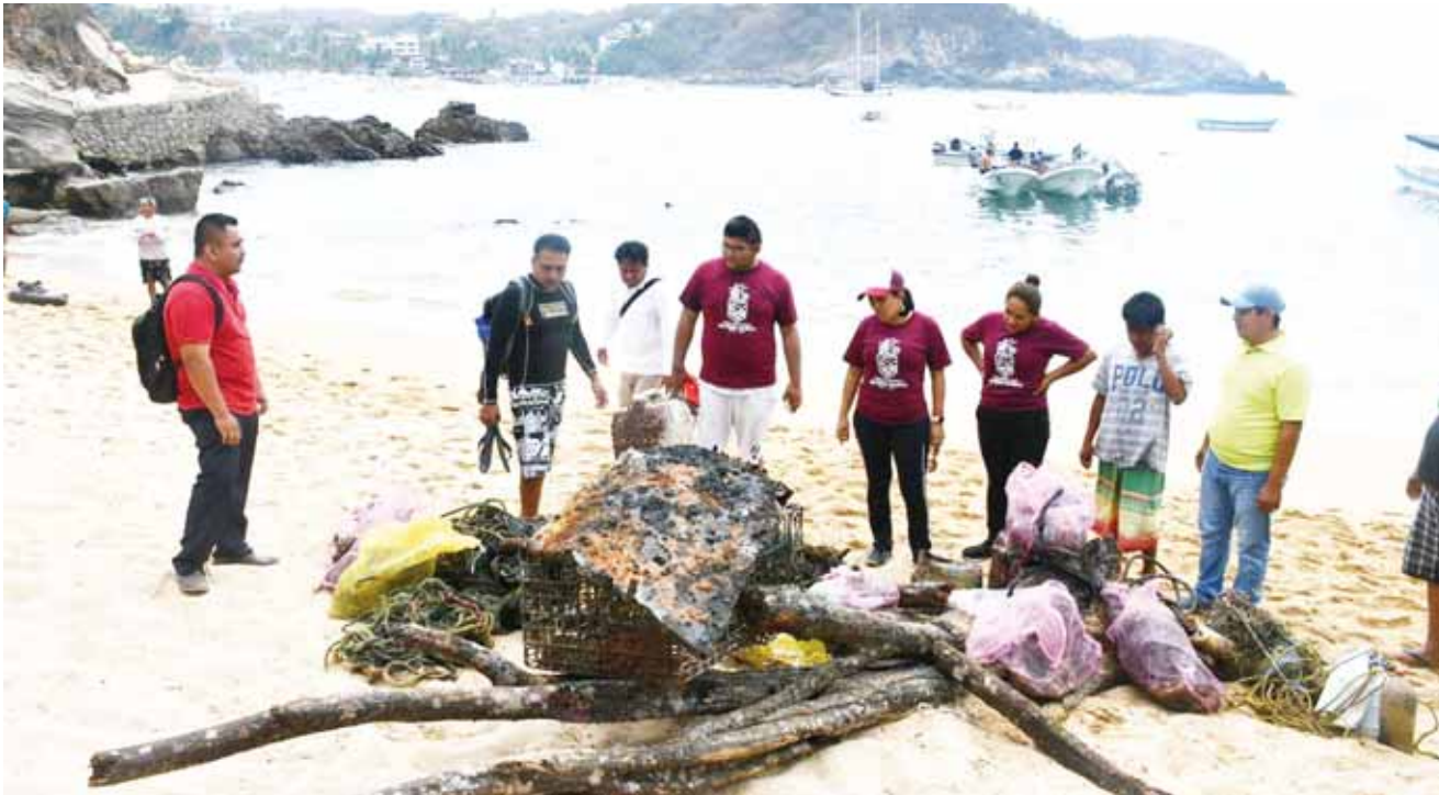
► Voluntarios limpiaron el fondo del océano.