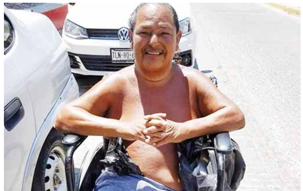
► El hombre pide el apoyo de las autoridades.

Asimismo dijo que ya acudió con las instancias legales correspondientes para presentar la denuncia y sea castigado el responsable por el delito de robo.