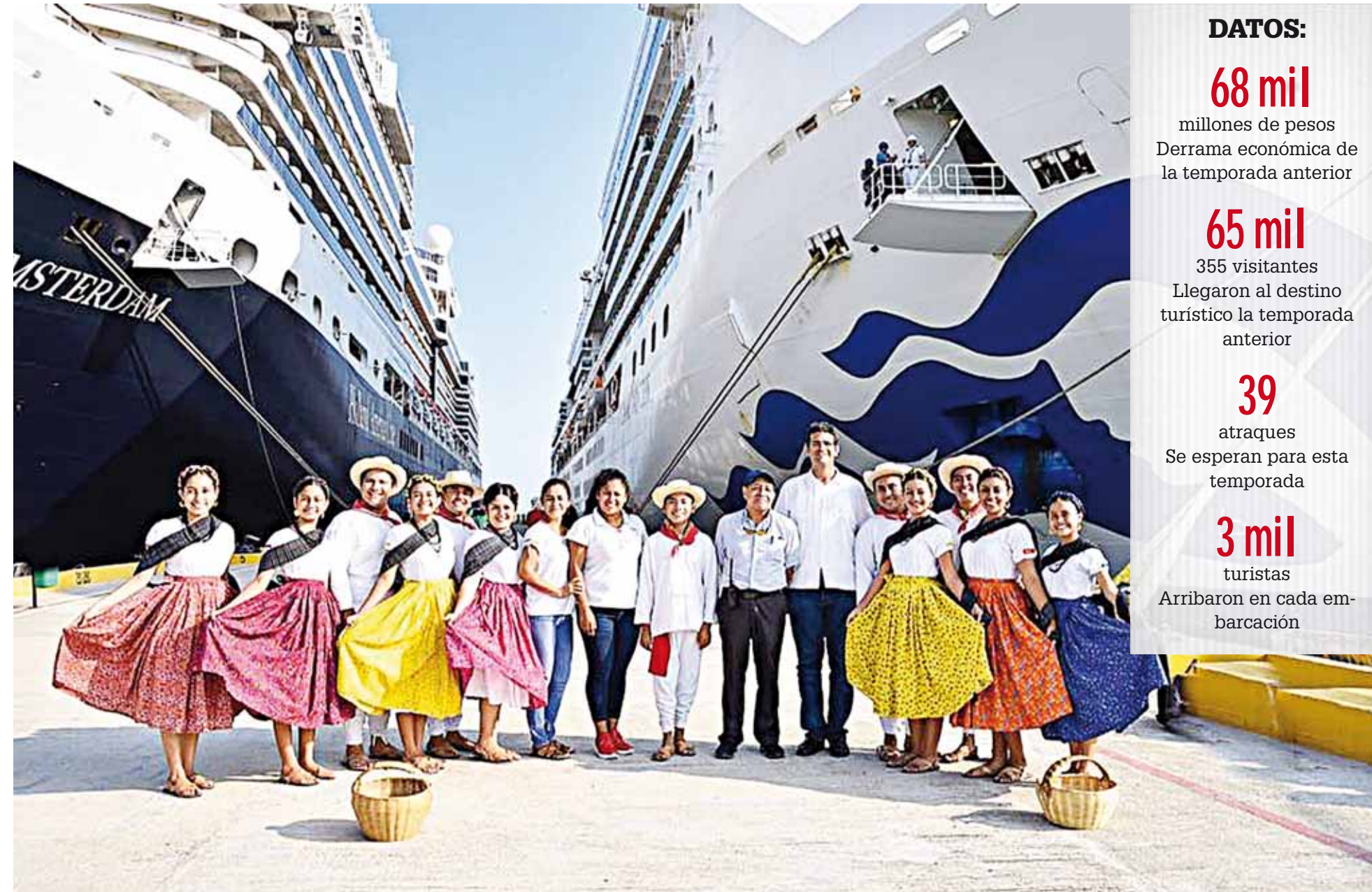
► La bienvenida de los turistas que desembarcaron de los cruceros fue realizada por personal de la regiduría de Turismo, Desarrollo Económico y Cultura.

En Bahías de Huatulco, la temporada de cruceros inició