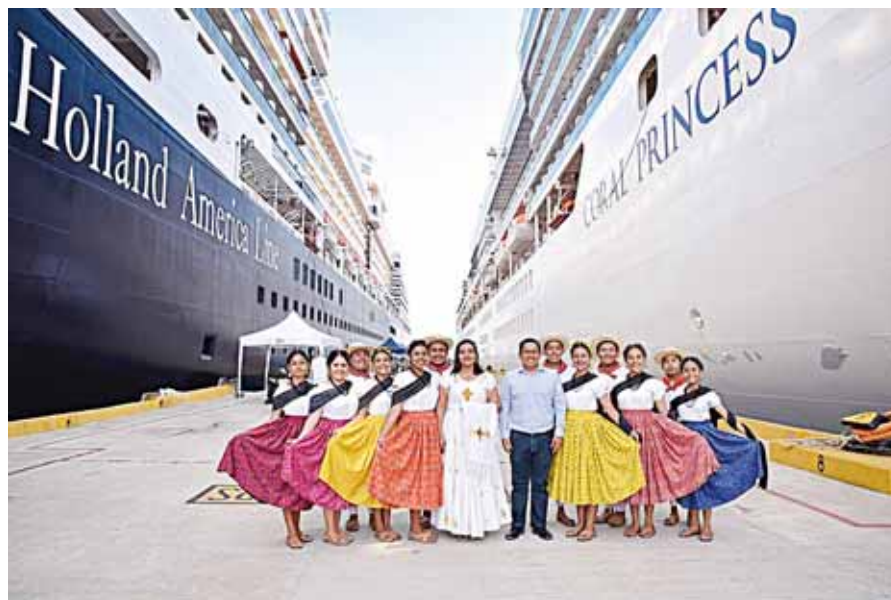
► Se espera una buena temporada de arribo de cruceros.