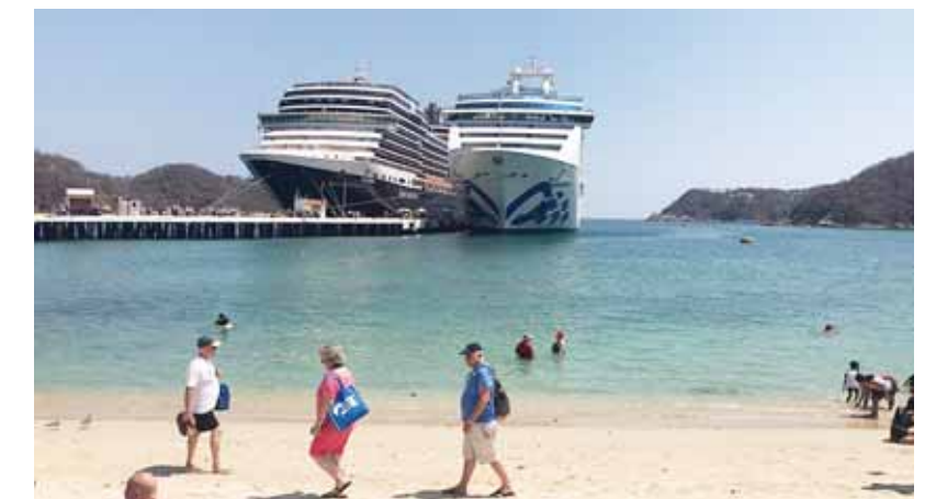
► Los paseantes, después de disfrutar el recibimiento, acudieron a diferentes rincones turísticos.