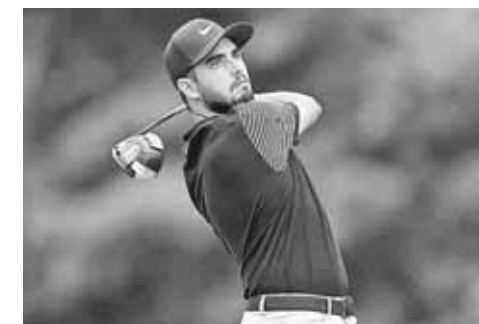
► Abraham Ancer está a cuatro tiros del líder.

después de que el líder de la víspera, McIlroy, sufriera una ronda mixta. La estrella de Irlanda del Norte se recuperó de un comienzo de bogey-bogey para terminar