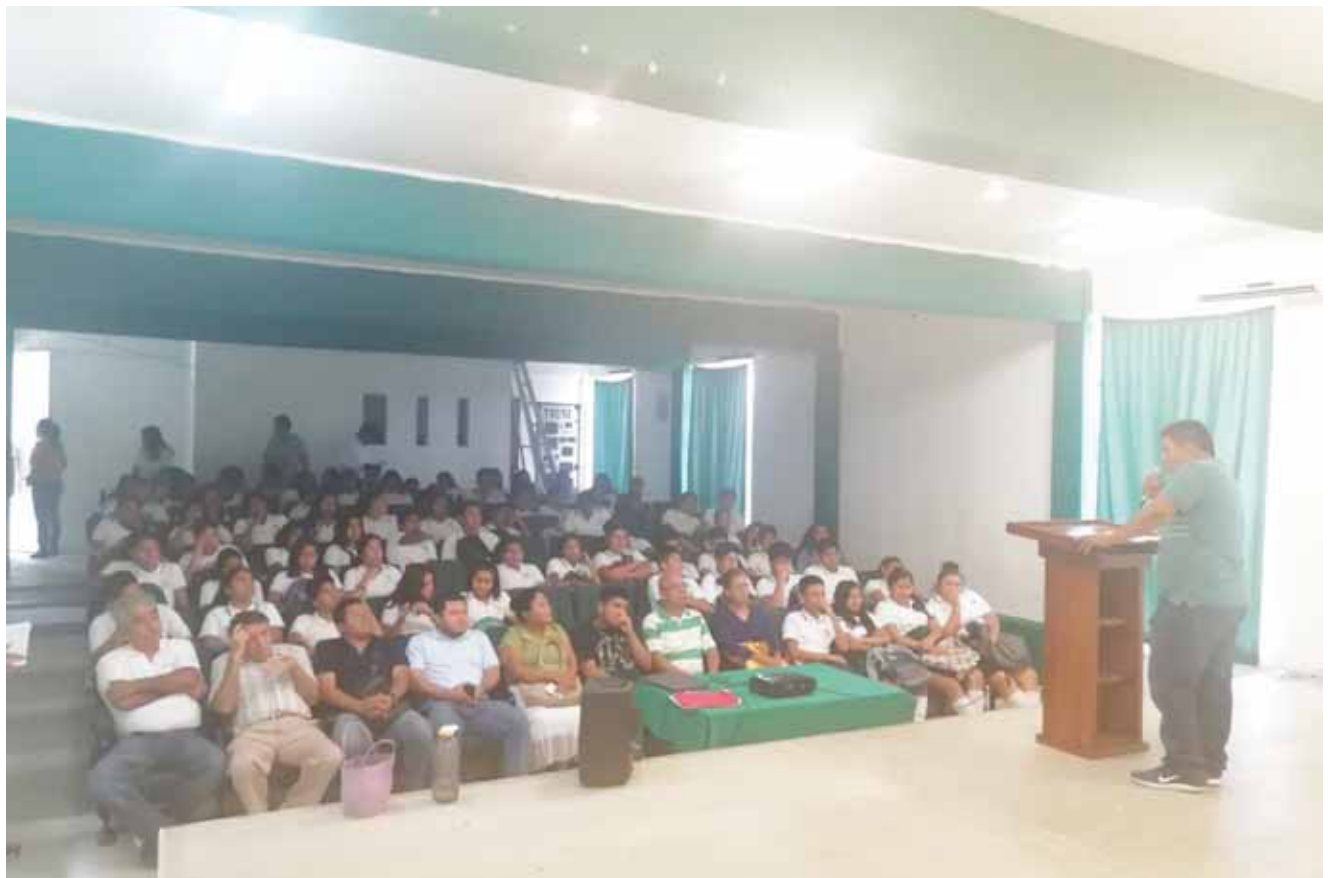
► Alumnos del plantel 21 del Colegio de Estudios Científicos y Tecnológicos de Oaxaca.

200 alumnos, las conferencias, talleres y pláticas enfocadas a la superación, a la reflexión," AA es una organización estable, fuerte en sus compromisos de extender la mano a quién