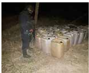
► El material fue asegurado por la fiscalía.