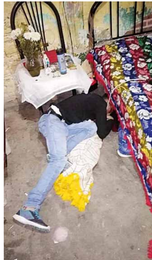
► Presentaban varios disparos de arma de fuego.

Por tal motivo la Vicefiscalía Regional del Istmo integro la carpeta de inves-