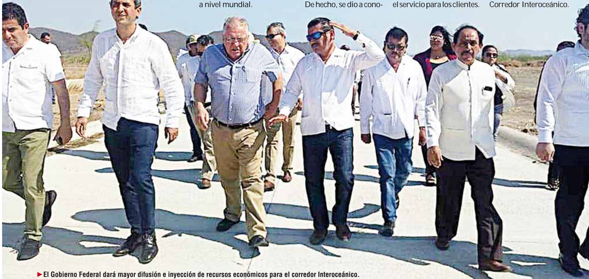
► El Gobierno Federal dará mayor difusión e inyección de recursos económicos para el corredor Interoceánico.

Sin duda destacó que Salina Cruz es uno de los puertos que será punta de lanza y detonará con el Corredor Interoceánico.