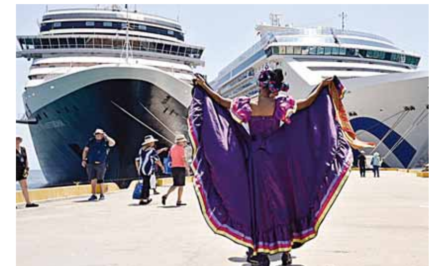
► Fueron recibidos con la calidez característica de Oaxaca.