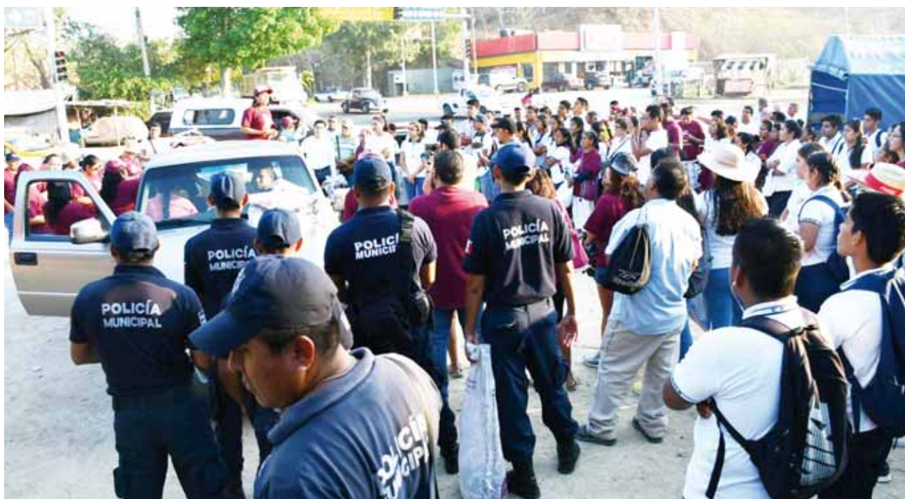
► Se reunieron el pasado viernes para hacer limpieza general de playas, fondos marinos, calles y carreteras.

"Seguimos recomendando que ya no dejemos los botes de aceite, ni contaminemos también nuestros mares, que estemos al pendiente de tomar cartas en el asunto y acciones concretas