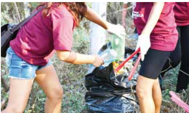
► Cada una de las personas recibió un kit que consiste en bolsa contenedora, guantes y pinzas.

Mientras se realizaba la recolección de basura, Pineda Velasco invitó a unirse a la limpieza todos los días; “que no sólo nos unamos a limpiar, también a no tirar