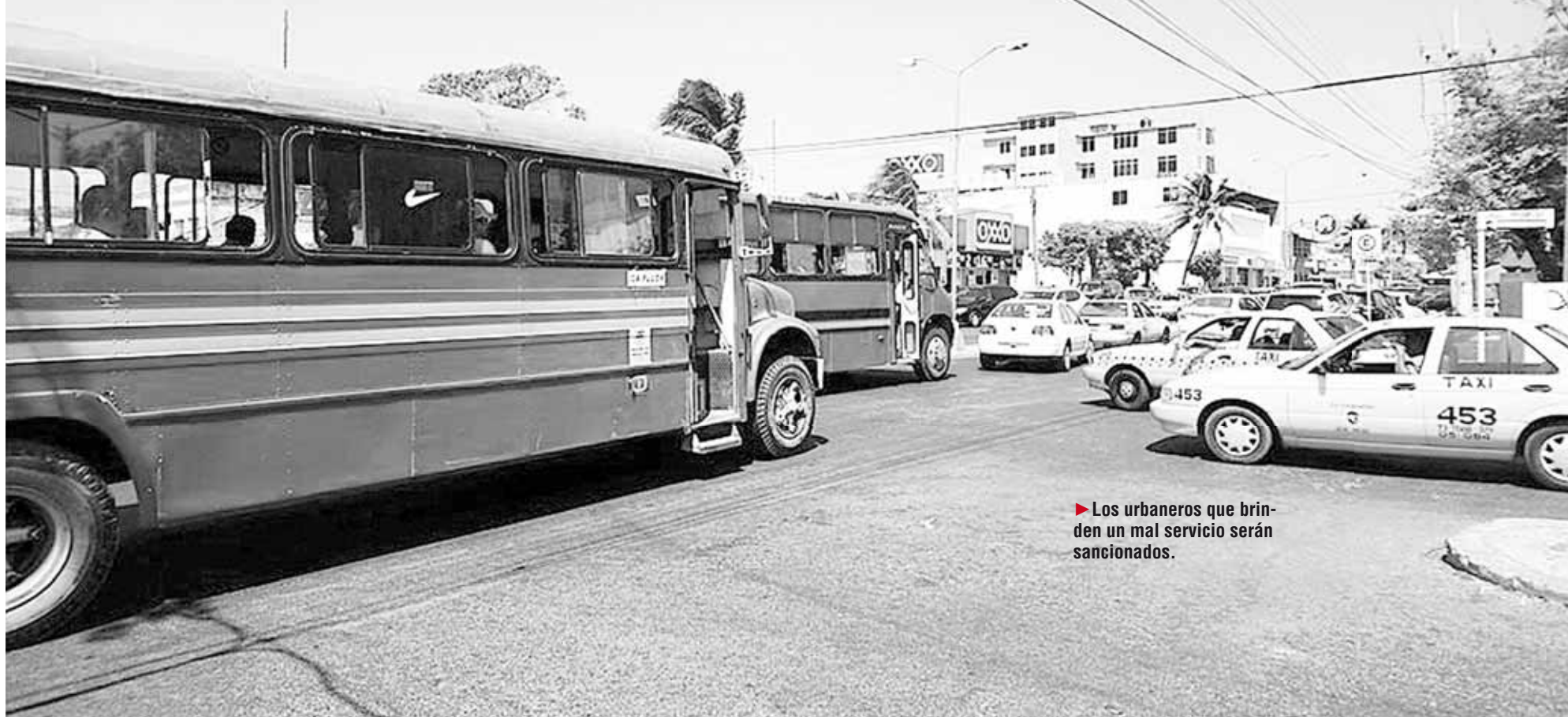
► Los urbaneros que brinden un mal servicio serán sancionados.