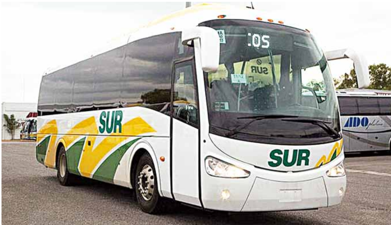
► El vehículo pertenecía a la línea Sur de Oaxaca.