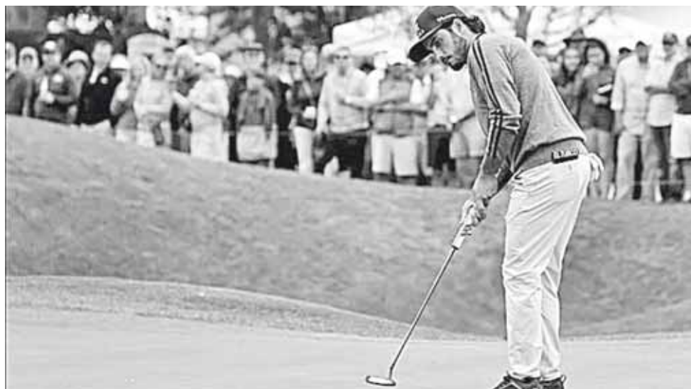
► El mexicano lidera en los primeros cinco lugares.

El ibérico, de 24 años, se convirtió en contendiente luego de dominar en el TPC Sawgrass Stadium en Ponte Vedra Beach (Florida), con una deslumbrante exhibición de disparos precisos y una sólida colocación para entregar una tarjeta con 64 golpes, ocho bajo par, un disparo por encima del inglés Tommy Fleetwood y el norirlandés Rory McIlroy.