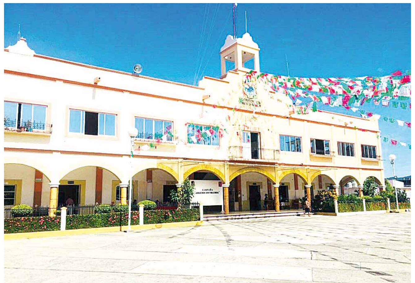
► Seis agencias de Pinotepa recibirán sus recursos para obra pública de manera directa.

El también regidor de Desarrollo Económico del Ayuntamiento de este municipio, dijo que, “tal y como lo ha pregonado nuestro presidente el Lic. Andrés Manuel López Obrador, a través de este logro los albañiles y traba-