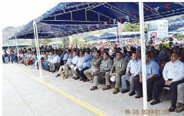
► En este evento se destacó el valor de la cooperación.