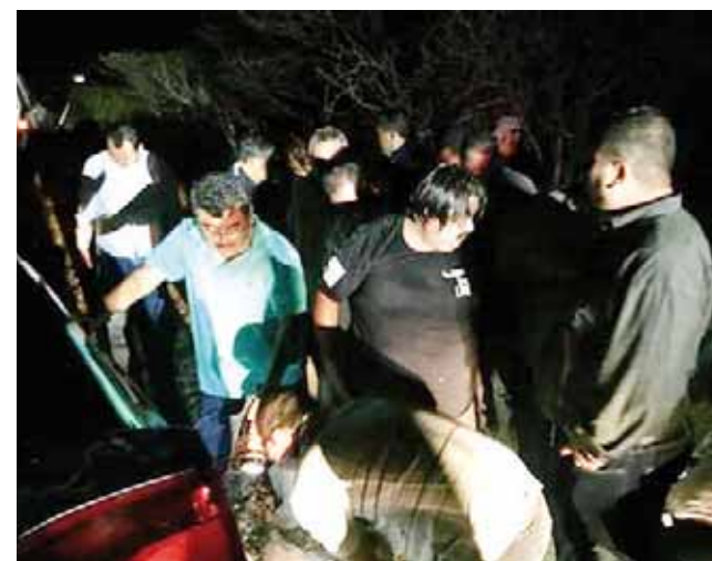
► El edil regresaba de la ciudad capital.