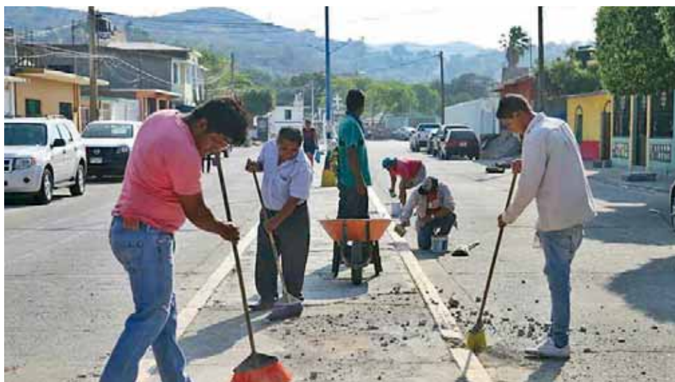
► Vecinos retiraron basura y escombros.

té de vecinos de la colonia Las Brisas, llevaron a cabo la limpieza, levantamien-