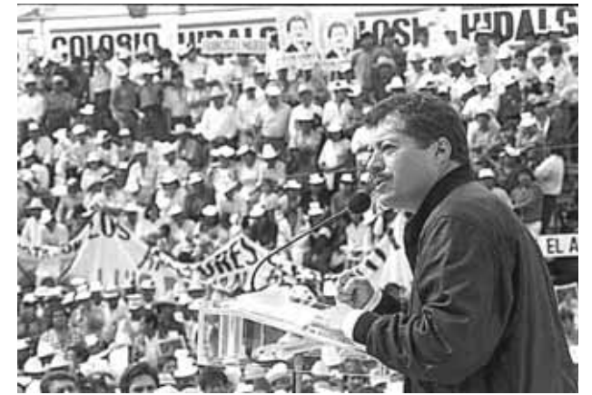
► Arropado por multitudes.

yesquizofrenia (2010), dice que hoy en día no ve a Luis Donaldo Colosio Murrieta vinculado al PRI. “Veinticinco años después veo a la figura de mi amigo y no pienso en el PRI, no lo pue-