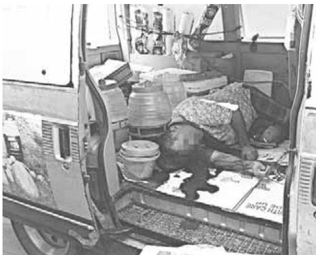
► Fue acribillado dentro de su vehículo.