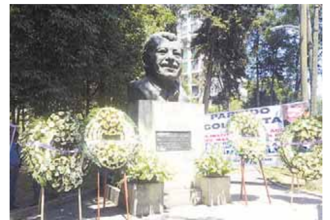
► El sábado se cumplieron 25 años de su asesinato.

do asociar con ellos porque lo que él pensaba, decía y hacía es muy diferente a lo que acabó haciendo el PRI”.