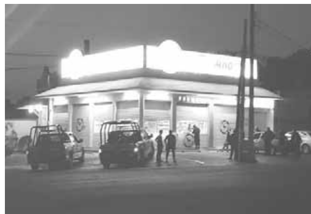
► Al parecer todo había sido un mal entendido.

Hecho que les resultó sospechoso al suscitarse a tempranas horas de la madrugada, por lo que solicitaron el apoyo de los uniformados.