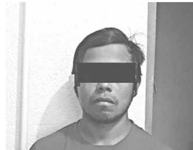
► Fue detenido por elementos de la AEI.

Tras leerle sus derechos y el motivo por el cual el juez del Juzgado de Garantías lo requería, fue detenido para ser llevado a la comandancia. Posteriormente fue puesto a disposición de las autoridades que lo requieren por el delito de presunto abuso sexual agravado, quedando recluso en los separos donde más tarde se sabrá sobre su situación jurídica.