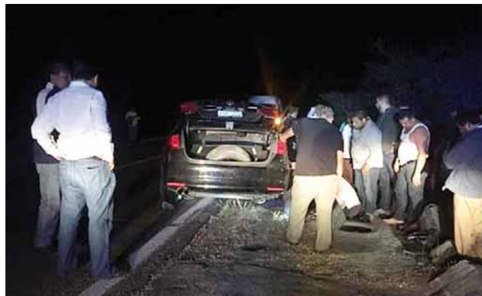
► Por fortuna nadie salió lesionado.