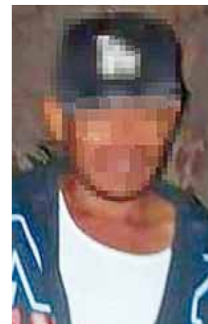
► El presunto agresor fue identificado por vecinos y una de las agredidas, la Policía ya lo busca.

La Vicefiscalía Regional de la Mixteca desplegó un equipo multidisciplinario, integrado por personal ministerial, pericial y de investigación para iniciar con las diligencias correspondientes y dar con el o los responsables de este crimen.