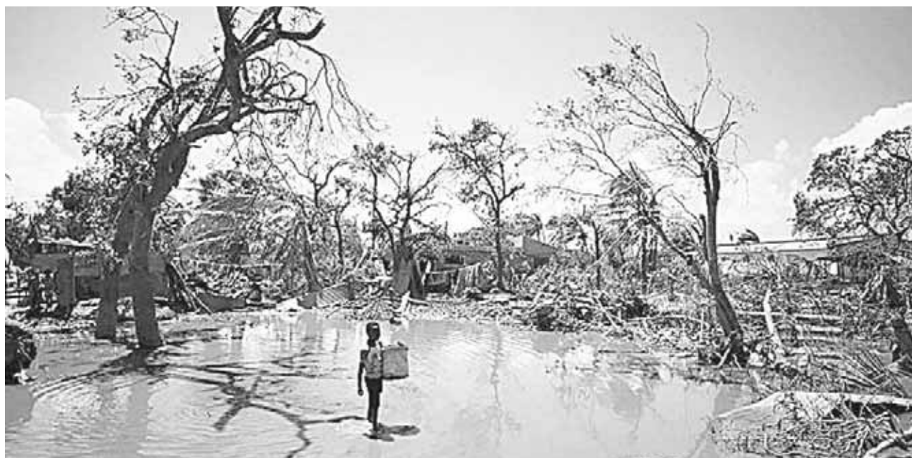
► La tragedia provocada por el ciclón Idai en África está al mismo nivel que las crisis en Siria y Yemen.

Vaticinó que la plaga se extenderá por otras partes del sur de Florida en las próximas semanas.