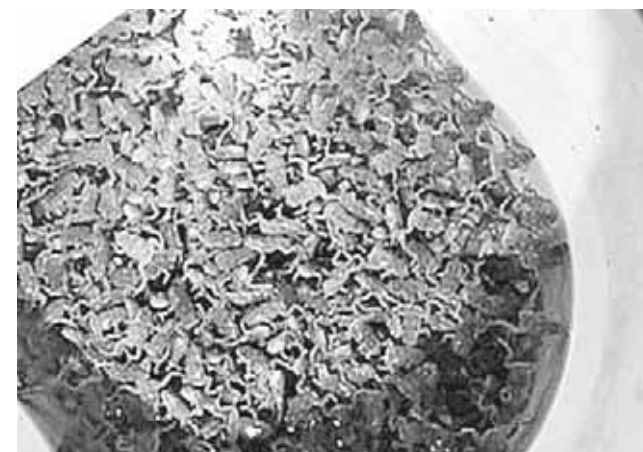
► La plaga se extenderá por otras partes del estado en las próximas semanas, según expertos.

Y la más inmediata se basa en dos pilares: el reparto de comida, pues «hay gente desesperada por estar más de una semana sin poder comer de manera regular», y el agua y saneamiento para que no se propaguen enfermedades como el cólera y la malaria.