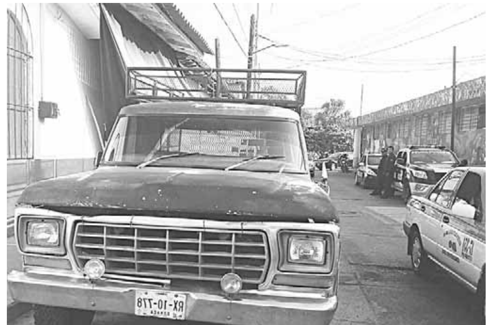
► Fue detenido por imprudencia e insultar a los oficiales.

Horas más tarde, tras pagar su respectiva multa recobró su libertad.