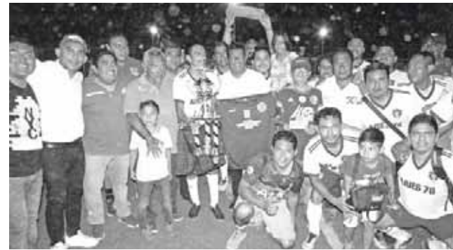
► Aries 78 campeones.

Los suplementarios se jugaron a su máximo esplendor y aunque América tuvo las suficientes llagadas en el arco contrario los tiros de Eder Romero se estrellaron