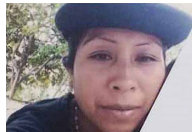
► La mujer se extravió en la Mixteca.

Ante los hechos, las autoridades competentes realizan los operativos de búsqueda, por lo que también piden el apoyo de las personas que tengan algún tipo de información que ayude a dar con su paradero.