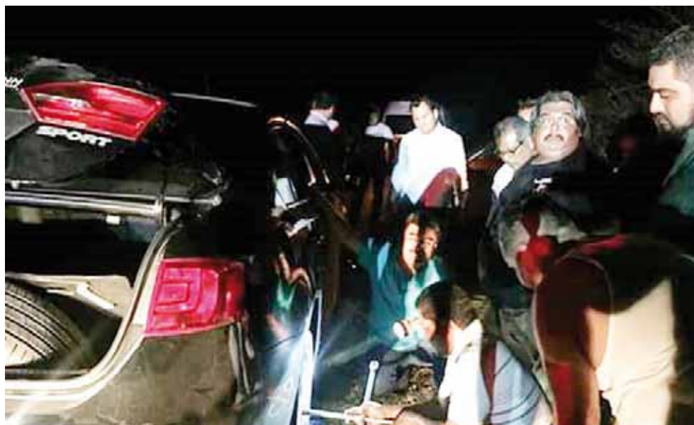
► El vehículo sufrió una pinchadura.