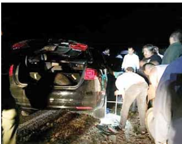
► El accidente ocurrió en la 190.

Al presidente municipal lo acompañaban algunos dirigentes de los sitios de taxi de la citada ciudad, con quienes había sostenido una reunión conjuntamente con funcionarios del Gobierno del Estado en la ciudad de Oaxaca de Juárez.