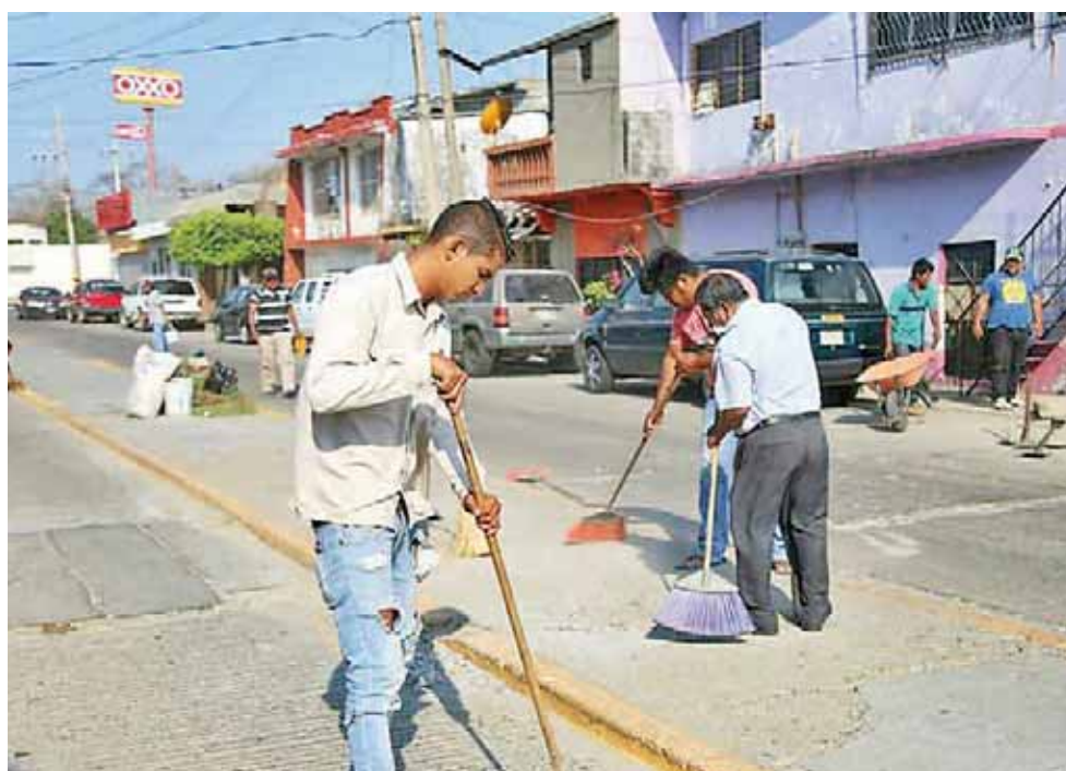
► Los integrantes del comité de vecinos de la colonia Las Brisas, llevaron a cabo la limpieza.

Asimismo, dijo que es importante que los ciudadanos depositen la basura en los cestos y esperen a que el camión recolector transite por sus colonias para que el personal de limpieza recolecte y se evite una mayor contaminación.