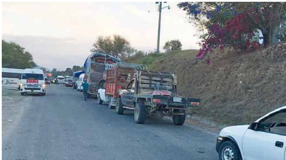
► Comuneros mantienen tomada la entrada a la comunidad en la carretera a Huajuapán.

dio por lo que se trasladaron autoridades del comisariado de bienes comunales y 10 brigadistas.