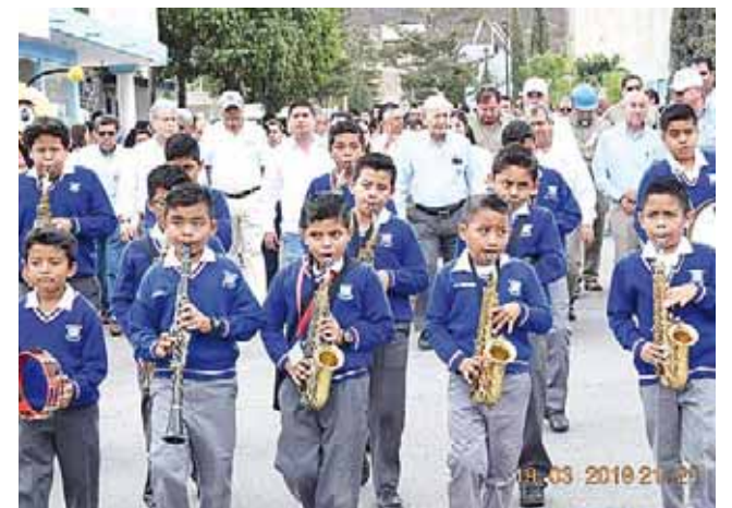
► Participaron los alumnos del Centro Educativo Cruz Azul y de escuelas de la región.