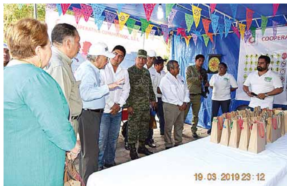
► Los hechos en el marco de la semana de la cooperación.