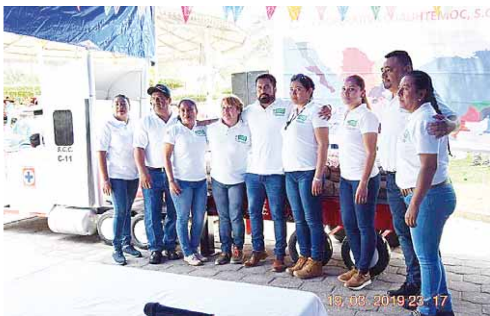
► Esto lo realizó la sociedad cooperativa La Cruz Azul S.C.L., en Lagunas, Oaxaca.