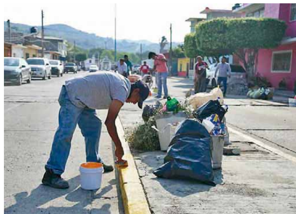
► Se organizaron para mejorar la imagen de esta avenida.