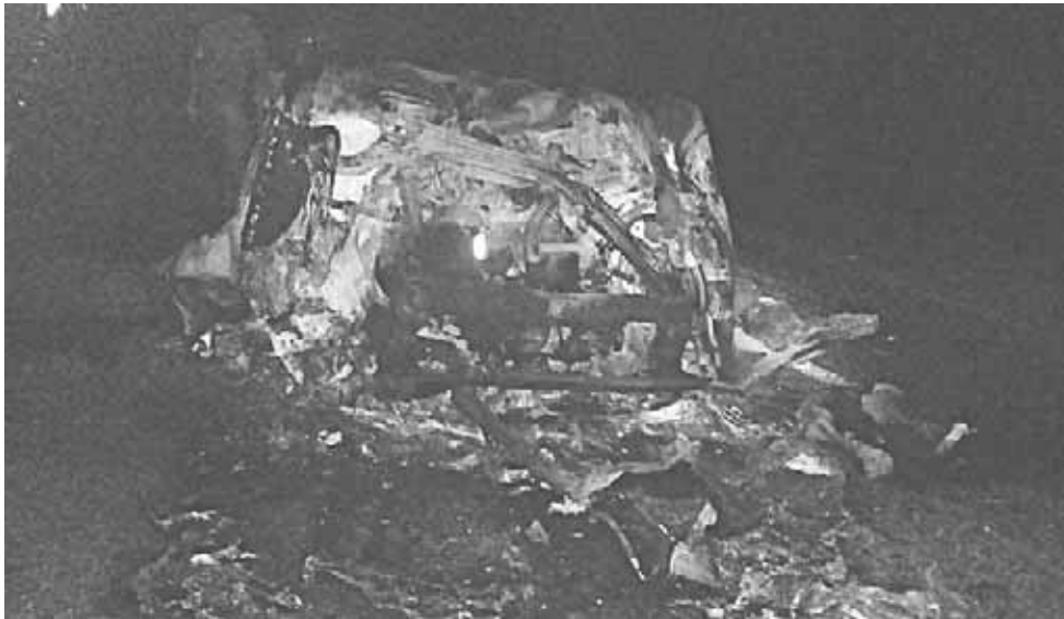
► El vehículo quedó completamente calcinado.