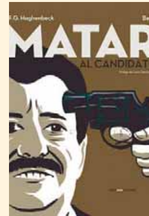
► Matar al candidato , obra de F.G. Haghenbeck y Bef.

25 años después, cuatro fiscales instructores y 68 mil hojas de expediente, la versión oficial es que Mario Aburto, un obrero pobre con supuestos antecedentes psiquiátricos, actuó como un lobo solitario. Ninguna línea alternativa logró sostenerse