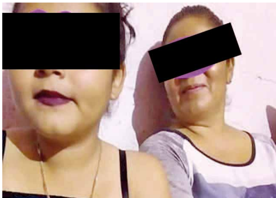
► Las mujeres fueron atacadas sin piedad.

En tanto, la hija de la occisa fue internada en el hospital, la cual recibió tres