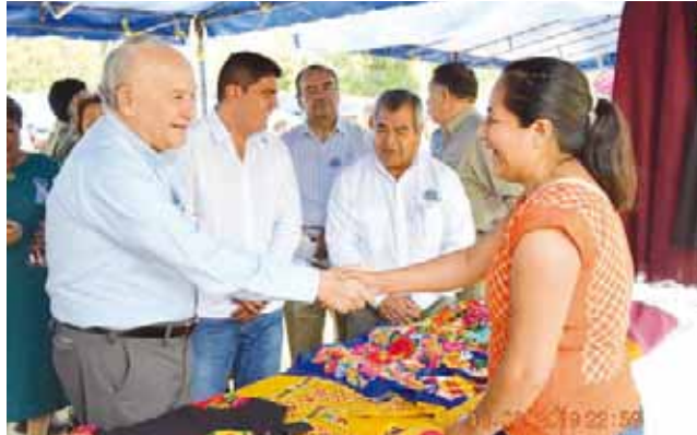
► En el pabellón de las artesanías presentaron los bordados y tejidos de la región.

ya que todas las empresas del núcleo cooperativo y las empresas filiales aportan su granito de arena para la realización de este evento que compartieron con la sociedad con eventos abiertos al público.