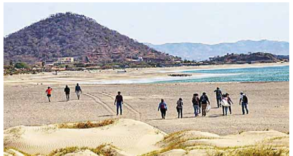
► Alumnos de diferentes planteles se sumaron a los trabajos.

El director expresó que estos trabajos se estarán realizando a lo largo de esta administración, pero también pedirles a los prestadores de servicios y habitantes de esas zonas a que se involucren para que juntos mejoren el entorno de las playas de Salina Cruz y la Región del Istmo.