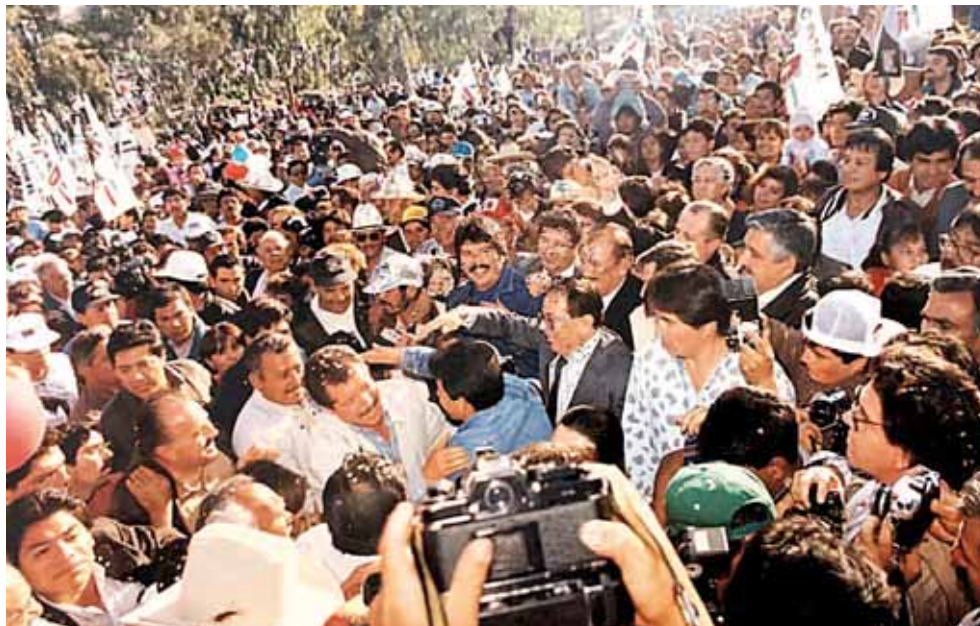
► 23 de marzo de 1993, Lomas Taurinas.

México ha sido incapaz de revelar la verdadera historia detrás del magnicidio; el eco de las dudas y las exigencias de justicia se escuchan con mayor fuerza