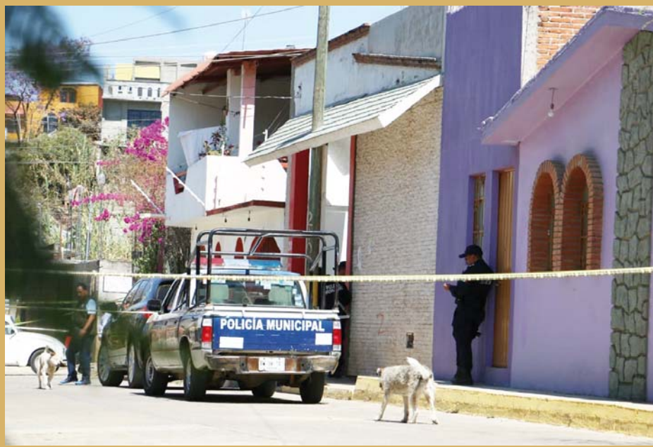
► El área del crimen fue acordonada por la policía.