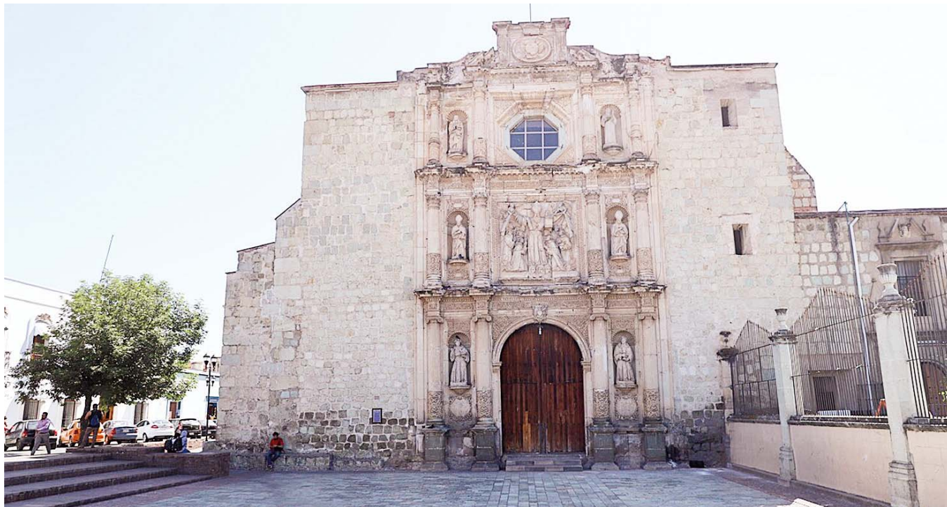
► Continuarán los recorridos de vigilancia para evitar que se repita esta situación.

En la misma situación se encuentran las inmediaciones del Templo de Santo Domingo de Guzmán, donde decenas de ambulantes se concentran y la vigilancia policiaca municipal ante cualquier contingencia, es mínima.