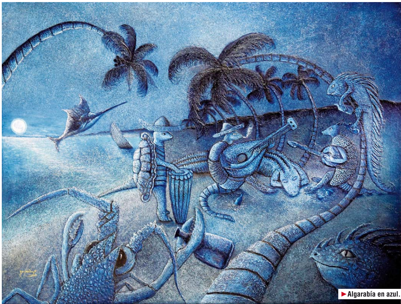
► Algarabía en azul.

“Siempre tengo contempladas a las mujeres porque siento que ellas juegan un papel fundamental en la vida del ser humano; siempre crean otra forma de ver”