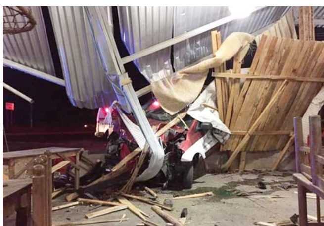
► Entró hasta la cocina del negocio.

En el lugar los agentes no localizaron al chofer,