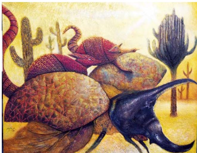
► Tras el oasis.