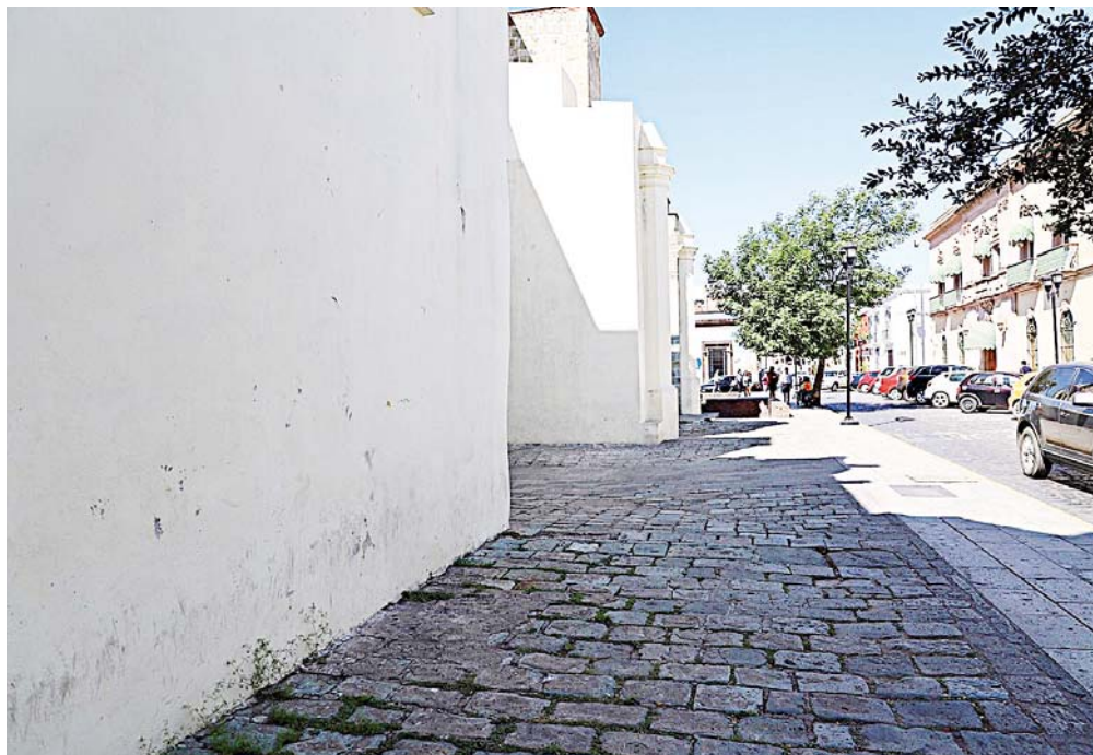
► Llaman a recuperar y dignificar otros espacios de la capital.

TEXTO: YADIRA SOSA