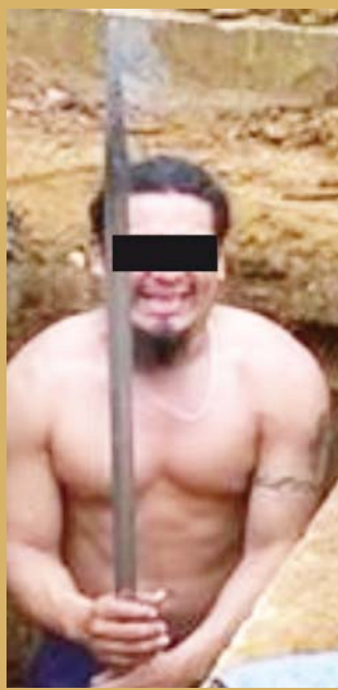
► Una de las víctimas en vida.

VECINOS DEL LUGAR DESPUÉS DE ESCUCHAR LAS DETONACIONES DE ARMA DE FUEGO, LLAMARON AL TELÉFONO DE EMERGENCIA, REPORTANDO LOS DISPAROS EN UNA VIVIENDA.