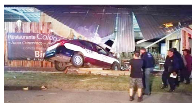
► Elementos policiacos llegaron al lugar del incidente vial.