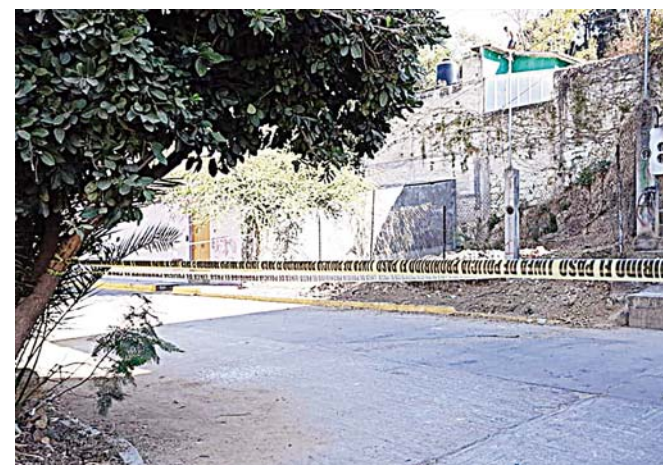
► Acordonaron la zona; vecinos están hartos de la inseguridad.

Señalaron que la inseguridad en la zona se agudizó desde 2018, donde los delin-