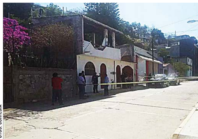
► Ayer por la mañana asesinaron a balazos a dos personas.

cuatro disparos pero nadie salió porque han estado robando y asaltando mucho en toda la colonia, los delincuentes ya no respetan nada, pero realmente no sabemos por qué los mataron, si iban directo contra ellos o los que-