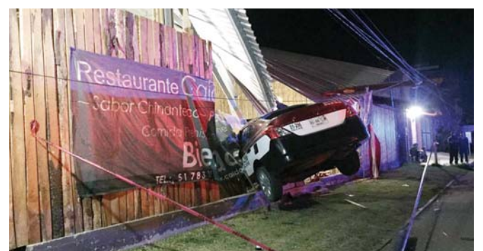
► Como una postal de película se veía la escena.

to a disposición de la autoridad municipal, quien tomó conocimiento por el delito de daños en contra de quien o quienes resulten responsables.