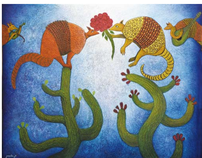
► A ti.