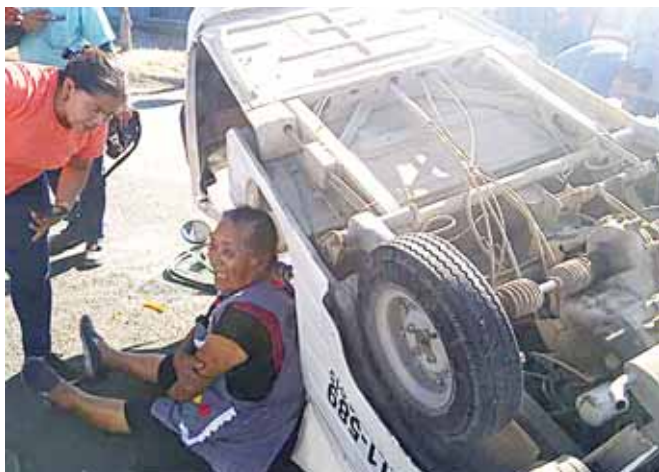
► Una pasajera resultó con lesiones de consideración.