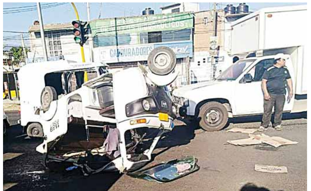
► El mototaxi fue impactado en uno de los costados y volcó.

Al circular el mototaxista sobre la calle de Eulalio Gutiérrez y ver que el semá-