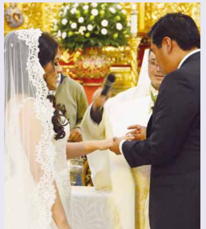
► La pareja intercambió votos y alianza.