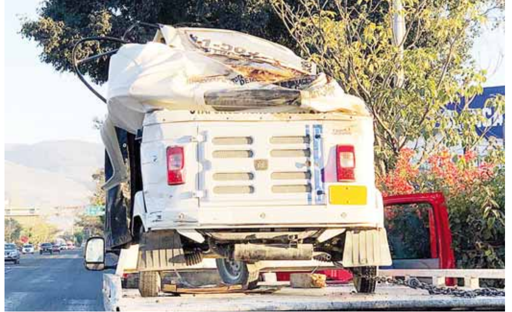
► La unidad siniestrada fue trasladada en una grúa a un corralón.