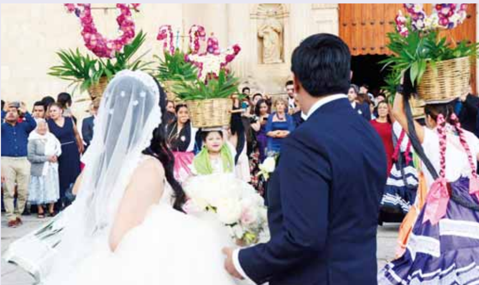
► Disfrutaron de una alegre calenda.