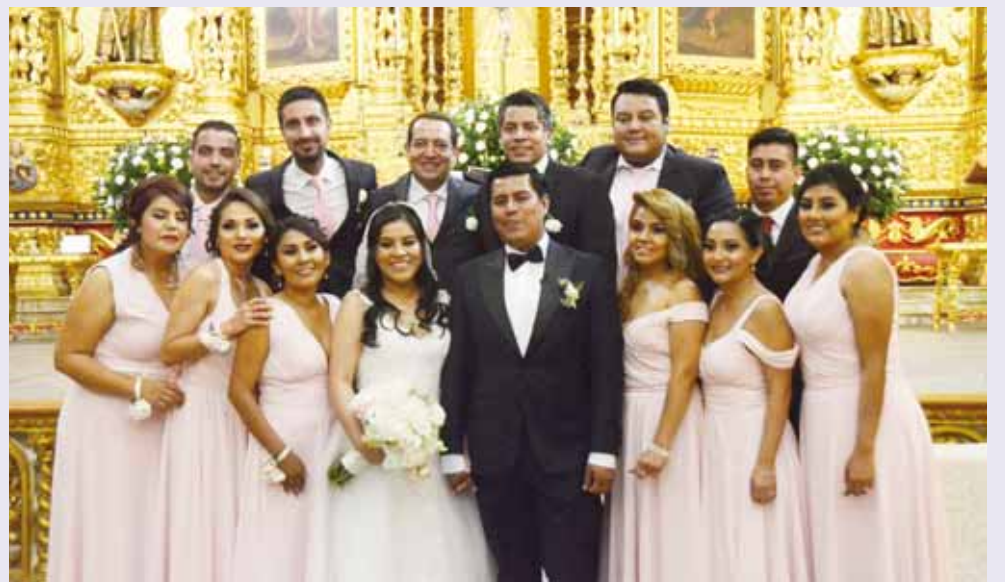
► Los enamorados con su cortejo de honor.