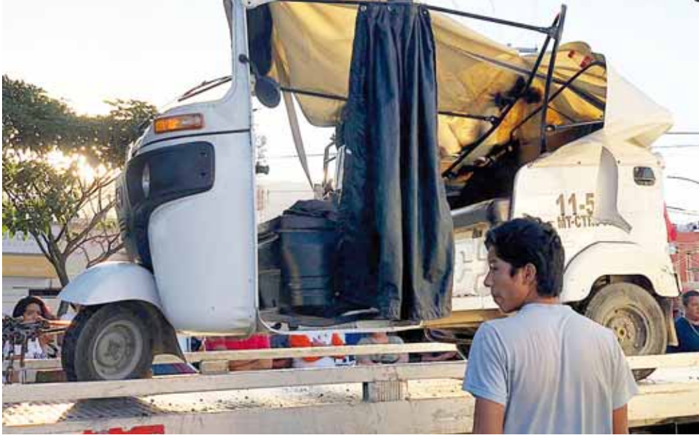
► Por fortuna no hubo pérdidas humanas que lamentar.

policiaca@imparcialenlinea.com / Teléfono 501 83 00 Ext. 3176