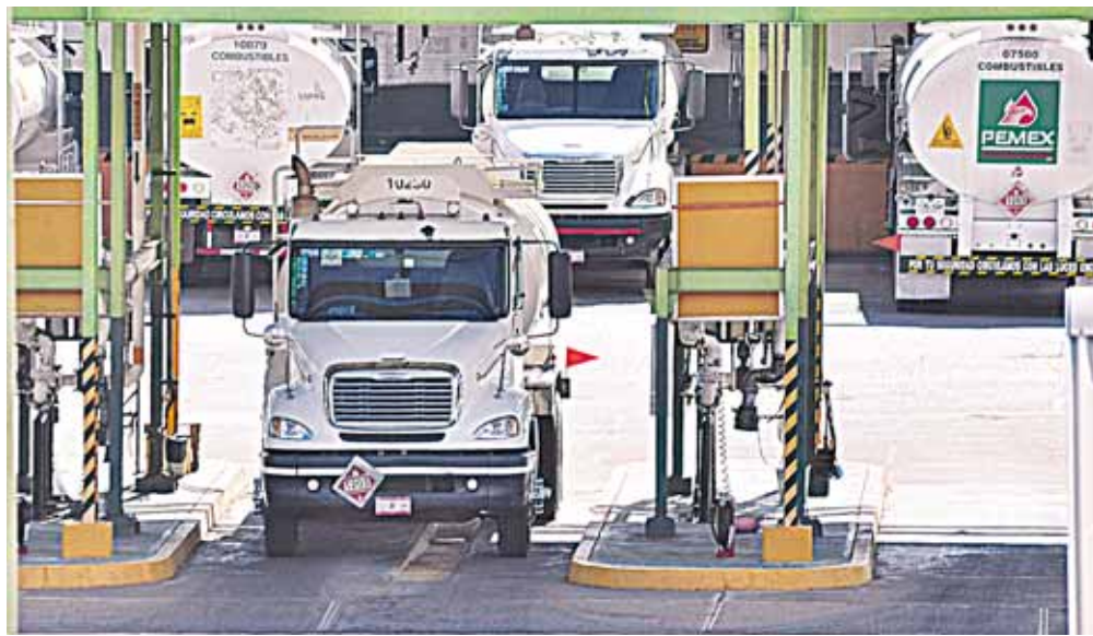
Tres pipas con gasolina de empresarios de la Mixteca, fueron robadas en retenes falsos, en la autopista Veracruz-Ciudad de México.

operativo Escalón, elementos de la Policía Federal iban custodiando las pipas, cuyos elementos informaron que alrededor de las 14:00 horas habían entregado la custodia del sector asignado a otro, es decir, personal de Veracruz le entregó al de Puebla.