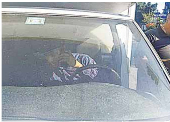
► El presunto responsable fue detenido.

La falta de precaución y el exceso de velocidad con la que conducía un chofer de una camioneta Nissan Estaquitas, al momento de pasarse un alto que marcaba el semáforo en el cruce de Candiani y la avenida Símbolos Patrios, ocasionó que chocara contra un motocarro; por el fuerte impacto la pesada unidad hizo volcar al motocarro, resultando el conductor y una mujer de 70 años con lesiones de consideración, paramédicos le brindaron los primeros auxilios.