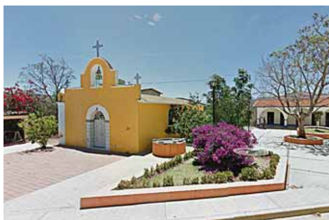
► Los hechos se cometieron supuestamente en Hacienda Vieja, Ejutla de Crespo.

De acuerdo con la causa penal 108\2016, la violación se cometió en diferentes fechas, la primera el 9 de abril de 2016, la segunda el 7 de mayo de 2016 y la tercera el 3 de junio de 2016, la imputada y otra persona del sexo masculino abusaron sexualmente de la víctima en el interior de su domi-