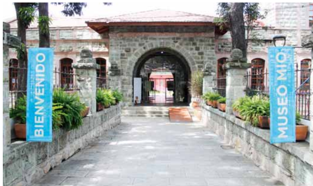
► El MIO representa un gran atractivo de la capital para locales y turistas.