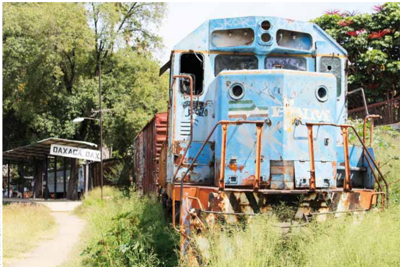
► Resaltan la importancia de mejorar las condiciones de nuevas áreas.