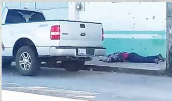
► La víctima quedó inerte en la banqueta

Al lugar acudieron oficiales de la Policía Municipal, Elementos de la Poli-