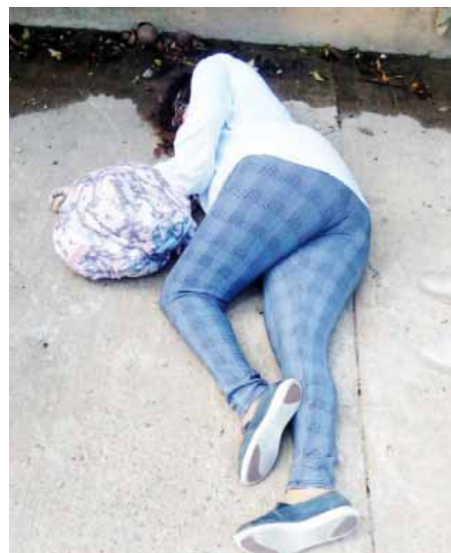
► La mujer fue balaceada por un solo hombre de acuerdo a testigos en el lugar.

años de edad, la cual tenía su domicilio en la unidad habitacional referida y al parecer era integrante del magisterio, sobre el móvil del crimen hasta el momento se desconoce, pese a esto las autoridades investigadoras ya trabajan en el caso, para tratar de esclarecer el crimen el cual fue el primero del año.