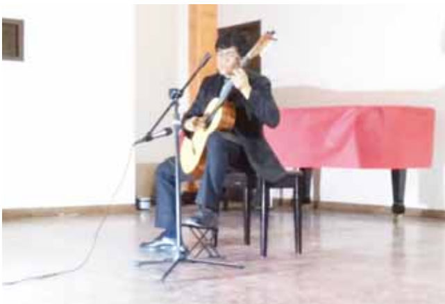
► Interpretaron diversos temas con guitarra acústica.

Cabe mencionar que dicho concierto tuvo una duración de más de una hora y media, en donde el público estuvo expectante a la música que interpretaron los tres jóvenes talentos, en donde, entre cada pieza musical, la gente aplaudía gustosa de escuchar estas canciones interpretadas durante la velada en el auditorio de la Casa de la Cultura de la ciudad.