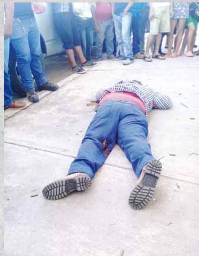
► La gente se arremolinó alrededor del cadáver.

Hasta el momento sigue existiendo el fuerte hermetismo en torno a este tipo de casos, la información se brinda a cuenta gotas, dejando especulaciones entre la ciudadanía, por