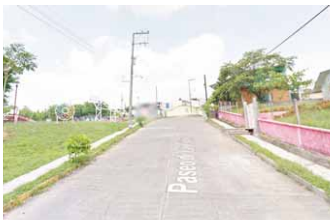
► En esta zona acontecieron los trágicos hechos.

En el lugar autoridades policiacas y ministeriales recababan información de algunos testigos, quienes aseguraban haber visto a un solitario sujeto acercarse a la mujer