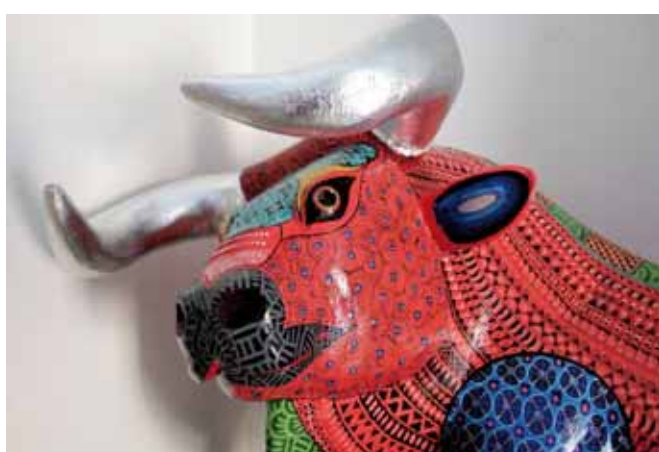
La talla de madera, conocida como alebrije, es la base de las esculturas que se realizan en el taller familiar.