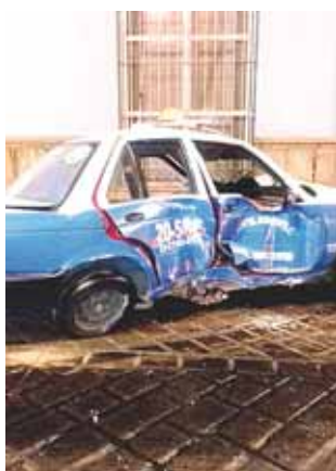
► El taxi fue la unidad que salió con la peor parte después del incidente.

Sin embargo, la unidad más dañada visiblemente fue el taxi, el cual presentaba un golpe brutal en la puerta delantera del conductor, quien resultó lesionado y fue