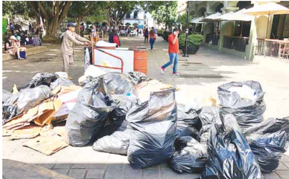
Se requiere de leyes más estrictas sobre el tema de la basura.