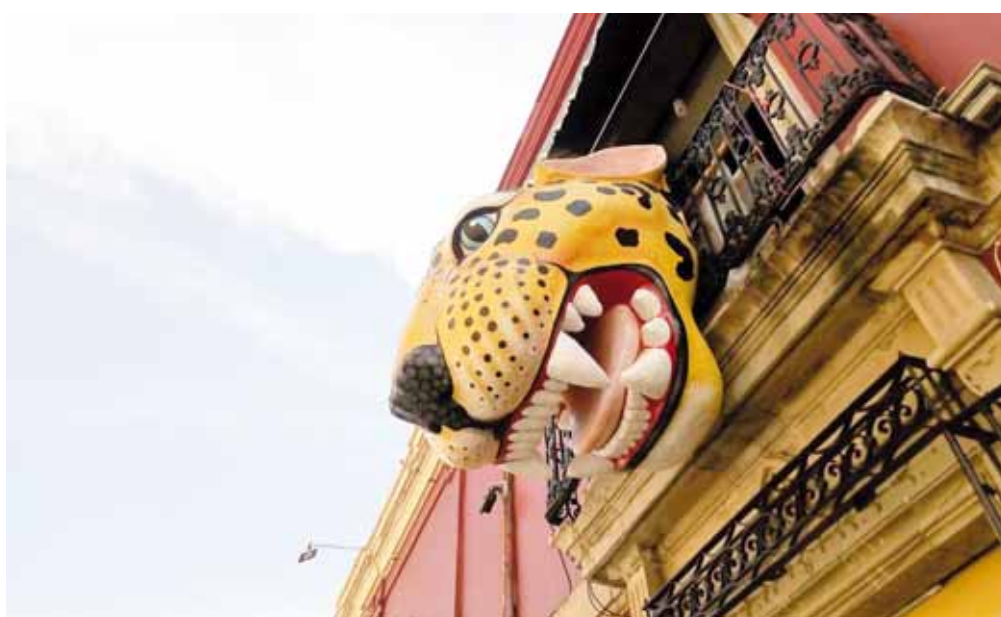
► Los autores fusionarán, a base de papel maché, a tres animales: el jaguar, el venado y el murciélago.