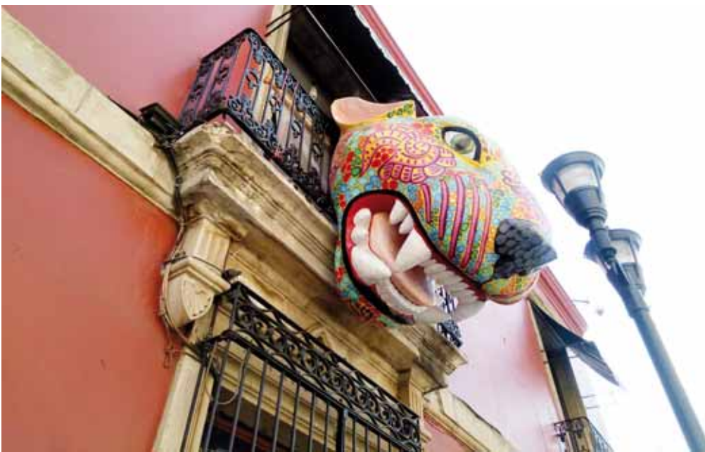
► La obra a crear en Barranquilla retoma a animales mexicanos y que habitan en Oaxaca, como el jaguar.

enesena@imparcialenlinea.com / Teléfono 501 83 00 Ext. 3172