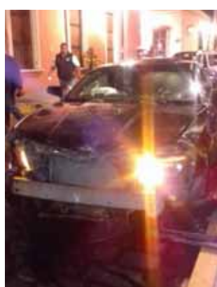
► El vehículo Camaro, al parecer fue quien embistió al taxi.