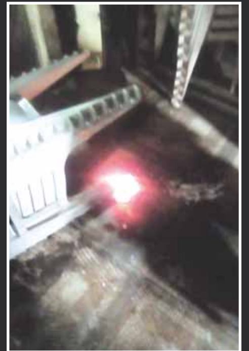
► Los lamentables hechos ocurrieron en el bar Los Faroles.