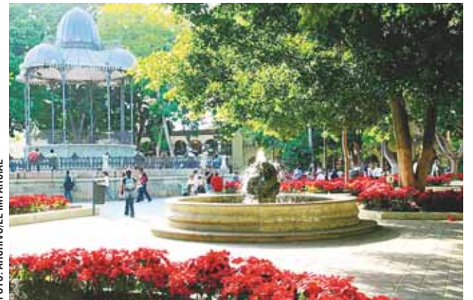
La autoridad municipal quiere que la sociedad tenga espacios libres.

“Cuando se haya consolidado un sistema de manejo de residuos se logrará reducir hasta en un 50 por ciento el volumen de desechos que diariamente se lleva a los rellenos sanitarios, fomentando la incorporación de diversos subproductos a cadenas de reciclaje”, apuntó.