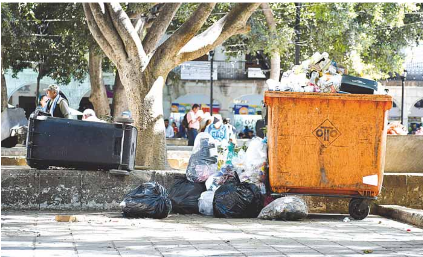
Esperan que la ciudadanía coopere y tenga educación ambiental para reciclar y separar la basura.

“La obra pública municipal será ejecutada por empresas oaxaqueñas, además el proyecto de desarrollo municipal será elaborado por profesionistas locales, con total transparencia y calidad en las obras para que no se hagan cada año como ha sucedido en los últimos trienios”, subrayó.