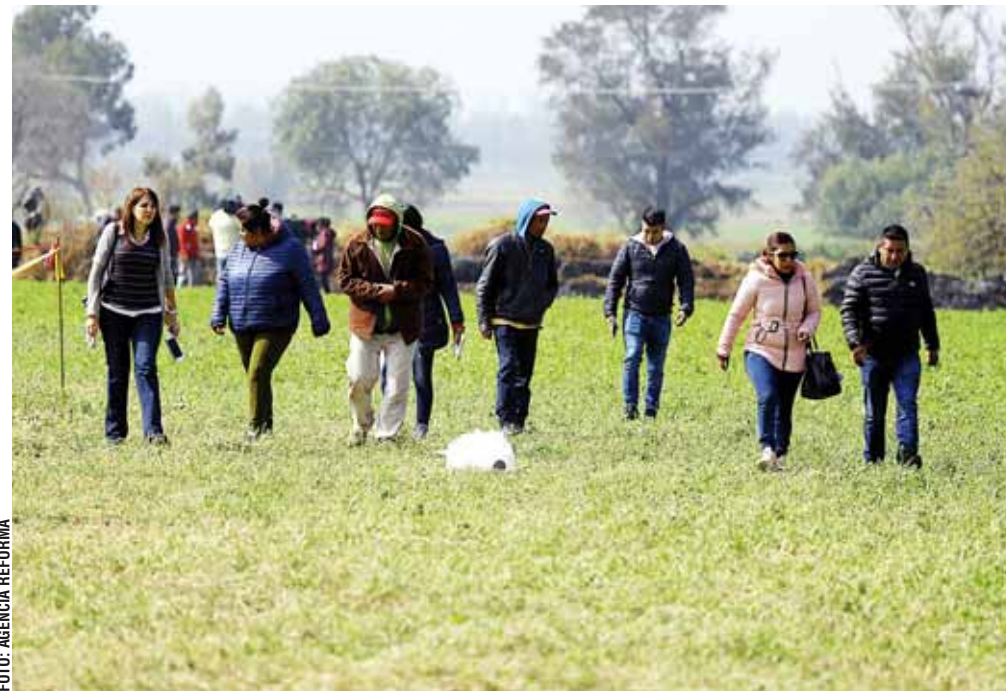
Al mediodía de este domingo, luego de que decenas de personas comenzaron a hacer búsquedas por su cuenta, la Procuraduría de Hidalgo organizó un "barrido" conjunto del área en Tlahuelilpan, Hidalgo.

El gobernador de Hidalgo, Omar Fayad informó que has-