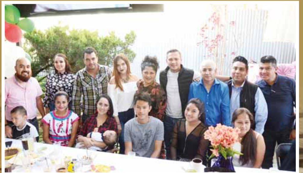
Sus más allegados la acompañaron a celebrar un año más de vida.